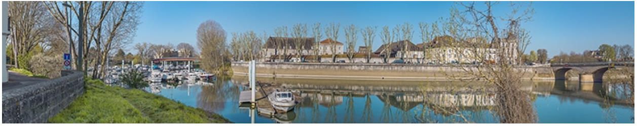
Vue d'ensemble du port de plaisance et des quais de l'île Saint-Laurent. A droite, le pont de la Génise.