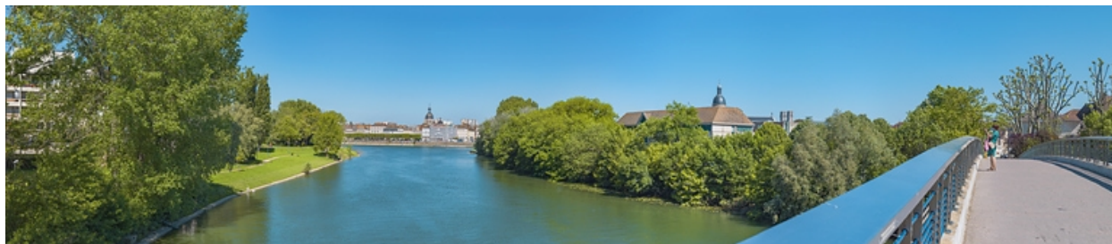
La ville de Chalon-sur-Saône vue depuis la passerelle Pierre-Soubrane.