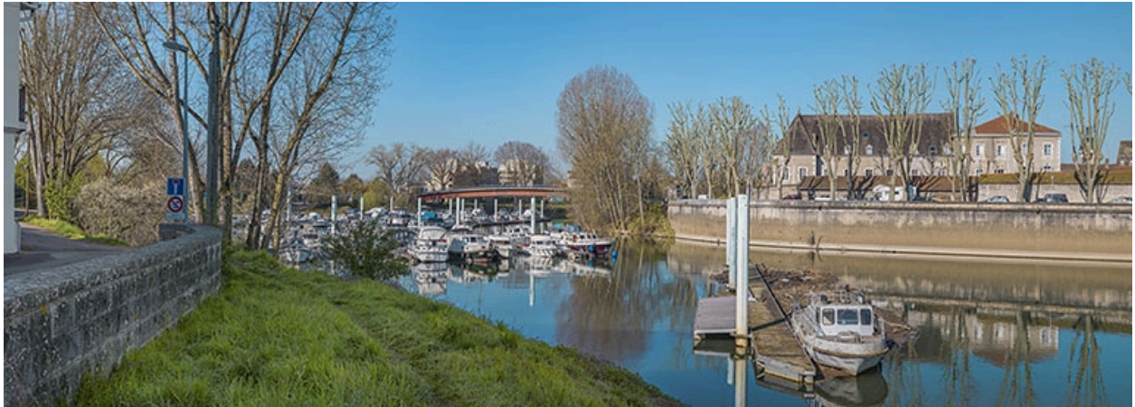
Vue d'ensemble du port de plaisance et de la passerelle.