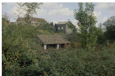
Vue extérieure.