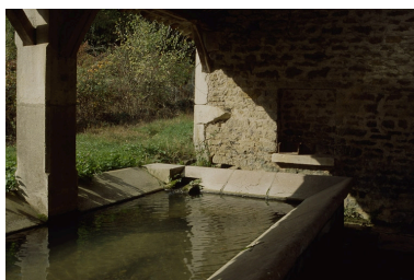
Vue intérieure. IVR26_19907100153ZA