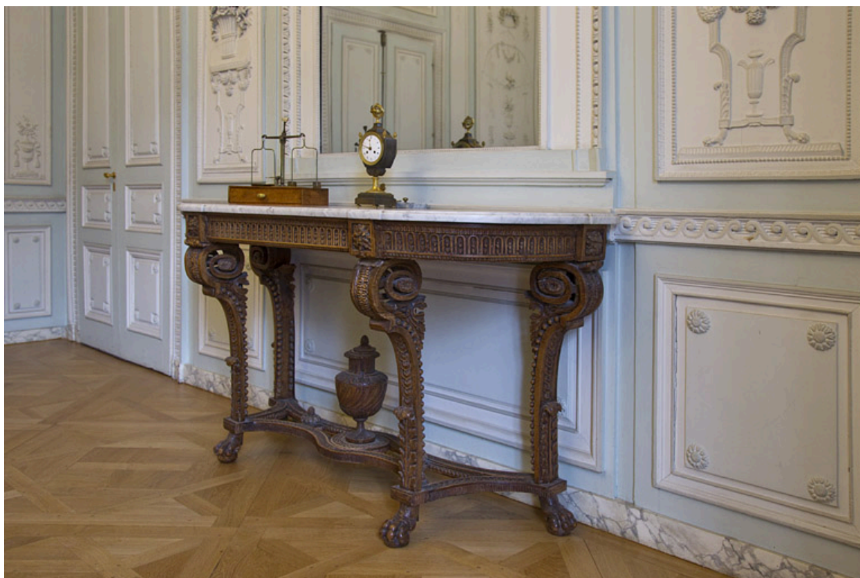
Intérieur, salon du rez-de-chaussée : vue d'ensemble de la console, de trois quarts droit.