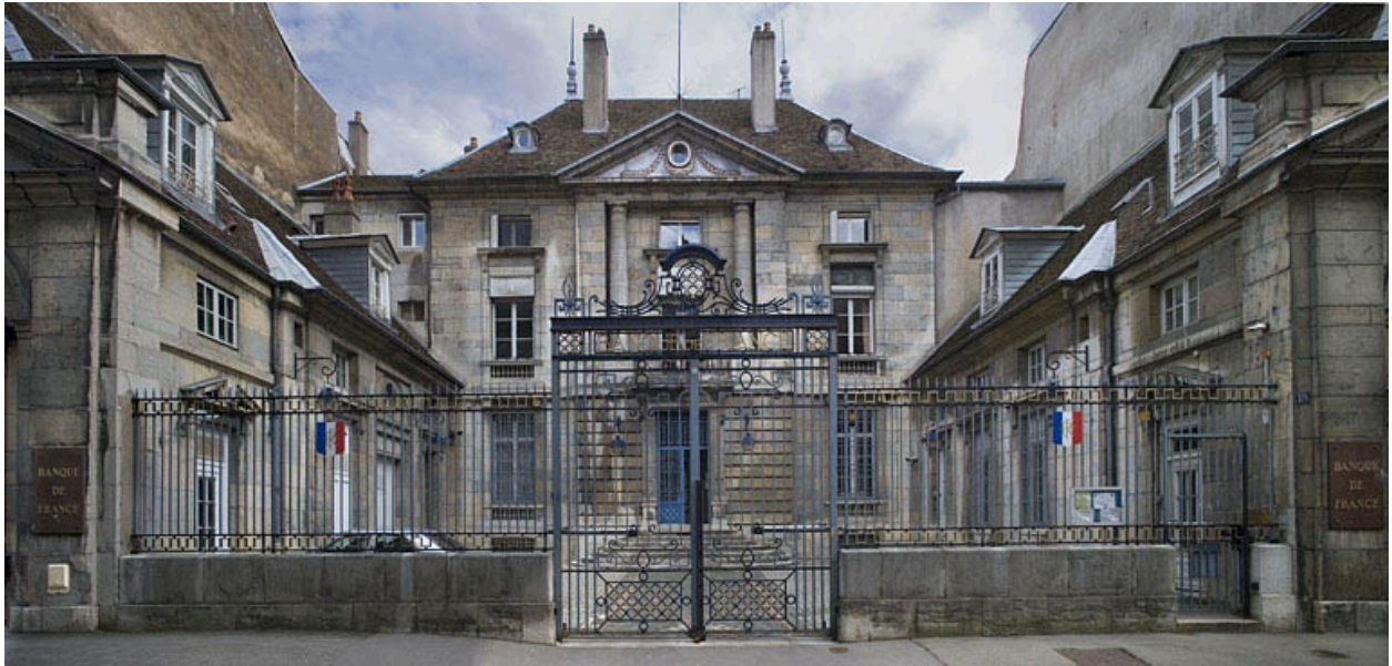
Vue d'ensemble de face depuis la rue.