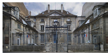
Vue d'ensemble de face depuis la rue.