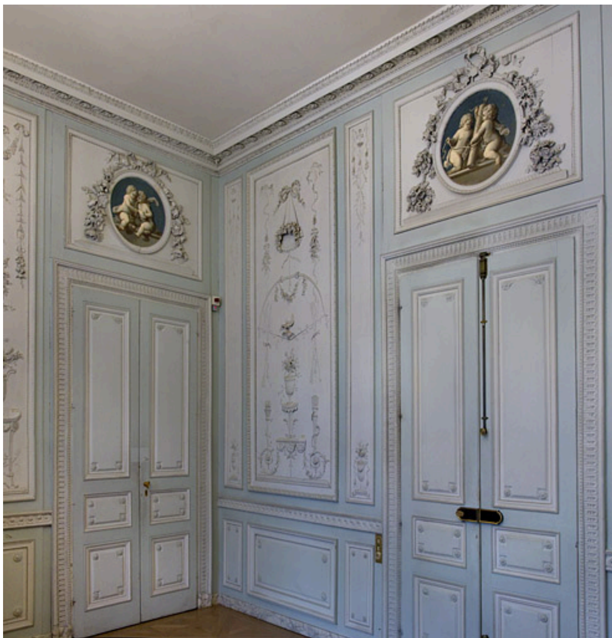
Intérieur, salon du rez-de-chaussée : détail des lambris dans un angle de la pièce.