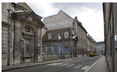
Vue de trois quarts gauche depuis la rue.