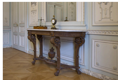
Intérieur, salon du rez-de-chaussée : vue d'ensemble de la console, de trois quarts droit. IVR43_20122501926NUC2A