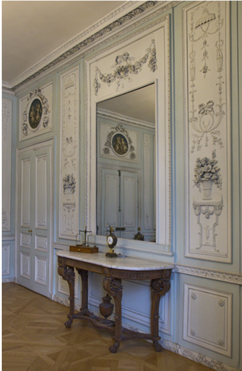
Intérieur, salon du rez-de-chaussée : vue d'ensemble de la console dans son décor de lambris.