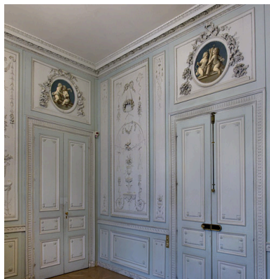
Intérieur, salon du rez-de-chaussée : détail des lambris dans un angle de la pièce.