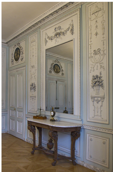
Intérieur, salon du rez-de-chaussée : vue d'ensemble de la console dans son décor de lambris. IVR43_20122501925NUC2A