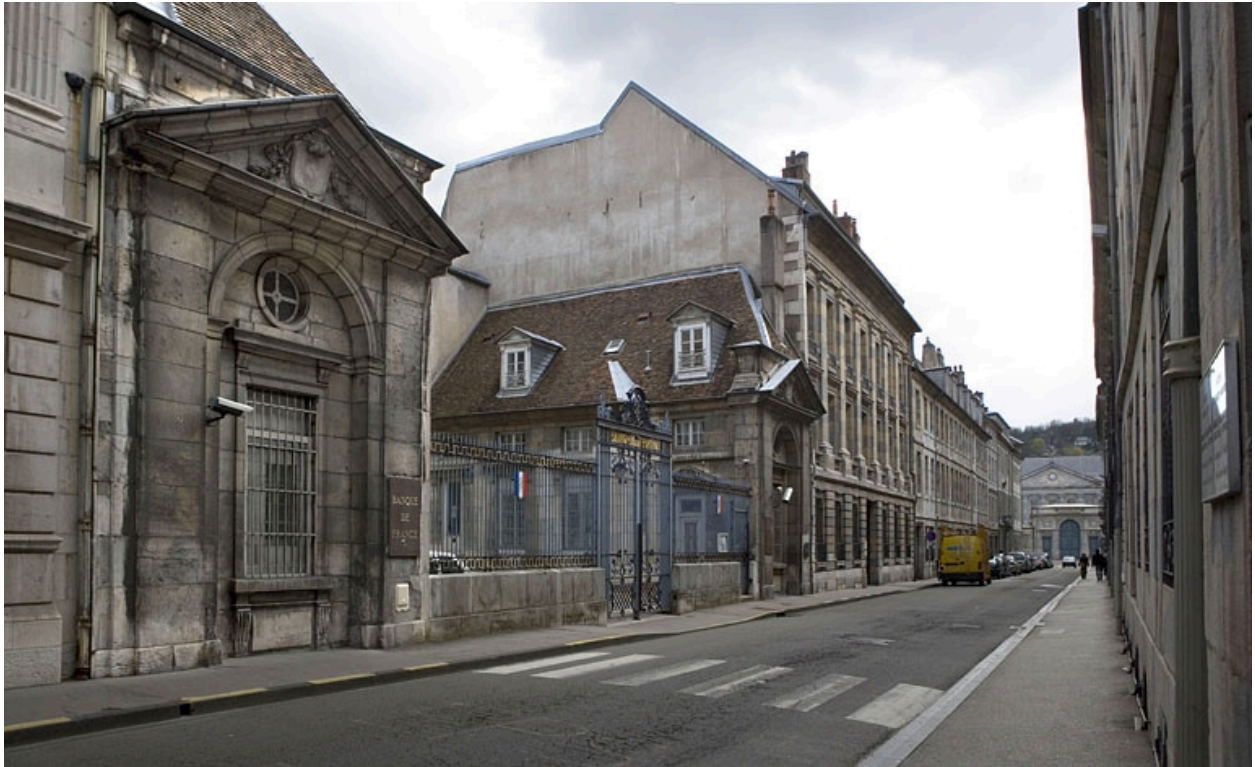
Vue de trois quarts gauche depuis la rue.