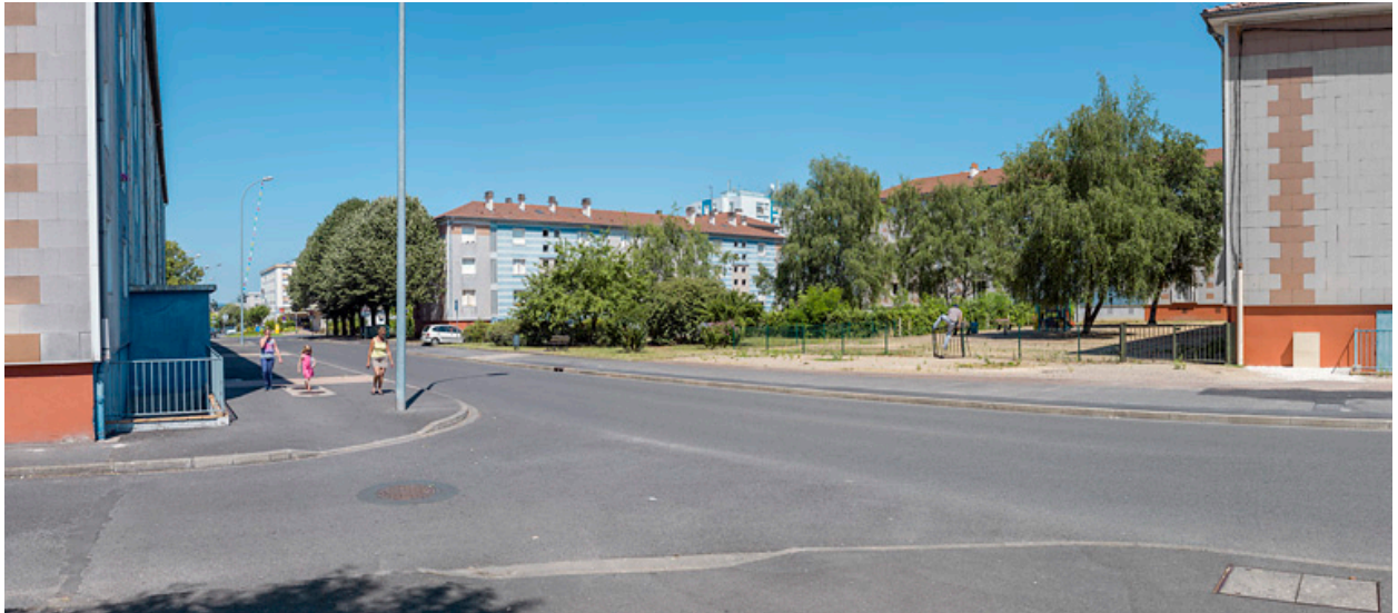
Vue depuis le croisement de l'avenue de la Paix et l'allée Antoine de Saint-Exupéry sur le square entre les bâtiments J, D et C.