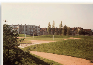
Aménagement du parc Schweitzer, à l'arrière-plan les immeubles 26 et Binot-E. Photographie ancienne, 1982.