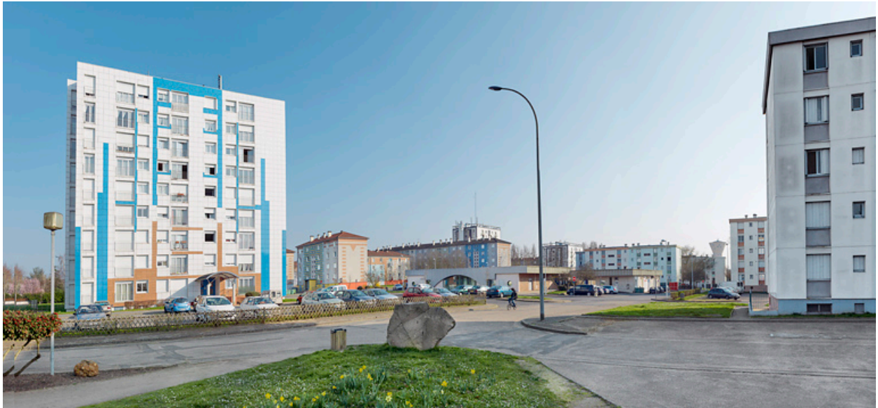
Vue générale entre la tour Schweitzer et le bâtiment B.1 en direction du sud.