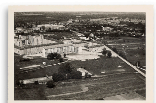
Vue aérienne du quartier Saint-Laurent en construction. Photographie ancienne, s.d., [1970-1971].