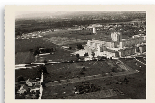
Vue aérienne du quartier Saint-Laurent en construction. Photographie ancienne, s.d., [1970-1971].