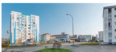
Vue générale entre la tour Schweitzer et le bâtiment B.1 en direction du sud.