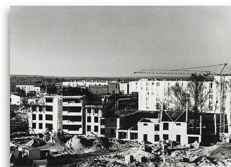
Construction des immeubles du programme Les Hauts de Loire. Photographie ancienne, ca. novembre 1981.