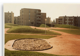
Aménagement du parc Schweitzer, à l'arrière-plan les immeubles 27, 26 et 25. Photographie ancienne, 1982.