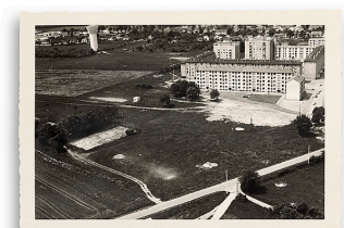
Vue aérienne du quartier Saint-Laurent en construction. Photographie ancienne, s.d., [1970-1971].