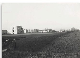
Aménagement du parc Schweitzer, à l'arrière-plan les immeubles 27 et 26. Photographie ancienne, ca.1982.