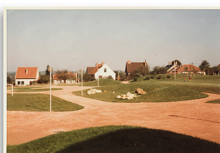
Aménagement du parc Schweitzer. Photographie ancienne, 1982.