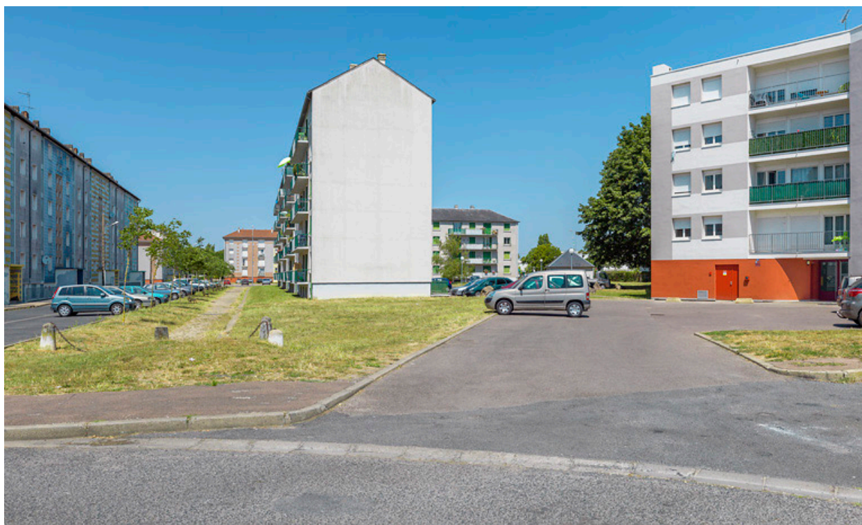
Bâtiment SIDEN, façades postérieure ouest et latérale sud.