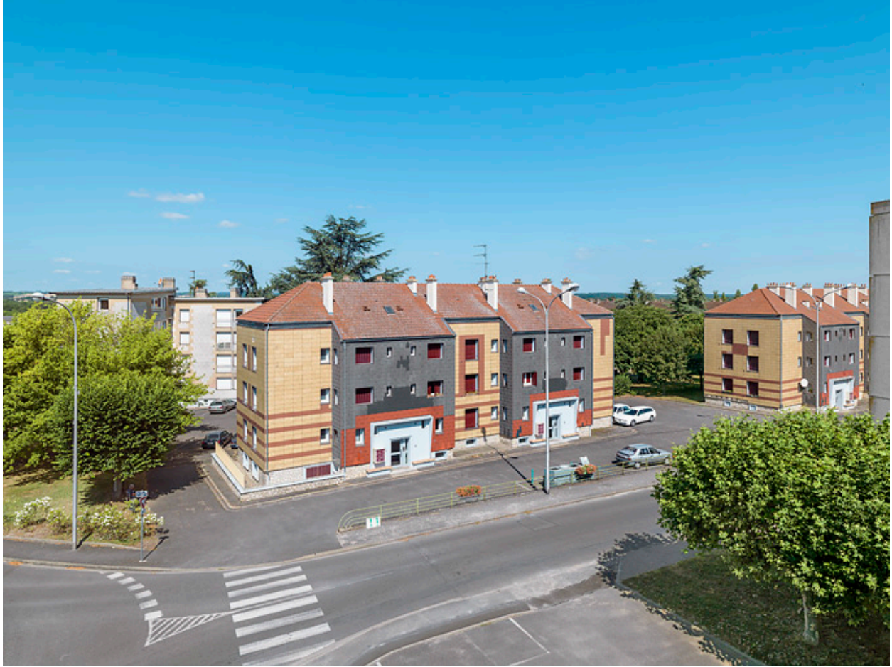
Bâtiment Binot-D, vue en situation.