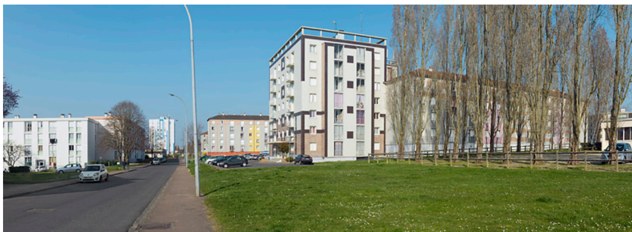
Vue générale depuis le croisement de la rue du Berry et de la rue Pierre et Marie Curie en direction du nord.