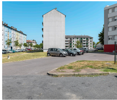
Bâtiment SIDEN, façade latérale sud et façade postérieure sud.