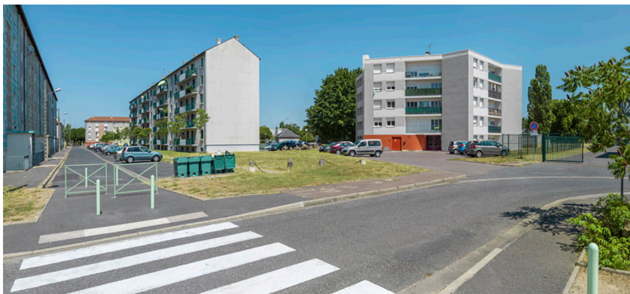
Bâtiment E, SIDEN et X depuis la place Pierre et Marie Curie.