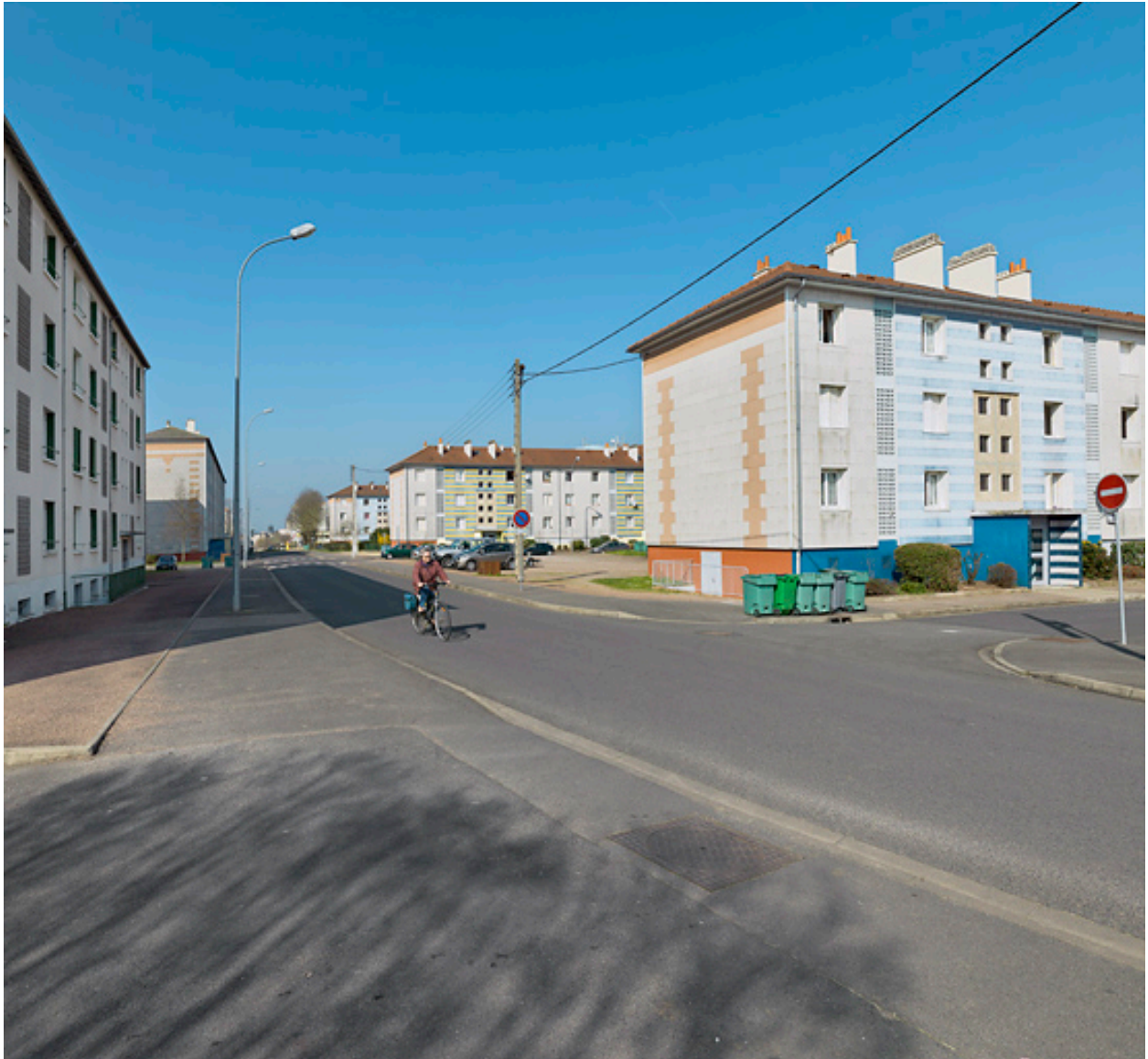
Vue générale depuis le nord de l'avenue de la Paix en direction de l'ouest.