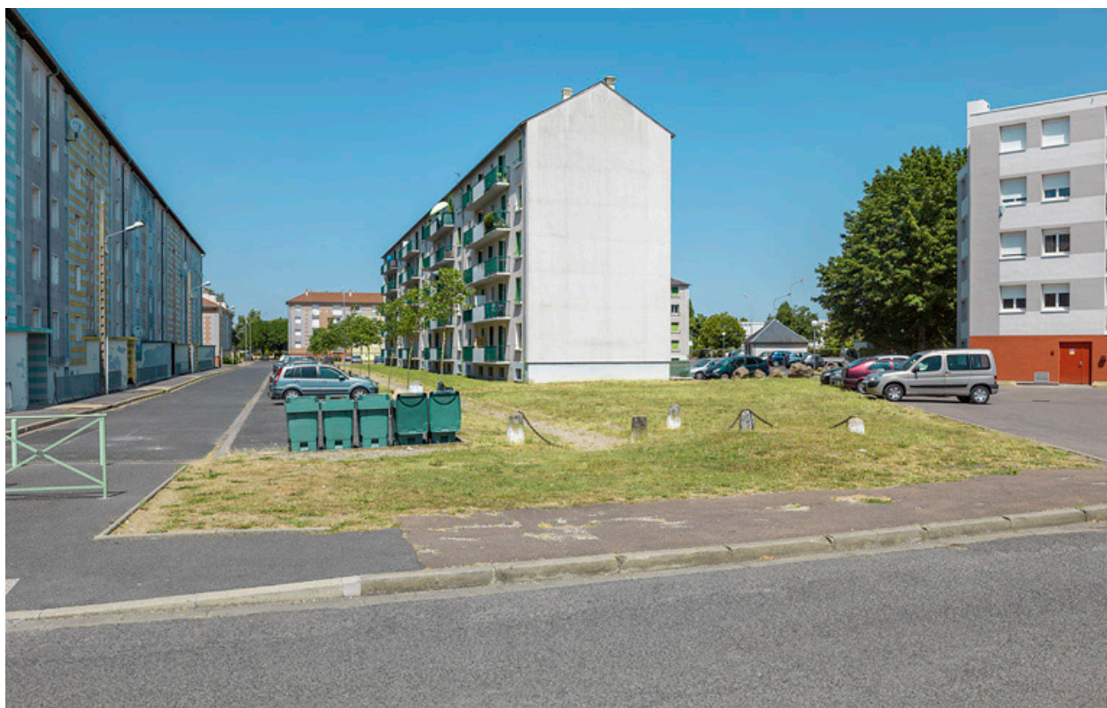
Bâtiment SIDEN, façades postérieure ouest et latérale sud.