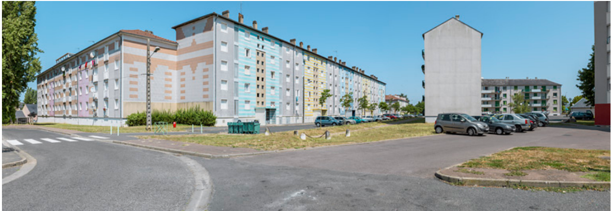
Bâtiment F, E et SIDEN depuis la place Pierre et Marie Curie.