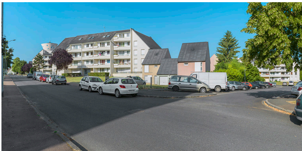
Les Hauts de Loire, vue générale.