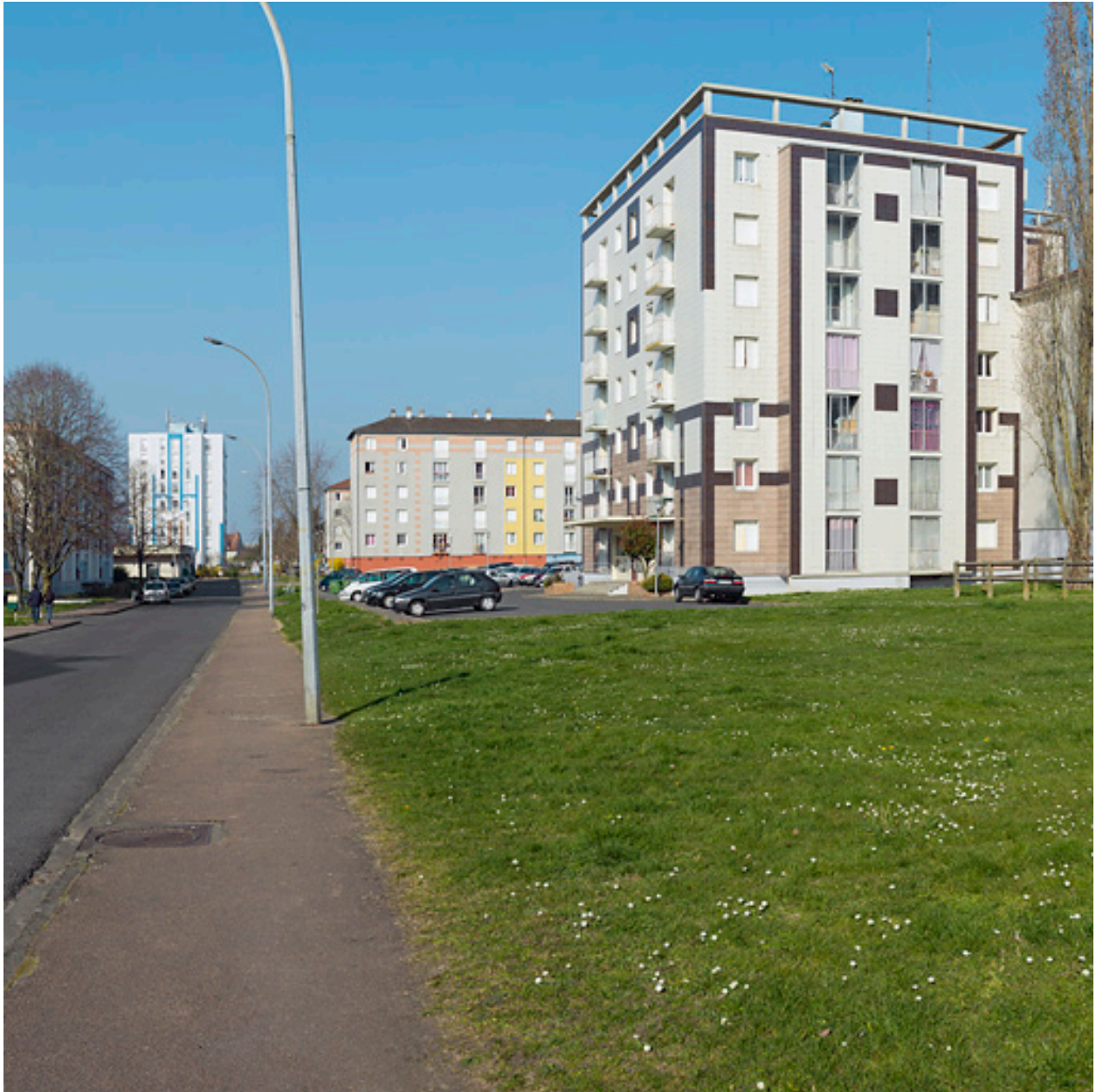
Vue générale depuis la rue du Berry en direction du nord, au premier plan le bloc G.