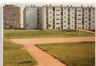
Aménagement du parc Schweitzer, à l'arrière-plan les immeubles B-1 et B-2 et la tour Schweitzer. Photographie ancienne, 1982.