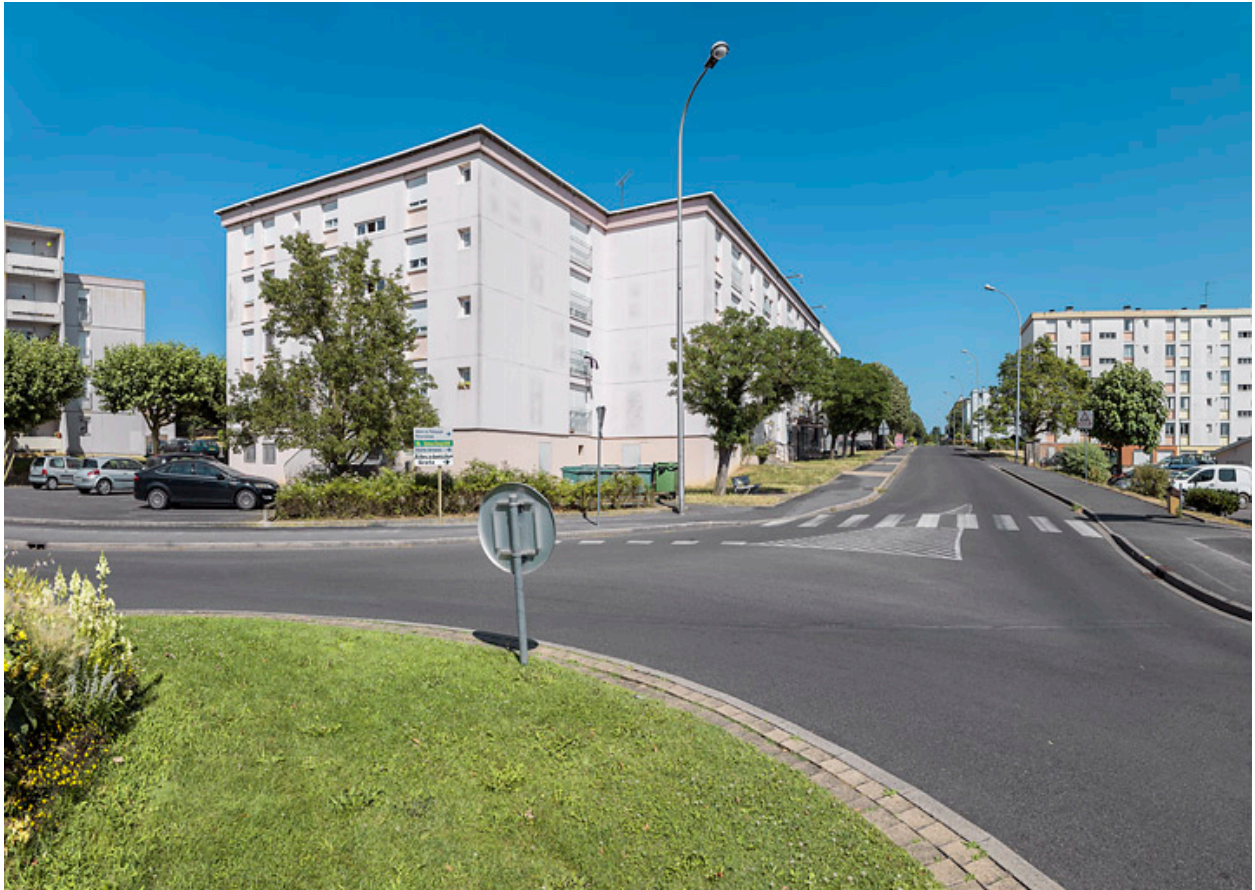
Vue depuis l'extrémité ouest de l'avenue de la Paix en direction de l'est.