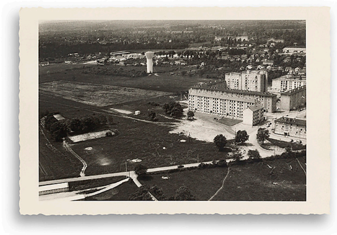
Vue aérienne du quartier Saint-Laurent en construction. Photographie ancienne, s.d., [1970-1971].