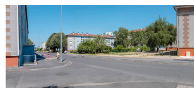
Vue depuis le croisement de l'avenue de la Paix et l'allée Antoine