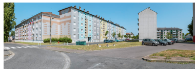
Bâtiment F, E et SIDEN depuis la place Pierre et Marie Curie. IVR26_20155800069NUC4A