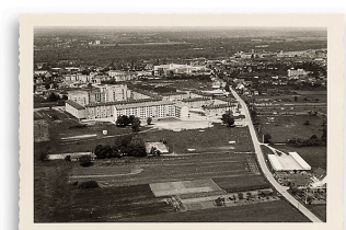
Vue aérienne du quartier Saint-Laurent en construction. Photographie ancienne, s.d., [1970-1971].