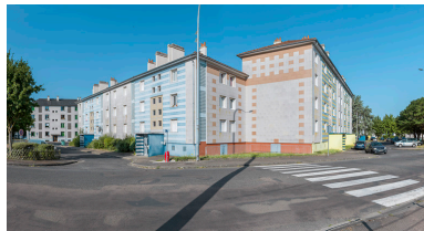
Bâtiments A et B, façades antérieures et latérales. IVR26_20155800049NUC4A