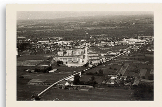
Vue aérienne du quartier Saint-Laurent en construction. Photographie ancienne, s.d., [1970-1971].