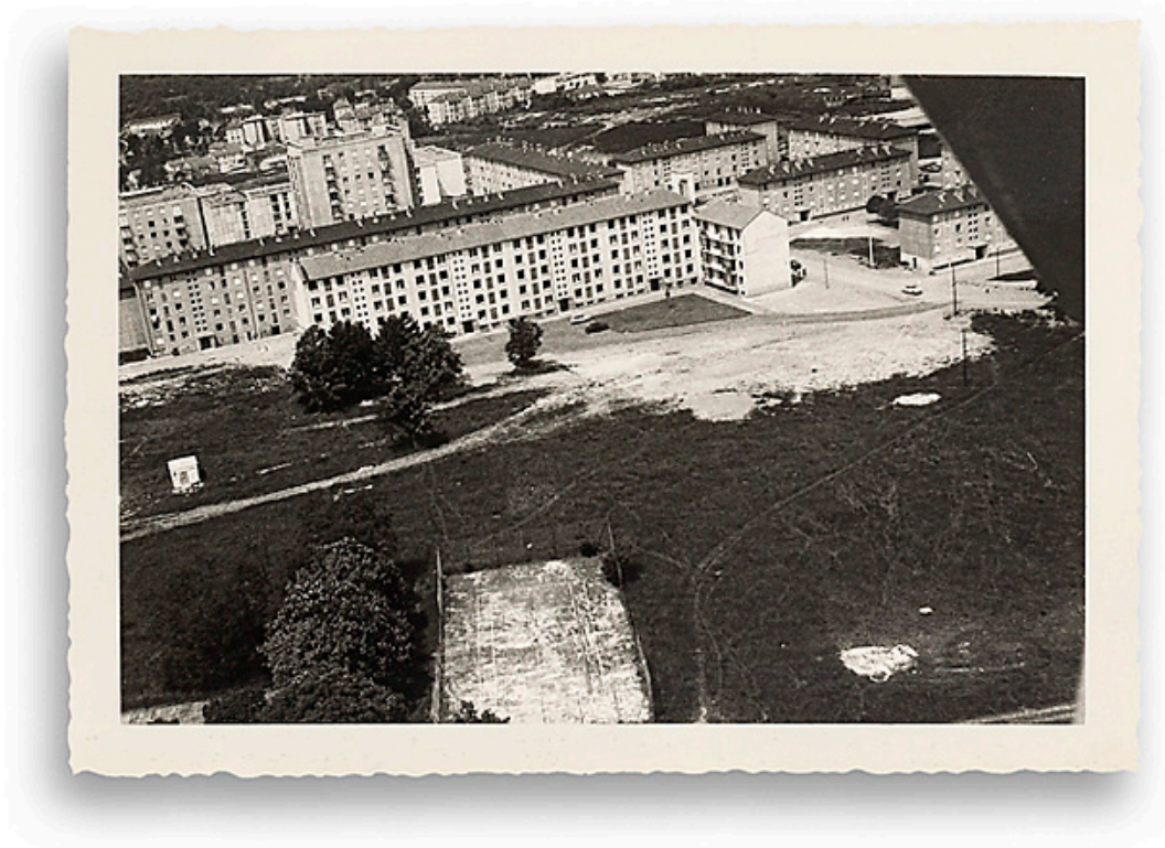
Vue aérienne du quartier Saint-Laurent en construction. Photographie ancienne, s.d., [1970-1971].