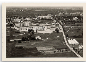
Vue aérienne du quartier Saint-Laurent en construction. Photographie ancienne, s.d., [1970-1971].