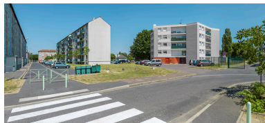
Bâtiment E, SIDEN et X depuis la place Pierre et Marie Curie.