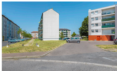
Bâtiment SIDEN, façades postérieure ouest et latérale sud. IVR26_20155800071NUC4A