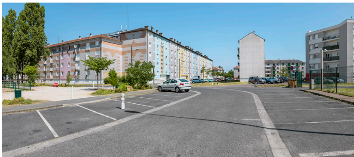
Vue générale depuis la place Pierre et Marie Curie.