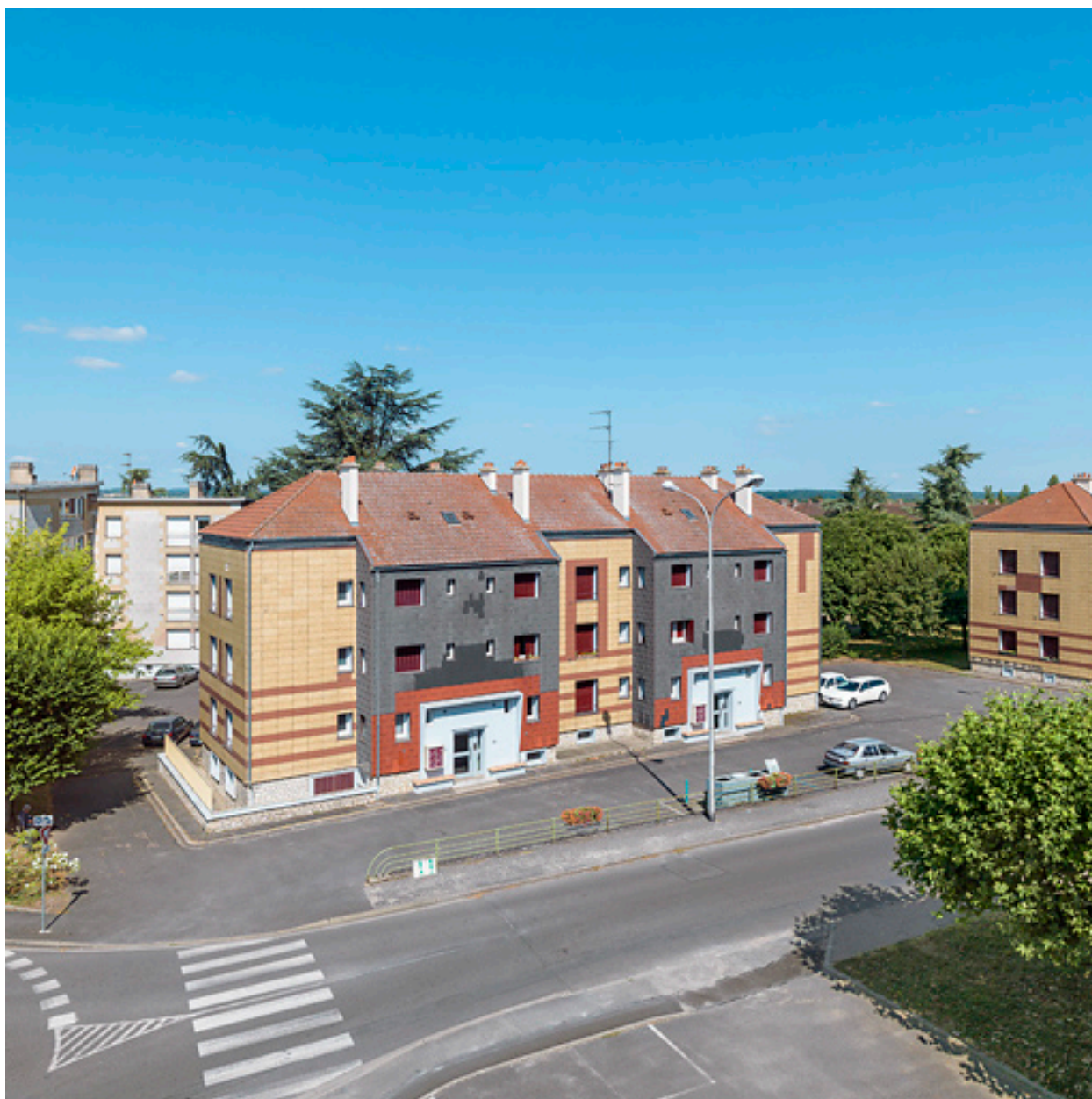
Bâtiment Binot-D, façade antérieure est.