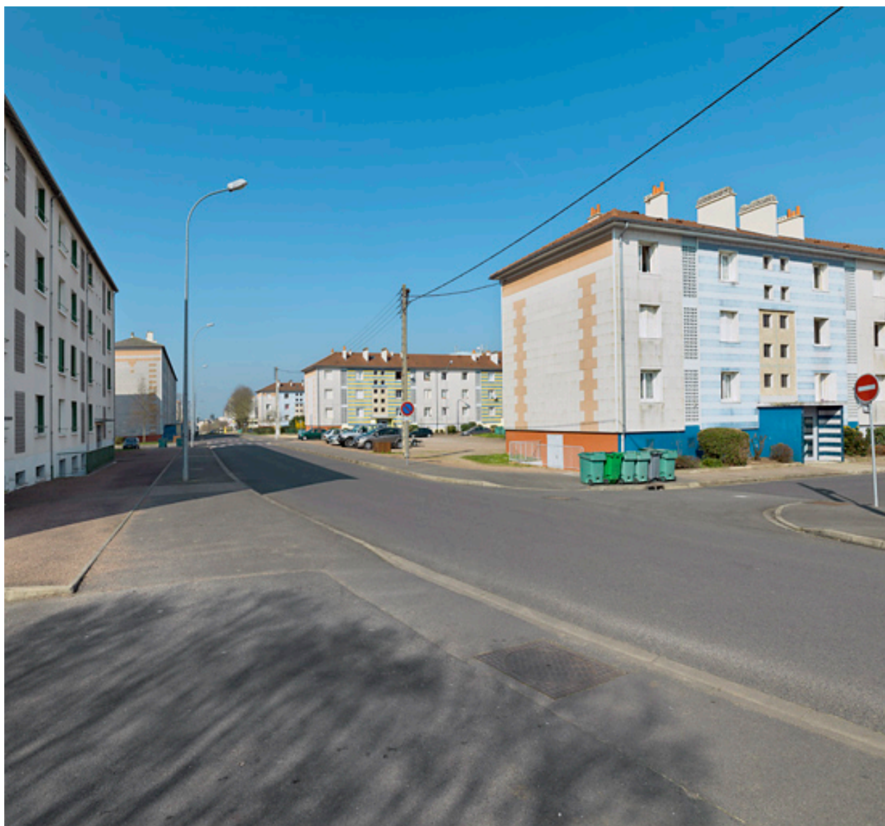
Vue générale depuis le nord de l'avenue de la Paix en direction de l'ouest.