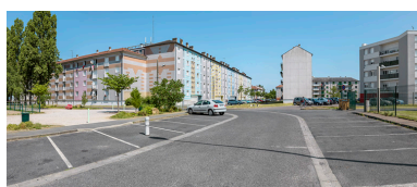
Vue générale depuis la place Pierre et Marie Curie.