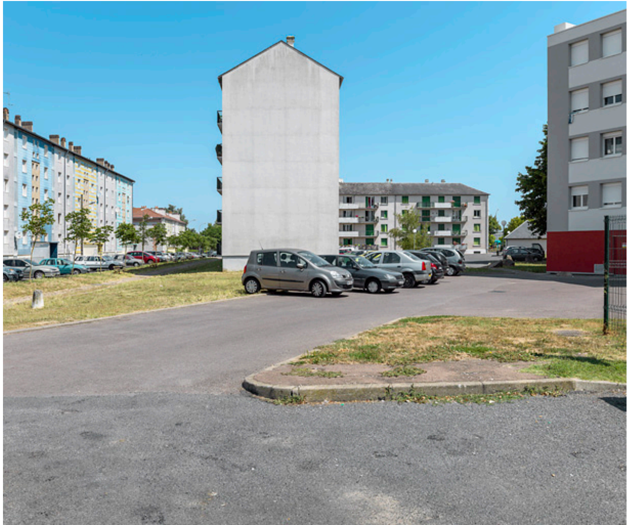
Bâtiment SIDEN, façade latérale sud et façade postérieure sud.