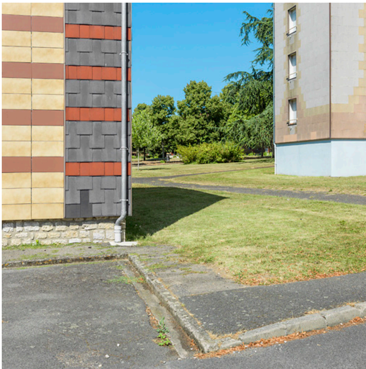
Vue sur le parc de la cité Binot, entre les bâtiments Binot-A et Million-1.