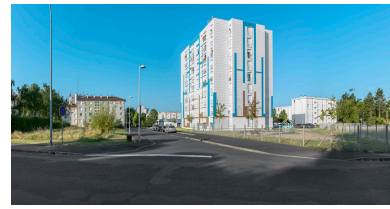
Tour Schweitzer, façade postérieure est et façade latérale nord. IVR26_20155800052NUC4A