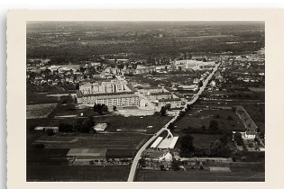
Vue aérienne du quartier Saint-Laurent en construction. Photographie ancienne, s.d., [1970-1971].