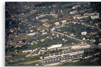
Vue aérienne du sud de Cosne-Cours-sur-Loire et du quartier Saint-Laurent. Photographie ancienne, s.d., [1990-2000].