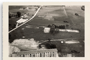
Vue aérienne du quartier Saint-Laurent en construction, au premier plan le bâtiment SIDA. Photographie ancienne, s.d., [1970-1971].

(Archives municipales Cosne-Cours-sur-Loire, 202W683 - 2Fi72)