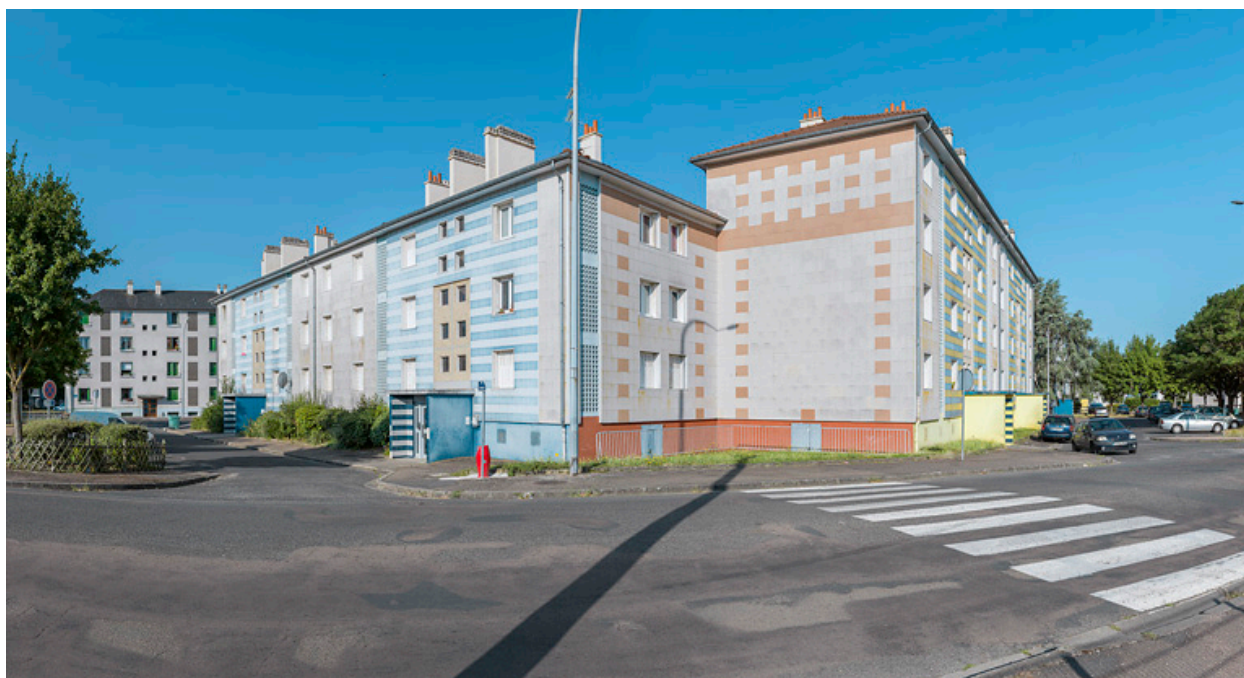
Bâtiments A et B, façades antérieures et latérales.