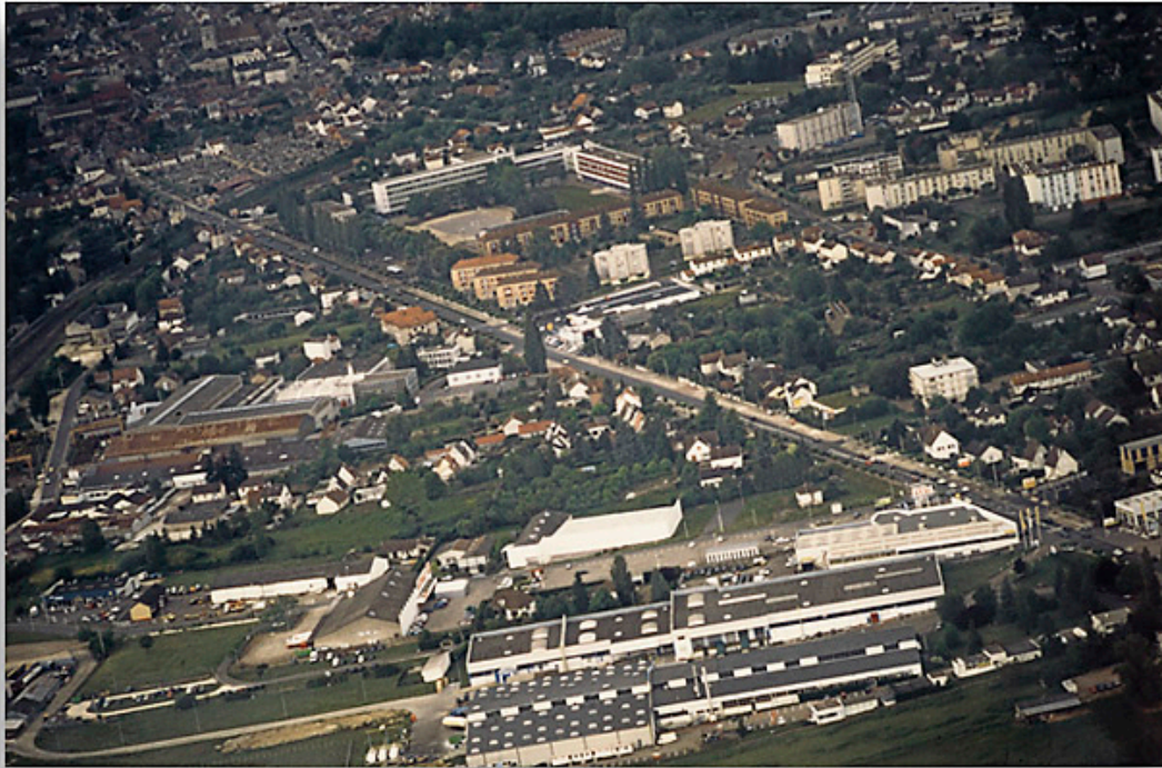
Vue aérienne du sud de Cosne-Cours-sur-Loire et du quartier Saint-Laurent. Photographie ancienne, s.d., [1990-2000].