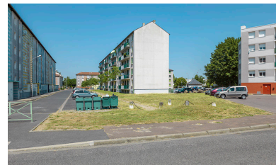
Bâtiment SIDEN, façades postérieure ouest et latérale sud.