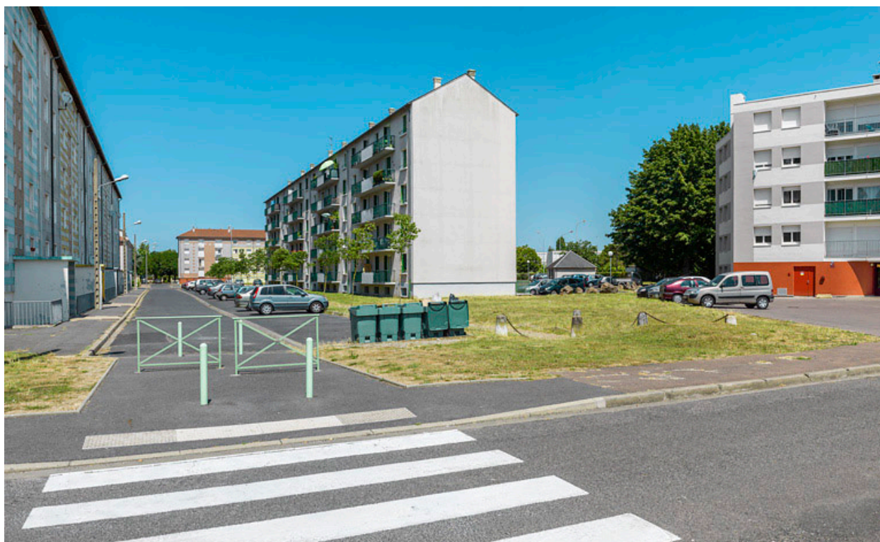
Vue générale depuis la place Pierre et Marie Curie en direction du nord.