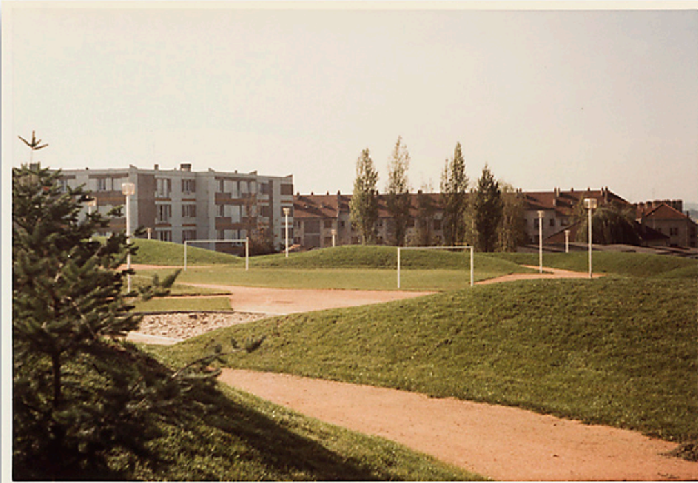
Aménagement du parc Schweitzer, à l'arrière-plan les immeubles 26 et Binot-E. Photographie ancienne, 1982.