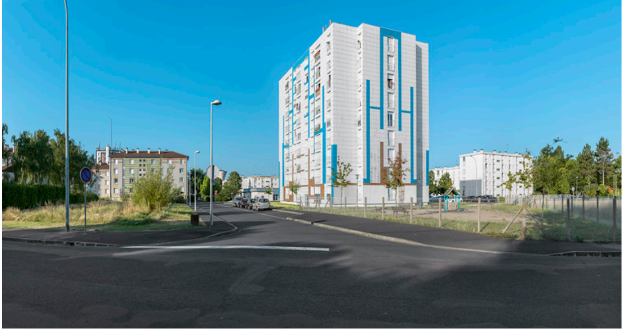
Tour Schweitzer, façade postérieure est et façade latérale nord.