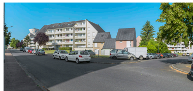
Les Hauts de Loire, vue générale.