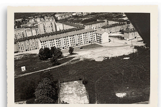
Vue aérienne du quartier Saint-Laurent en construction. Photographie ancienne, s.d., [1970-1971].