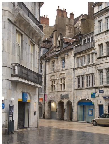
Façade antérieure du 15 Grande Rue : vue éloignée de trois quarts droit. IVR43_20102500237NUC2A