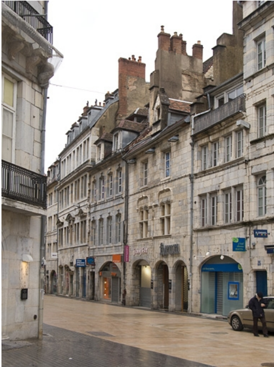
Vue d'ensemble des façades antérieures de trois quarts droit.