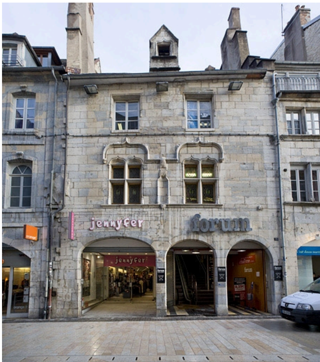
Façade antérieure du 15 Grande Rue : de face.