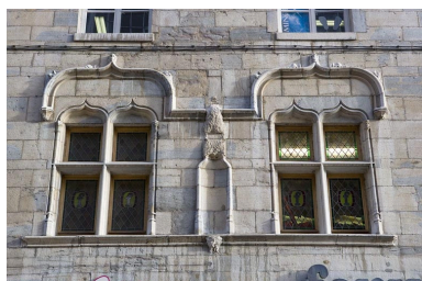
Façade antérieure du 15 Grande Rue : détail des fenêtres du premier étage. IVR43_20102500240NUC2A