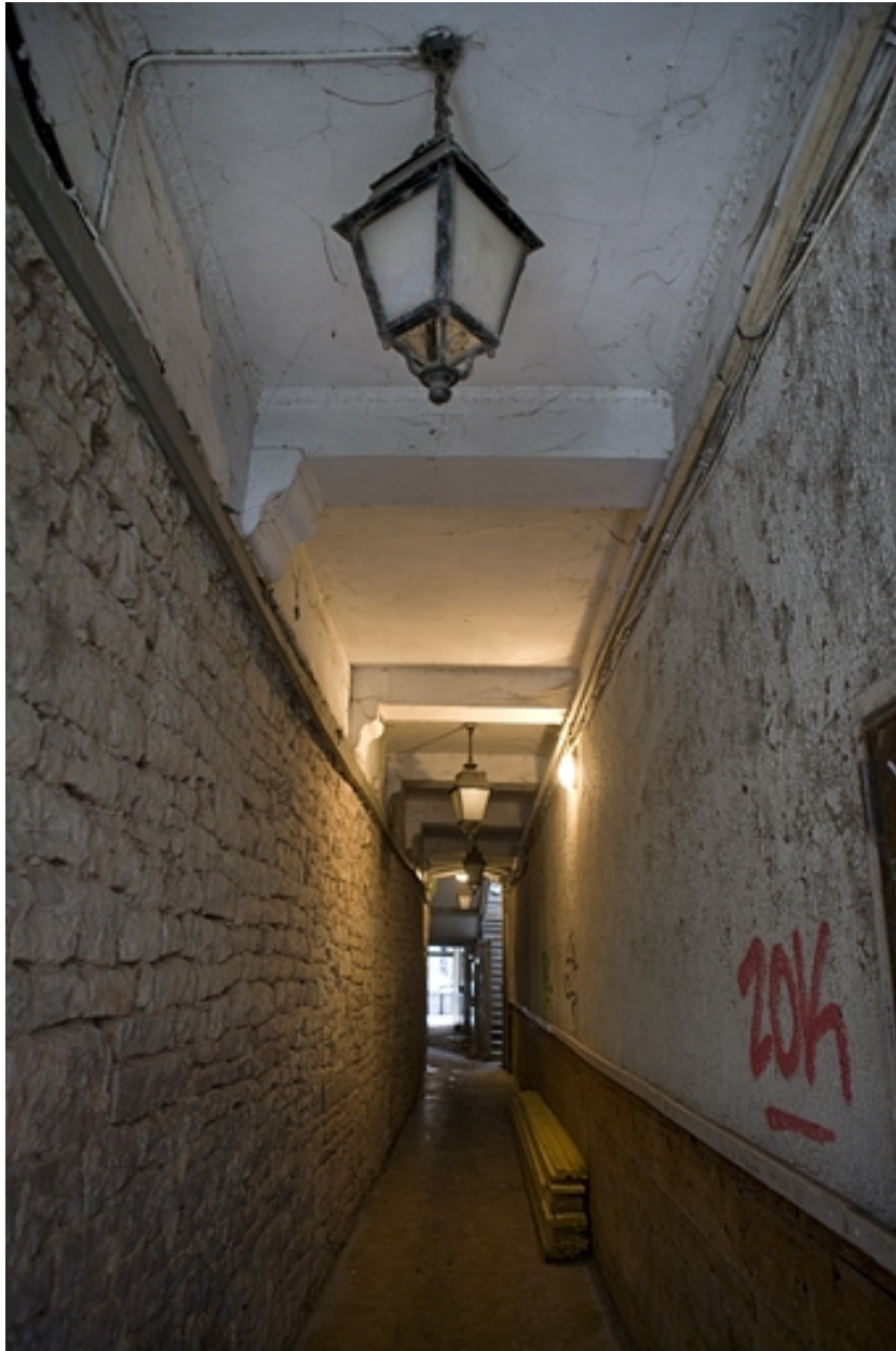
Détail du couloir en enfilade des deux premiers logis : 13 Grande Rue.