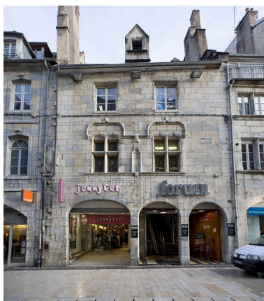
Façade antérieure du 15 Grande Rue : de face. IVR43_20102500239NUC2A