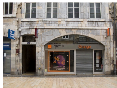
Détail du rez-de-chaussée de la façade antérieure du 13 Grande Rue : de face. IVR43_20102500236NUC2A