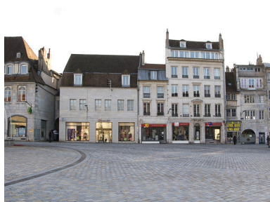
Vue d'ensemble éloignée des façades des logis secondaires