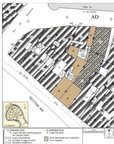
Plan masse et de situation. Extrait du plan cadastral, 1994, section AD. IVR43_20072500061NUDA