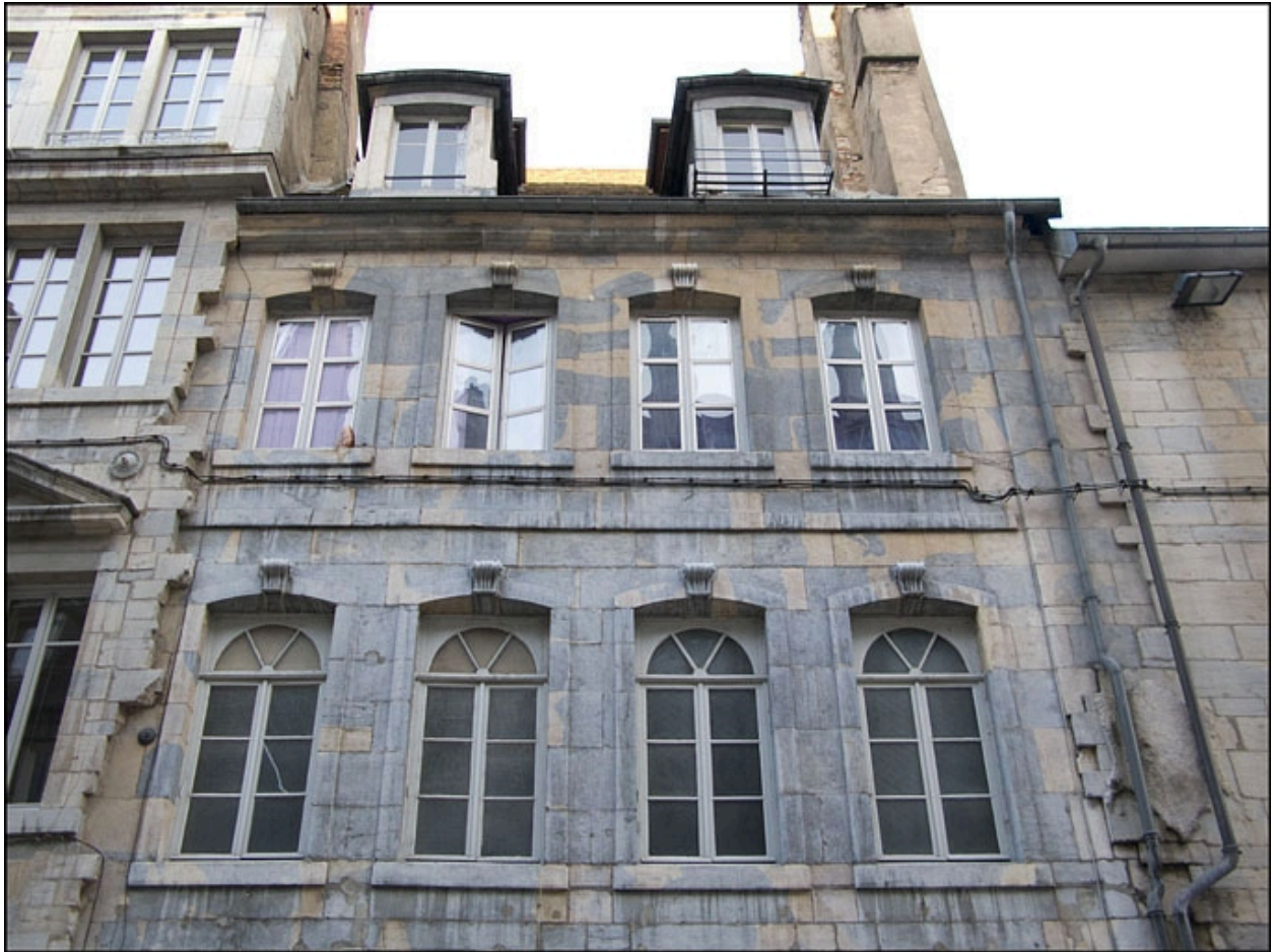
Détail des premier et deuxième étages de la façade antérieure du 13 Grande Rue : de face.