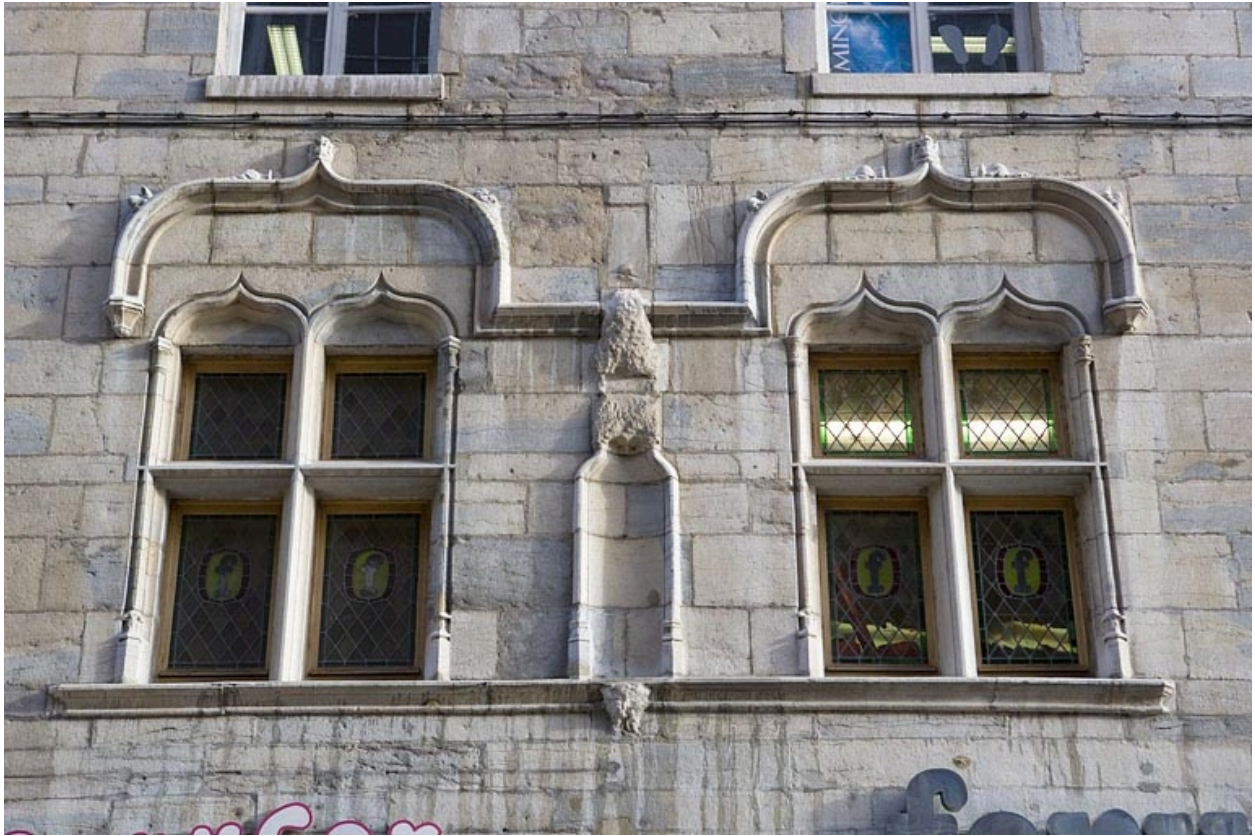
Façade antérieure du 15 Grande Rue : détail des fenêtres du premier étage.