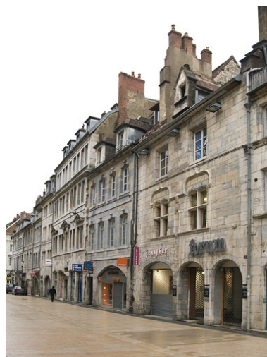
Vue d'ensemble des façades antérieures dans l'alignement de la rue. IVR43_20102500233NUC2A