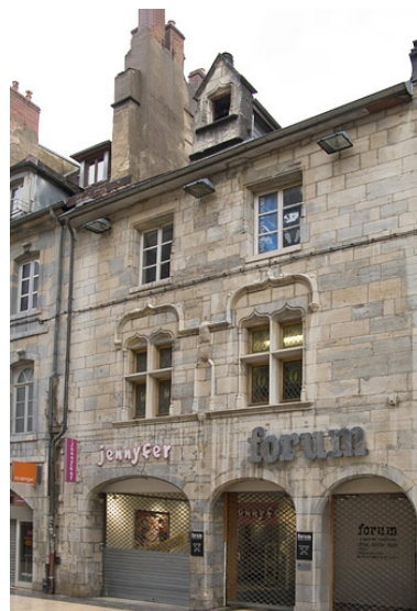
Façade antérieure du 15 Grande Rue : de trois quarts droit. IVR43_20102500238NUC2A