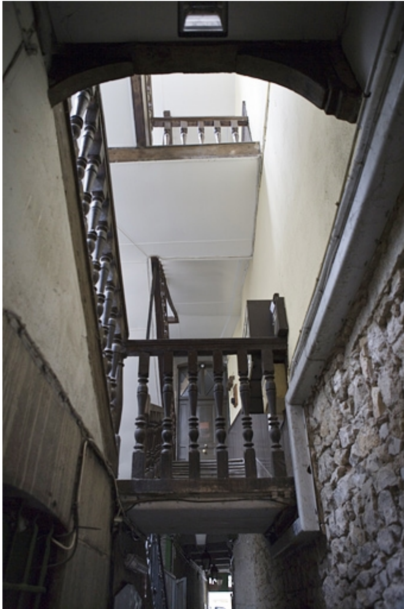
Détail de l'escalier à cage ouverte dans la première cour : 13 Grande Rue.