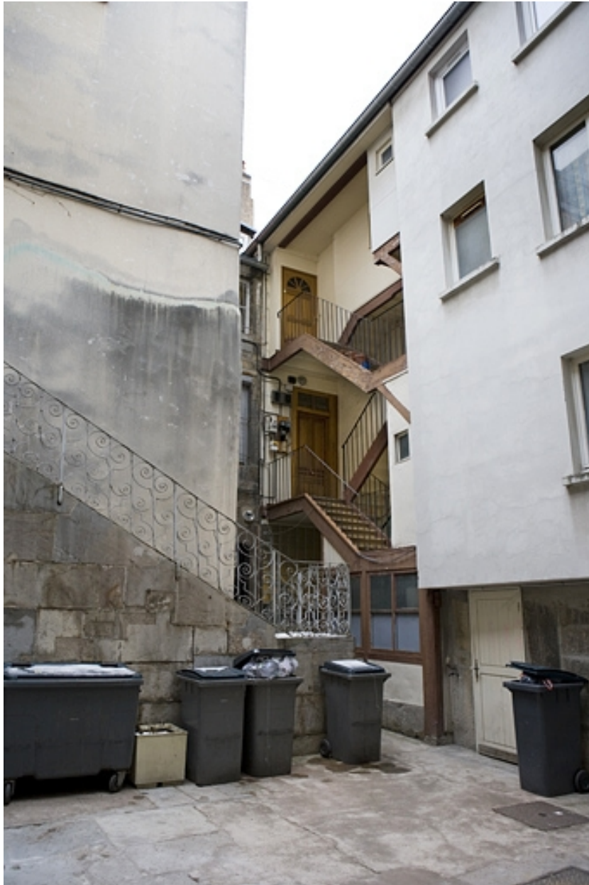
Vue des logis situés dans la deuxième cour : 13 Grande Rue.