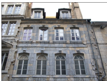
Détail des premier et deuxième étages de la façade antérieure du 13 Grande Rue : de face. IVR43_20102500235NUC2A