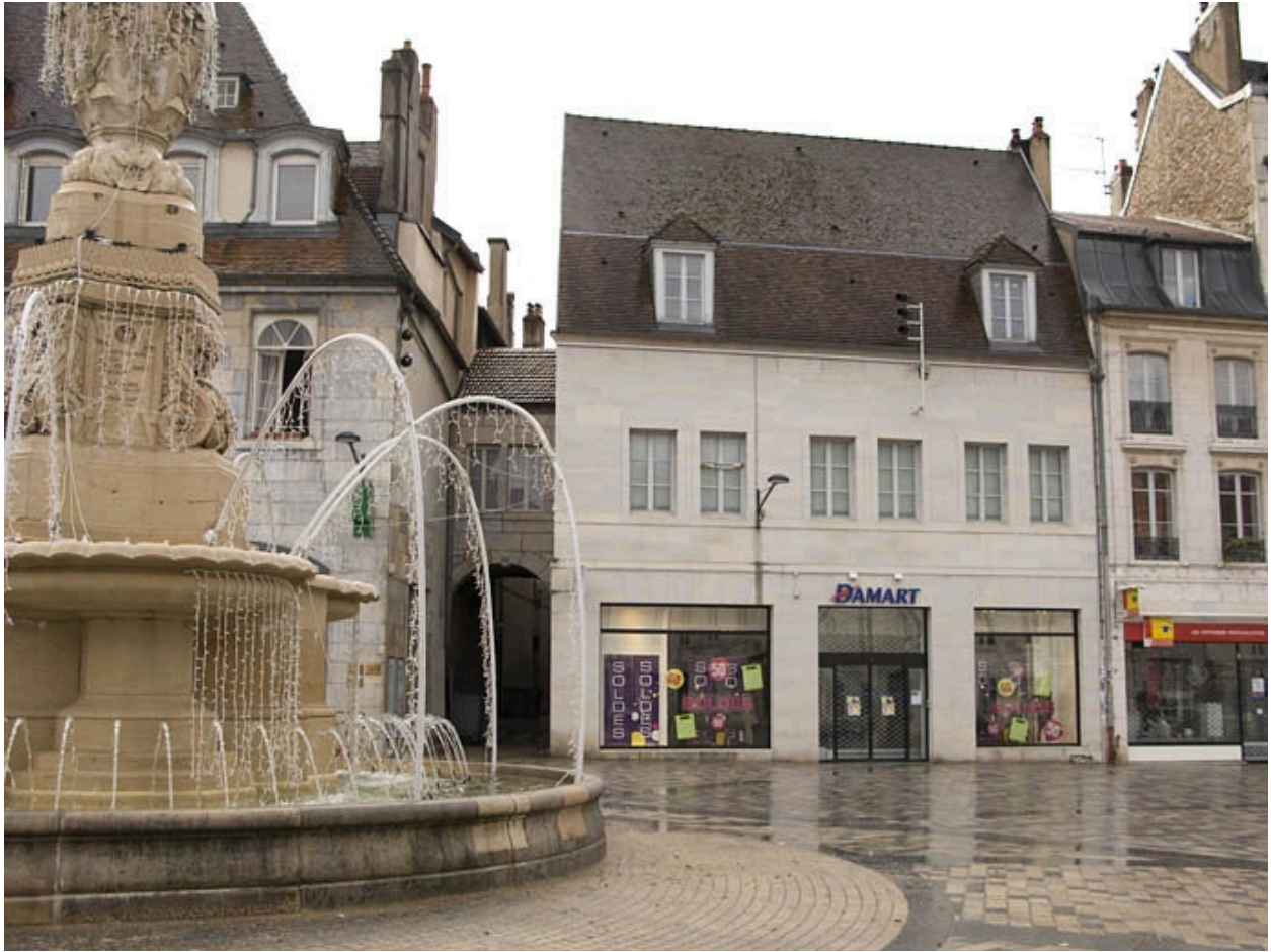
Vue d'ensemble des façades des logis secondaires de l'ancien hôtel, depuis la place de la Révolution.