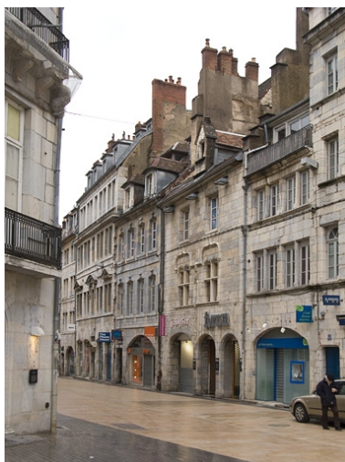
Vue d'ensemble des façades antérieures de trois quarts droit. IVR43_20102500234NUC2A