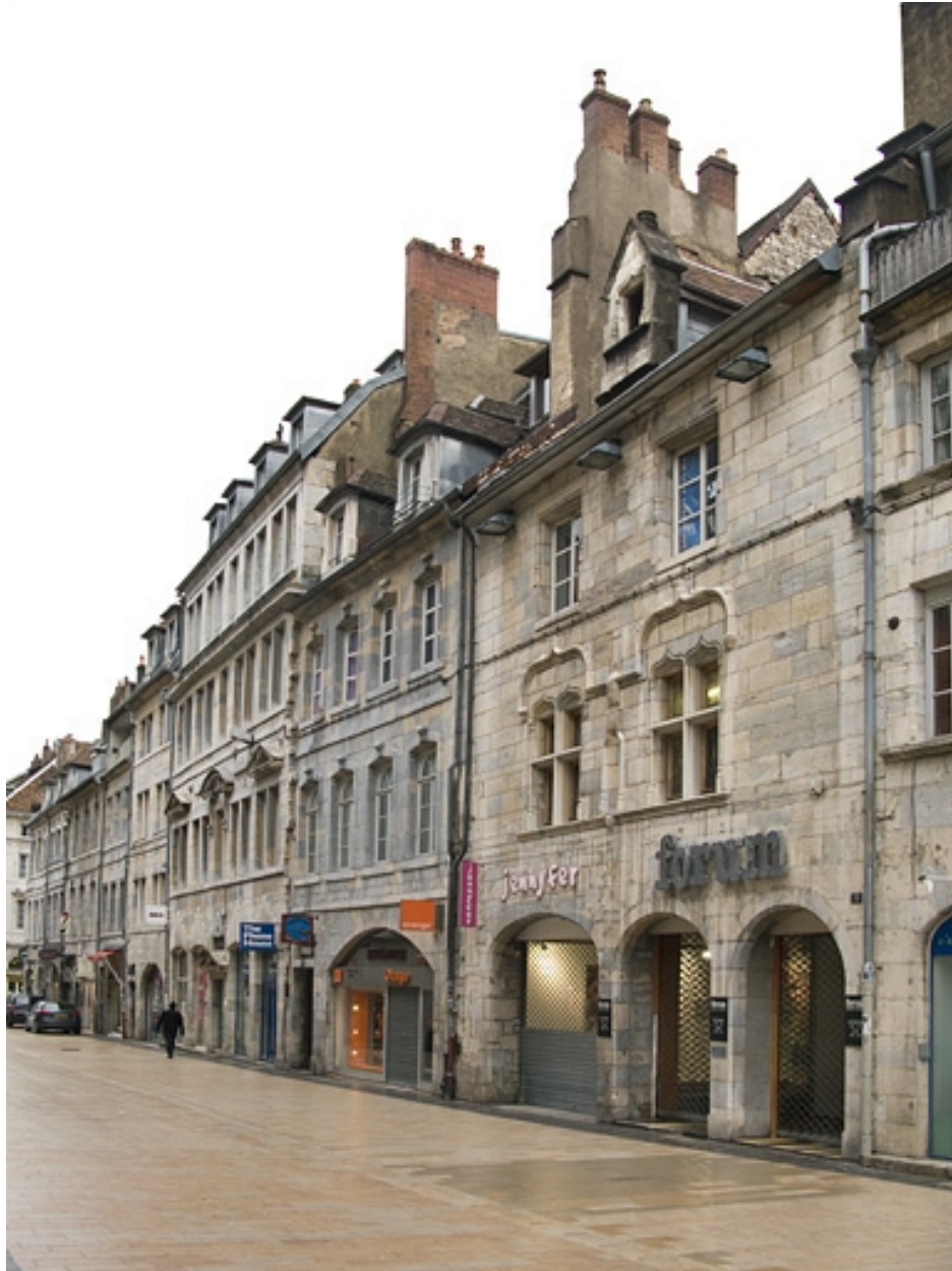
Vue d'ensemble des façades antérieures dans l'alignement de la rue.