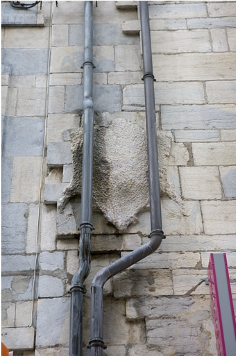
Détail des armoiries bûchées entre le 13 et le 15 Grande Rue.