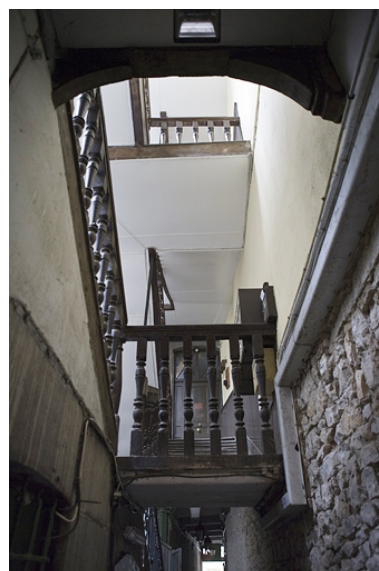
Détail de l'escalier à cage ouverte dans la première cour : 13 Grande Rue. IVR43_20102500244NUC2A