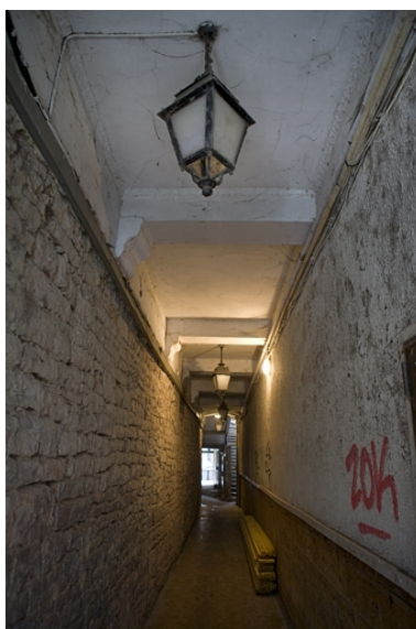
Détail du couloir en enfilade des deux premiers logis : 13 Grande Rue. IVR43_20102500245NUC2A