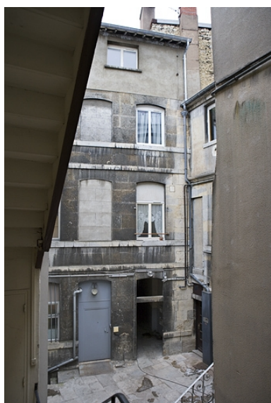
Façade postérieure du premier logis secondaire donnant sur la deuxième cour : 13 Grande Rue. IVR43_20102500247NUC2A