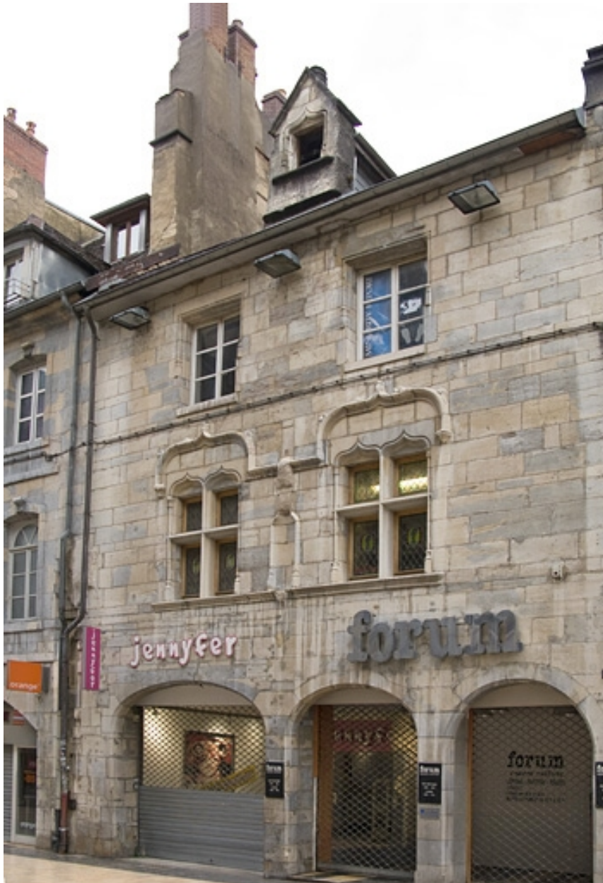
Façade antérieure du 15 Grande Rue : de trois quarts droit.