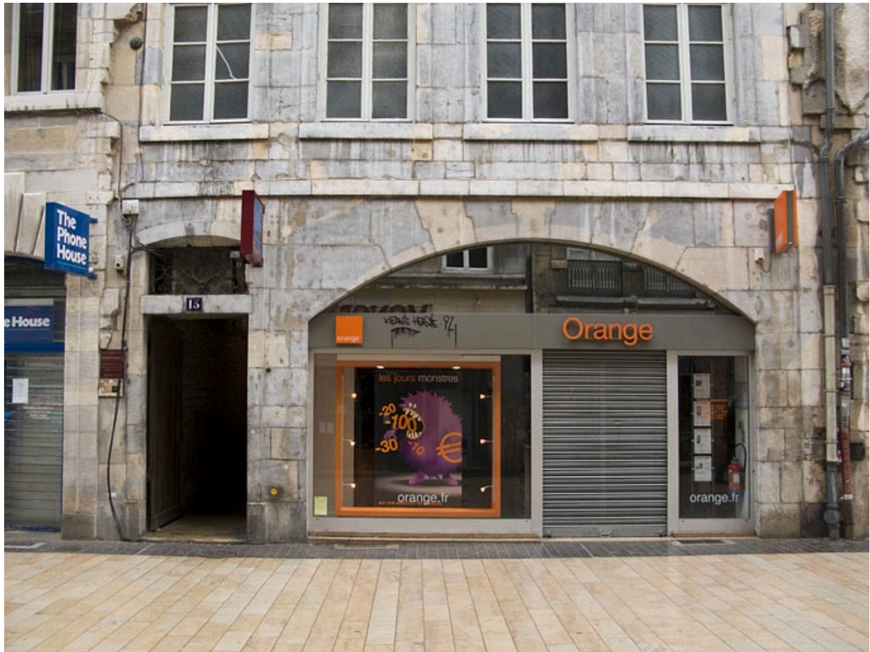
Détail du rez-de-chaussée de la façade antérieure du 13 Grande Rue : de face.