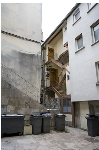
Vue des logis situés dans la deuxième cour : 13 Grande Rue. IVR43_20102500246NUC2A