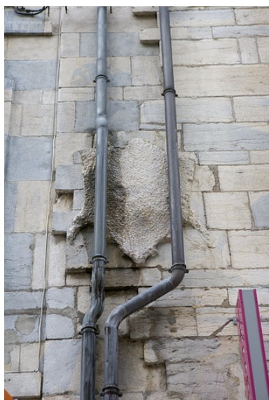
Détail des armoiries bûchées entre le 13 et le 15 Grande Rue. IVR43_20102500241NUC2A