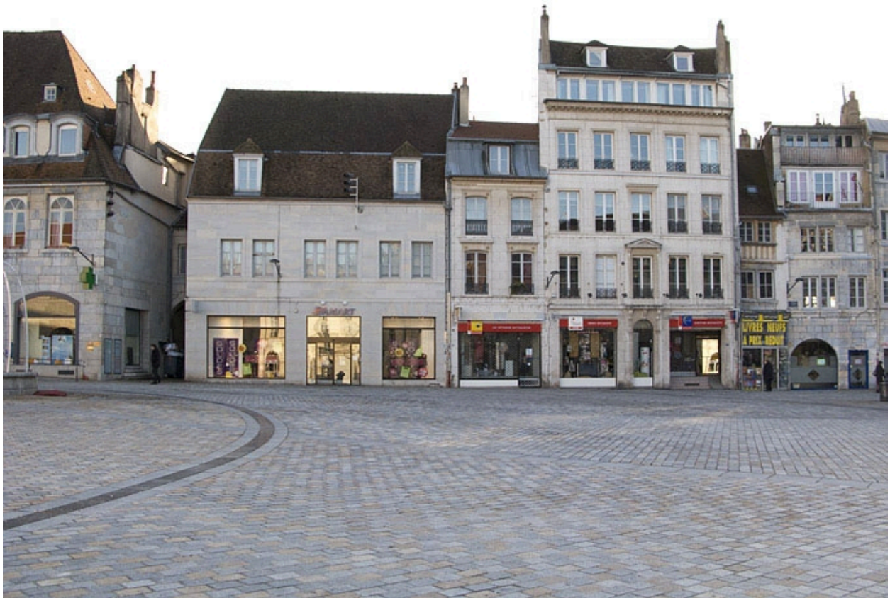
Vue d'ensemble éloignée des façades des logis secondaires de l'ancien hôtel, depuis la place de la Révolution.