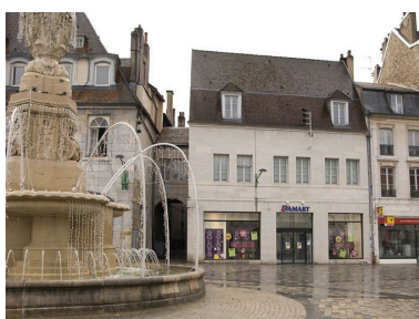
Vue d'ensemble des façades des logis secondaires de l'ancien hôtel, depuis la place de la Révolution.