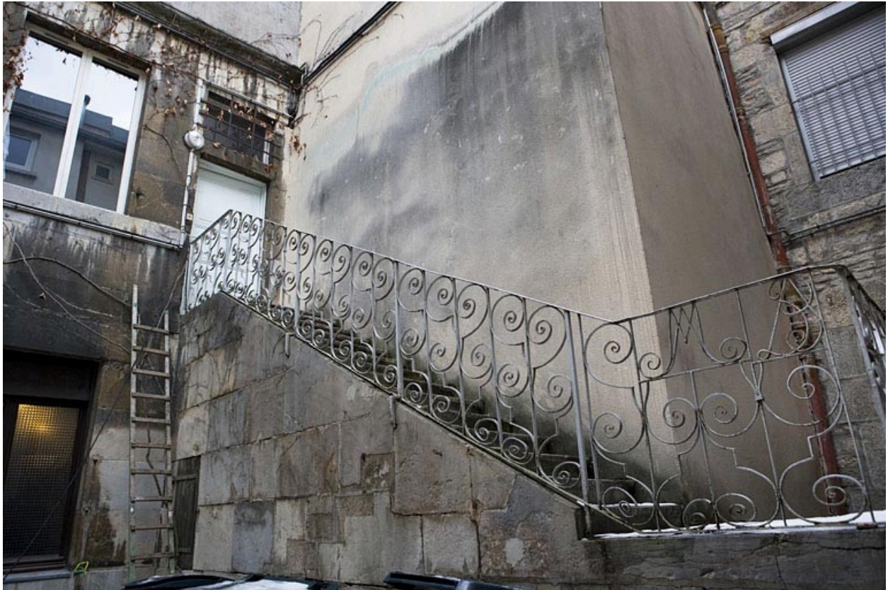
Détail d'un escalier extérieur situé dans la deuxième cour : 13 Grande Rue.