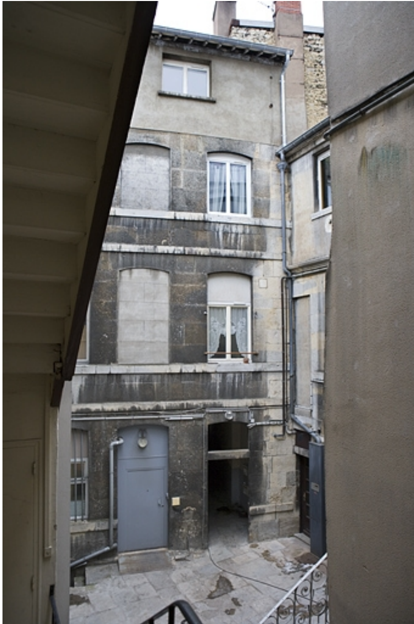
Façade postérieure du premier logis secondaire donnant sur la deuxième cour : 13 Grande Rue.