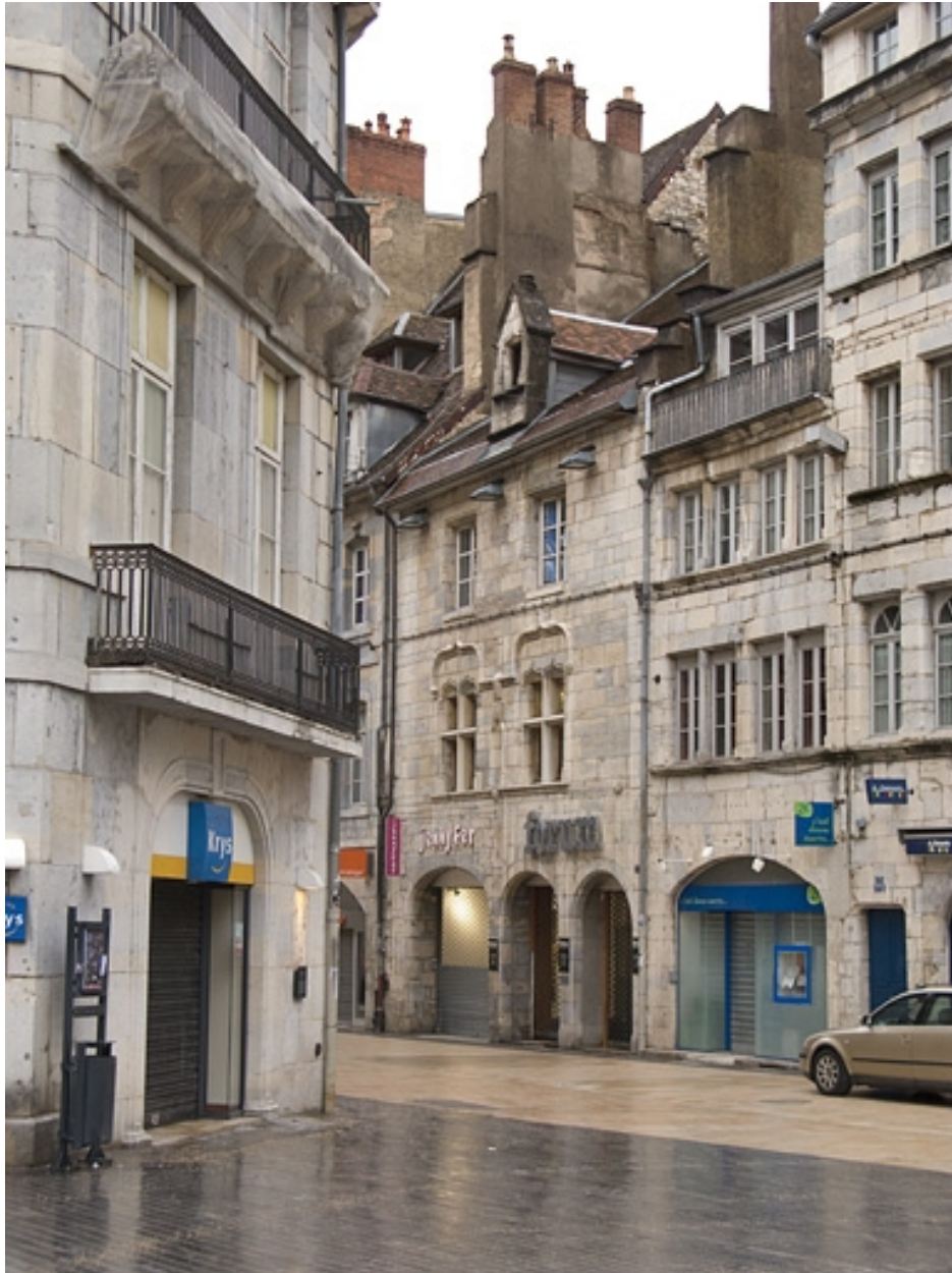
Façade antérieure du 15 Grande Rue : vue éloignée de trois quarts droit.