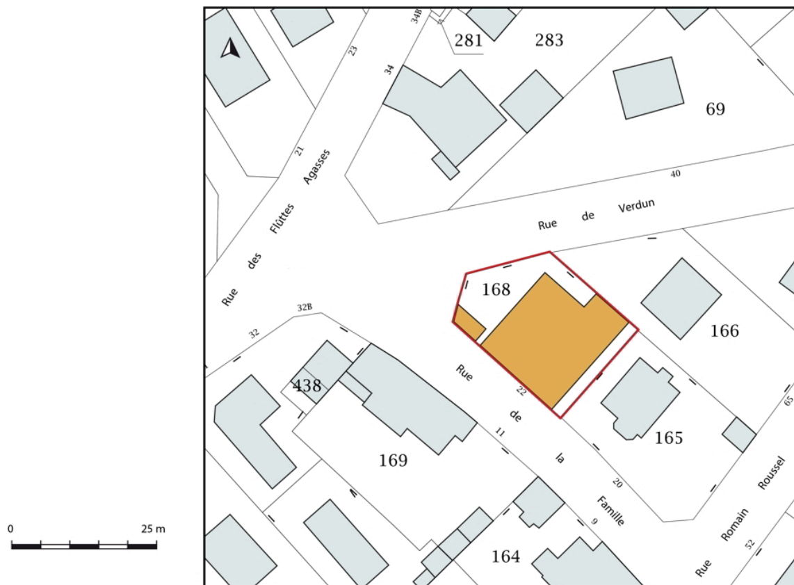
Plan-masse et de situation. Extrait du plan cadastral, 2019.