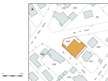
Plan-masse et de situation. Extrait du plan cadastral, 2019. IVR43_20192501111NUDA