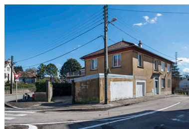
Vue d'ensemble depuis l'ouest. IVR43_20182500561NUC4A