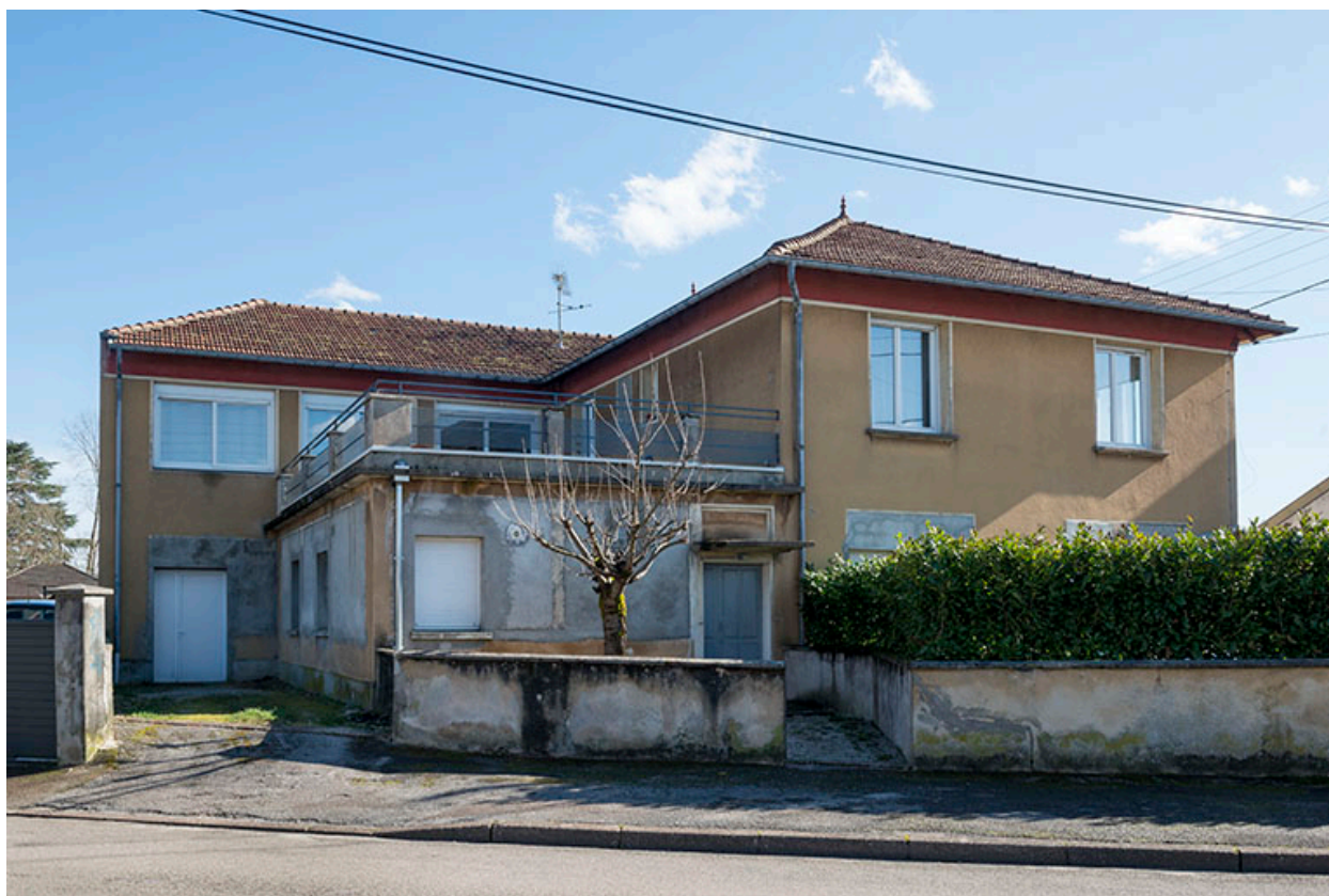
Vue depuis le nord.