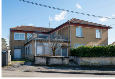
Vue depuis le nord. IVR43_20182500563NUC4A