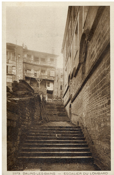
Salins-les-Bains - Escalier du lombard, s.d. [fin 19e ou début du 20e siècle]. IVR43_20243900337NUC4A