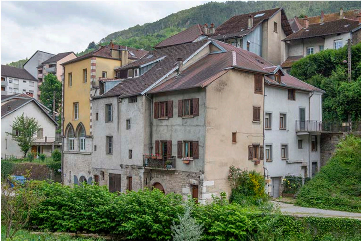
Vue d'ensemble depuis le sud-ouest (immeuble à gauche).