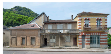
Elévation de la façade rue Gambetta (maison de droite). IVR43_20233900669NUC4A