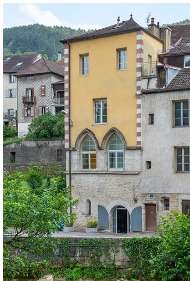
Élévation de la façade ouest. IVR43_20233900461NUC4A