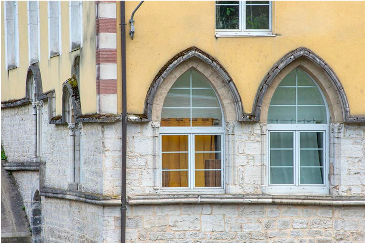
Fenêtres du premier étage, depuis l'ouest.