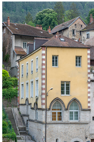
Partie supérieure, depuis l'ouest.