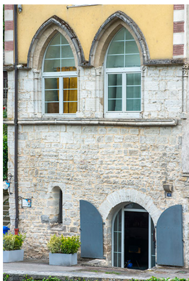
Façade ouest, vue de trois quarts droite. IVR43_20233900460NUC4A