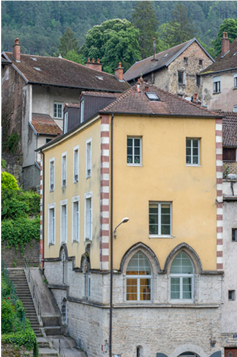
Partie supérieure, depuis l'ouest.