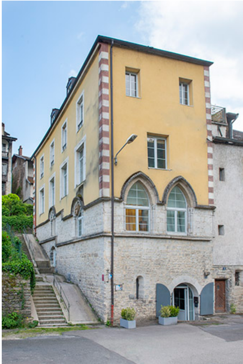
Vue depuis le nord-ouest.