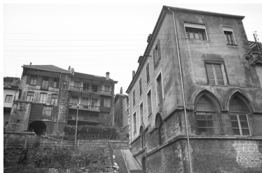
Vue depuis la rue des Barres, s.d. [milieu 20e siècle]. IVR43_20243900934NUC2A