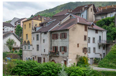
Vue d'ensemble depuis le sud- ouest (immeuble à gauche). IVR43_20233900453NUC4A