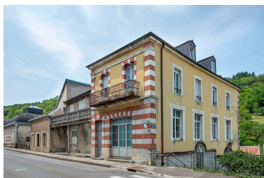
Vue rapprochée depuis le nord-est.