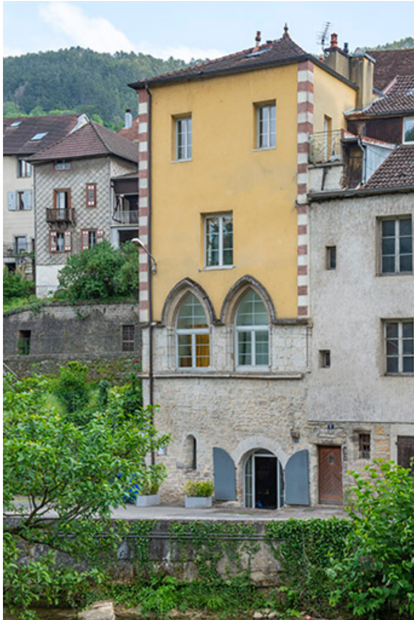
Elévation de la façade ouest.