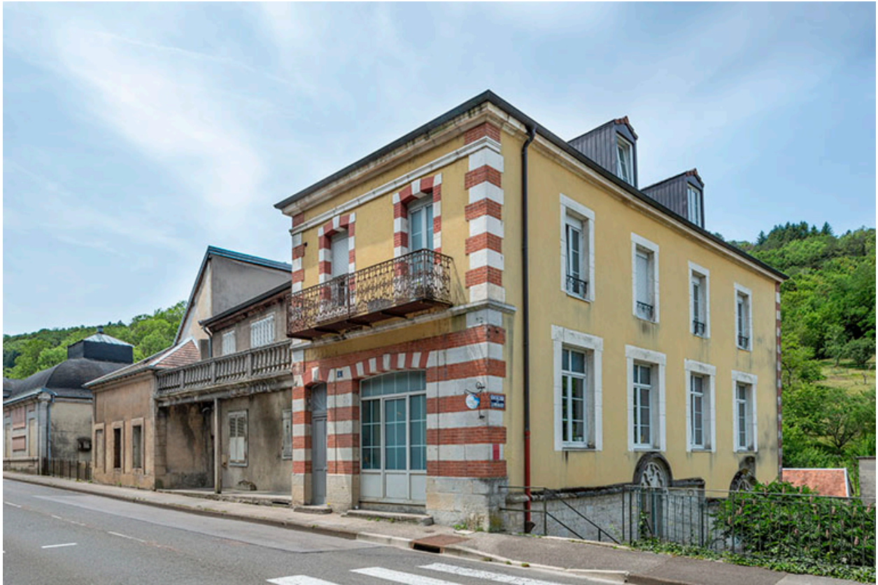
Vue rapprochée depuis le nord-est.