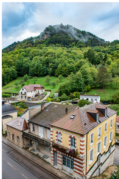
Vue plongeante depuis l'est.