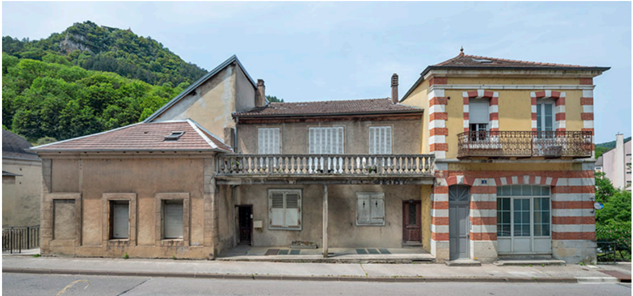
Elévation de la façade rue Gambetta (maison de droite).