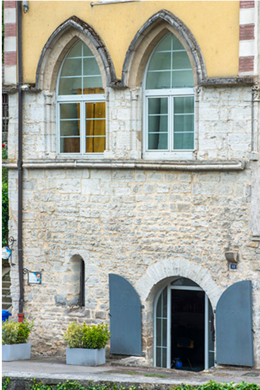
Façade ouest, vue de trois quarts droite.