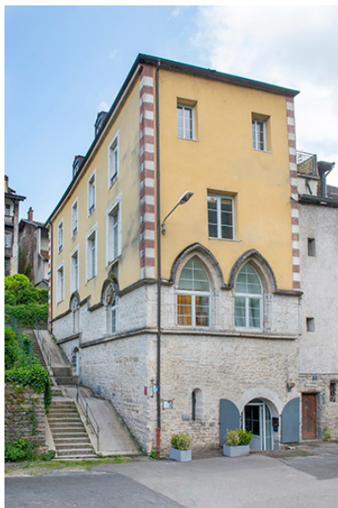
Vue depuis le nord-ouest.