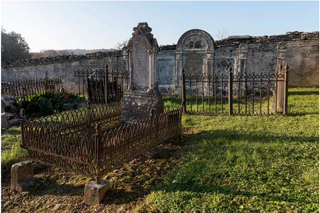
Vue partielle du cimetière.