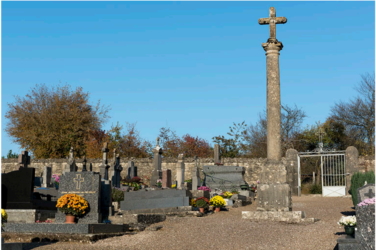
Vue générale de la croix du nouveau cimetière.