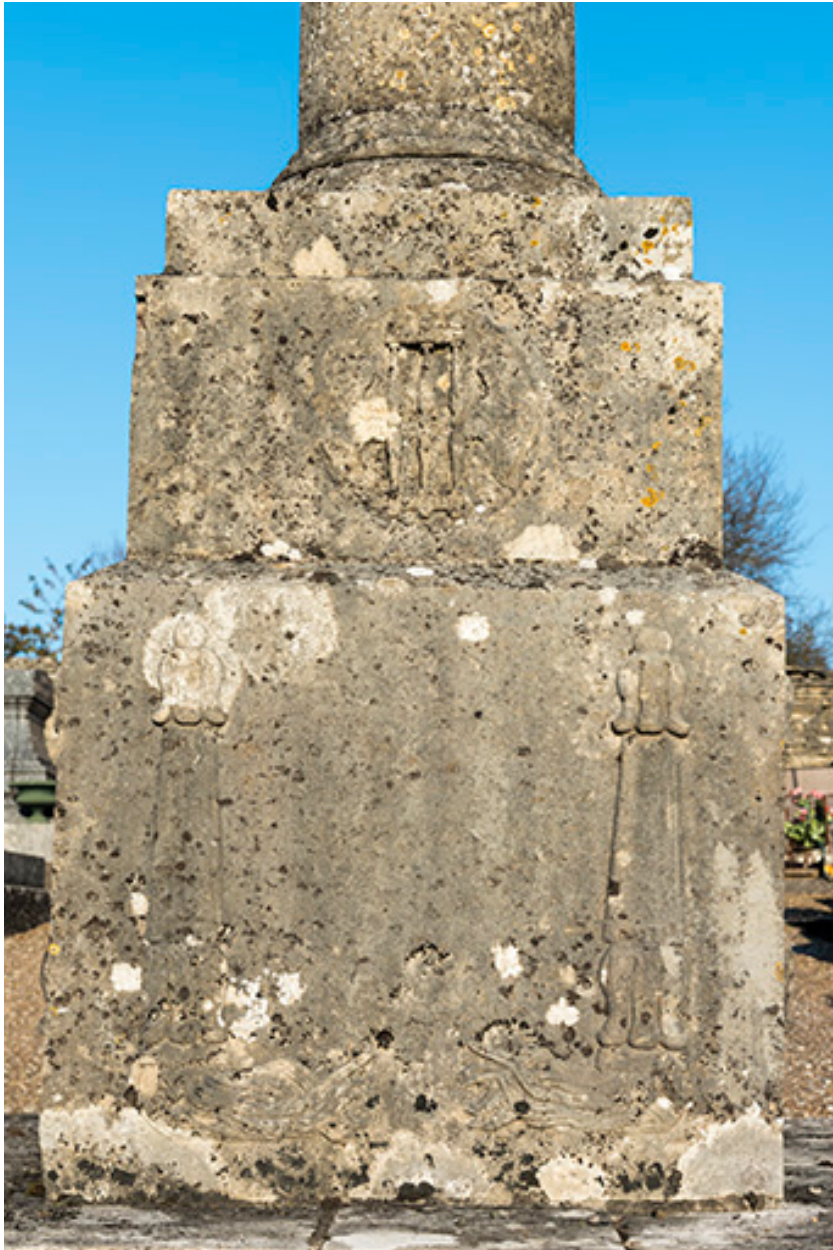
Détail de la croix du nouveau cimetière : décor du piédestal (torche renversée).