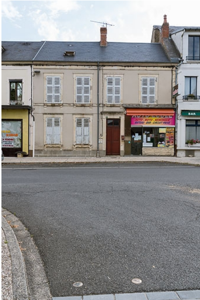
Façade, vue de face.