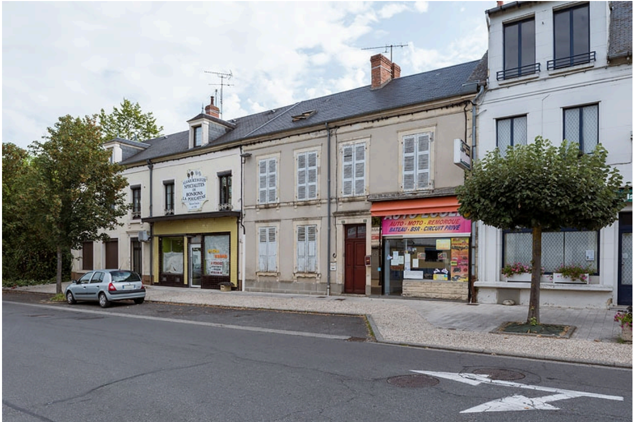
Façade, vue de trois quarts.