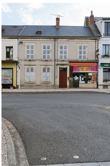
Façade, vue de face.

Phot. Pierre-Marie Barbe- Richaud, Autr. H. Quaisain, Autr. Ph. Catonné, Autr. A. Simon IVR26_20205800334NUC2A