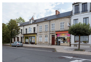
Façade, vue de trois quarts. IVR26_20205800572NUC4A