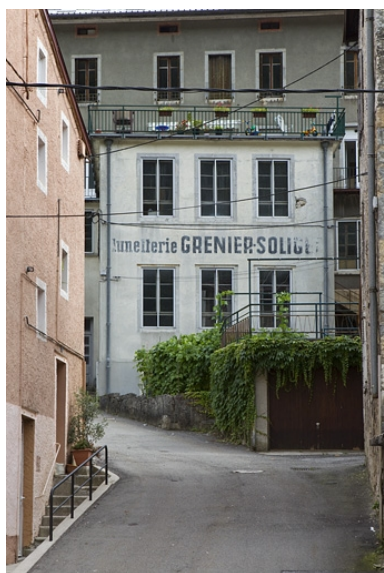
Façade postérieure sur la rue Fenandre. IVR43_20103900539NUC2A