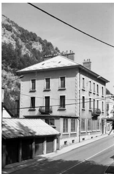
Façades antérieure et latérale gauche. IVR43_19913901463Z