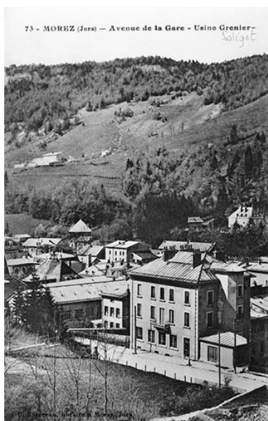
Morez (Jura) - Avenue de la Gare - Usine Grenier.