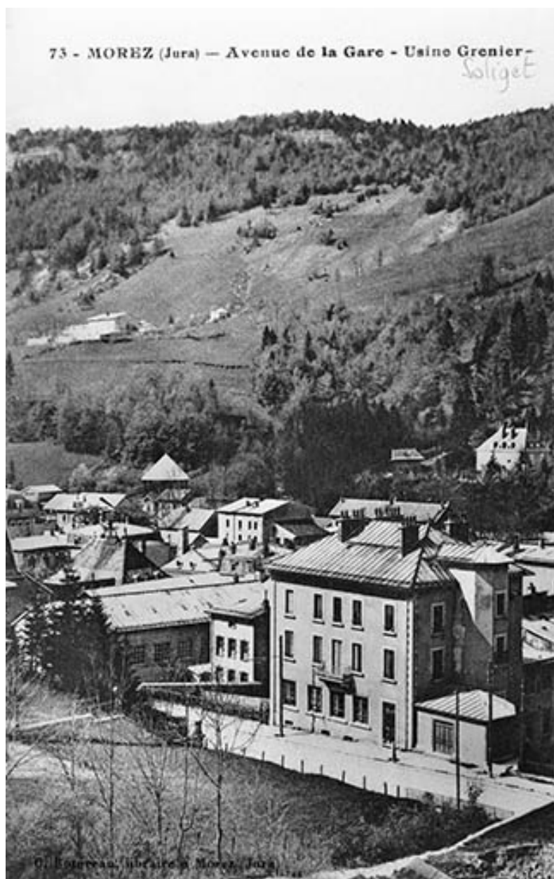
Morez (Jura) - Avenue de la Gare - Usine Grenier.