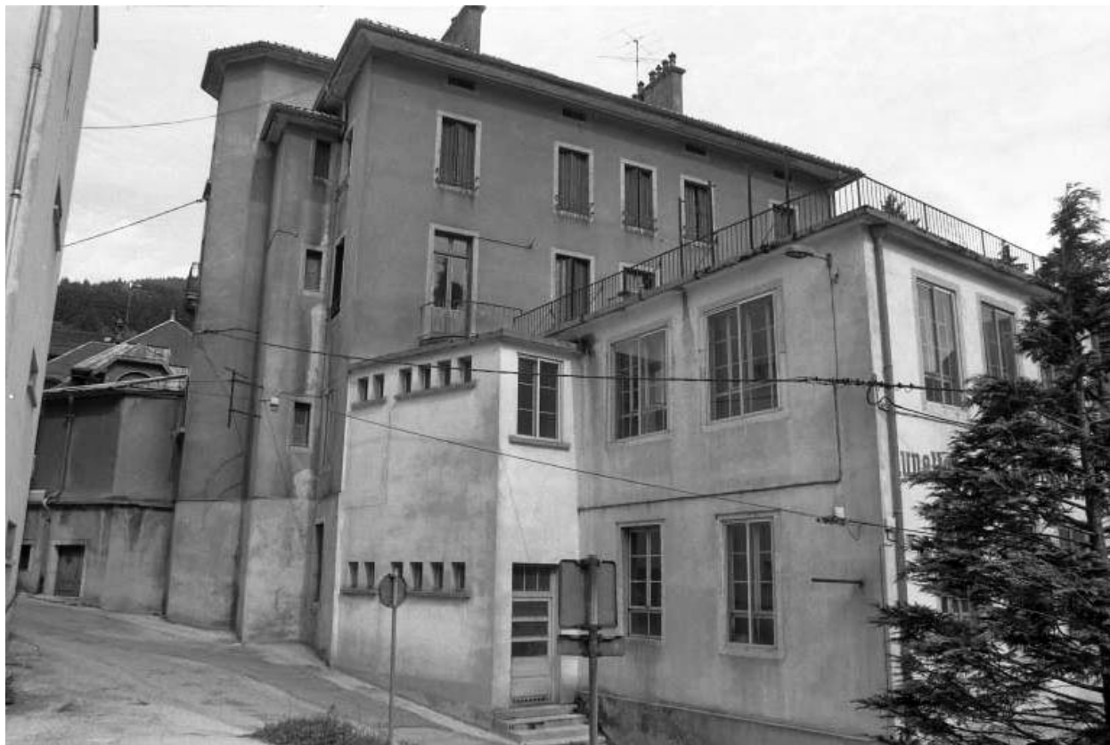
Façade postérieure et atelier sur la rue Fenandre.