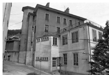
Façade postérieure et atelier sur la rue Fenandre.