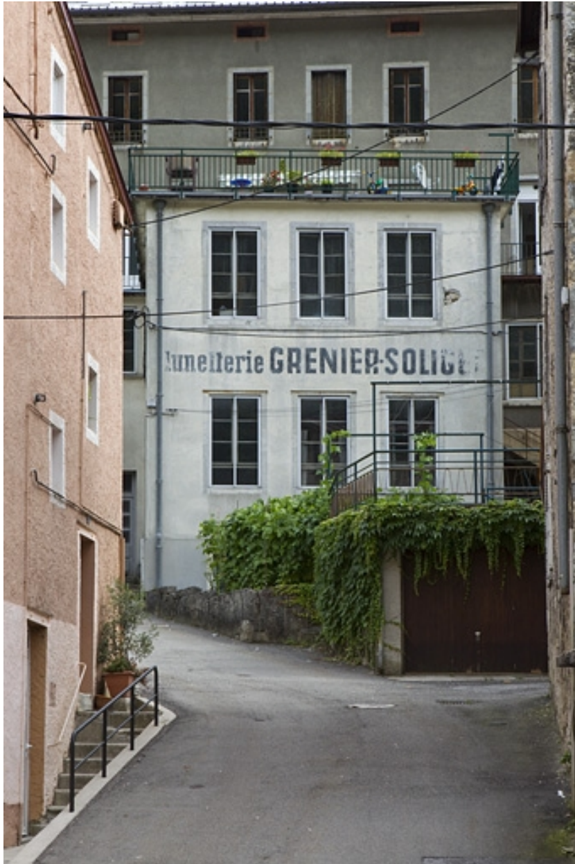
Façade postérieure sur la rue Fenandre.