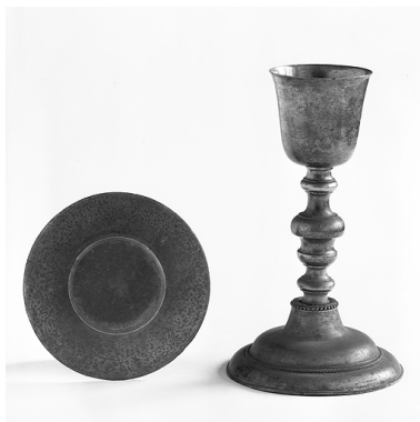
Calice et patène. IVR43_19822500436V