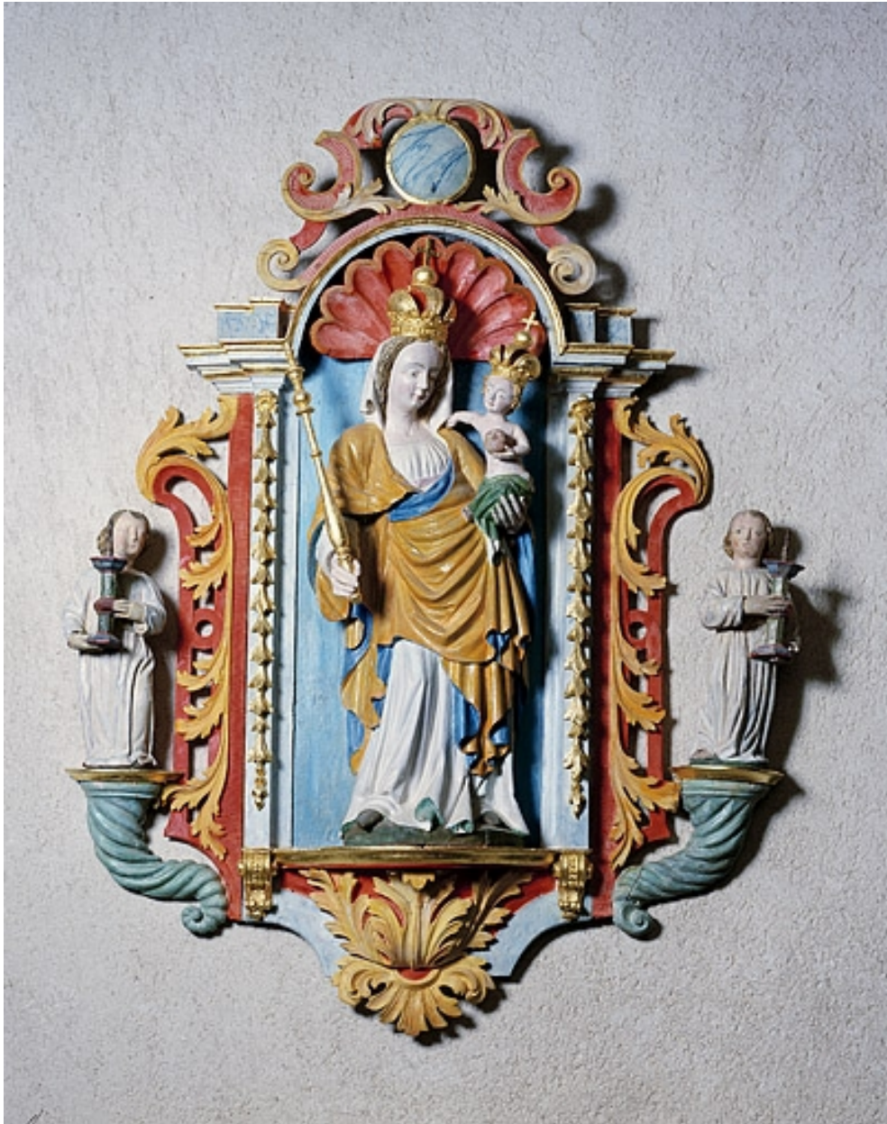
Statue de Vierge à l'Enfant.