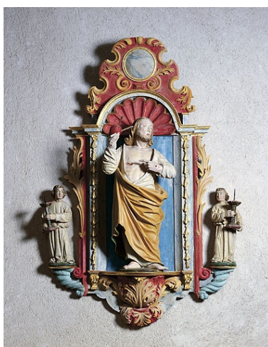
Statue du Sacré-Coeur. IVR43_19822500427VA