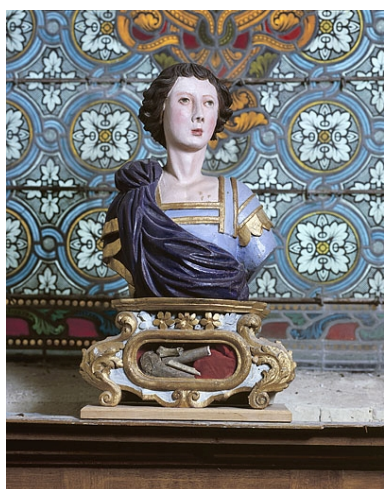
Buste-reliquaire. IVR43_19822500432VA