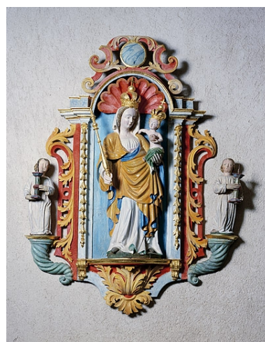
Statue de Vierge à l'Enfant. IVR43_19822500428VA