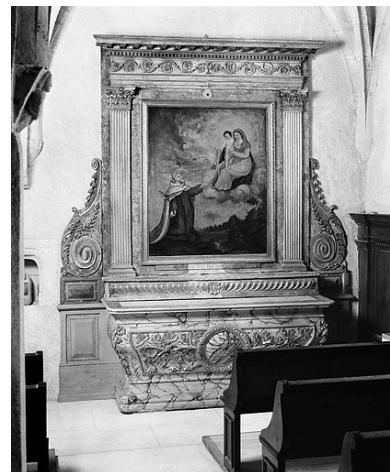
Autel secondaire nord.