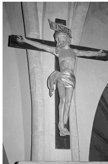
Christ en croix IVR43_19682500137Z