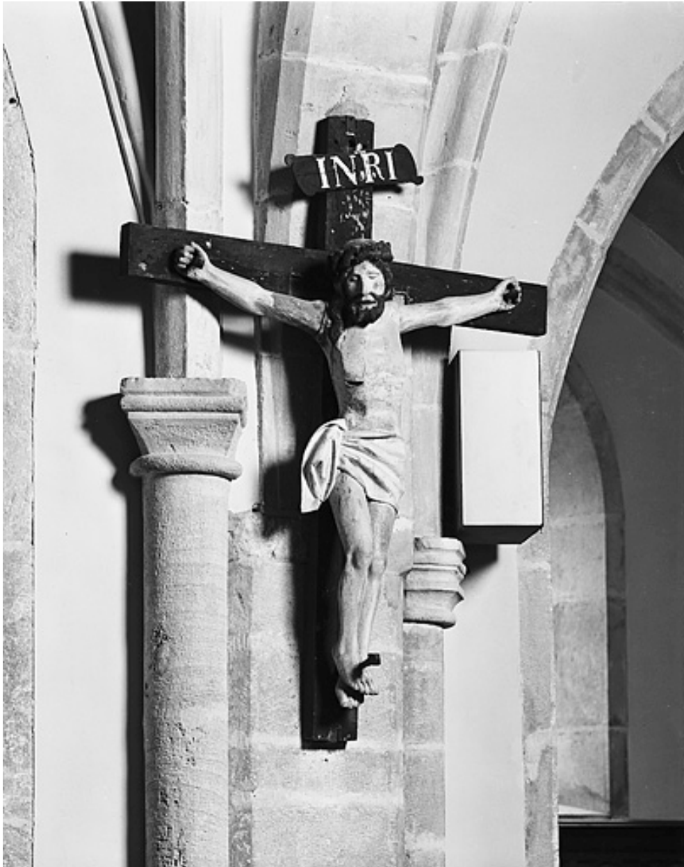
Christ en croix.