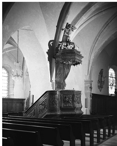
Chaire à prêcher.