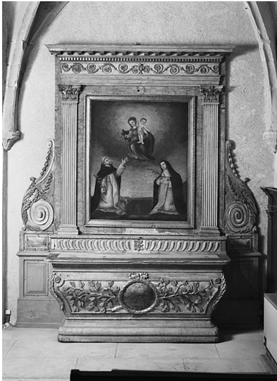
Autel secondaire sud.