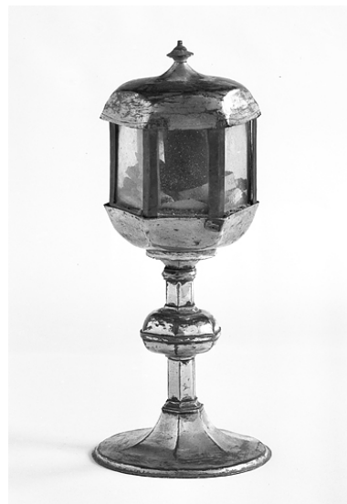
Reliquaire. IVR43_19822500434V