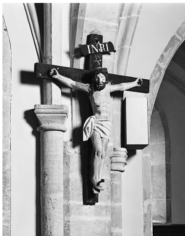
Christ en croix. IVR43_19822500431V