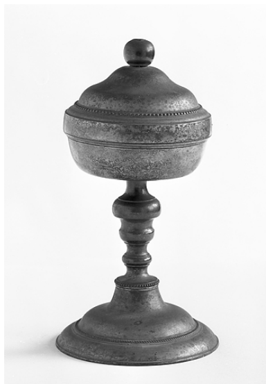
Ciboire. IVR43_19822500435V