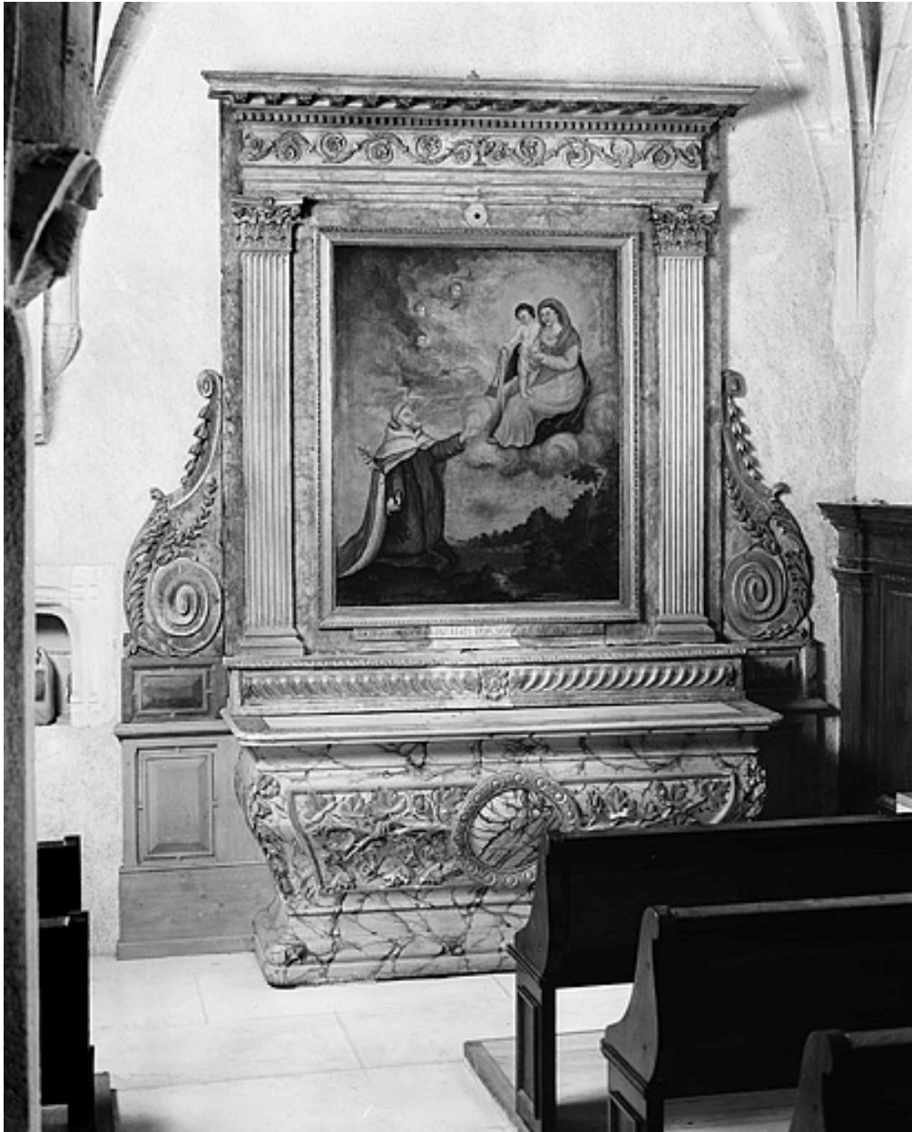
Autel secondaire nord.