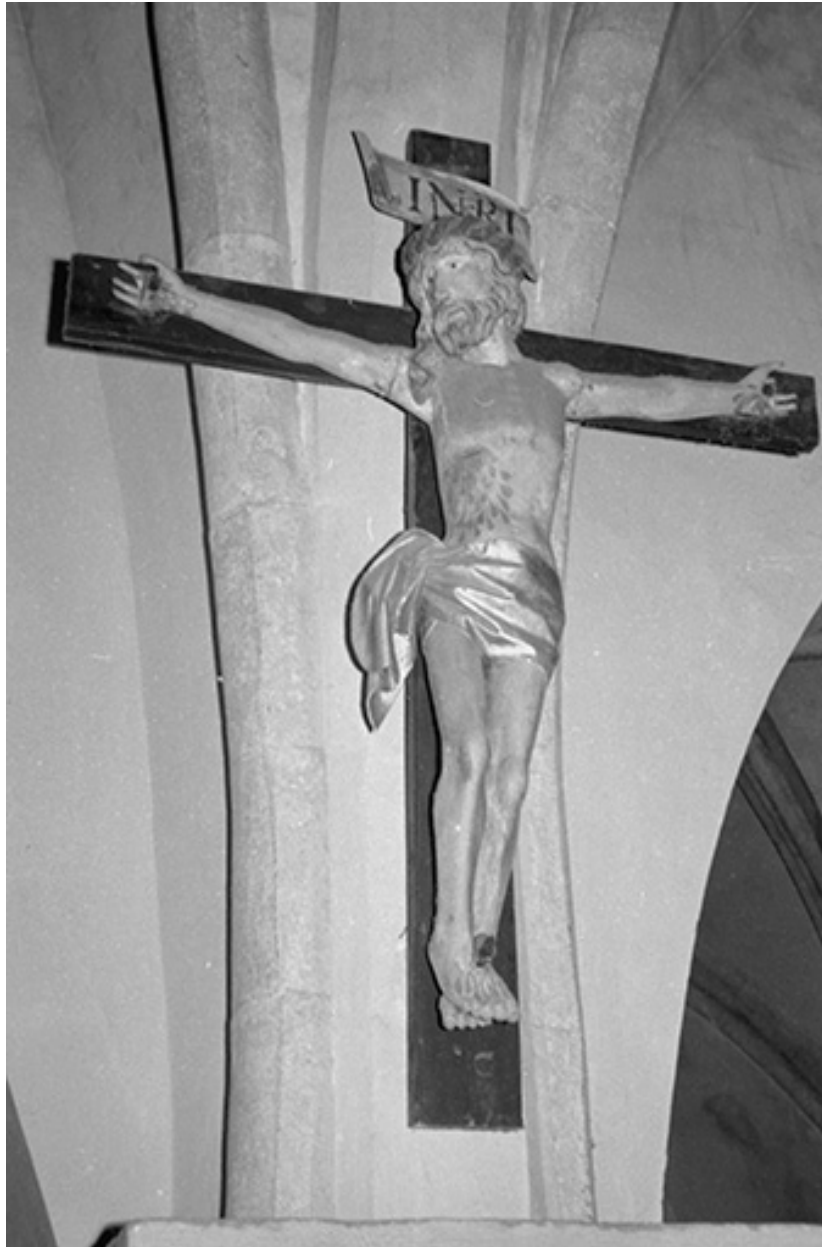
Christ en croix