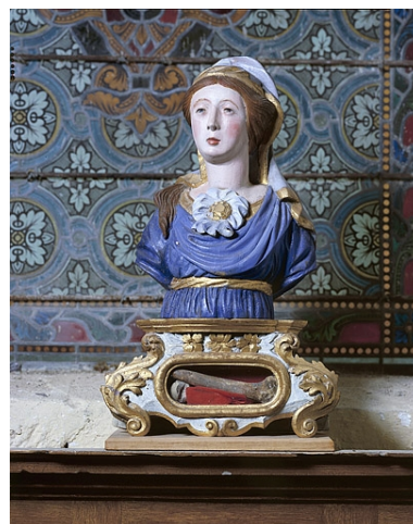
Buste-reliquaire.