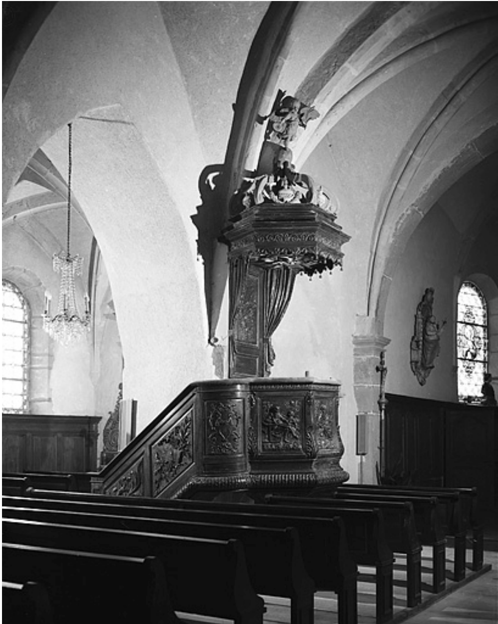
Chaire à prêcher.