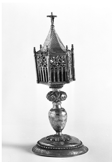
Reliquaire. IVR43_19822500437V