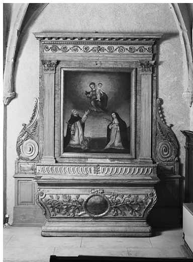
Autel secondaire sud. IVR43_19822500425V