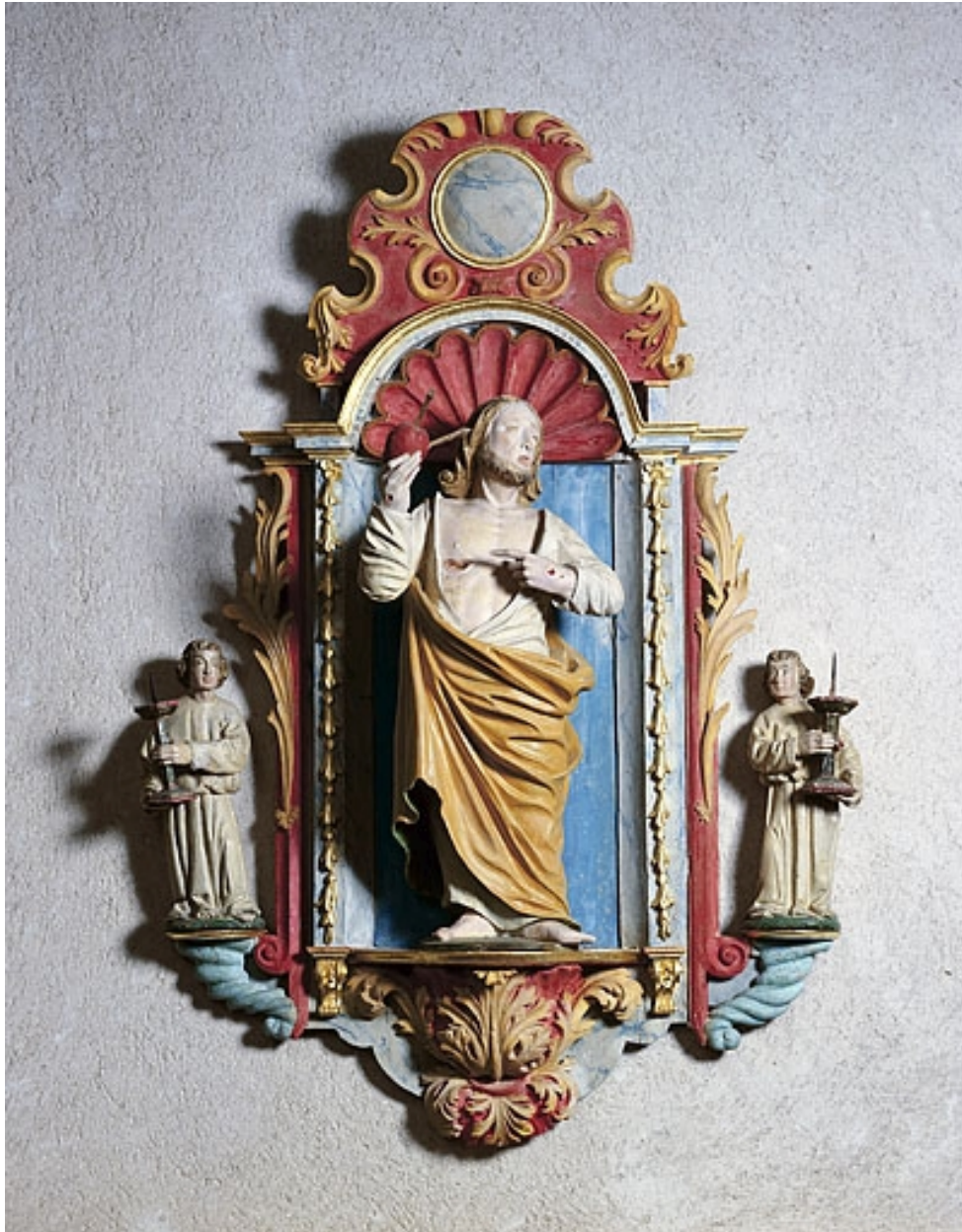
Statue du Sacré-Coeur.