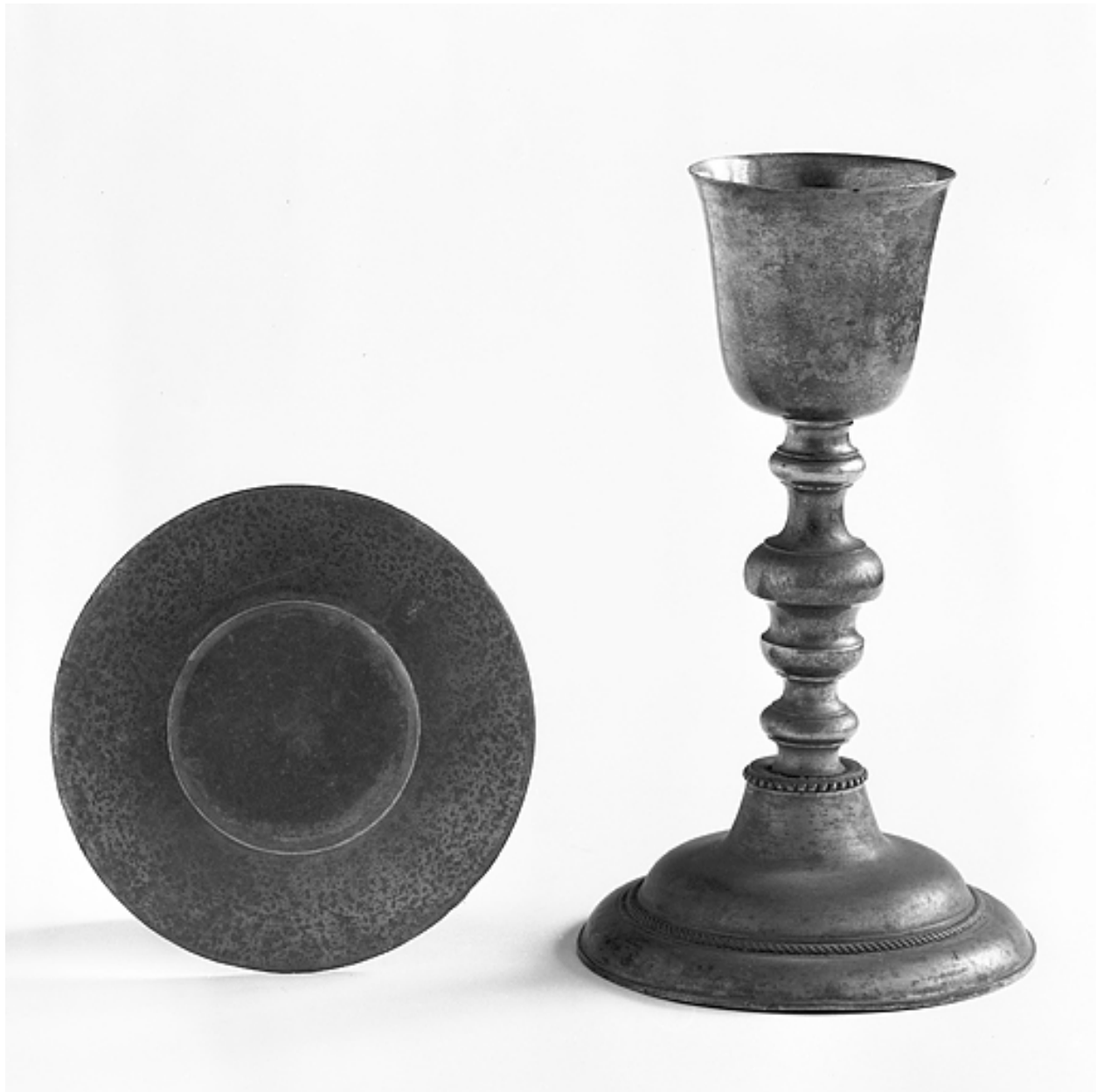
Calice et patène.