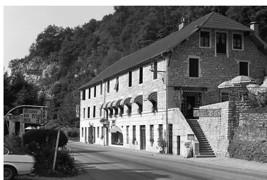
Façade antérieure de trois quarts droit. IVR43_19802500961X