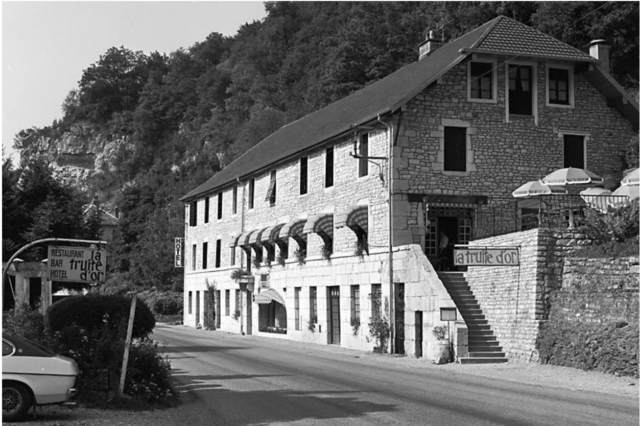
Façade antérieure de trois quarts droit.