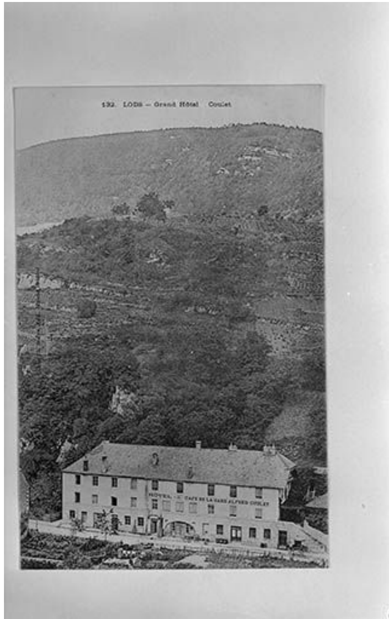
Lods. Grand Hôtel Coulet, 1er quart 20e siècle.