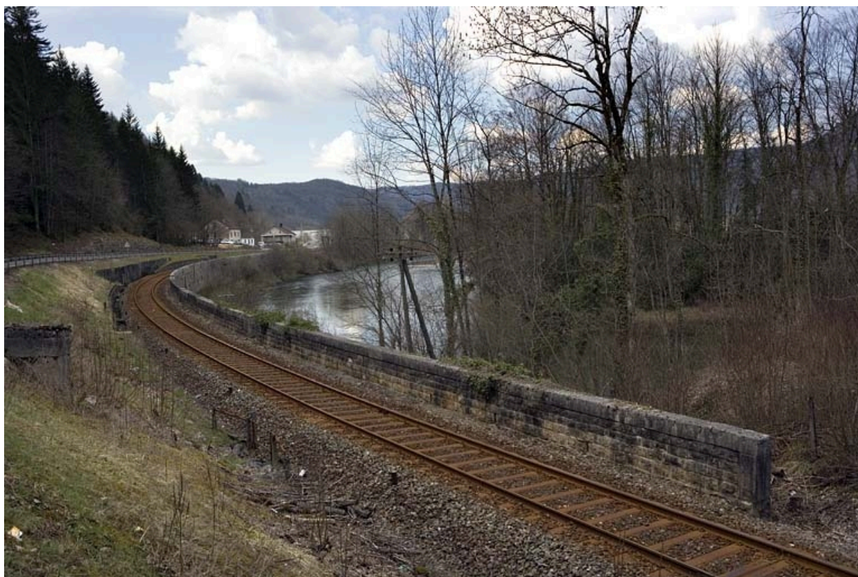
Vue d'ensemble, depuis le côté Andelot-en-Montagne.