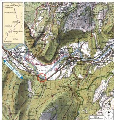
Carte et schéma de localisation. Carte topographique, IGN, 2000, dalle F086_052, échelle 1:25 000. Scan 25, licence n° 2008/CISE/2968. IVR43_20073900499NUDA