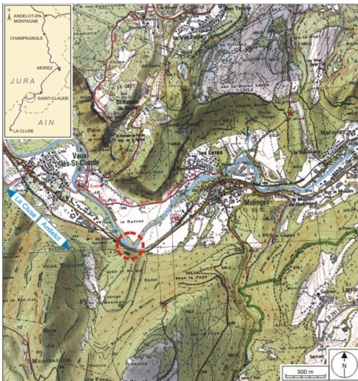
Carte et schéma de localisation. Carte topographique, IGN, 2000, dalle F086_052, échelle 1:25 000. Scan 25, licence n° 2008/CISE/2968.