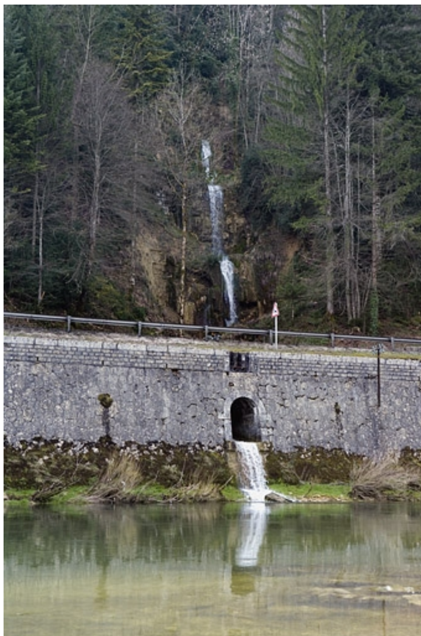
Aqueduc du ruisseau du Tournachut.