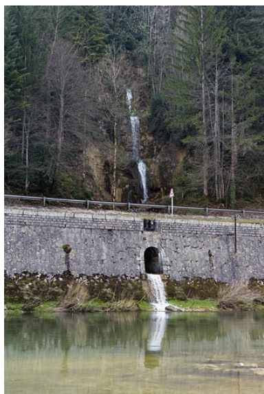
Aqueduc du ruisseau du Tournachut. IVR43_20073900141NUCA