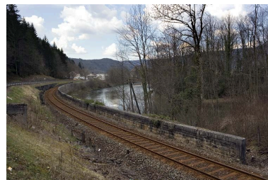
Vue d'ensemble, depuis le côté Andelot-en-Montagne. IVR43_20073900142NUCA