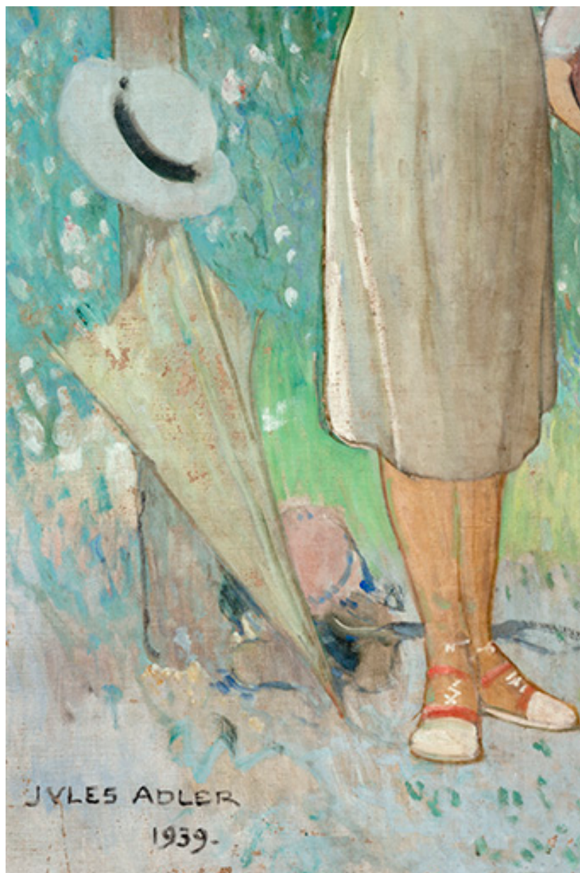
Décor du vestibule de l'établissement thermal de Luxeuil-les-Bains, détail.