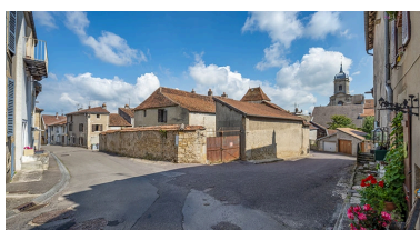
Angle sud-ouest de la maison, à l'angle des rues Patet-Traverse et Patet-Tournante.