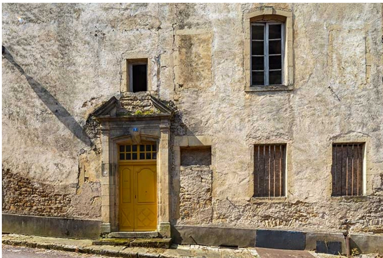
Détail de la façade orientale et de la porte située à la base de la tour.