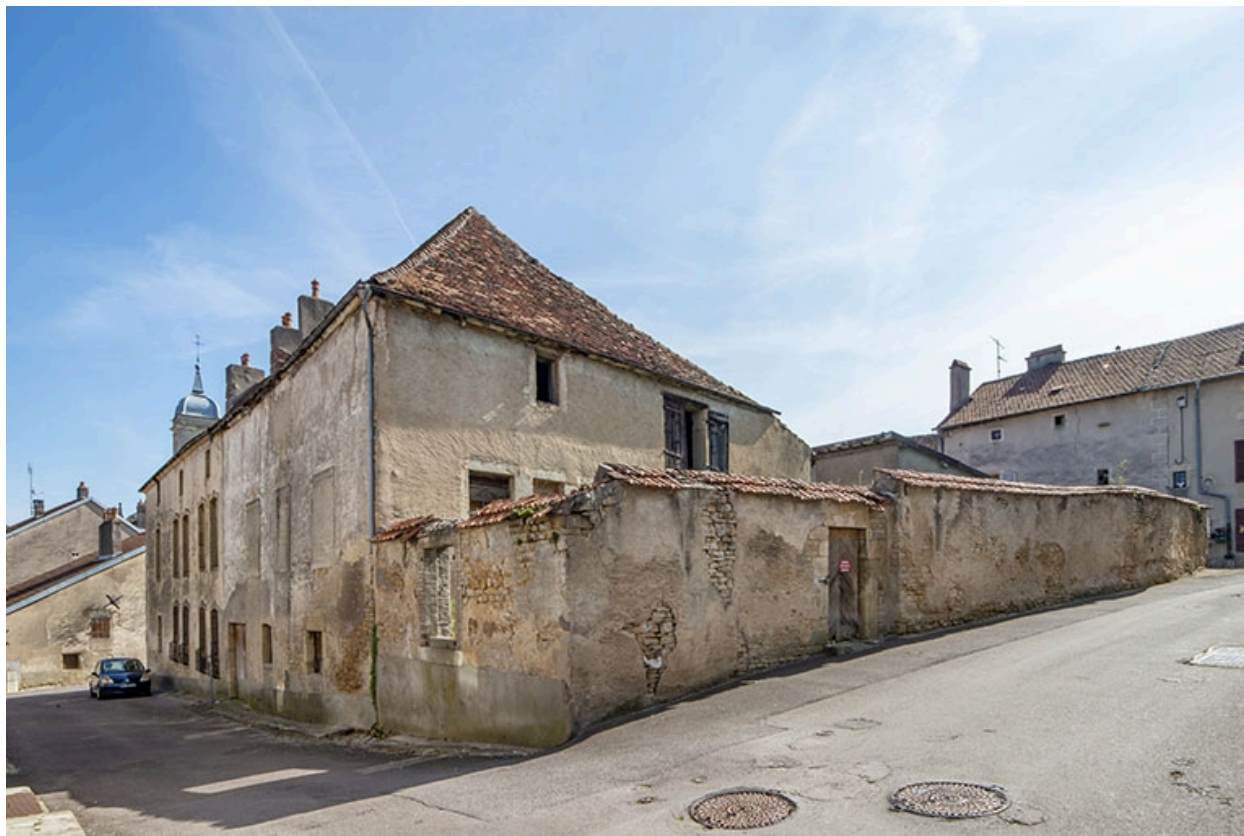
Angle nord-ouest de la maison, à l'angle des rues Patet-Traverse et Général-Etienne.