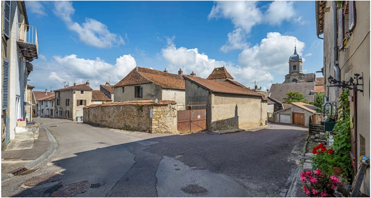
Angle sud-ouest de la maison, à l'angle des rues Patet-Traverse et Patet-Tournante.