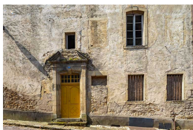
Détail de la façade orientale et de la porte située à la base de la tour. IVR43_20217000550NUC4A