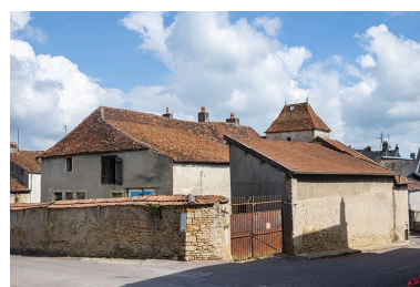
Vue rapprochée de l'angle sud-ouest de la maison, à l'angle des rues Patet-Traverse et Patet-Tournante. IVR43_20217000552NUC4A