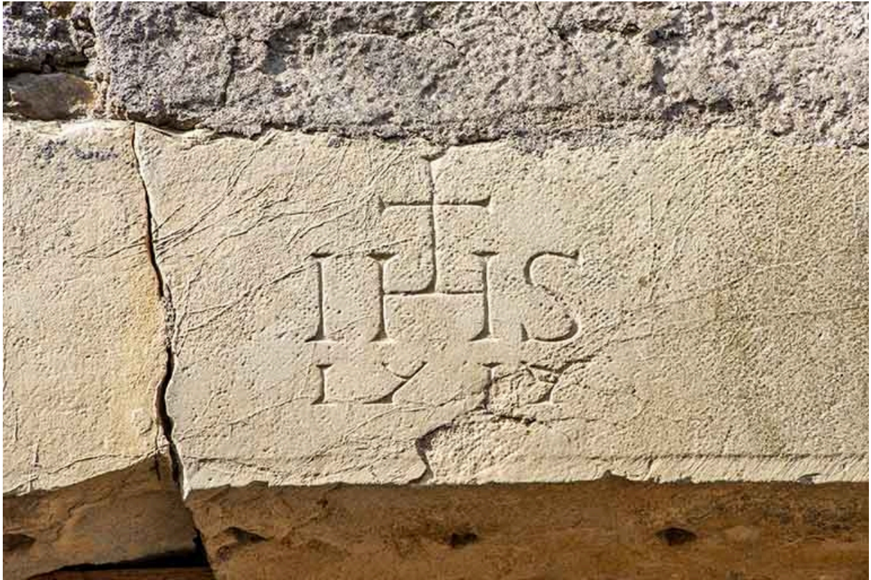
Christogramme et date portée sur le linteau jouxtant la porte d'entrée (1717).