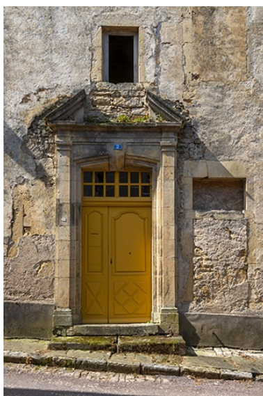
La porte au pied de la tour, rue Patet-Tournante.