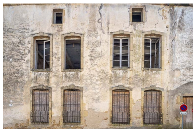
Le corps de logis sur la rue du Général-Etienne.