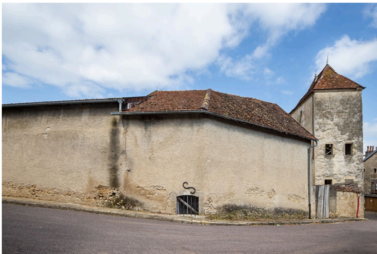
Le mur côté sud et la tour depuis le sud.