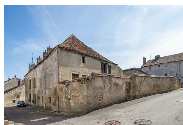
Angle nord-ouest de la maison, à l'angle des rues Patet-Traverse et Général-Etienne.