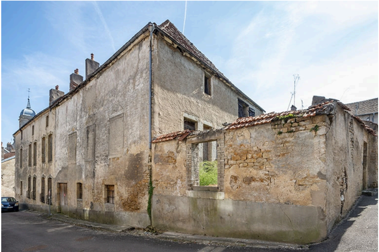
La façade sur la rue du Général-Etienne, de biais.