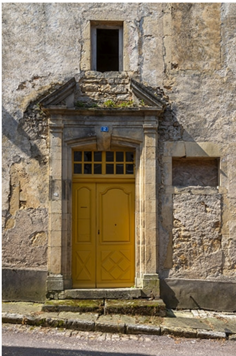
La porte au pied de la tour, rue Patet-Tournante.