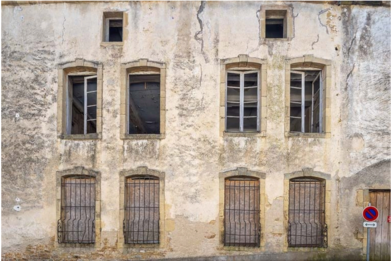
Le corps de logis sur la rue du Général-Etienne.