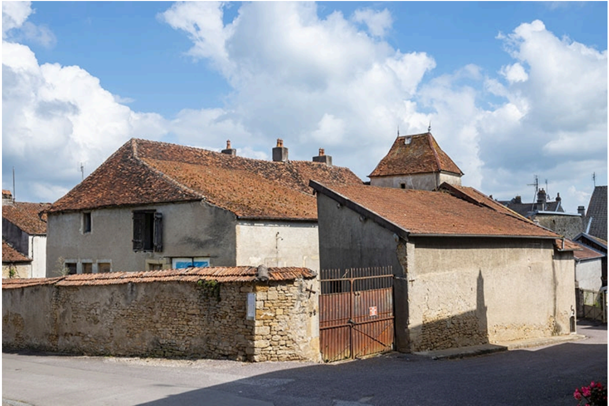
Vue rapprochée de l'angle sud-ouest de la maison, à l'angle des rues Patet-Traverse et Patet-Tournante.