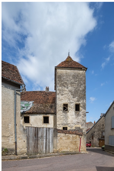
La face sud de la tour.