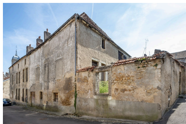
La façade sur la rue du Général-Etienne, de biais. IVR43_20217000556NUC4A