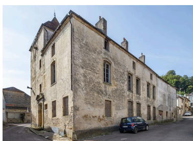
Angle nord-est de la maison. IVR43_20217000554NUC4A