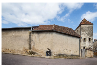
Le mur côté sud et la tour depuis le sud. IVR43_20217000547NUC4A