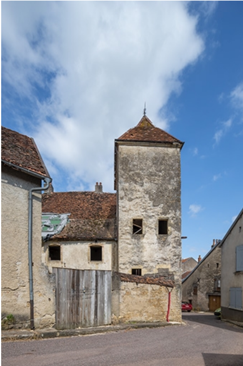
La face sud de la tour.