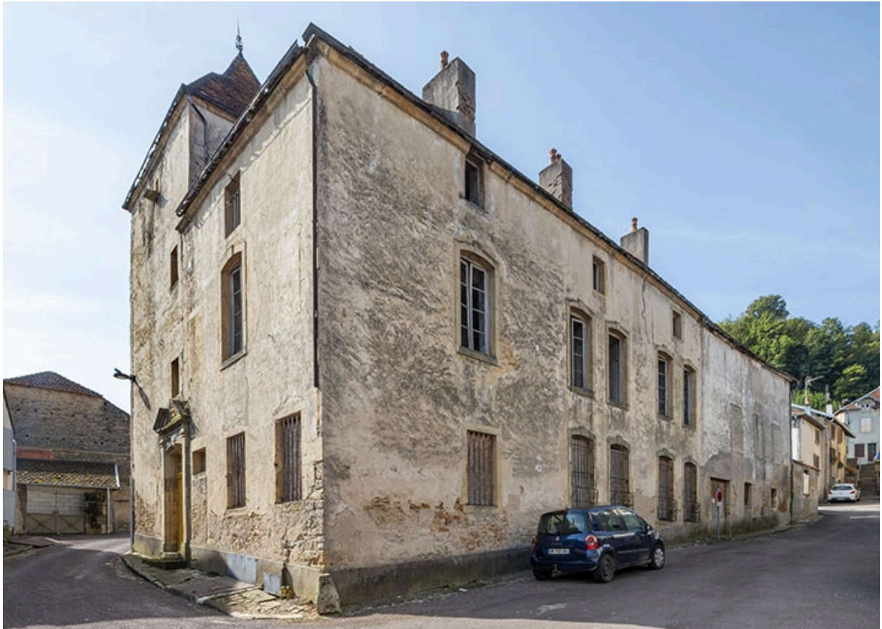
Angle nord-est de la maison.