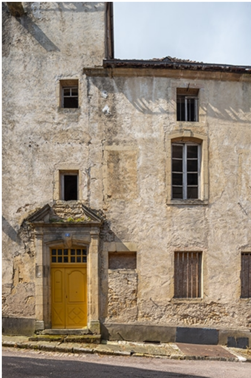
Détail de la façade orientale et de la porte située à la base de la tour.