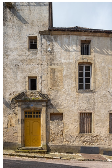
Détail de la façade orientale et de la porte située à la base de la tour.