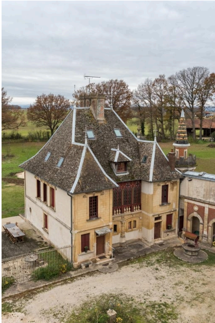
Vue plongeante depuis le "Donjon".