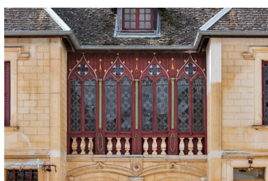
Elévation antérieure : galerie à l'étage. IVR26_20222100917NUC4A