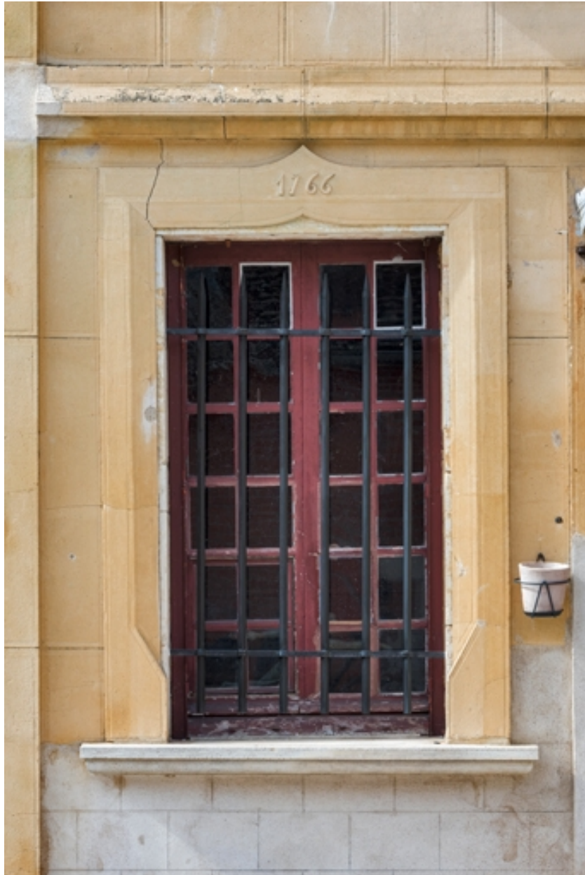
Elévation antérieure : fenêtre portant la date 1766.