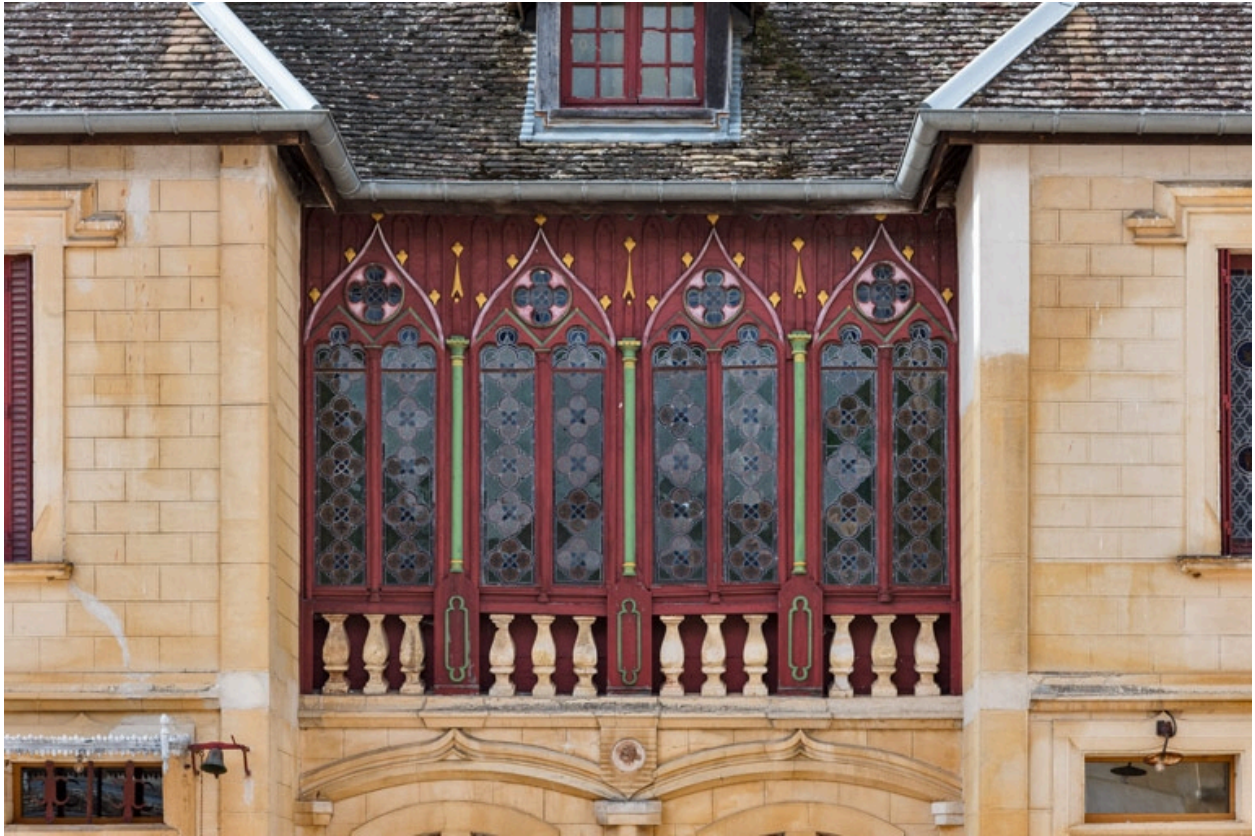
Elévation antérieure : galerie à l'étage.