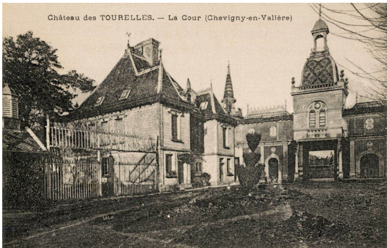
Château des Tourelles. - La Cour (Chevigny-en-Valière). S.d. [1re moitié 20e siècle].