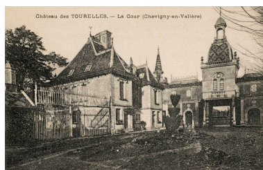
Château des Tourelles. - La Cour (Chevigny-en-Valière). S.d. [1re moitié 20e siècle]. Autr. auteur inconnu IVR26_20222100099NUC4A