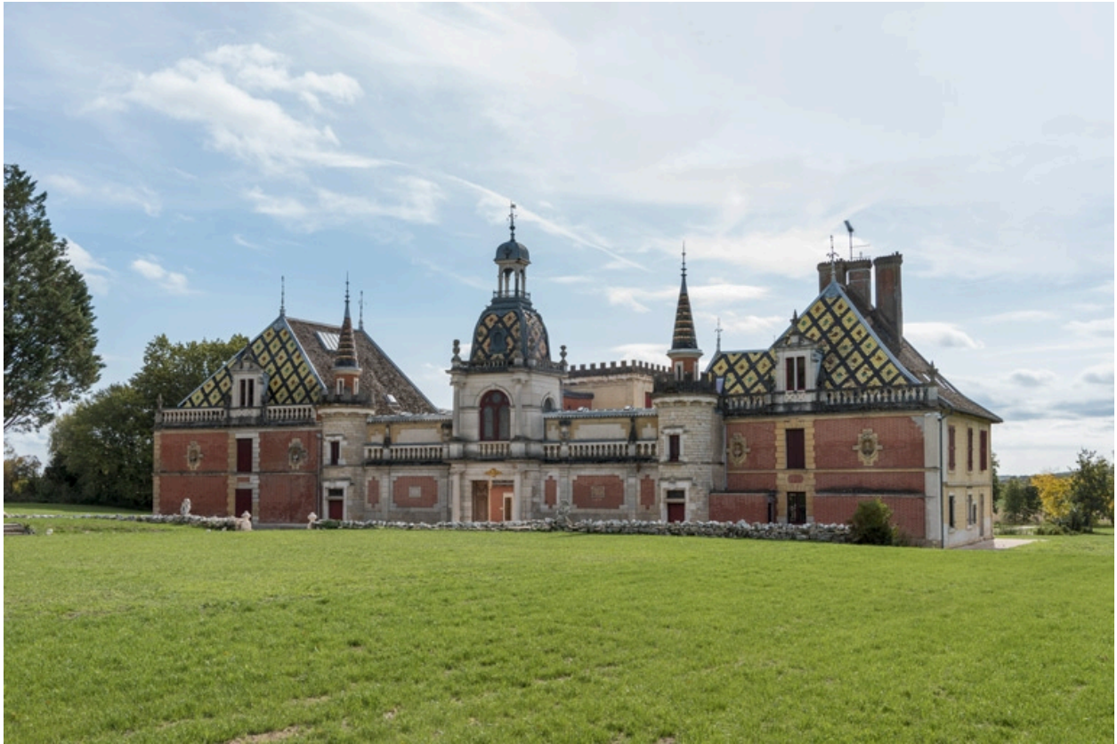
Vue d'ensemble, depuis le nord-ouest.