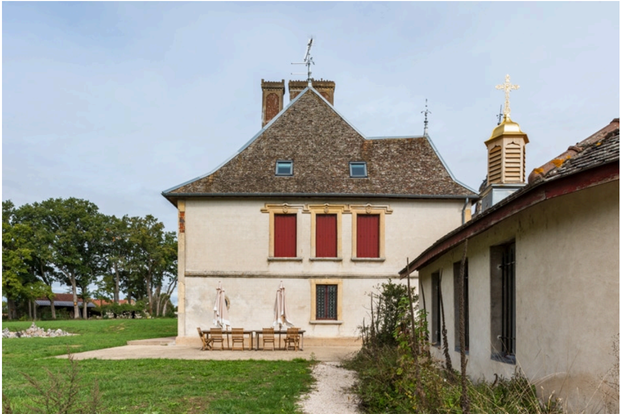
Elévation latérale gauche (sud).