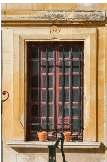
Elévation antérieure : fenêtre portant la date 1767.