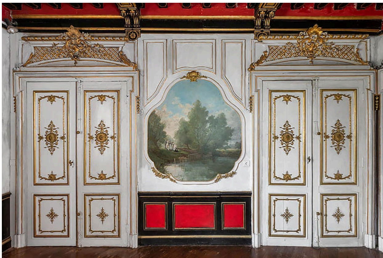
Salon : portes provenant de l'ambassade de Russie, rue du Faubourg Saint-Honoré à Paris.