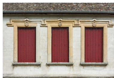
Elévation latérale gauche : baies de l'étage.