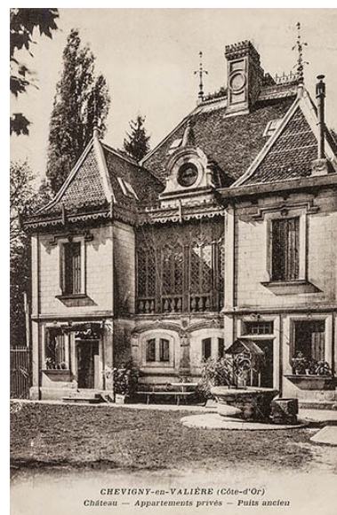
Chevigny-en-Valière (Côte- d'Or). Château - Appartements privés - Puits ancien. S.d. [1re moitié 20e siècle, avant 1942]. IVR26_20222100103NUC4A