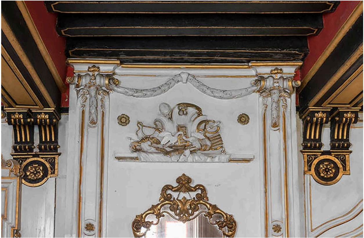
Salon : décor du trumeau de cheminée.