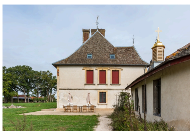
Elévation latérale gauche (sud). IVR26_20222100899NUC4A