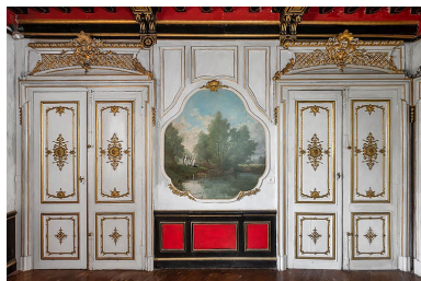
Salon : portes provenant de l'ambassade de Russie, rue du Faubourg Saint-Honoré à Paris. IVR26_20222100136NUC4A