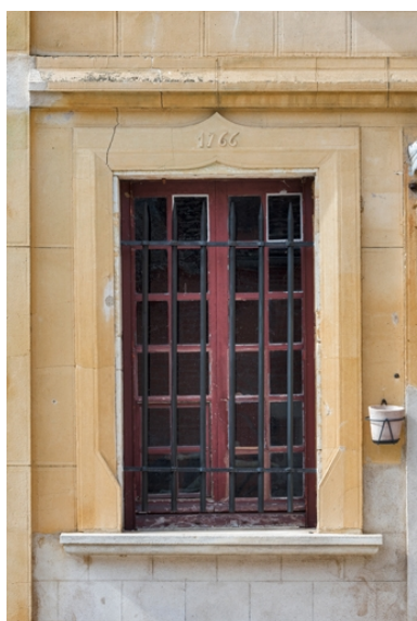
Elévation antérieure : fenêtre portant la date 1766. IVR26_20222100909NUC4A