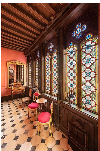
Galerie à l'étage.