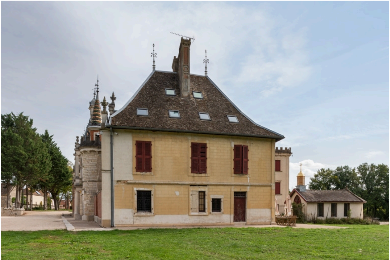
Elévation postérieure (ouest).