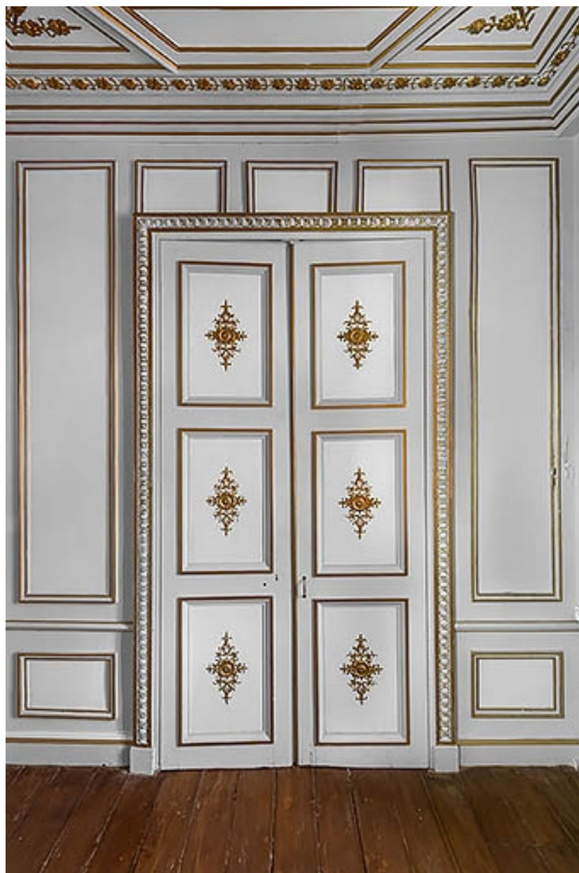
Bureau à l'étage : porte du palais des Tuileries, à Paris.