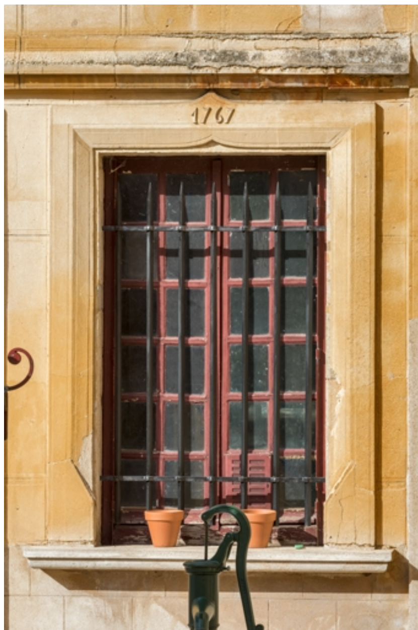
Elévation antérieure : fenêtre portant la date 1767.