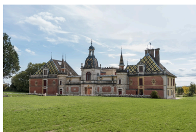
Vue d'ensemble, depuis le nord-ouest. IVR26_20222100905NUC4A