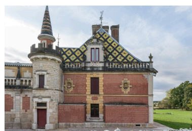
Elévation latérale droite (nord). IVR26_20222100882NUC4A