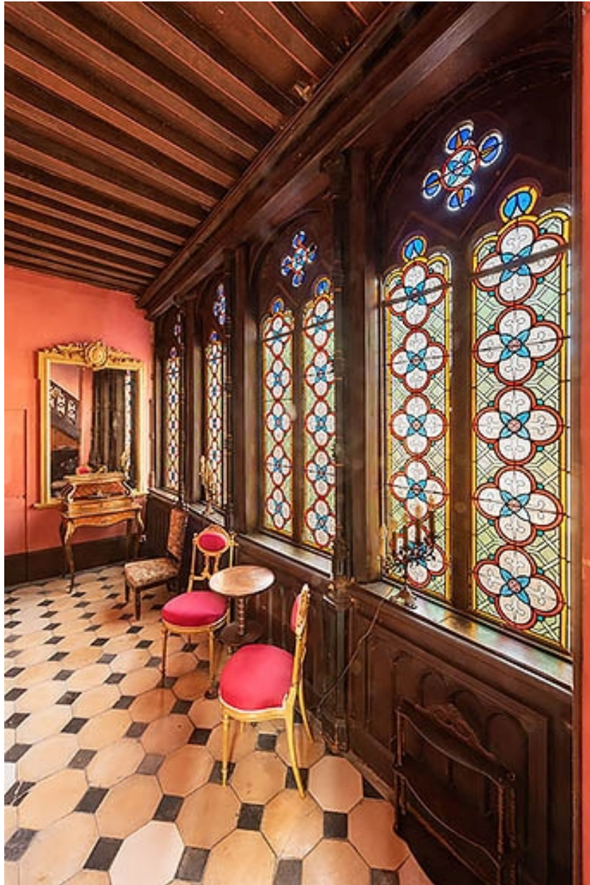
Galerie à l'étage.