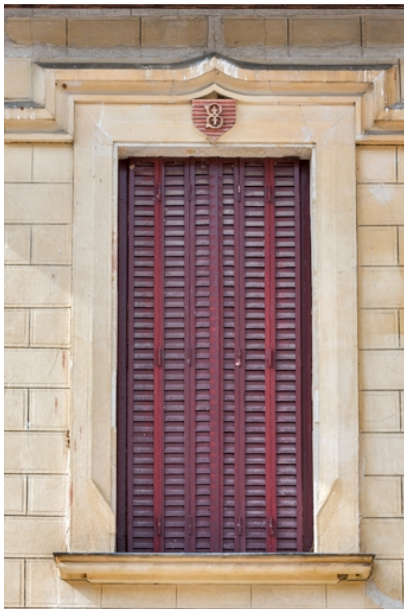
Elévation antérieure : fenêtre à l'étage avec la lettre B.