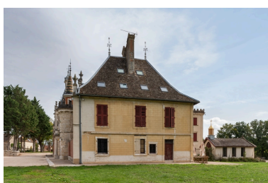
Elévation postérieure (ouest). IVR26_20222100900NUC4A