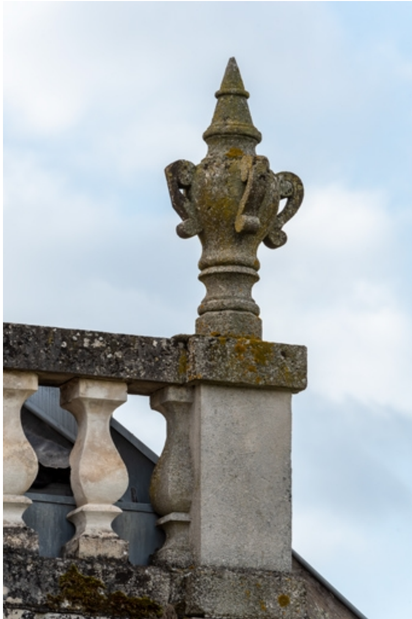
Elévation latérale droite : motif d'amortissement.