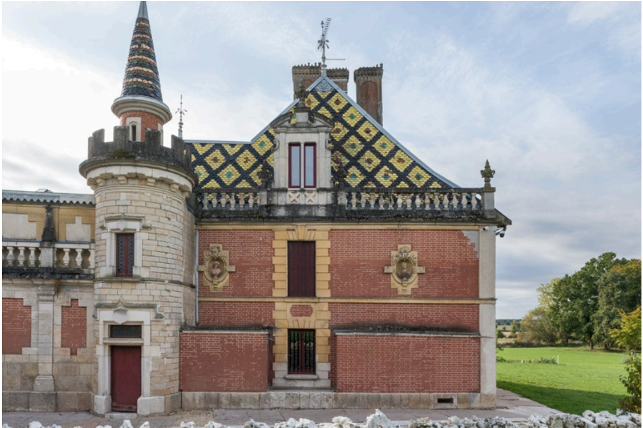
Elévation latérale droite (nord).