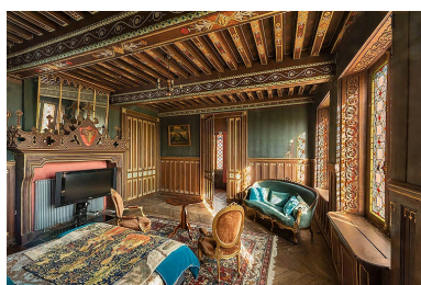
Salle à manger de l'étage (actuellement chambre à coucher), à décor d'inspiration gothique. IVR26_20222100132NUC4A