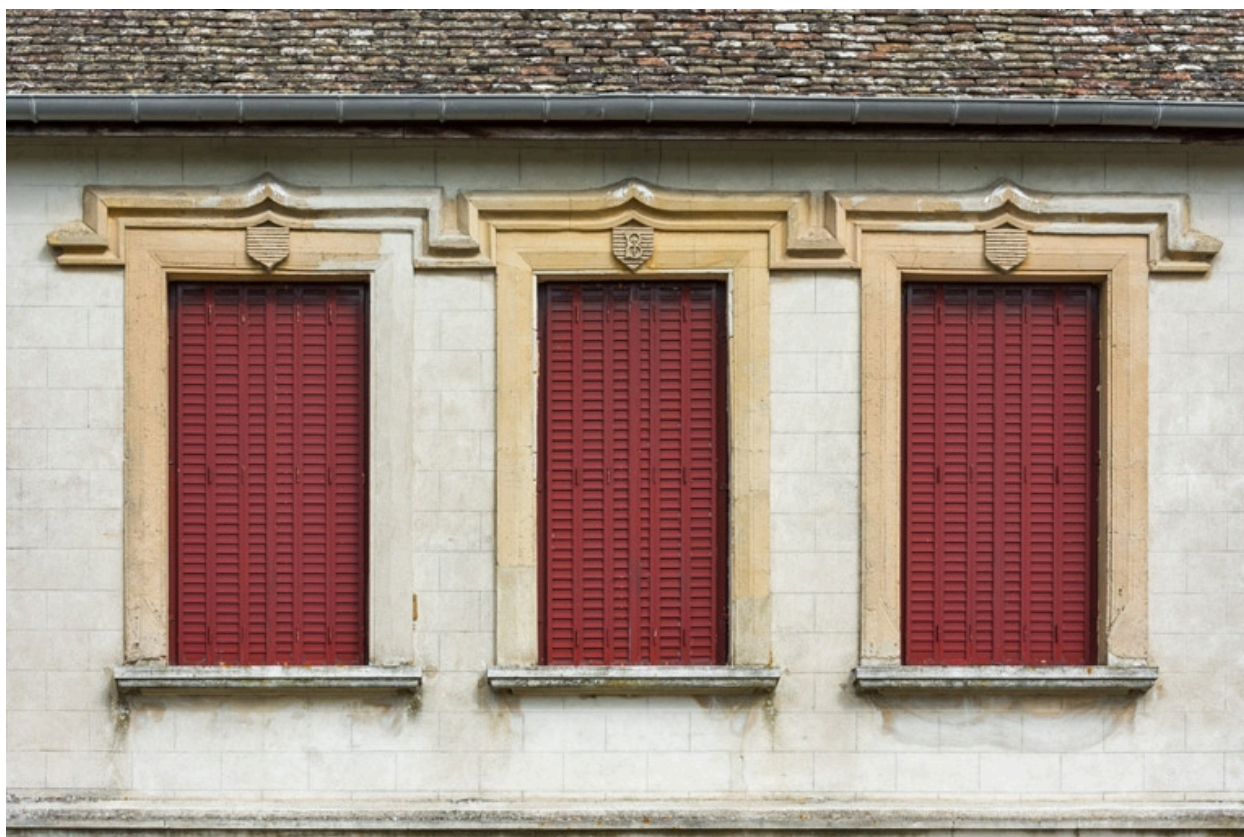
Elévation latérale gauche : baies de l'étage.