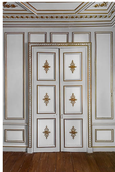
Bureau à l'étage : porte du palais des Tuileries, à Paris. IVR26_20222100147NUC4A