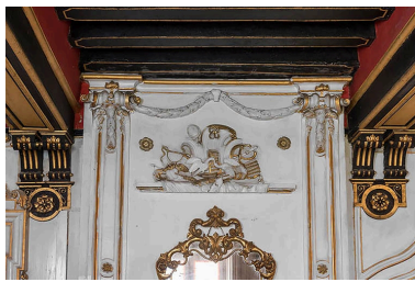
Salon : décor du trumeau de cheminée. IVR26_20222100138NUC4A