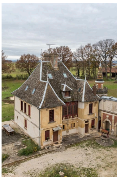
Vue plongeante depuis le "Donjon".