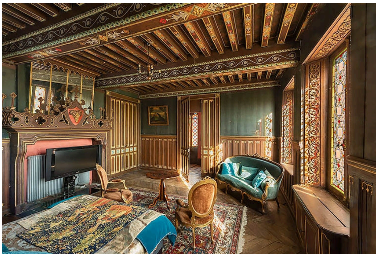
Salle à manger de l'étage (actuellement chambre à coucher), à décor d'inspiration gothique.