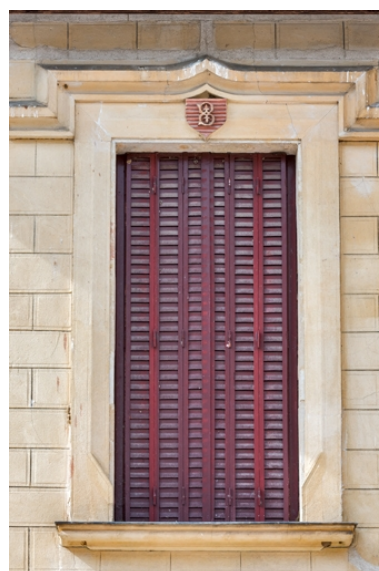
Elévation antérieure : fenêtre à l'étage avec la lettre B.