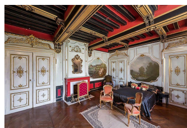
Salon à l'étage (actuellement chambre à coucher). IVR26_20222100135NUC4A