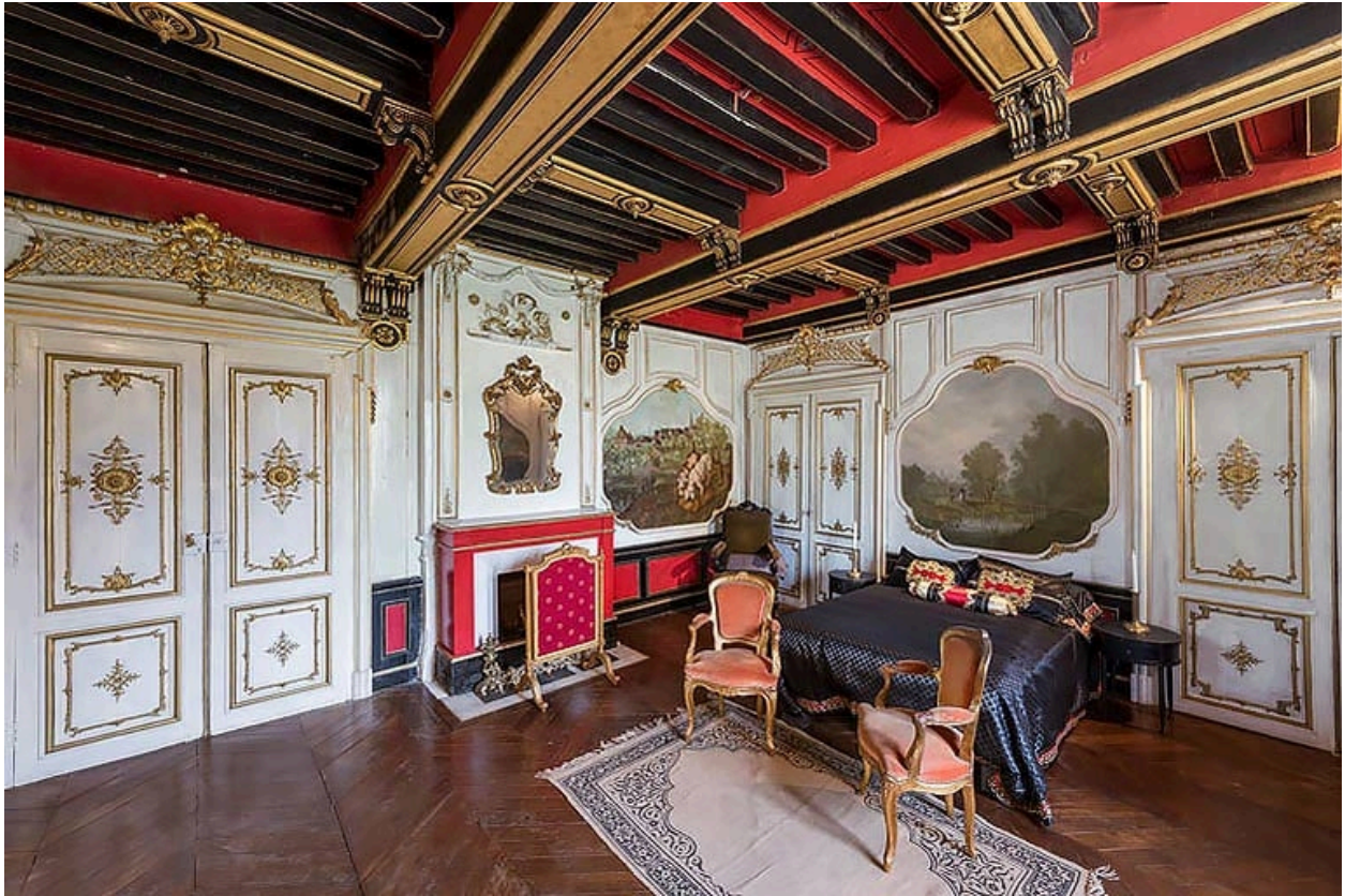
Salon à l'étage (actuellement chambre à coucher).