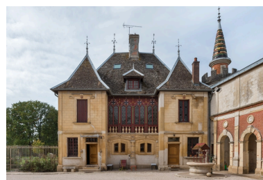
Elévation antérieure (est).