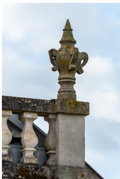
Elévation latérale droite : motif d'amortissement. IVR26_20222100869NUC4A