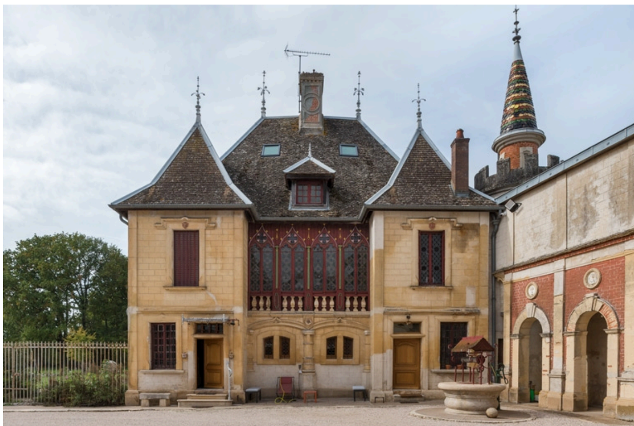
Elévation antérieure (est).