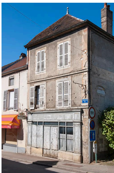
Vue sud-ouest IVR43_20137000455NUCA