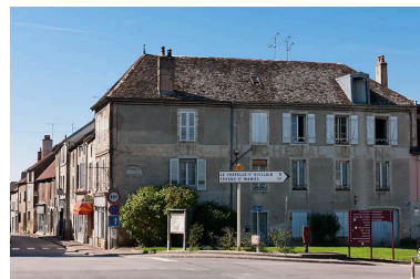
Vue ouest de l'ancien hôtel du Cheval Blanc IVR43_20137000457NUCA