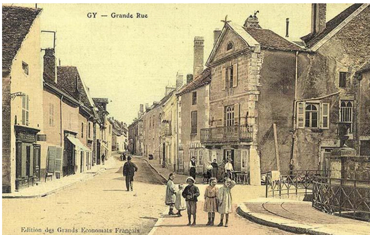
La Grande Rue sur une carte postale ancienne