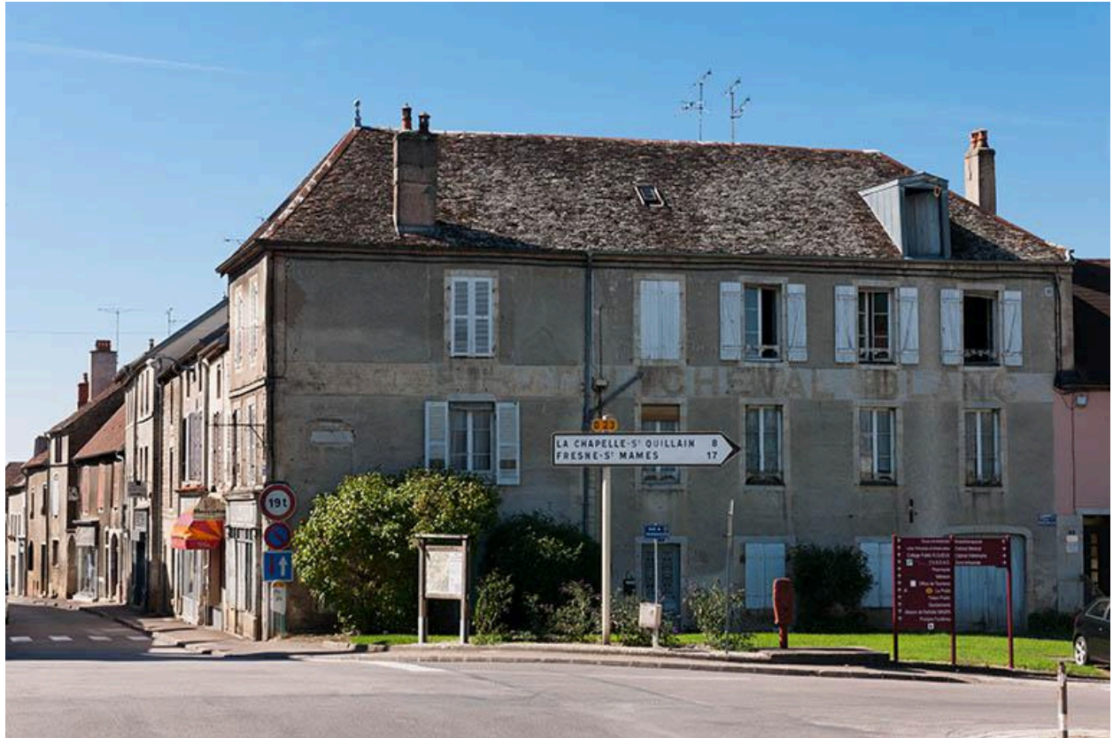
Vue ouest de l'ancien hôtel du Cheval Blanc