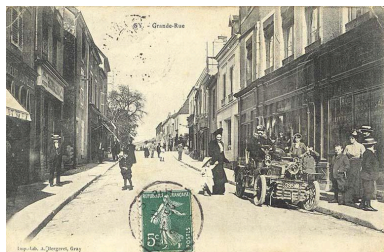
La Grande Rue au début du 20e siècle