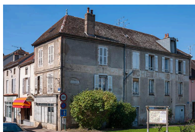
Ancien hôtel du Cheval Blanc