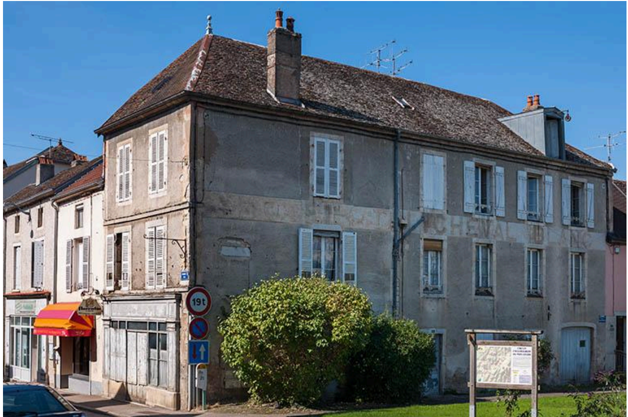
Ancien hôtel du Cheval Blanc