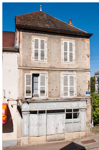
Façade sud IVR43_20137000456NUCA