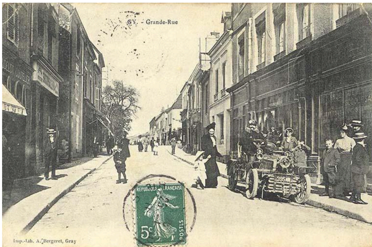
La Grande Rue au début du 20e siècle