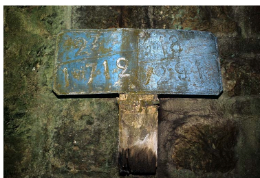
Vue d'ensemble.