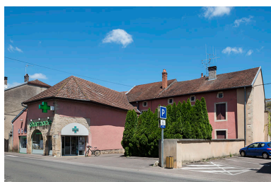
Élévation sur la rue Armand Paulmard. IVR43_20187000409NUC4A