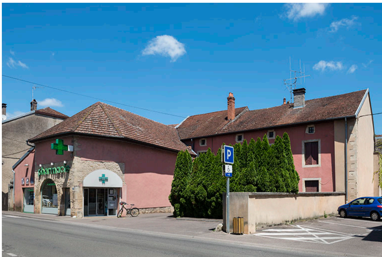
Élévation sur la rue Armand Paulmard.