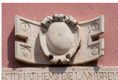
Linteau et relief sculptés datés de 1567.