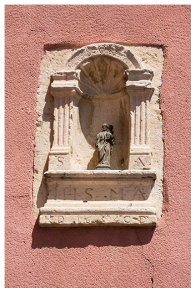
Niche sculptée datée de 1682.