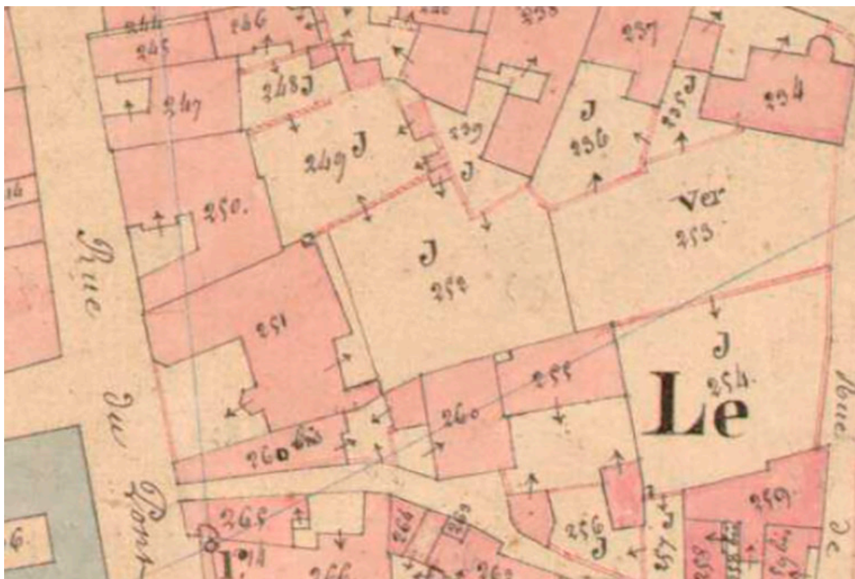
Plan de situation en 1836.