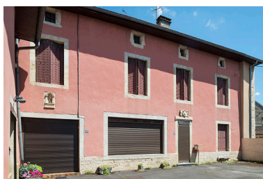
Élévation sur la cour. IVR43_20187000410NUC4A