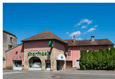
Élévation sur la rue Armand Paulmard. IVR43_20187000415NUC4A