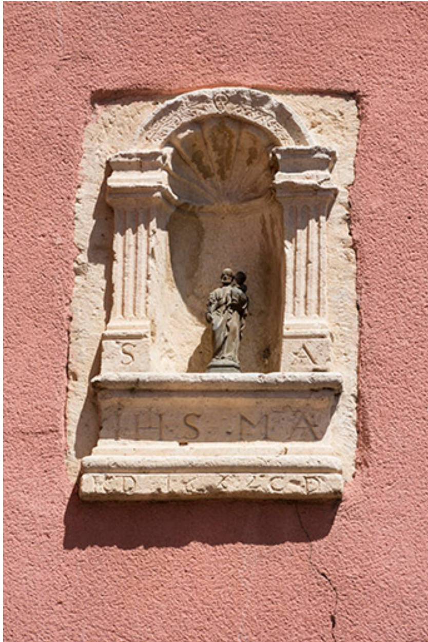
Niche sculptée datée de 1682.