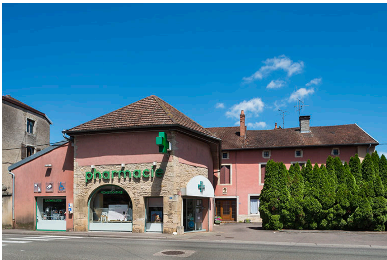
Élévation sur la rue Armand Paulmard.