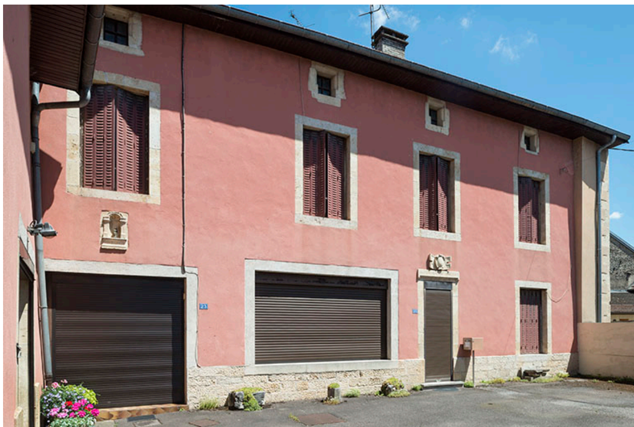
Élévation sur la cour.