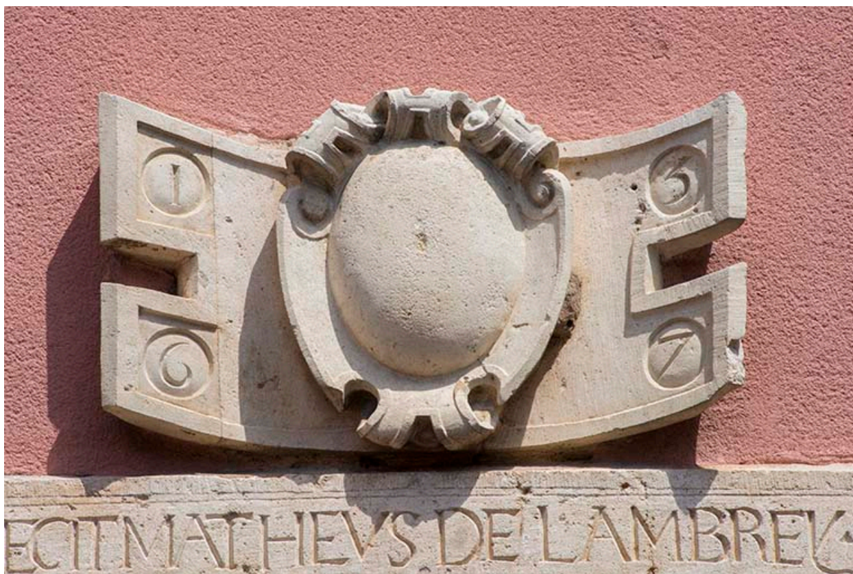
Linteau et relief sculptés datés de 1567.