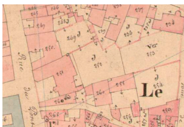
Plan de situation en 1836. IVR43_20187000836NUCA