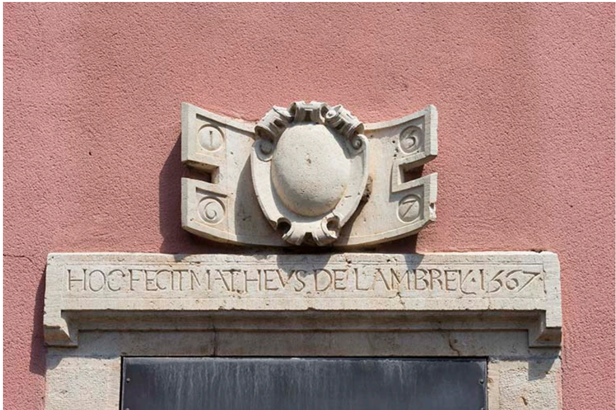
Linteau et relief sculptés datés de 1567.