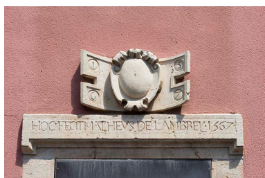
Linteau et relief sculptés datés de 1567.