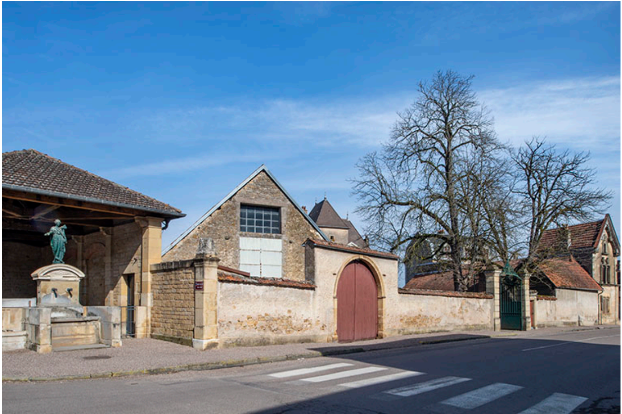
La rue avec le lavoir et les n° 27 et 29.