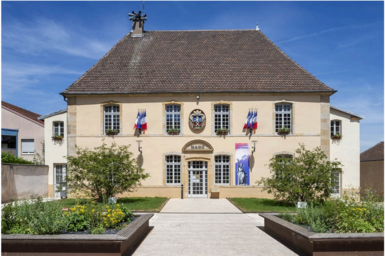
La façade de l'hôtel de ville.