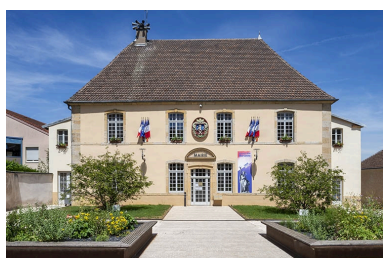
La façade de l'hôtel de ville. IVR43_20217000394NUC4A