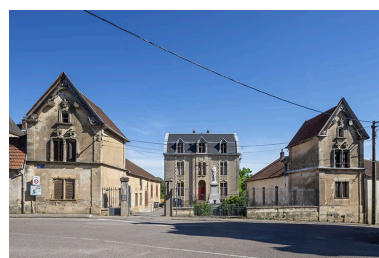
L'ancienne école libre, au n° 29.