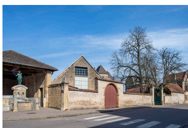
La rue avec le lavoir et les n° 27 et 29. IVR43_20227000035NUC4A