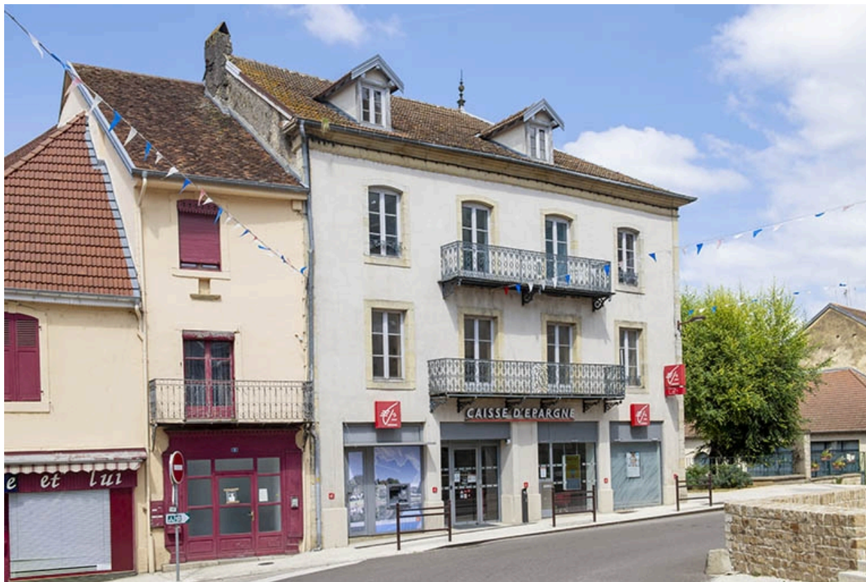
Trois quarts gauche des maisons à boutiques et immeuble aux n° 1, 3 et 5.