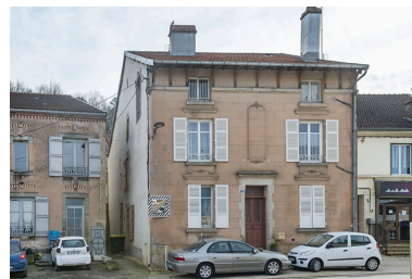
Trois quarts gauche du n° 16. IVR43_20227000034NUC4A