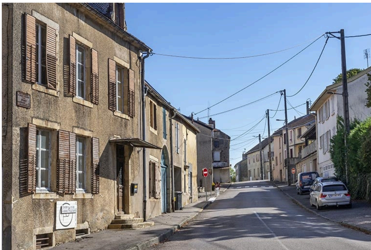
Vue vers l'est, à hauteur du n° 37, anciennement rue de la bourlerie.