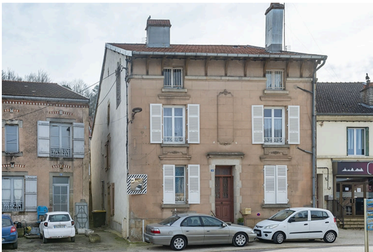
Trois quarts gauche du n° 16.