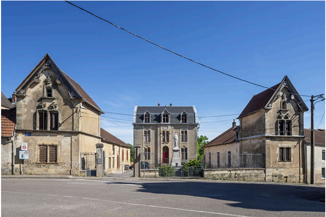
L'ancienne école libre, au n° 29.