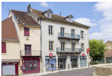
Trois quarts gauche des maisons à boutiques et immeuble aux n° 1, 3 et 5.