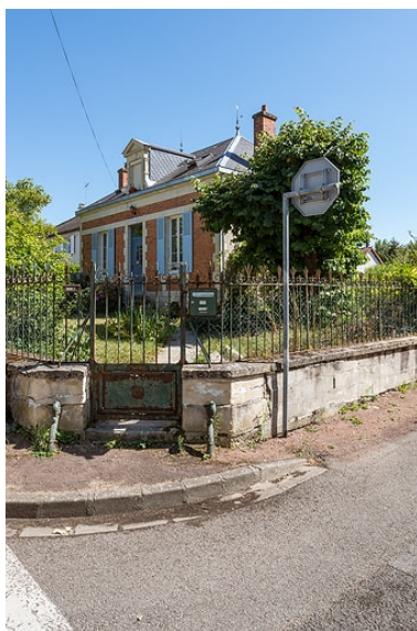
Vue depuis la rue. IVR26_20205800525NUC4A