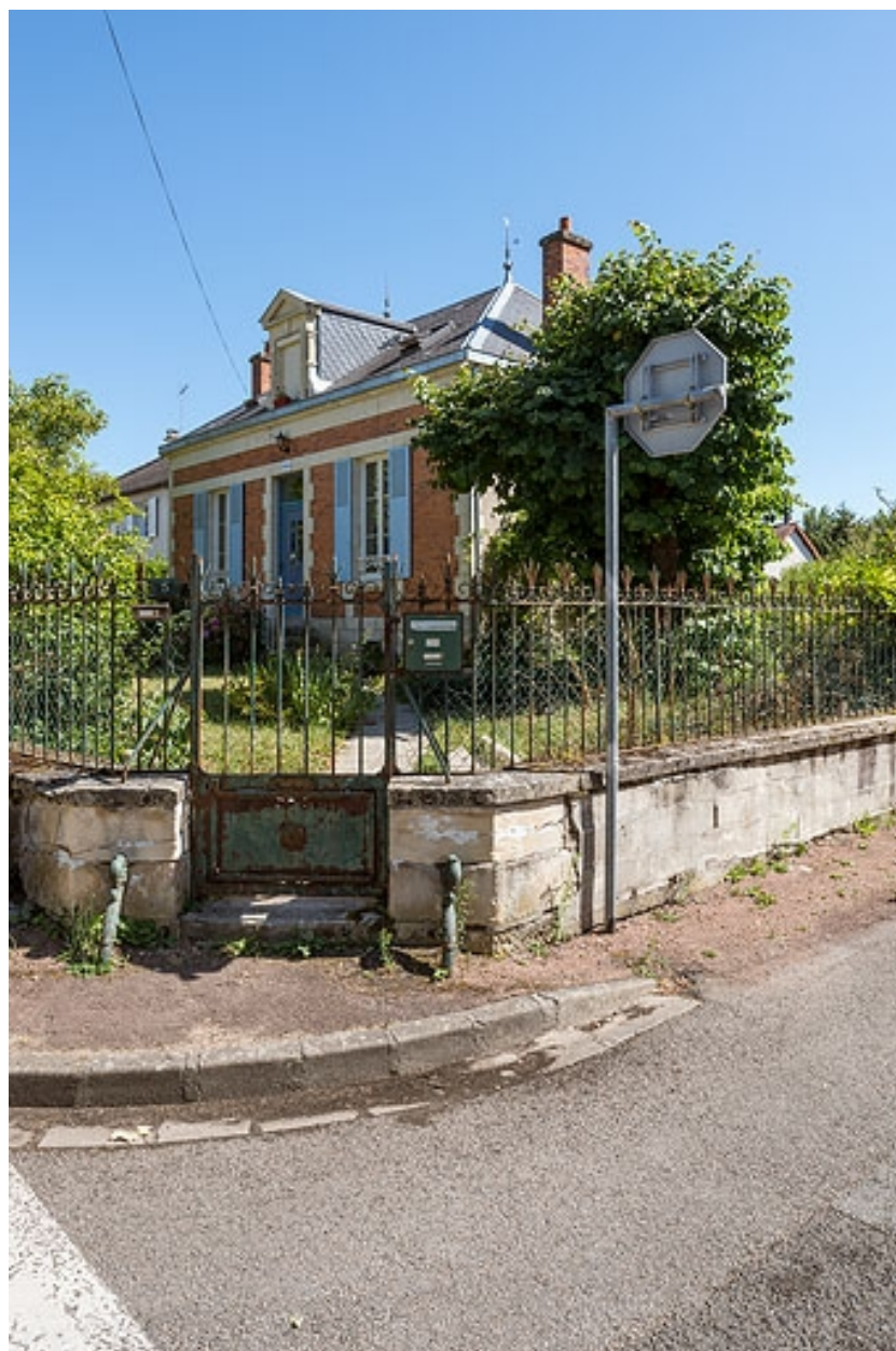
Vue depuis la rue.