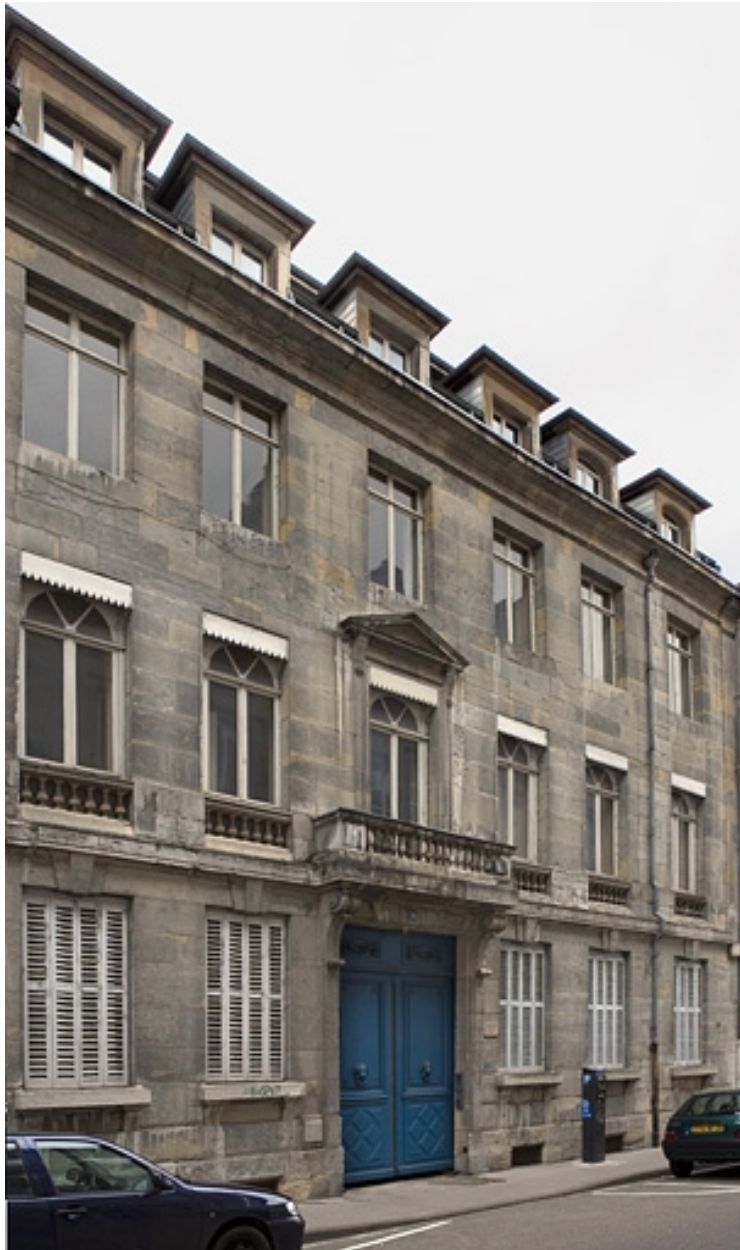
Vue d'ensemble du logis principal depuis la rue, de trois quarts gauche.