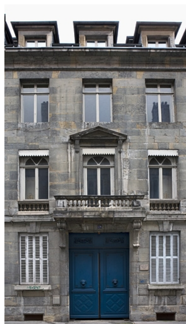
Vue d'ensemble de la partie centrale de la façade sur rue. IVR43_20072500289NUCA