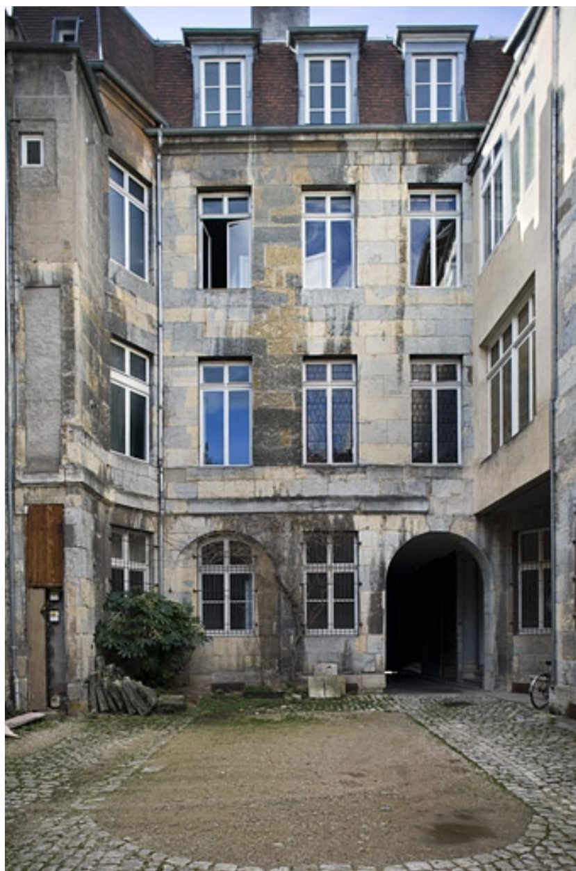
Vue d'ensemble des façades sur cour depuis le fond de la parcelle.