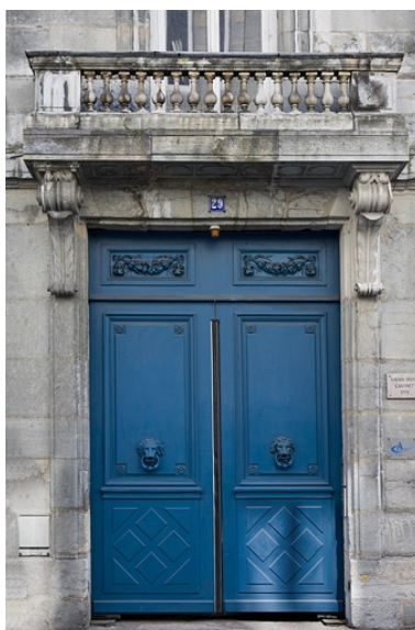
Détail du portail d'entrée sur rue.