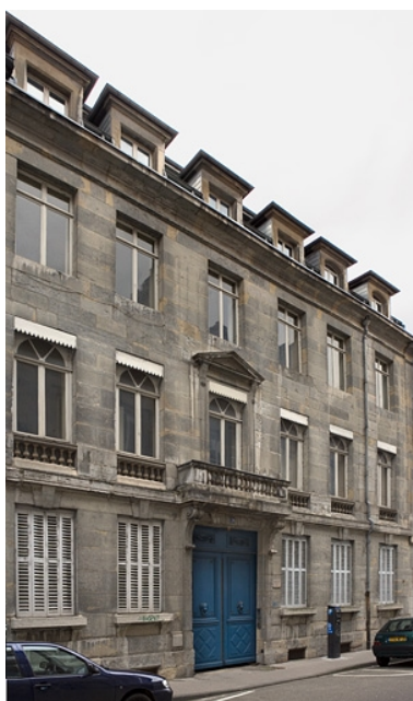
Vue d'ensemble du logis principal depuis la rue, de trois quarts gauche. IVR43_20072500288NUCA