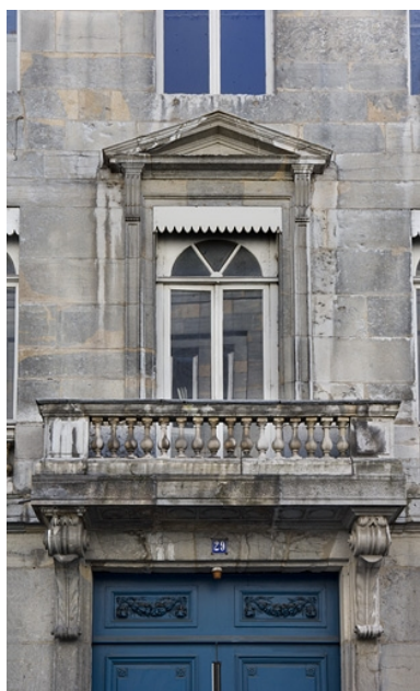
Détail de la baie et du balcon situés au-dessus du portail d'entrée. IVR43_20072500290NUCA