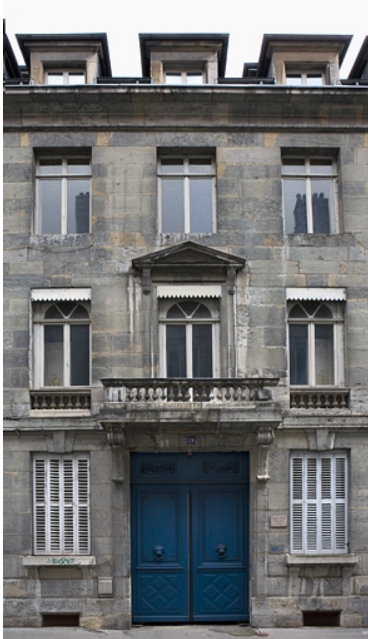
Vue d'ensemble de la partie centrale de la façade sur rue.