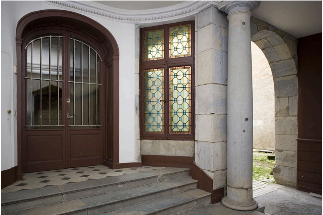
Vue de l'entrée de l'escalier.