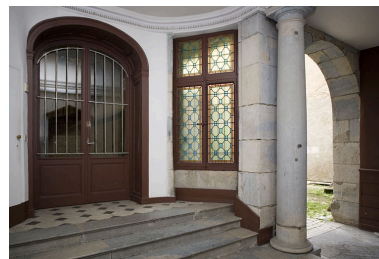
Vue de l'entrée de l'escalier.