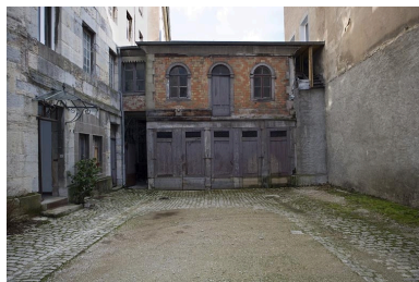
Vue d'ensemble des dépendances en fond de cour, de face. IVR43_20072500283NUCA