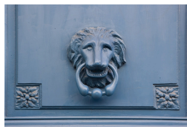
Détail du heurtoir du portail d'entrée.