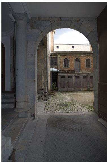
Vue des dépendances en fond de cour depuis le passage cocher.