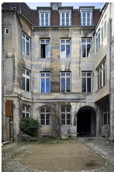
Vue d'ensemble des façades sur cour depuis le fond de la parcelle. IVR43_20072500284NUCA