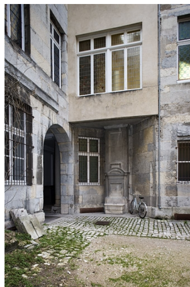
Vue d'ensemble de l'entrée sur cour.