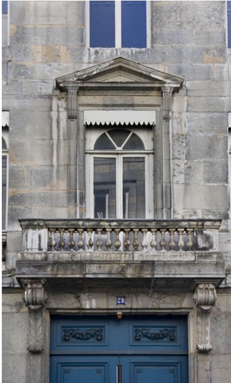
Détail de la baie et du balcon situés au-dessus du portail d'entrée.