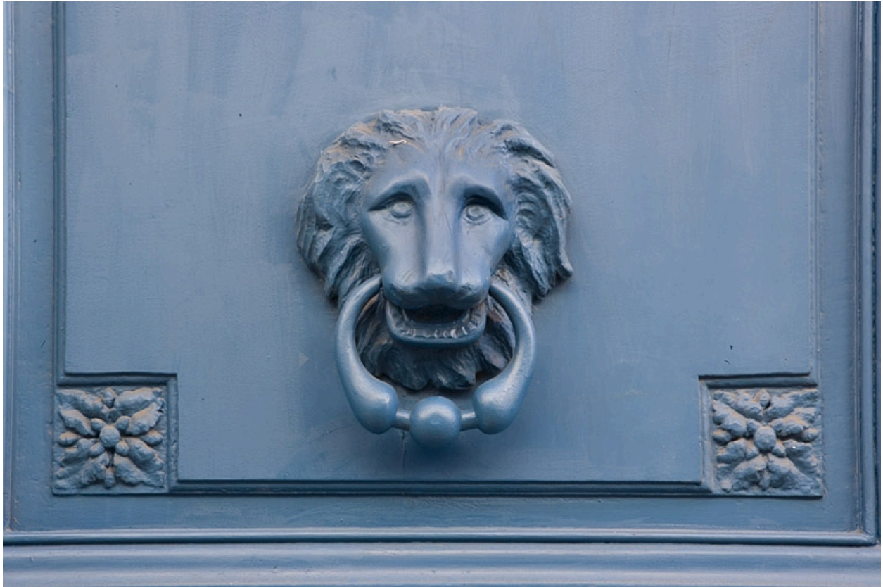
Détail du heurtor du portail d'entrée.