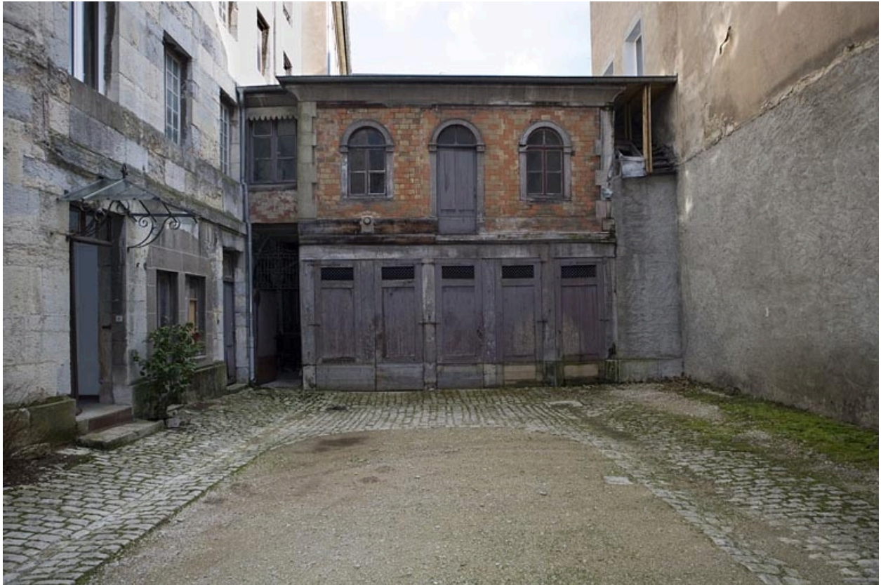
Vue d'ensemble des dépendances en fond de cour, de face.