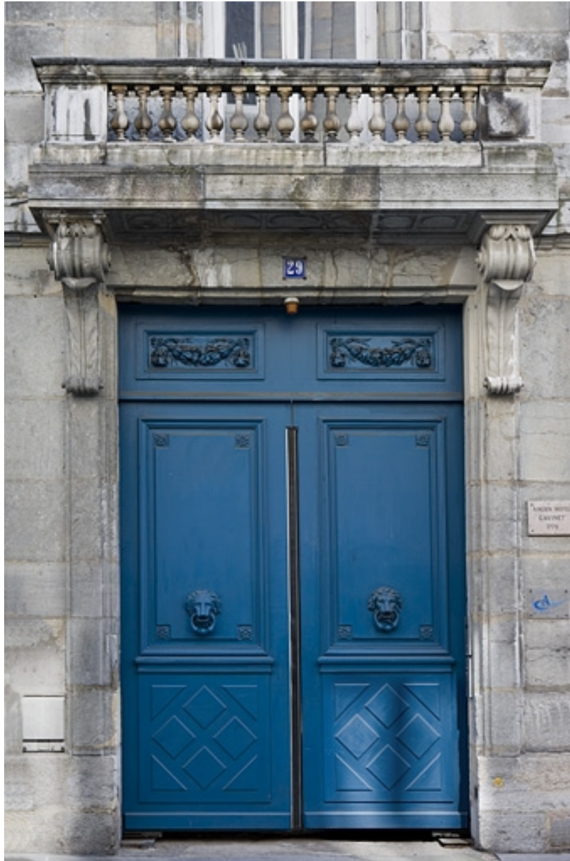
Détail du portail d'entrée sur rue.