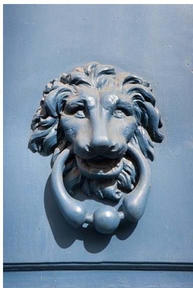
Détail du heurtoir du portail d'entrée : vue rapprochée. IVR43_20072500287NUCA