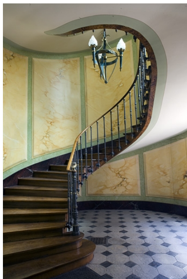
Vue d'ensemble de l'escalier. IVR43_20072500281NUCA