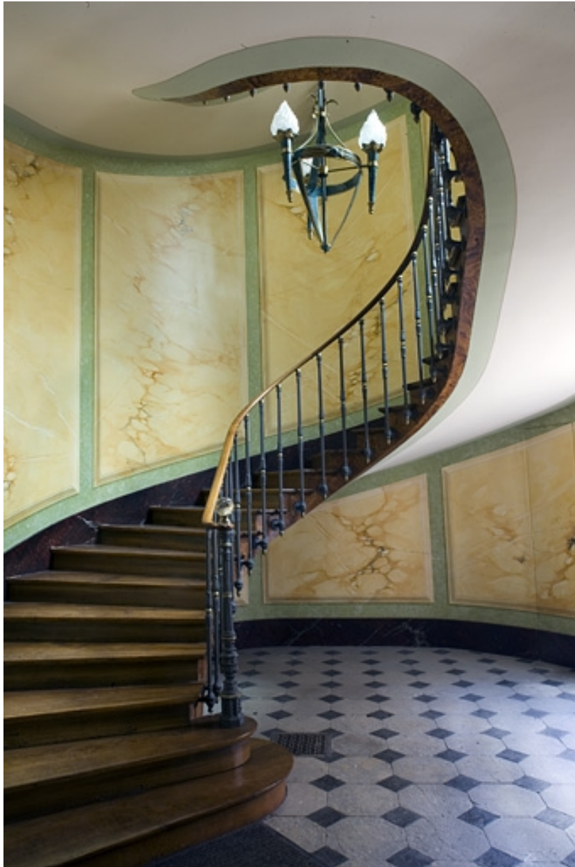
Vue d'ensemble de l'escalier.