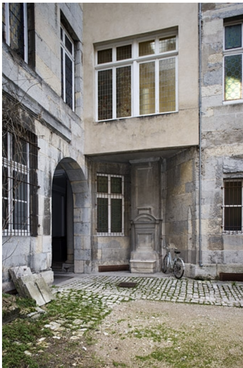
Vue d'ensemble de l'entrée sur cour.