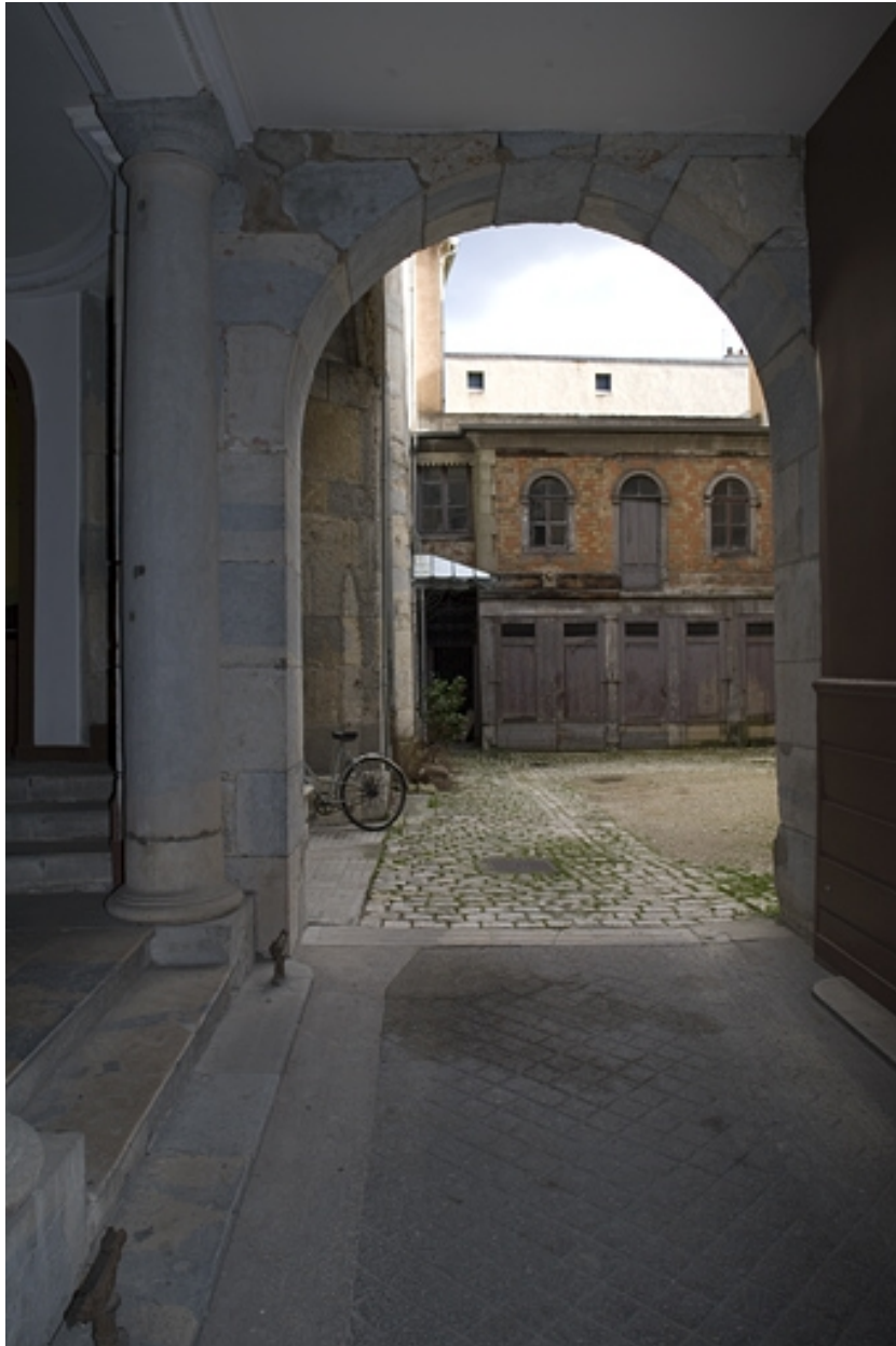
Vue des dépendances en fond de cour depuis le passage cocher.