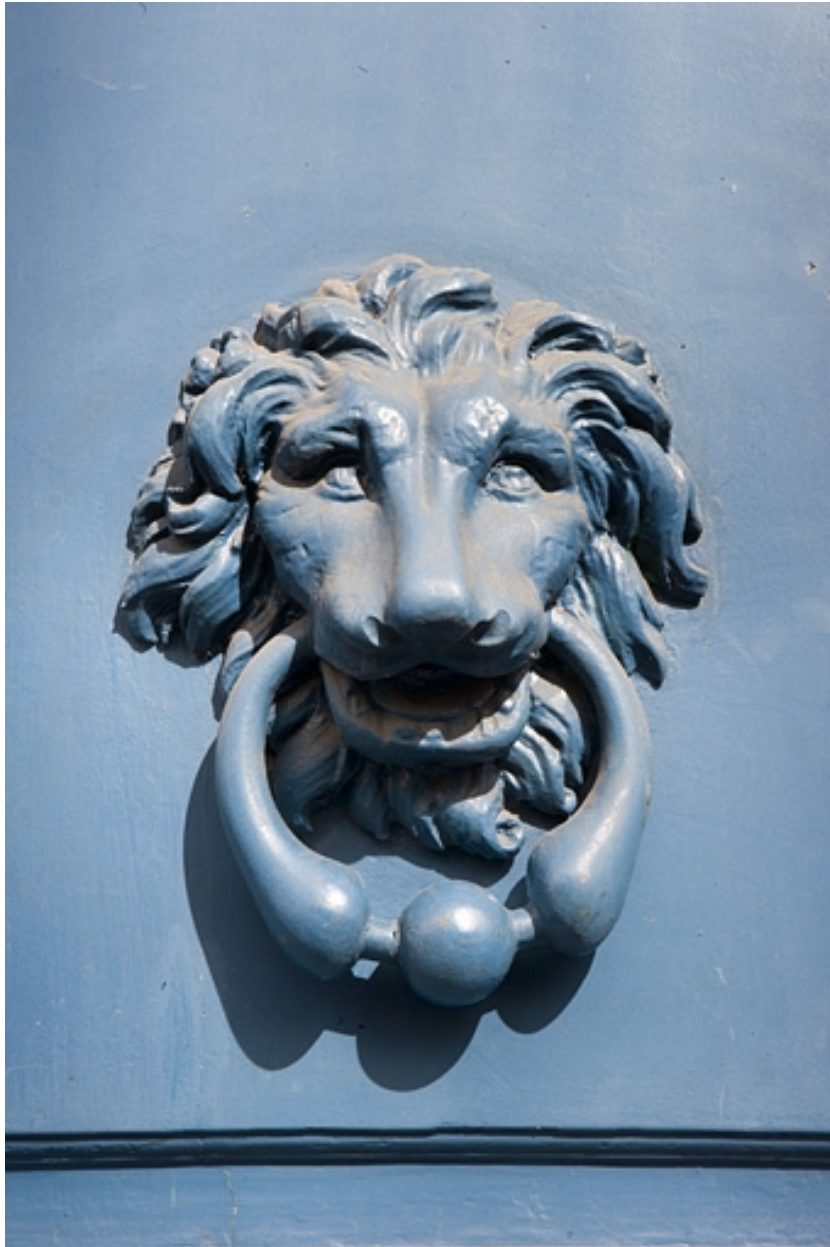
Détail du heurtor du portail d'entrée : vue rapprochée.