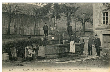
Salins-les-Bains (Jura) - Fontaine du Lion, place Constant-Rollier, s.d. [fin 19e ou début 20e siècle].