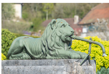
Le lion, vu de trois quarts. IVR43_20233900242NUC4A