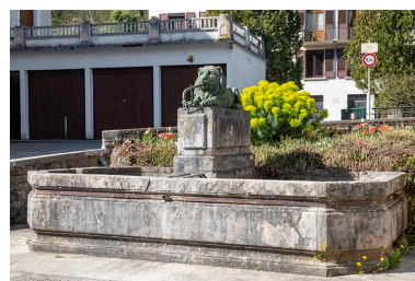
Vue de trois quarts droite. IVR43_20233900244NUC4A