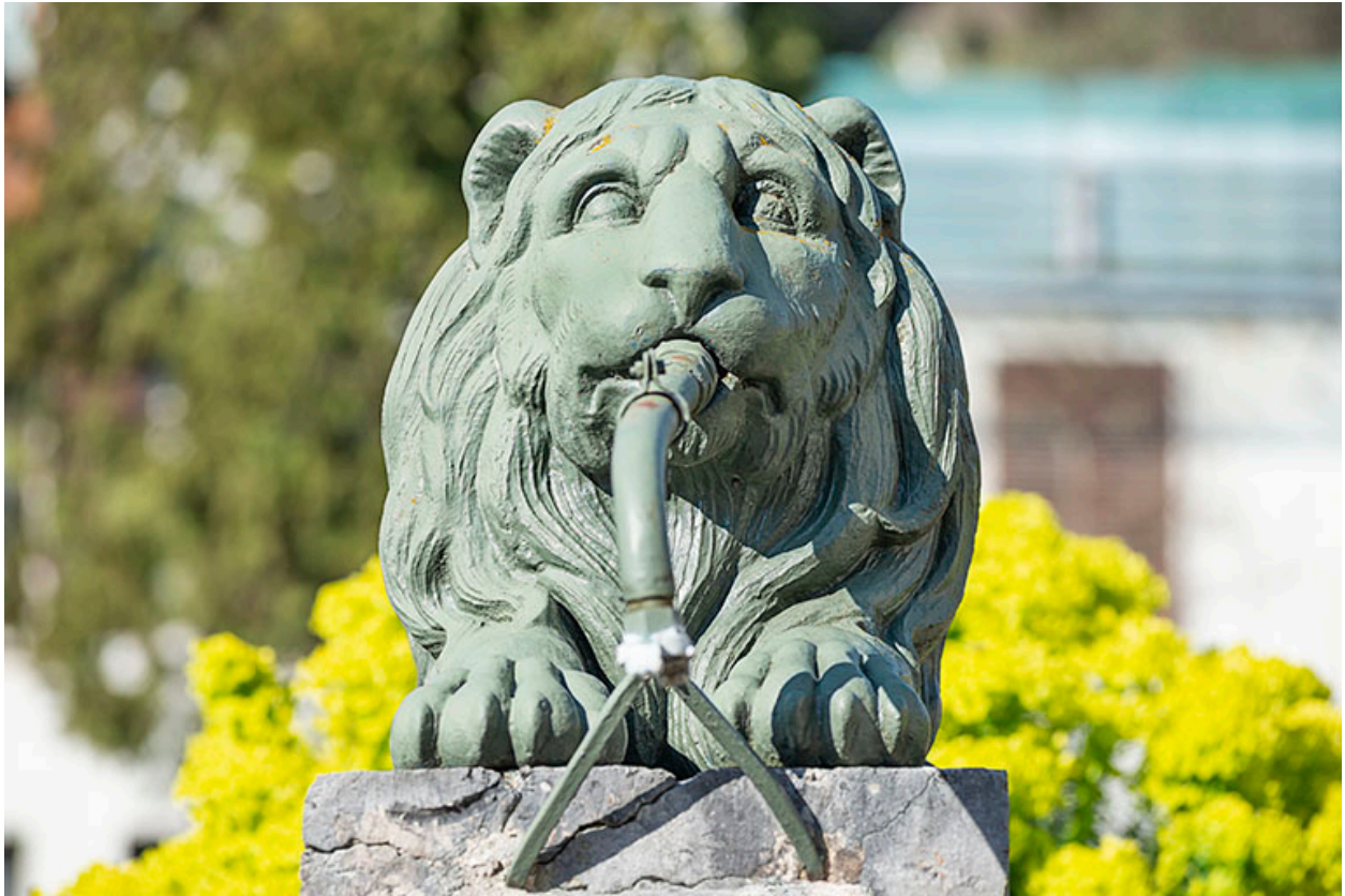
Le lion, vue de face.