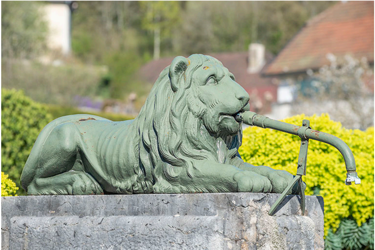
Le lion, vu de trois quarts.