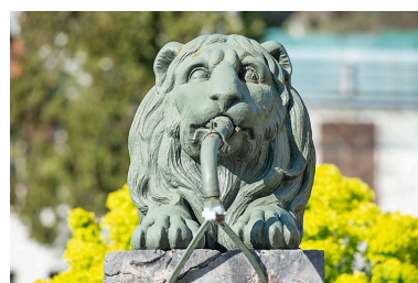
Le lion, vue de face. IVR43_20233900243NUC4A