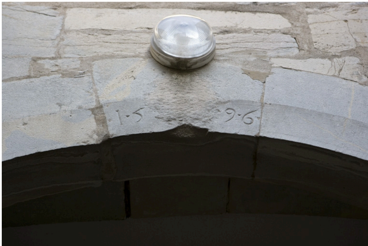
Détail de la date sur l'arc du portail d'entrée.