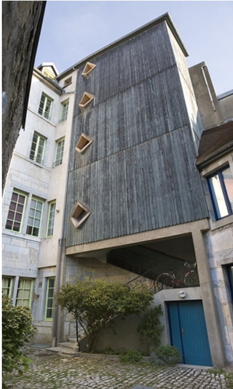
Vue d'ensemble de l'escalier à cage ouverte sur cour.