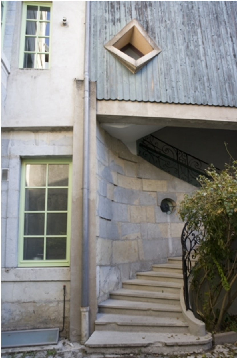
Détail du départ de l'escalier à cage ouverte sur cour, vue verticale.