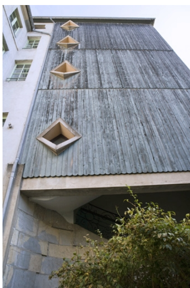
Escalier à cage ouverte sur cour : détail de la fermeture de la cage. IVR43_20092501448NUC2A