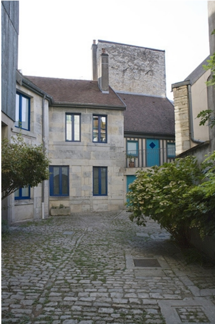
Vue d'ensemble des logis situés autour de la cour.