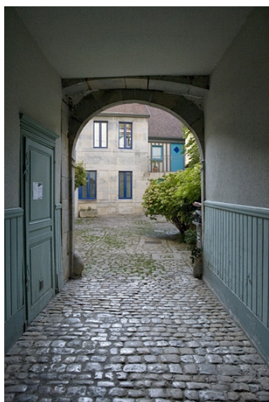
Vue de la cour depuis l'entrée du passage cocher. IVR43_20092501443NUC2A