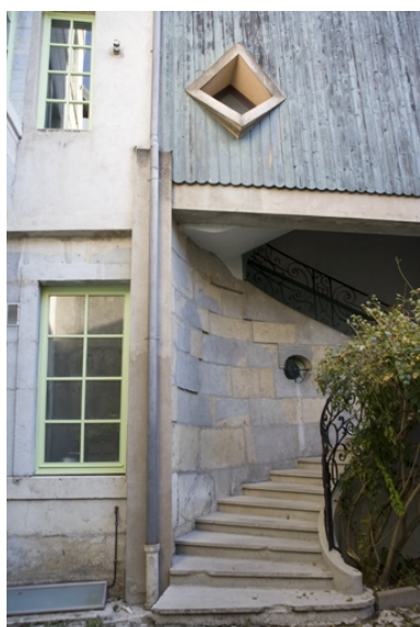
Détail du départ de l'escalier à cage ouverte sur cour, vue verticale. IVR43_20092501447NUC2A