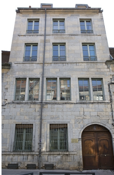
Façade sur rue : de face.