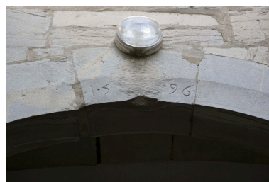
Détail de la date sur l'arc du portail d'entrée.