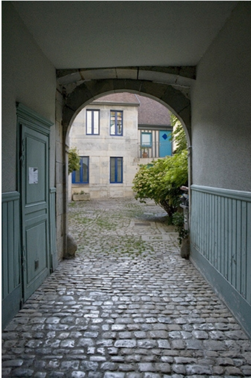
Vue de la cour depuis l'entrée du passage cocher.