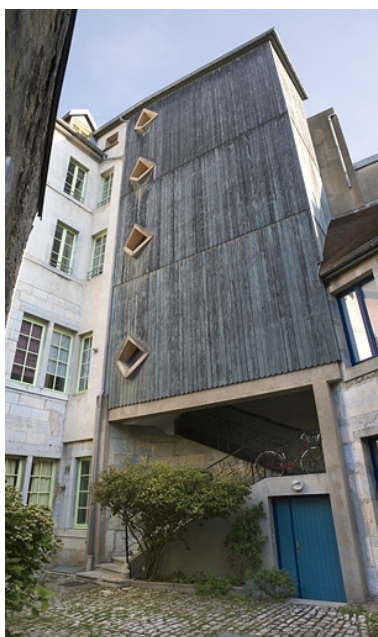
Vue d'ensemble de l'escalier à cage ouverte sur cour. IVR43_20092501445NUC2A