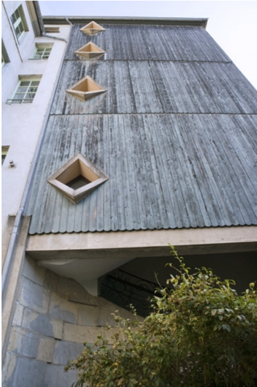
Escalier à cage ouverte sur cour : détail de la fermeture de la cage.