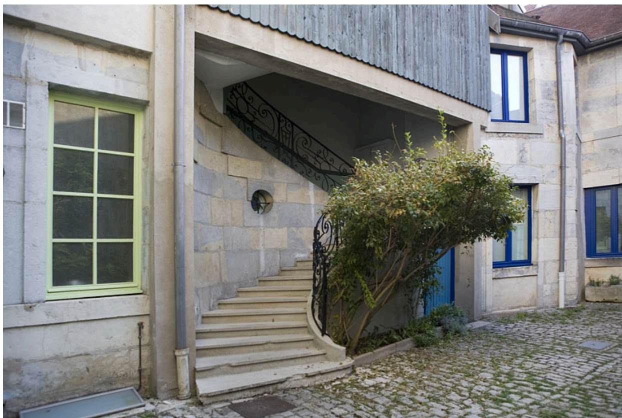
Détail du départ de l'escalier à cage ouverte sur cour.