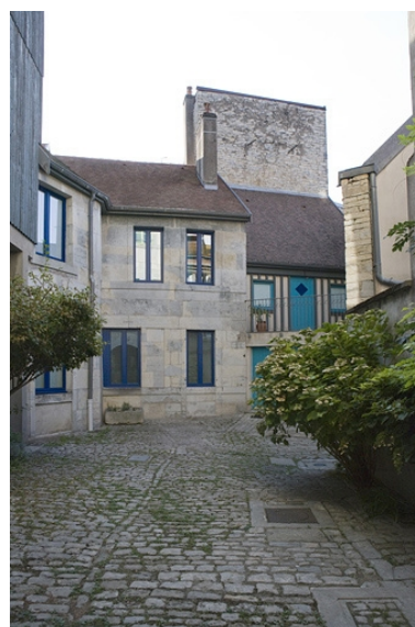
Vue d'ensemble des logis situés autour de la cour.