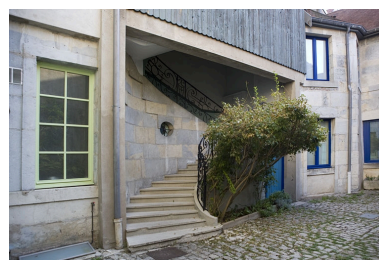
Détail du départ de l'escalier à cage ouverte sur cour. IVR43_20092501446NUC2A