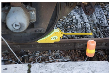
Cale nouvelle. IVR43_20073900081NUCA