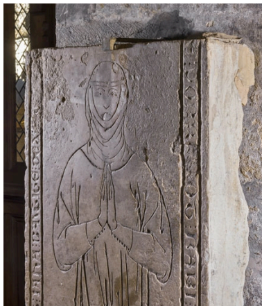
Personnage vu en lumière rasante IVR26_20222100503NUC2A

IVR26_20222100502NUC4A