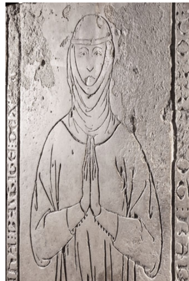
Personnage vu en lumière rasante (vue resserrée). IVR26_20222100504NUC4A