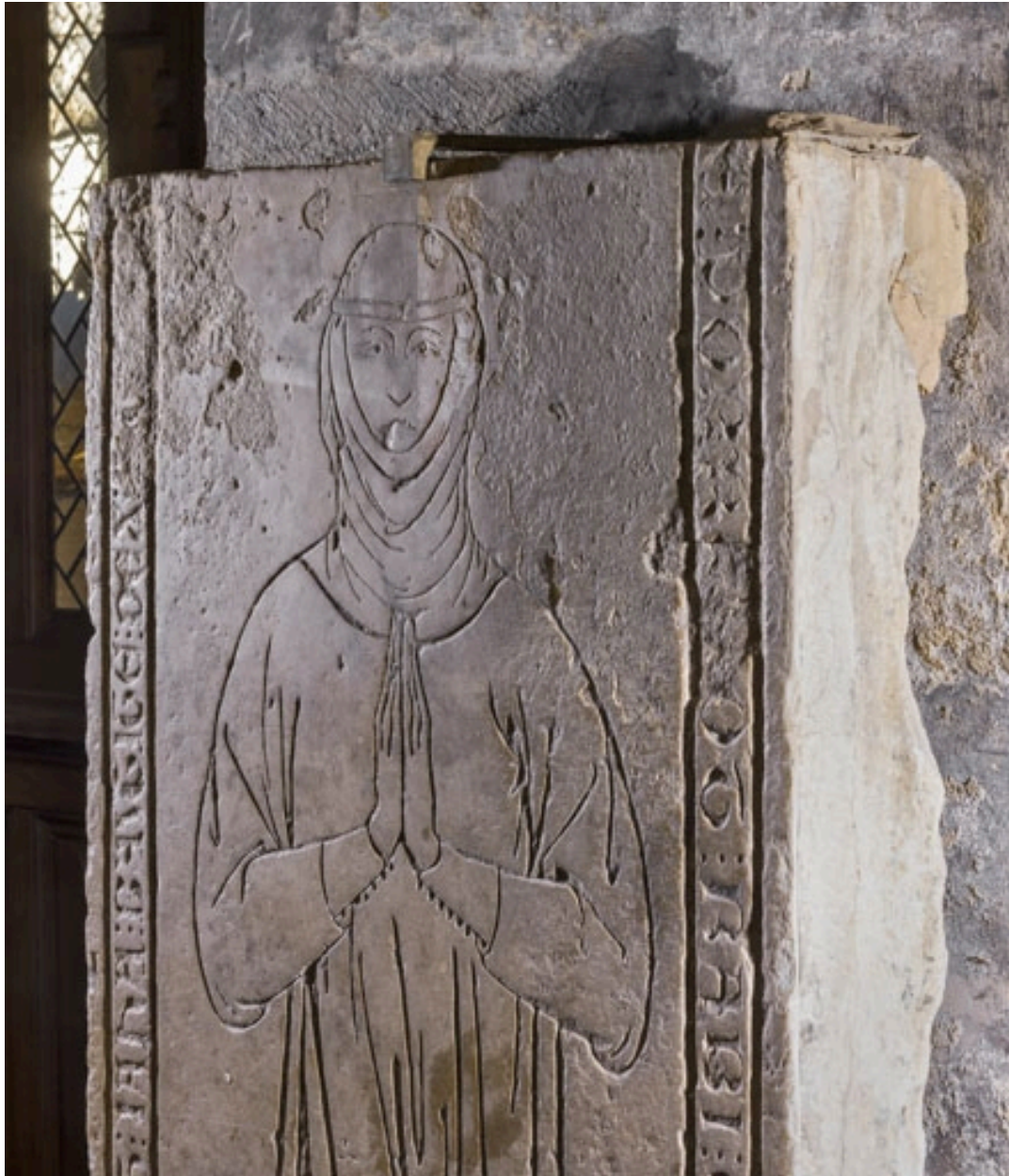
Personnage vu en lumière rasante