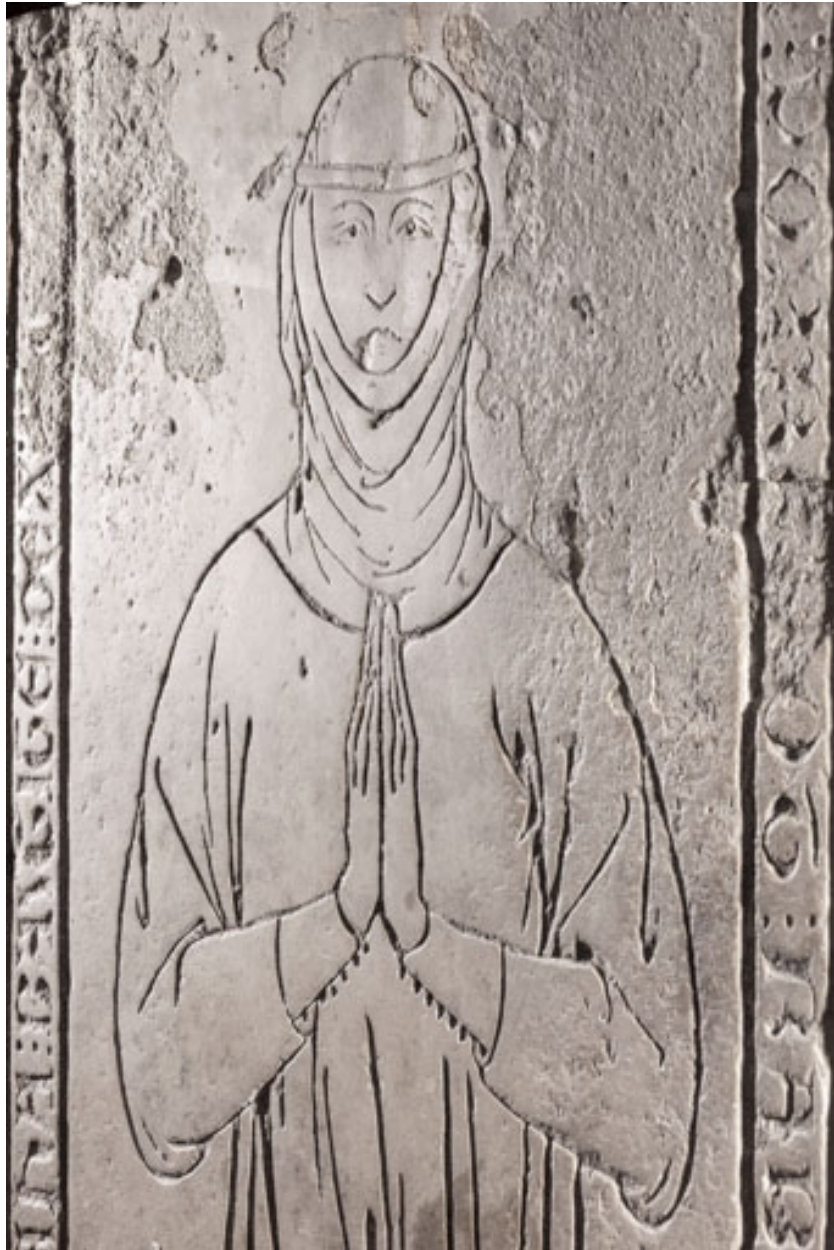
Personnage vu en lumière rasante (vue resserrée).