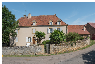
Ferme d'embouche. La maison est construite au milieu du XIXe siècle.