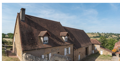
Ferme du XVIIIe siècle, propriété d'un riche laboureur, devenu emboucheur à la fin de ce siècle. IVR26_20197100176NUC4AQ