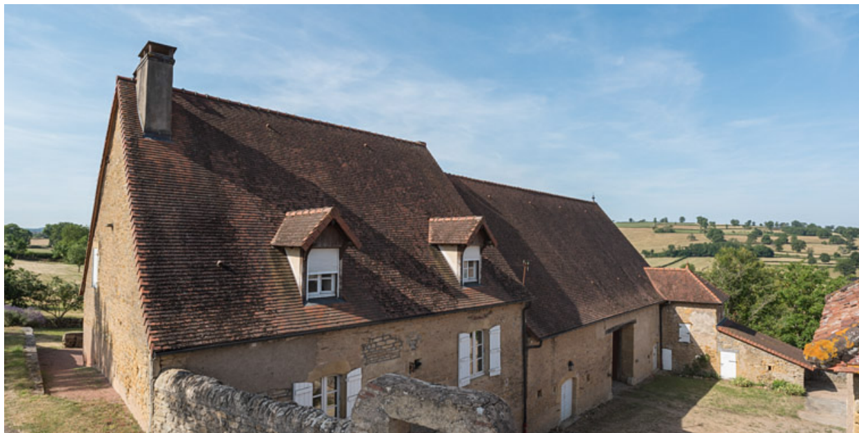
Ferme du XVIIIe siècle, propriété d'un riche laboureur, devenu emboucheur à la fin de ce siècle.