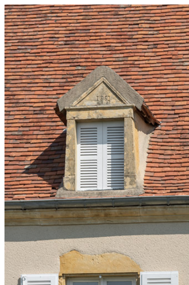
Autre lucarne de la maison d'emboucheur, dont le fronton est gravé de la date "1851", date de la construction de la bâtisse.