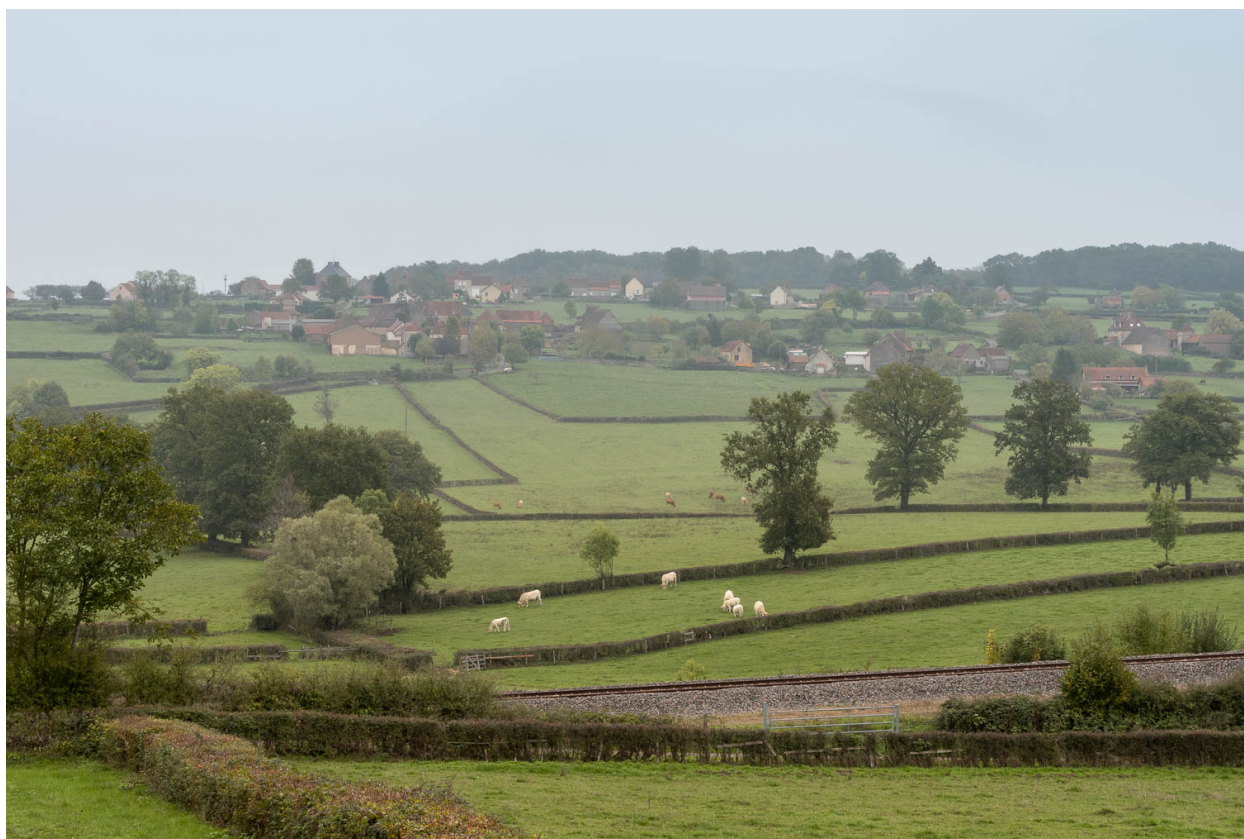
Vue du hameau de Tourny, depuis l'ouest et la route menant au vieux-bourg de Changy