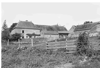
Ferme d'embouche, construite au XIXe siècle, située au coeur du hameau. IVR26_20207100093NUC2