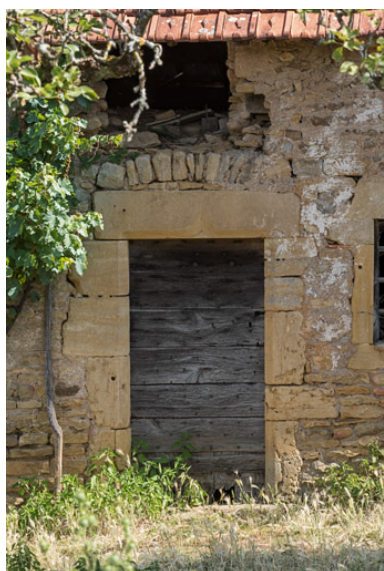
Porte d'une des maisons de l'alignement, avec un linteau à accolade, provenant sans doute d'un autre bâtiment et utilisé en remploi. IVR26_20197100178NUC4A