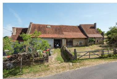
Ensemble formé par deux fermes construites dans le même alignement et situé à un croisement au coeur du village. IVR26_20197100177NUC4A