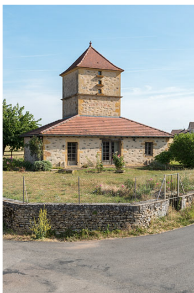
Habitation, surmontée d'un pigeonnier et érigée à la fin du XIXe siècle