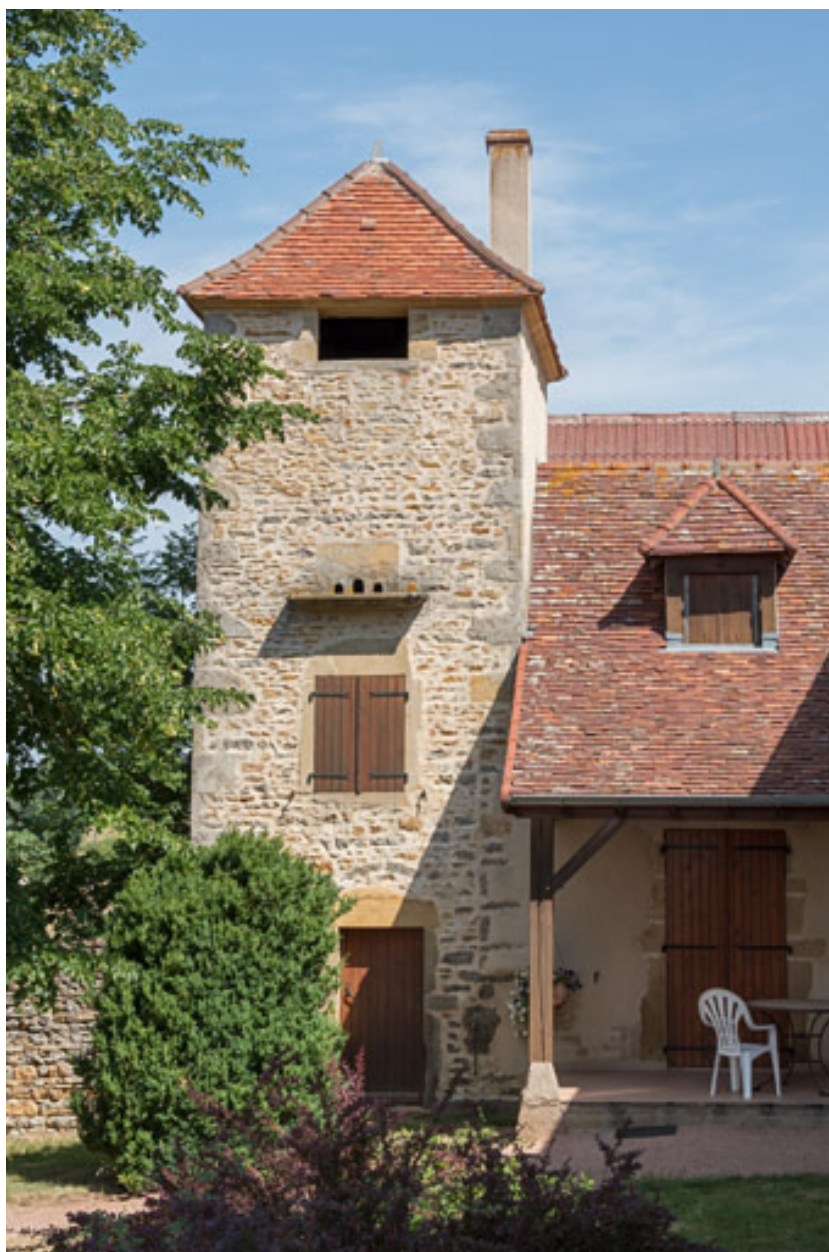
Ancien pigeonnier, dépendant de la ferme d'embouche