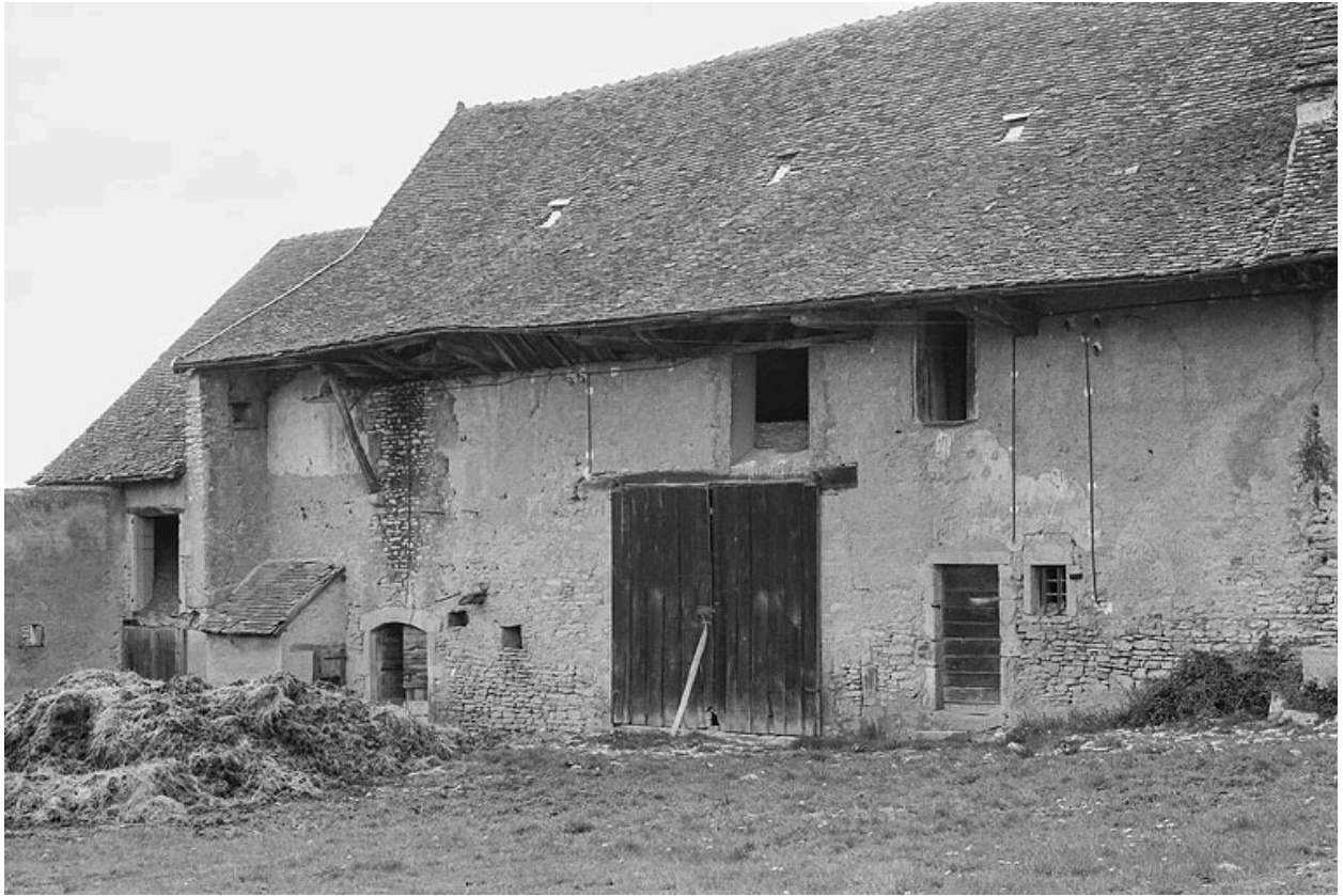
Grange, aujourd'hui détruite, à l'est du carrefour principal du hameau. Seul subsiste aujourd'hui, le bâtiment bas, à l'arrière-plan.