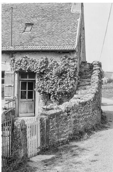
Détail de la même ferme : vue de l'escalier extérieur, construit