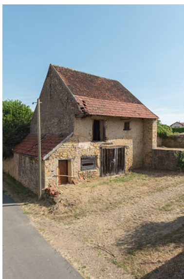
Ancienne maison de laboureur, transformée en bâtiment agricole. La grange, aujourd'hui détruite se situait dans le prolongement de la maison. IVR26_20197100175NUC4A