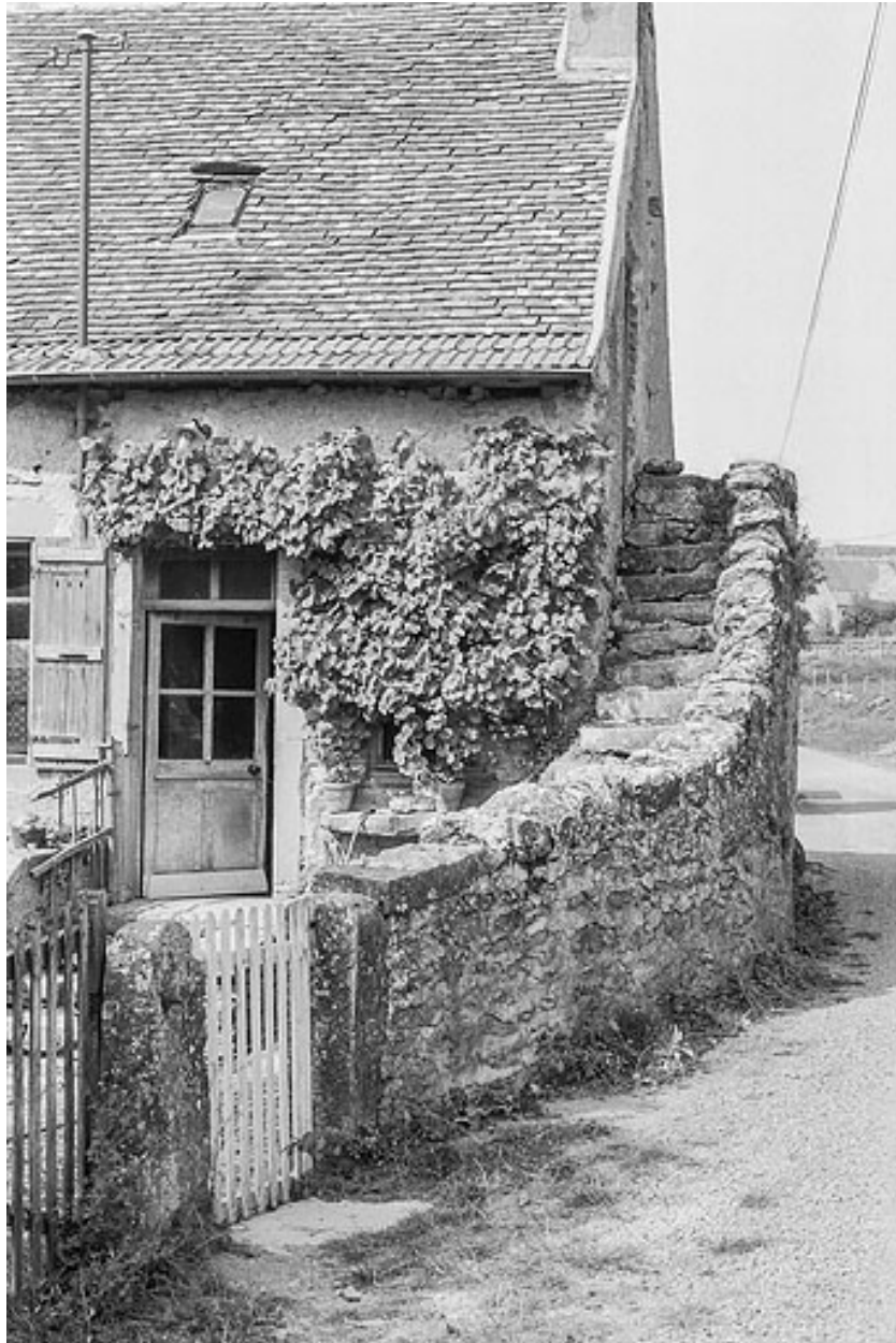
Détail de la même ferme : vue de l'escalier extérieur, construit contre le mur-pignon et donnant accès aux combles de la maison.