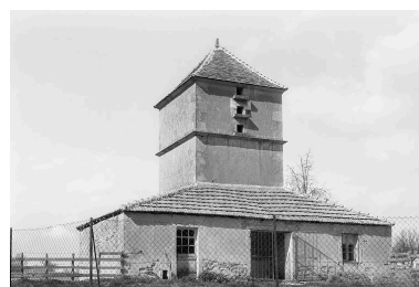
Vue de l'abitation surmontée d'un pigeonnier vers 1970 IVR26_20207100082NUC2