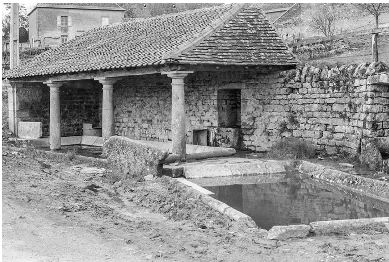
Le lavoire, vers 1970.