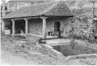
Le lavoire, vers 1970. IVR26_20207100086NUC2

IVR26_20207100092NUC2