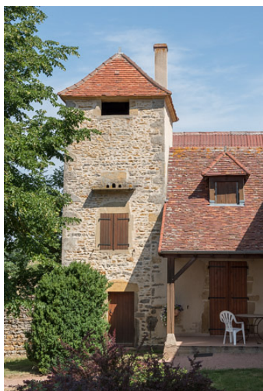
Ancien pigeonnier, dépendant de la ferme d'embouche IVR26_20197100182NUC4A