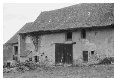
Grange, aujourd'hui détruite, à l'est du carrefour principal du hameau. Seul subsiste aujourd'hui, le bâtiment bas, à l'arrière-plan. IVR26_20207100083NUC2