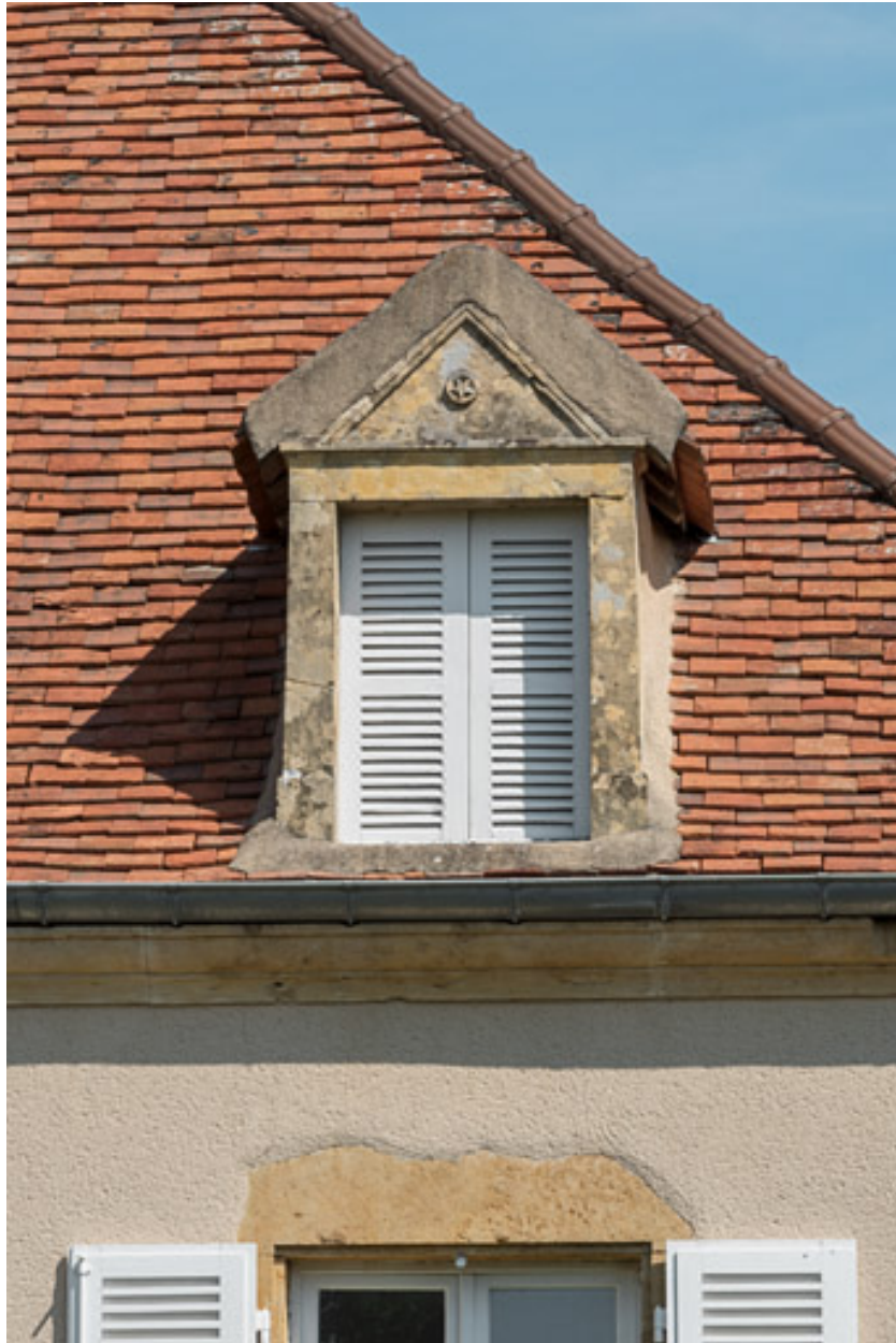
Une des lucarnes du toit de la maison d'emboucheur, dont le fronton est décoré d'une étoile dans un petit médaillon.