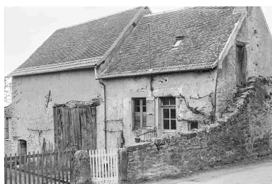
Ferme de polyculture, située dans la partie ouest du hameau. IVR26_20207100087NUC2