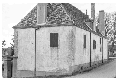
Maison d'emboucheur, construite au début du XIXe siècle, sur une parcelle formant un îlot au coeur du hameau. IVR26_20207100085NUC2