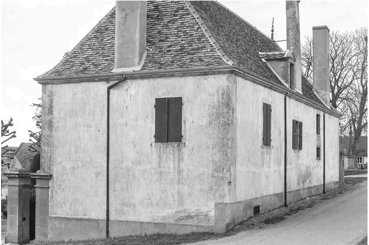
Maison d'emboucheur, construite au début du XIXe siècle, sur une parcelle formant un îlot au coeur du hameau.