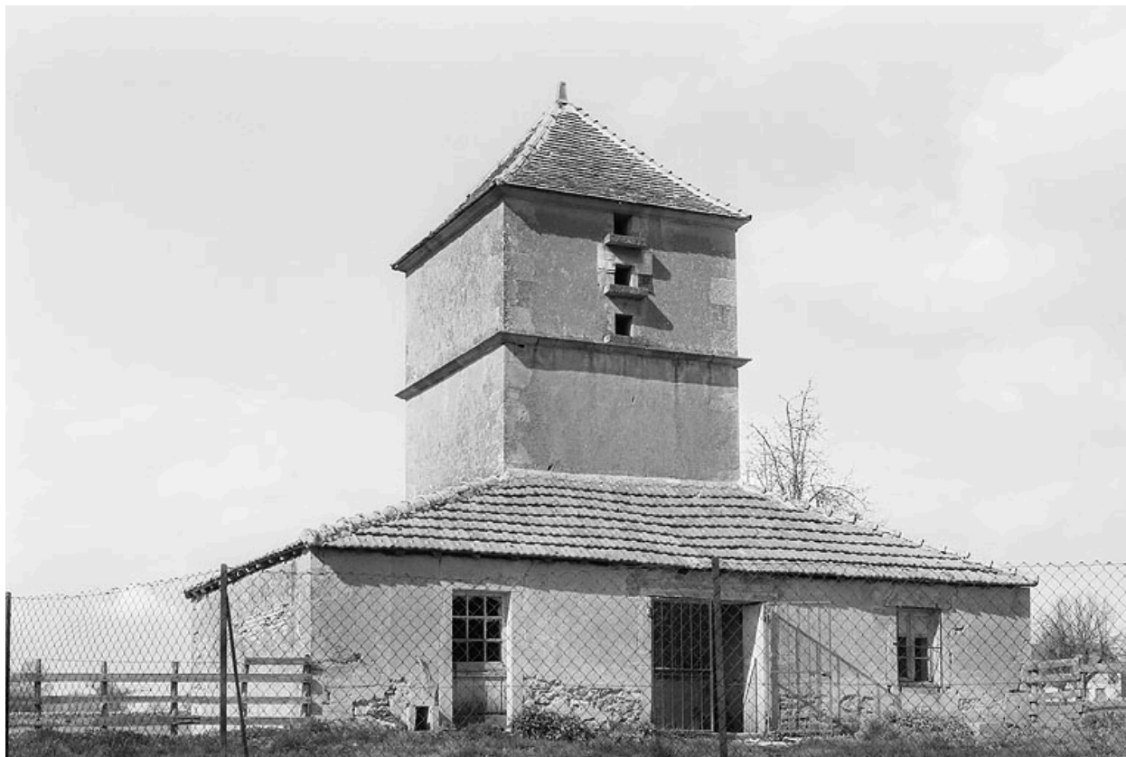
Vue de l'abitation surmontée d'un pigeonnier vers 1970