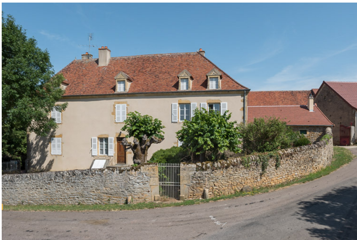
Ferme d'embouche. La maison est construite au milieu du XIXe siècle.