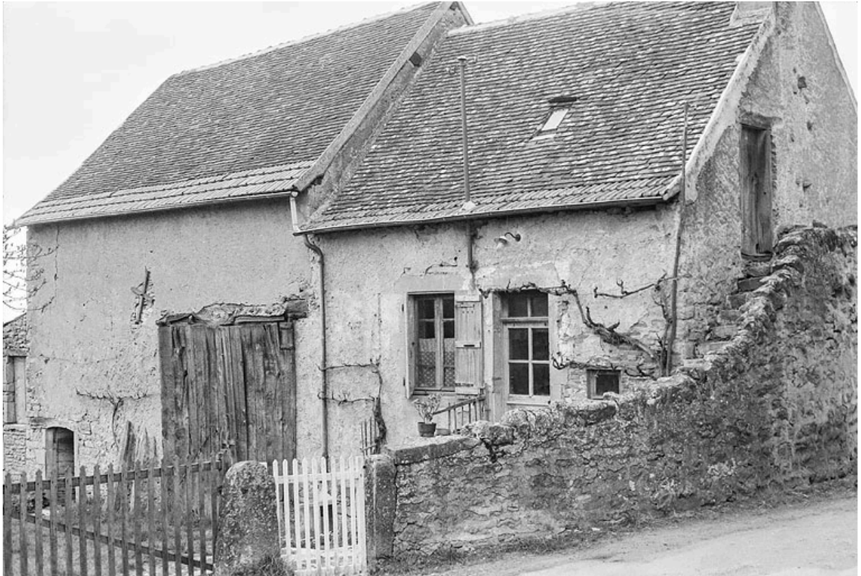
Ferme de polyculture, située dans la partie ouest du hameau.