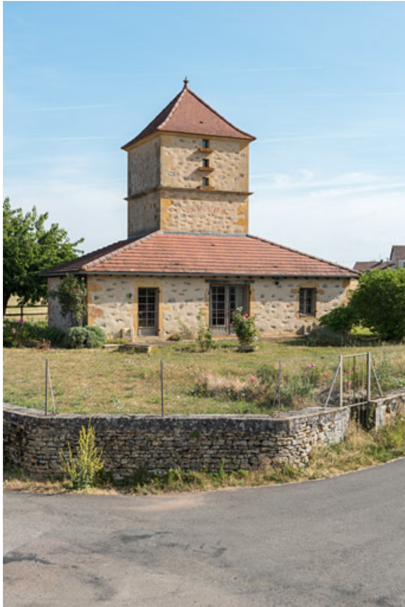
Habitation, surmontée d'un pigeonnier et érigée à la fin du XIXe siècle