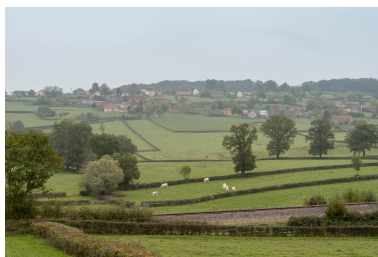
Vue du hameau de Tourny, depuis l'ouest et la route menant au vieux-bourg de Changy IVR26_20197100790NUC4A

Plan de situation du hameau avec la datation des bâtiments qui le composent. Extrait du plan cadastral, 2020, section AB et C, échelle 1/10000. IVR26_20207100143NUDA