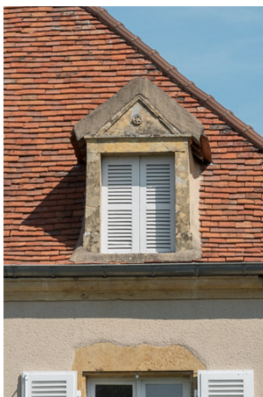
Une des lucarnes du toit de la maison d'emboucheur, dont le fronton est décoré d'une étoile dans un petit médaillon. IVR26_20197100181NUC4A