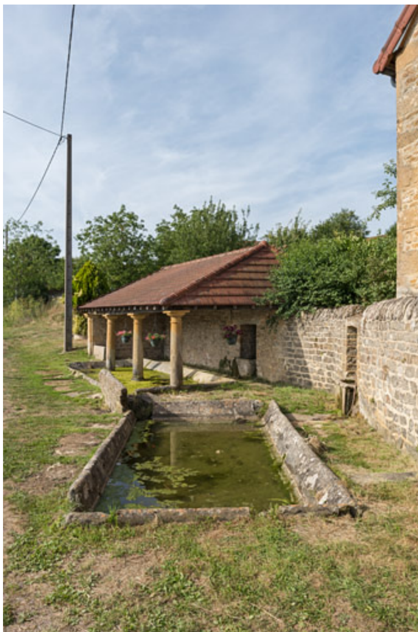
Lavoir à Tourny