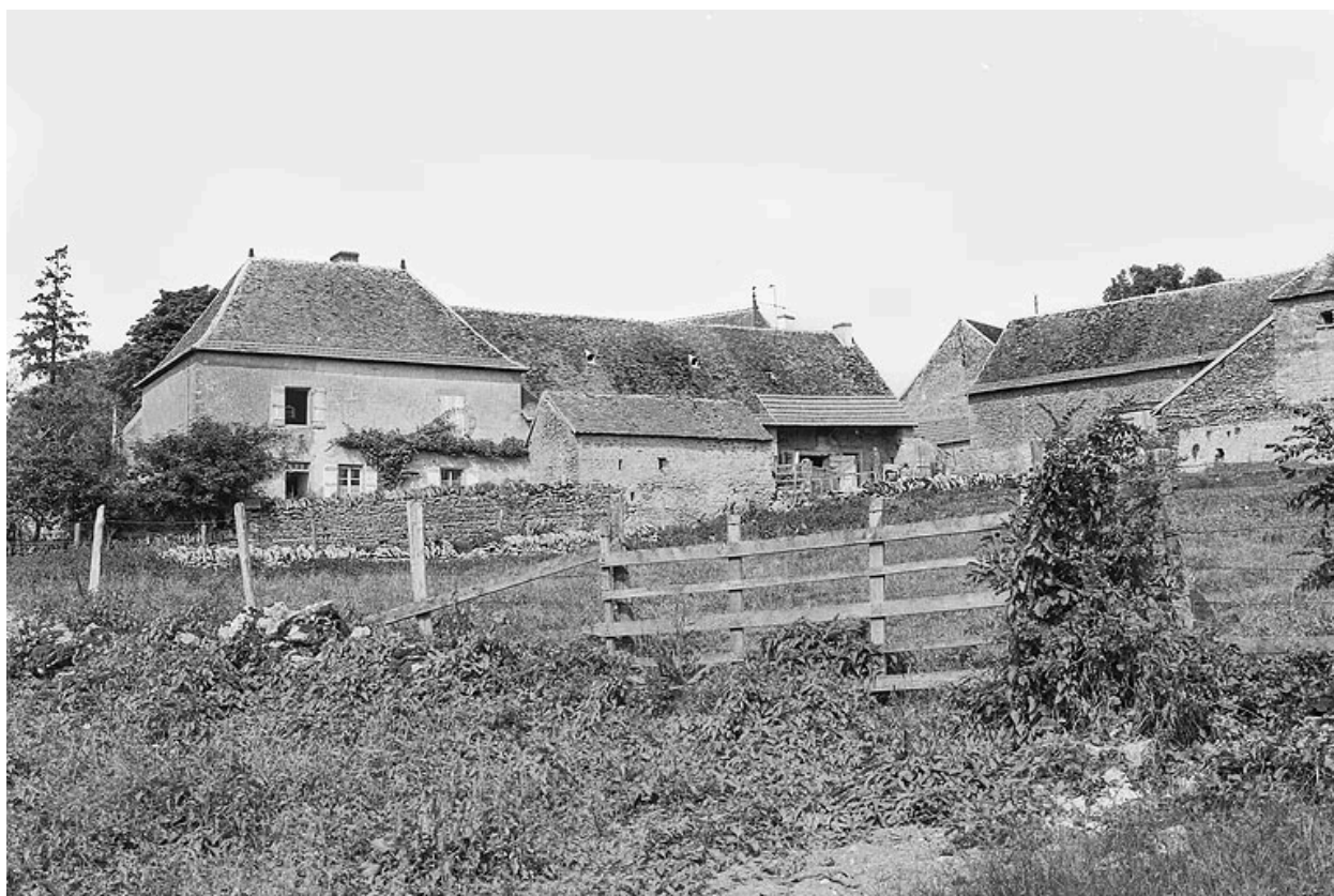
Ferme d'embouche, construite au XIXe siècle, située au coeur du hameau.