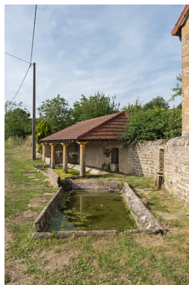
Lavoir à Tourny IVR26_20197100210NUC4A