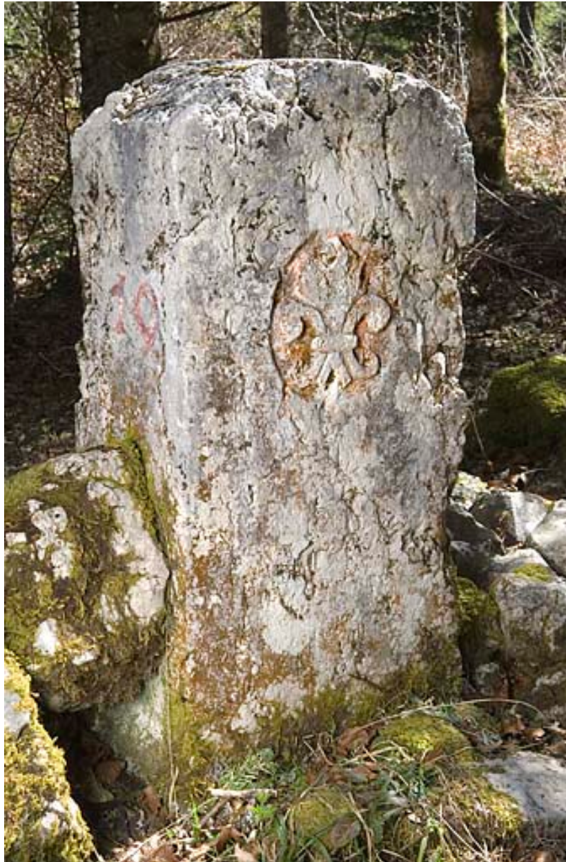
Borne n° 19 : fleur de lys côté France.