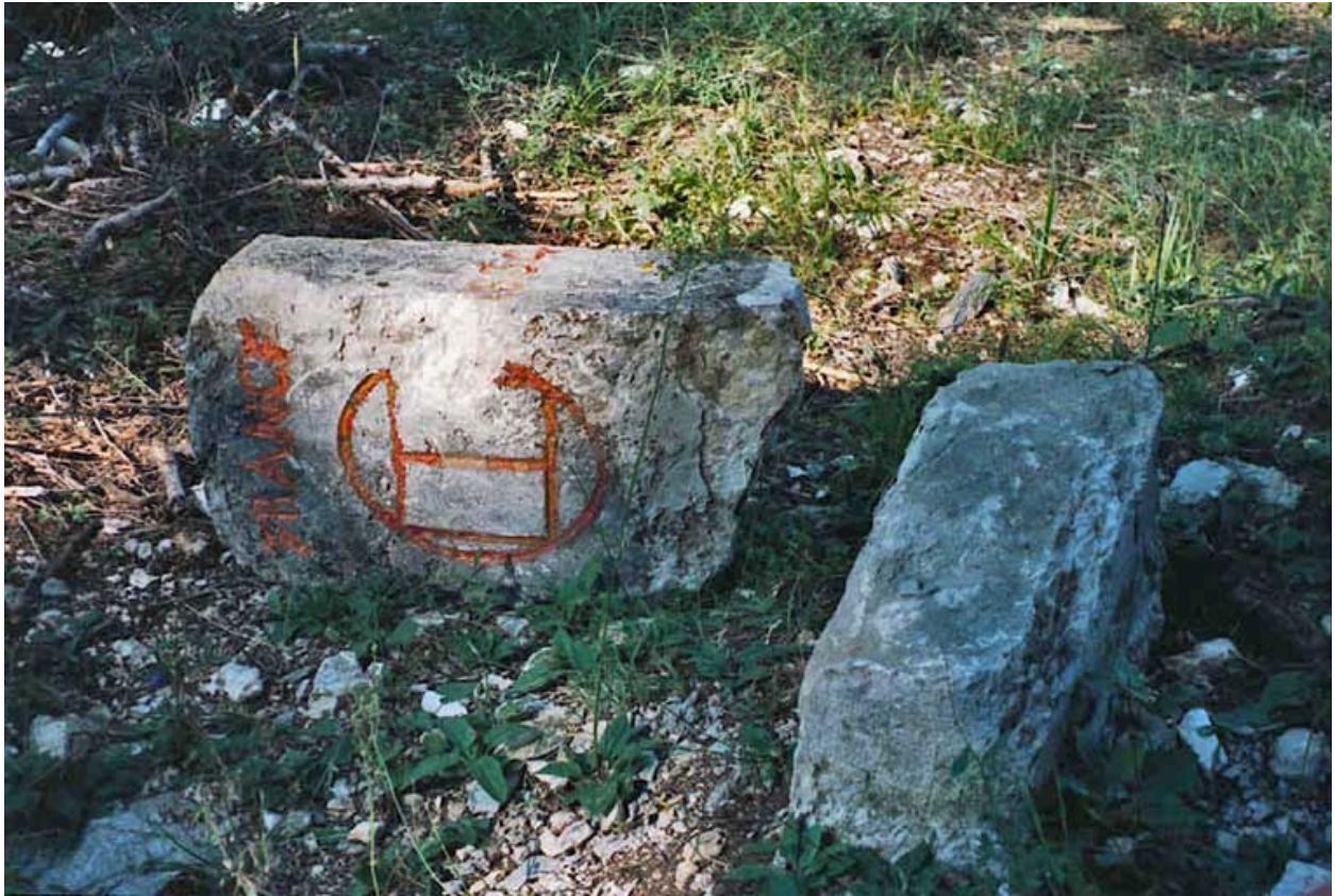
Borne cassée : décor au livre ouvert, côté France.