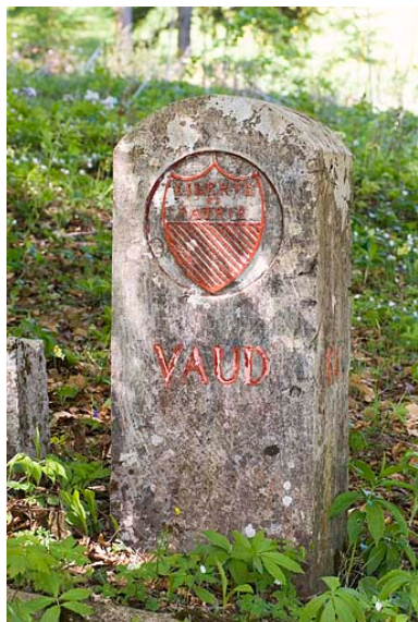
Borne n° 64 : écu du canton de Vaud côté Suisse.