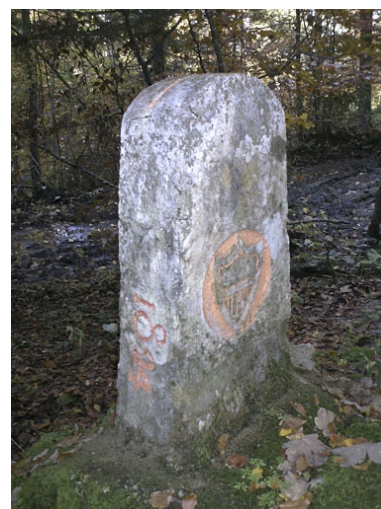
Borne n° 34 : écu du canton de Vaud côté Suisse.