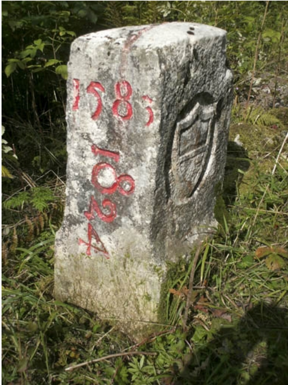
Borne n° 27 : écu du canton de Vaud côté Suisse.