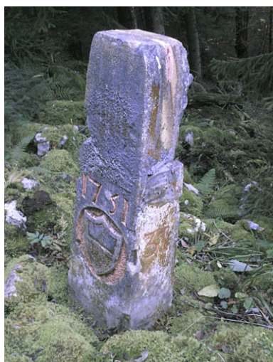
Borne n° 31 : écu du canton de Vaud côté Suisse.