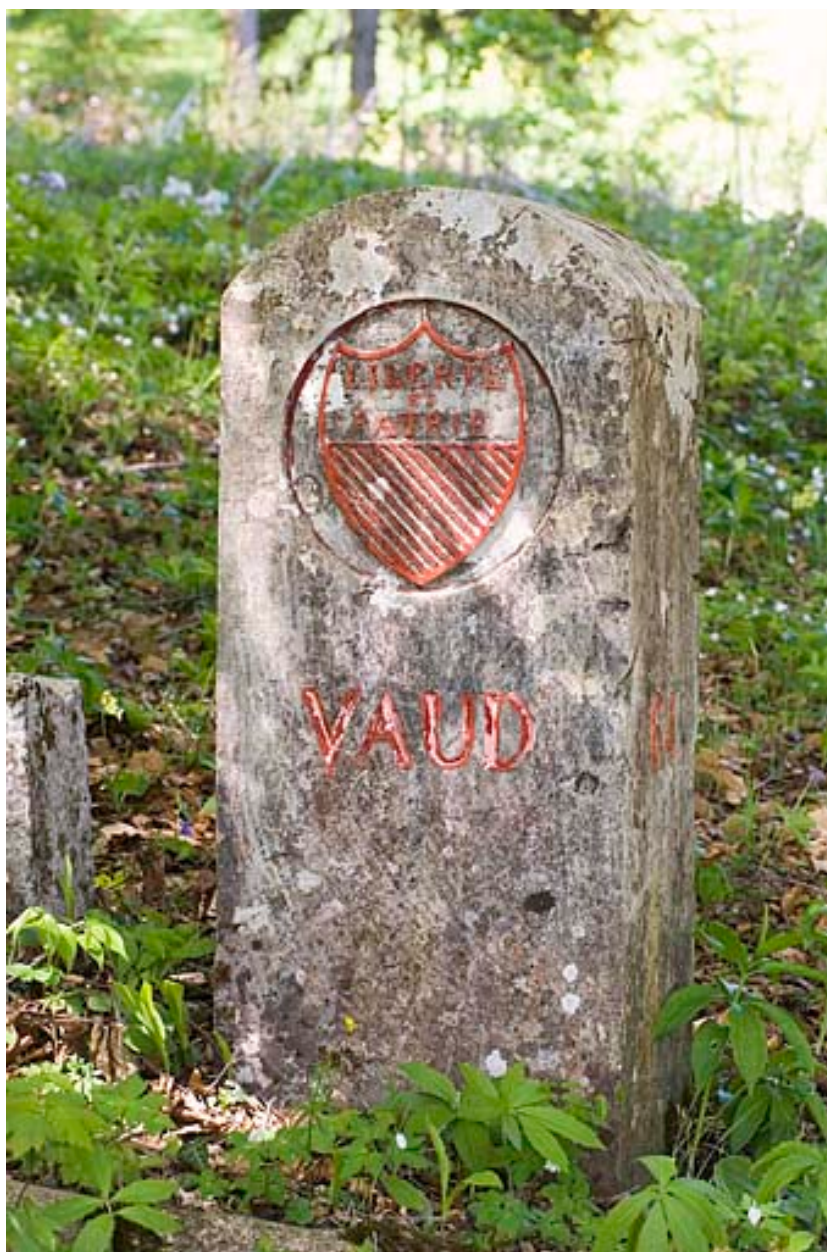
Borne n° 64 : écu du canton de Vaud côté Suisse.