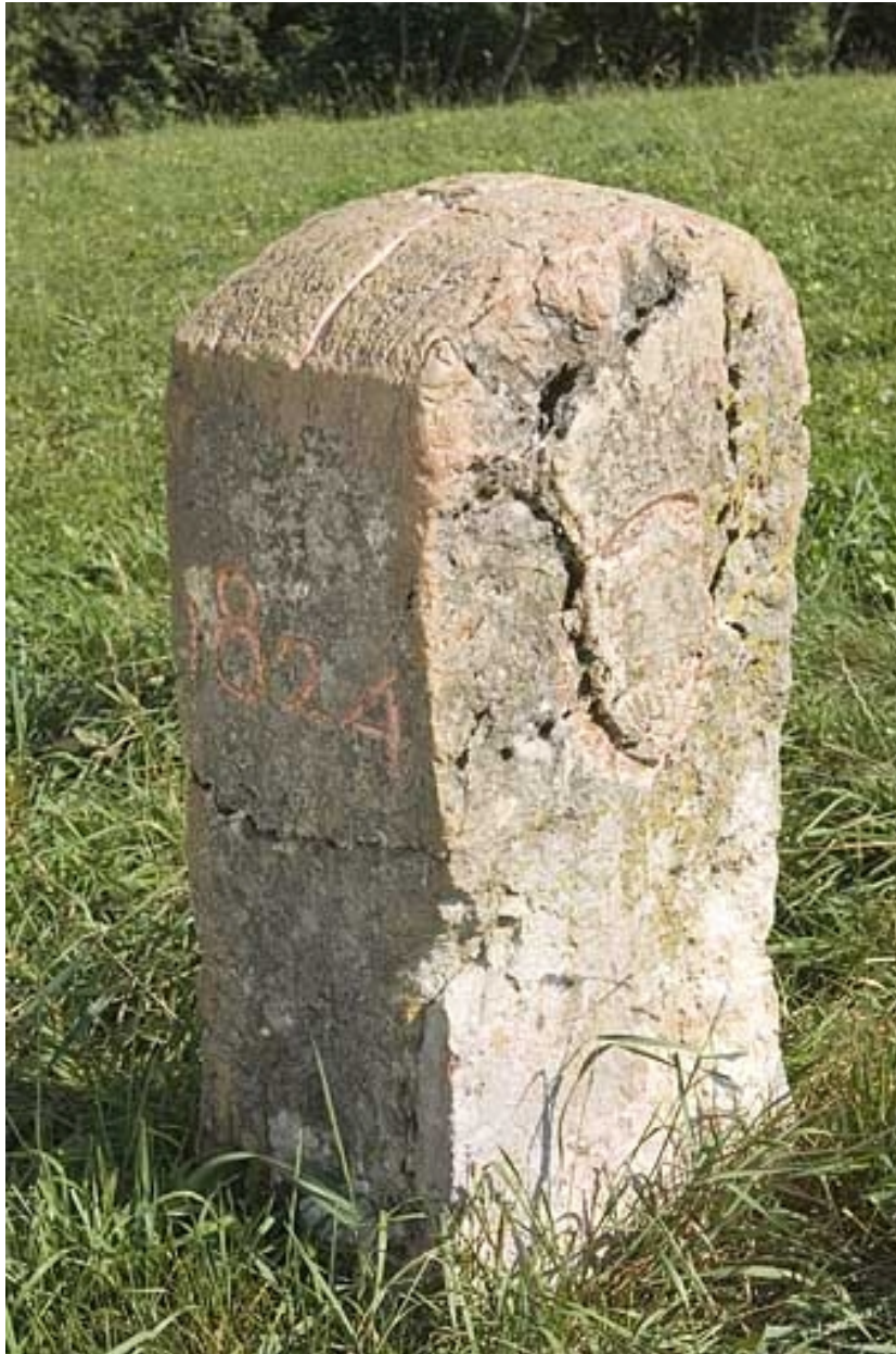
Borne n° 60 : côté Suisse.