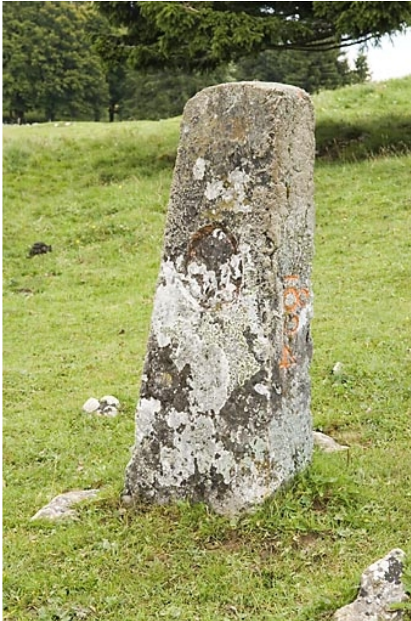
Borne n° 44 : fleur de lys côté France.