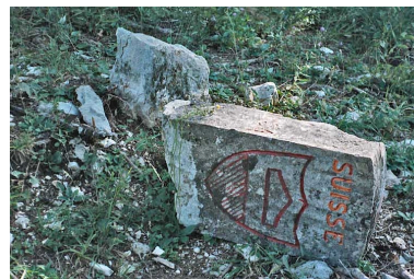
Borne cassée : écu côté Suisse. IVR43_20112500013NUC1A