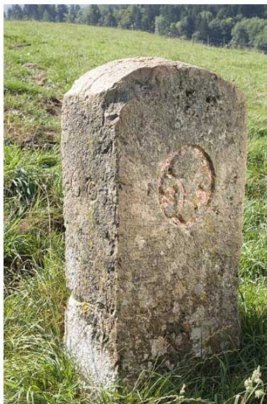
Borne n° 60 : fleur de lys côté France.