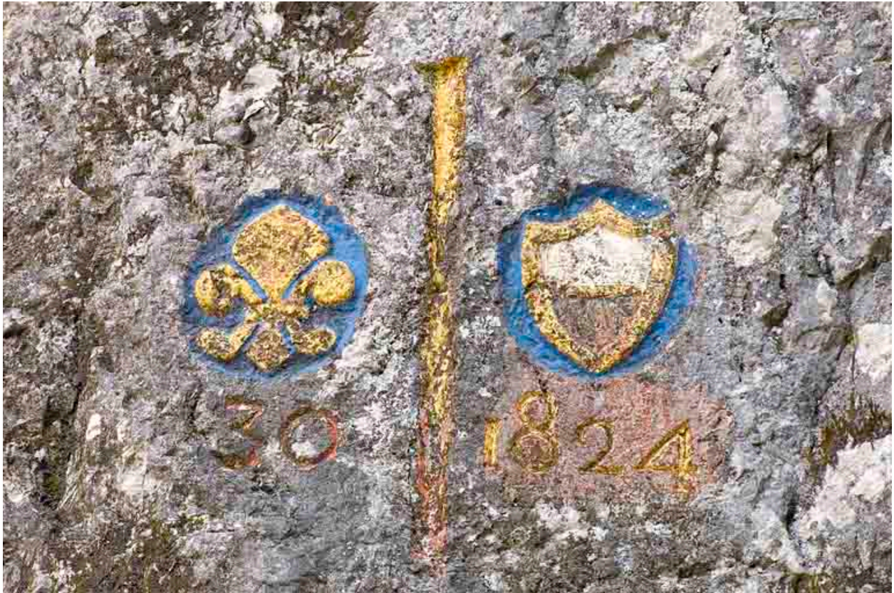
Borne n° 30 : fleur de lys et écu du canton de Vaud.