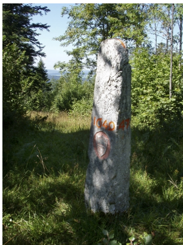
Borne n° 47 : écu du canton de Vaud côté Suisse.