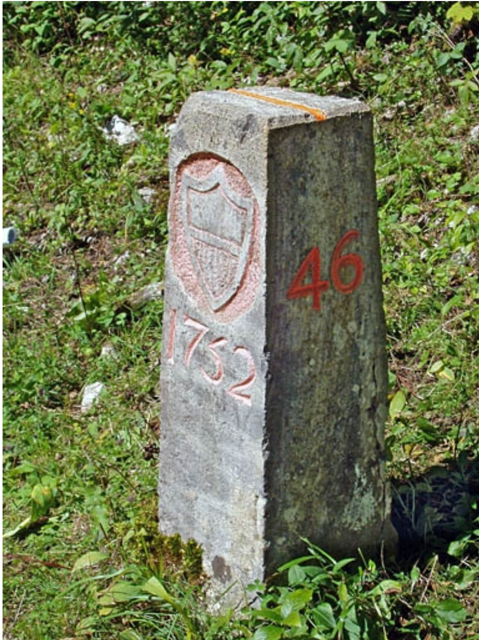
Borne n° 46 : écu du canton de Vaud côté Suisse.