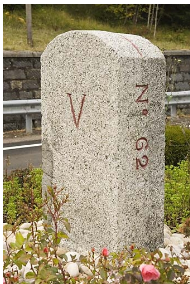
Borne n° 62, en granite : côté Suisse.