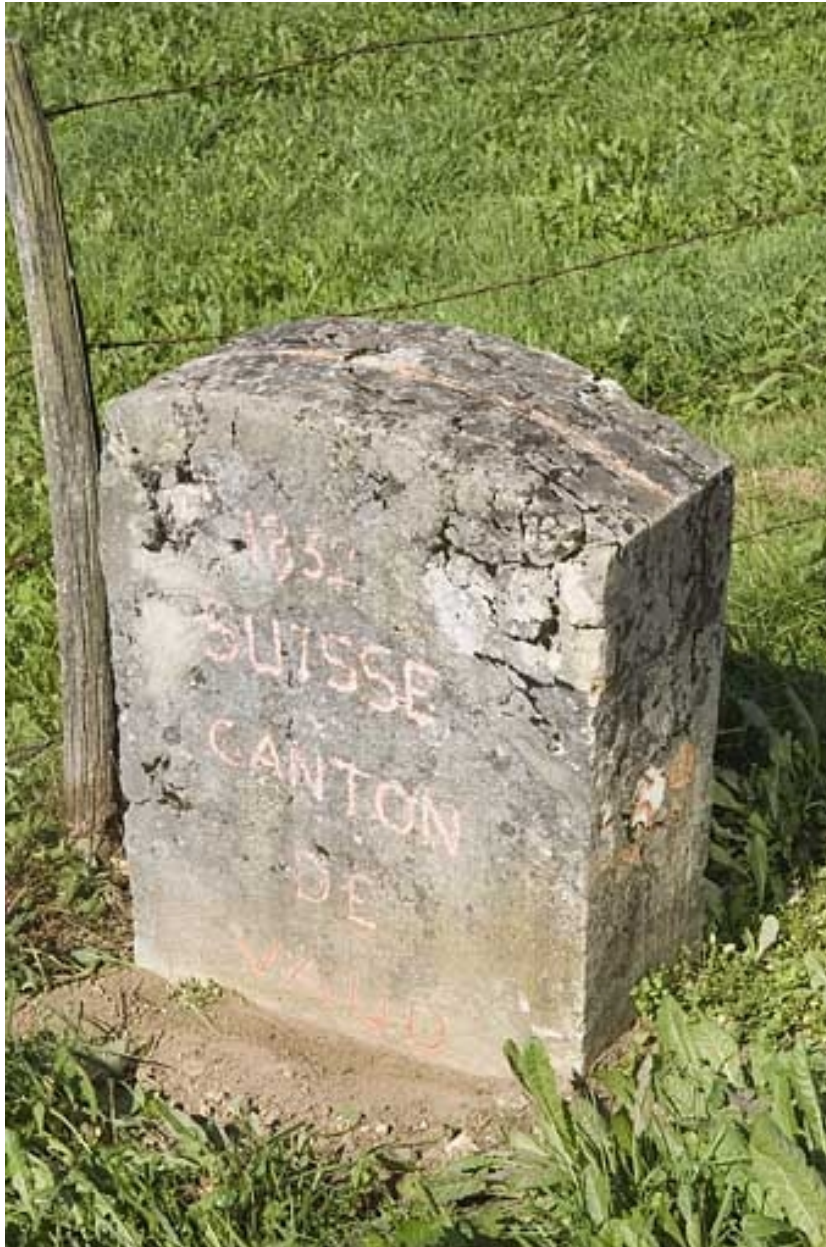
Borne n° 59 : inscription côté Suisse.