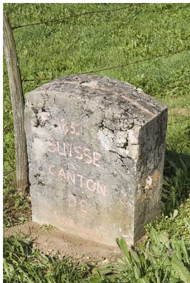
Borne n° 59 : inscription côté Suisse.