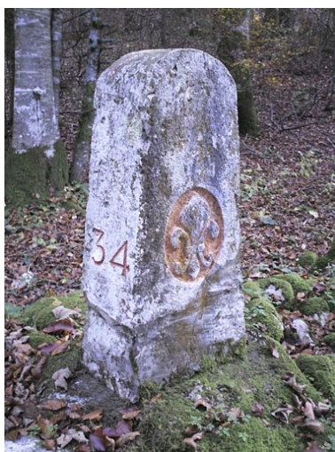
Borne n° 34 : fleur de lys côté France.