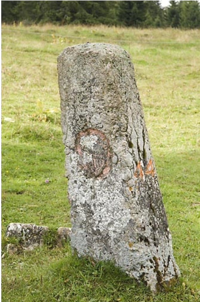
Borne n° 44 : écu du canton de Vaud côté Suisse.