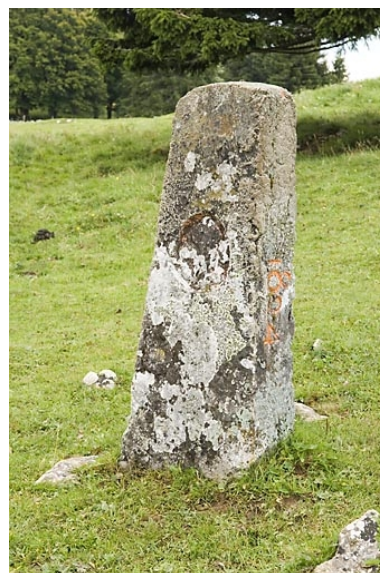
Borne n° 44 : fleur de lys côté France. IVR43_20082500932NUC2A