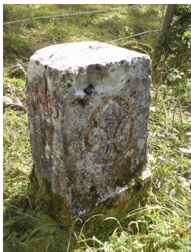
Borne n° 27 : fleur de lys côté France.