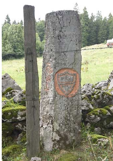
Borne n° 43 : écu du canton de Vaud côté Suisse.