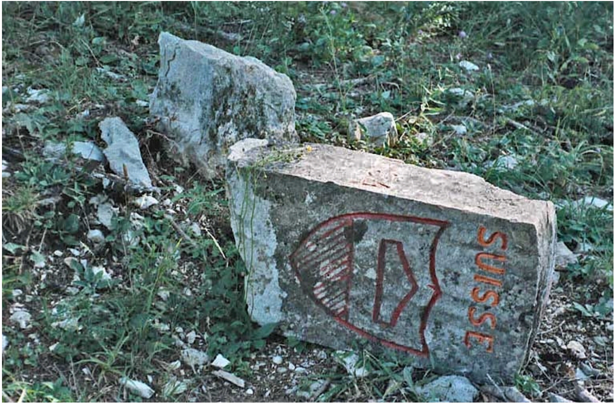
Borne cassée : écu côté Suisse.