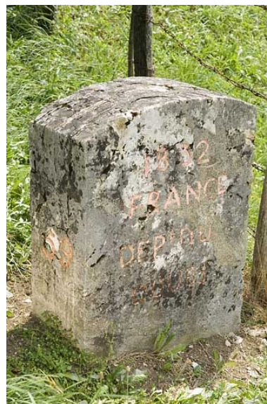
Borne n° 59 : inscription côté France. IVR43_20092500938NUC2A