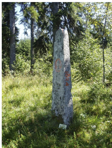
Borne n° 47 : fleur de lys côté France.