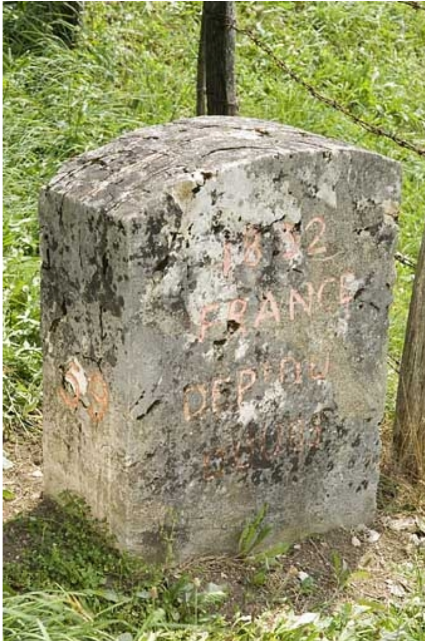
Borne n° 59 : inscription côté France.