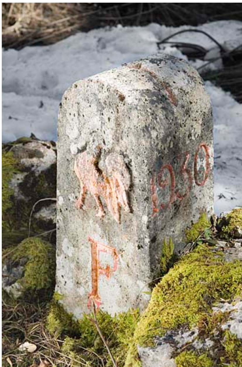
Borne n° 20.