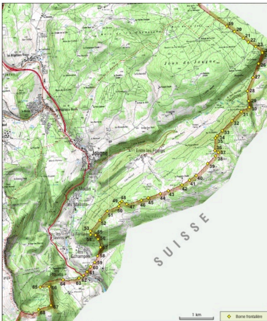
Carte de localisation. Extrait de la carte IGN, échelle 1/25 000 réduite à 1/43 956.