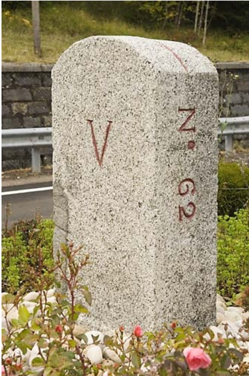
Borne n° 62, en granite : côté Suisse.