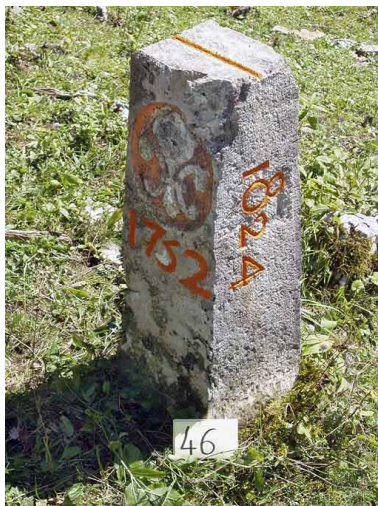
Borne n° 46 : fleur de lys côté France. IVR43_20112500001NUC1A