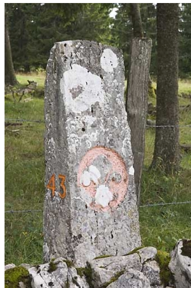
Borne n° 43 : fleur de lys côté France. IVR43_20082500936NUC2A