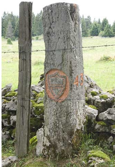
Borne n° 43 : écu du canton de Vaud côté Suisse.