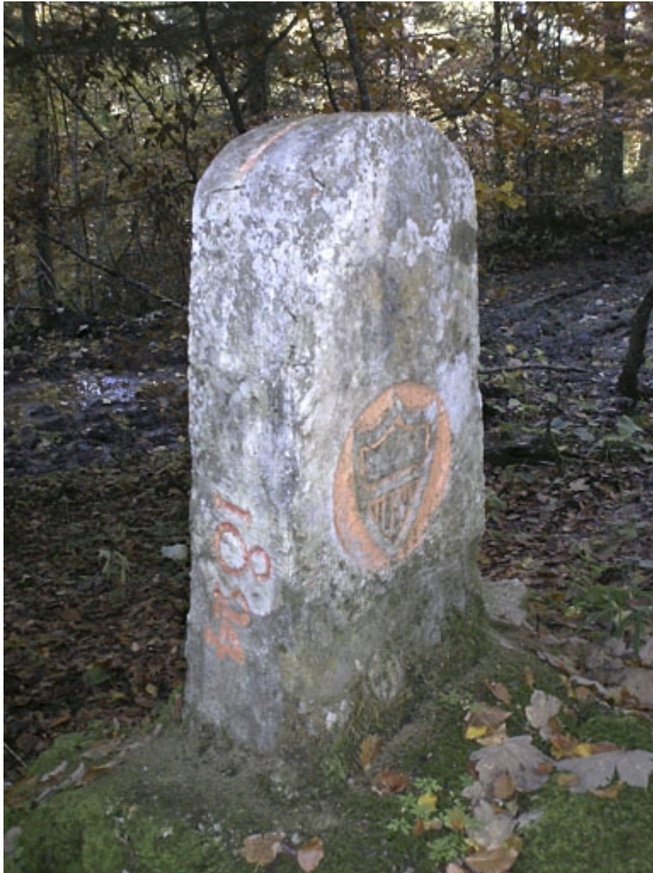
Borne n° 34 : écu du canton de Vaud côté Suisse.