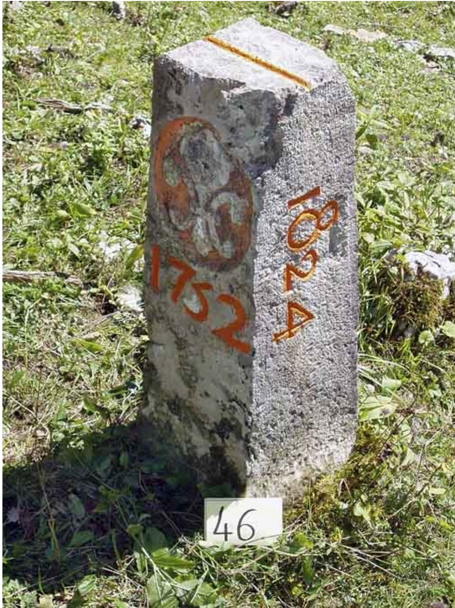
Borne n° 46 : fleur de lys côté France.