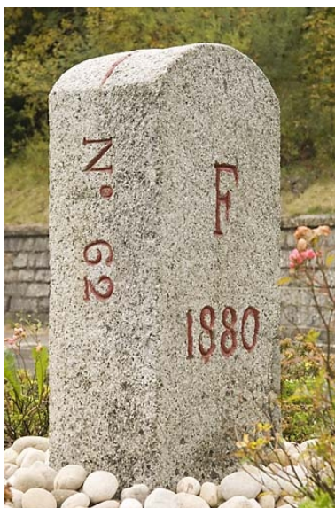
Borne n° 62, en granite : côté France. IVR43_20082500902NUC2A