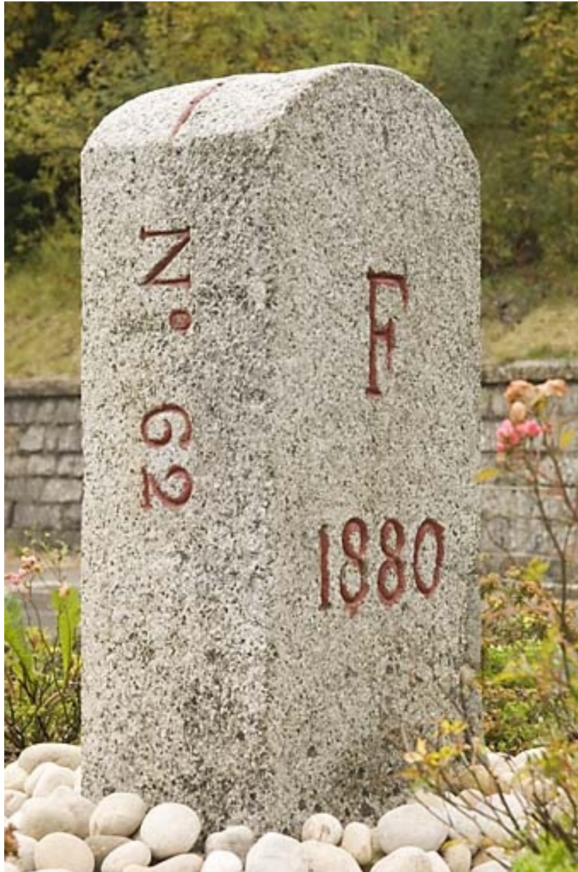
Borne n° 62, en granite : côté France.