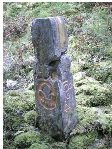
Borne n° 31 : fleur de lys côté France.