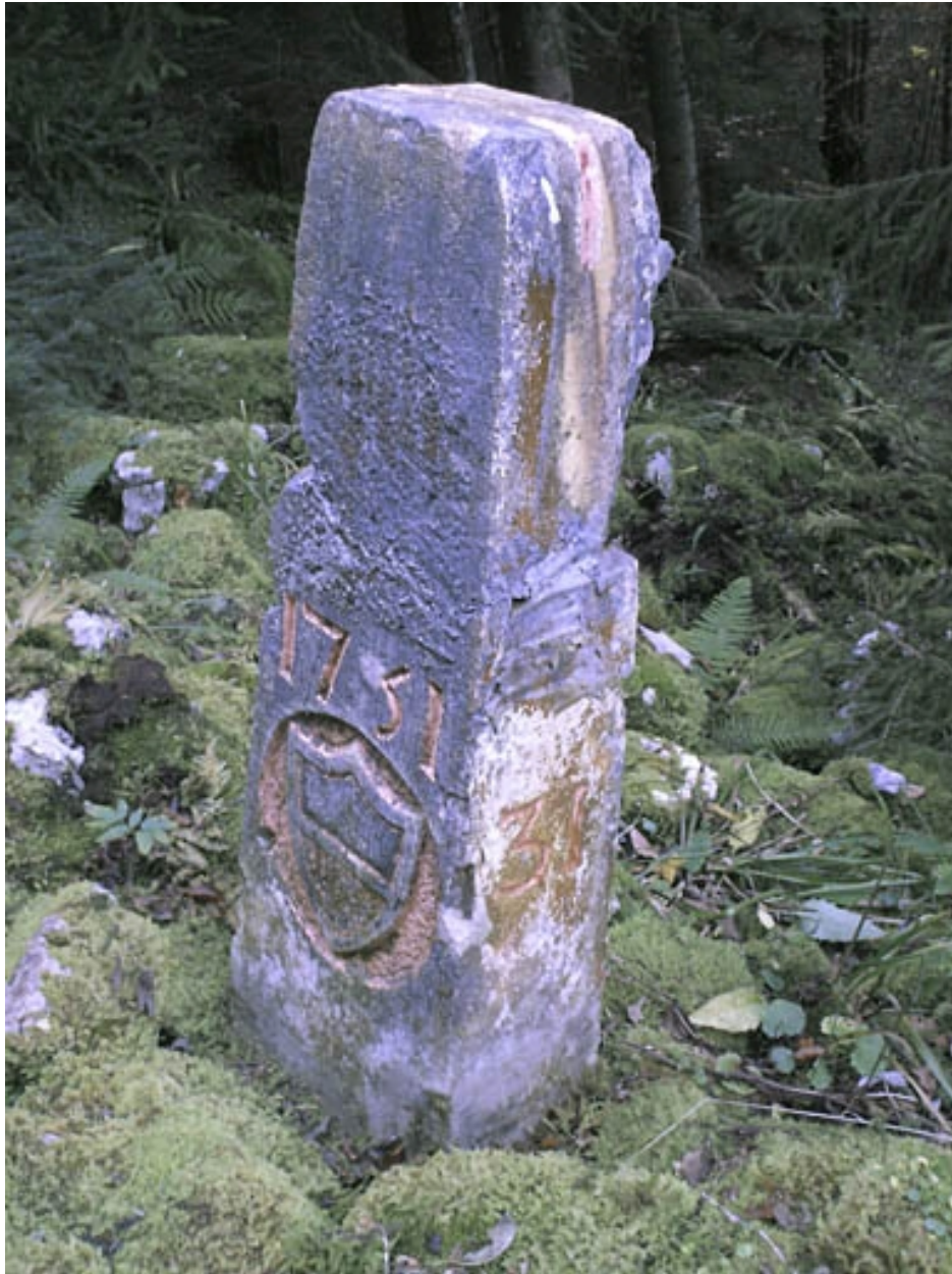
Borne n° 31 : écu du canton de Vaud côté Suisse.