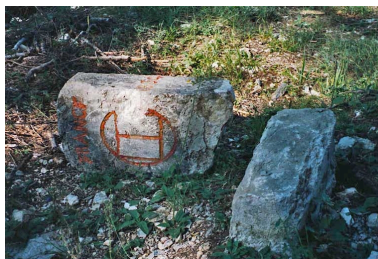
Borne cassée : décor au livre ouvert, côté France. IVR43_20112500014NUC1A