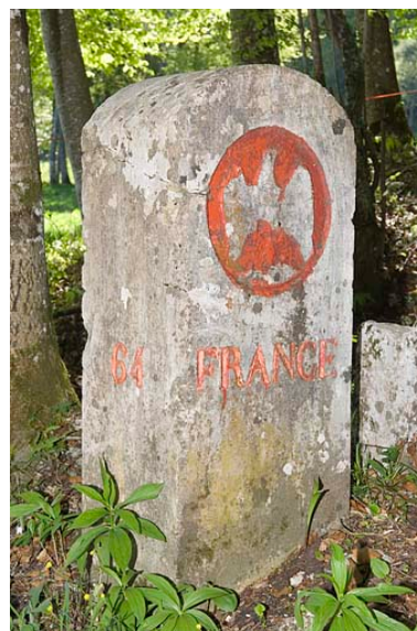
Borne n° 64 : aigle impérial côté France. IVR43_20092500483NUC2A