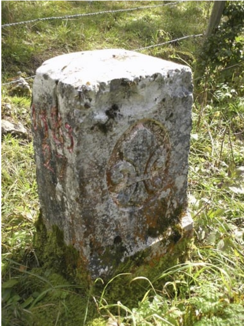
Borne n° 27 : fleur de lys côté France.