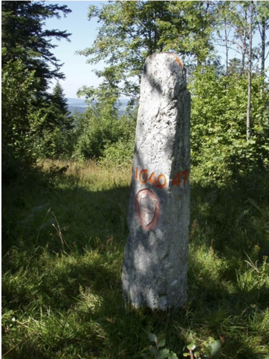
Borne n° 47 : écu du canton de Vaud côté Suisse.