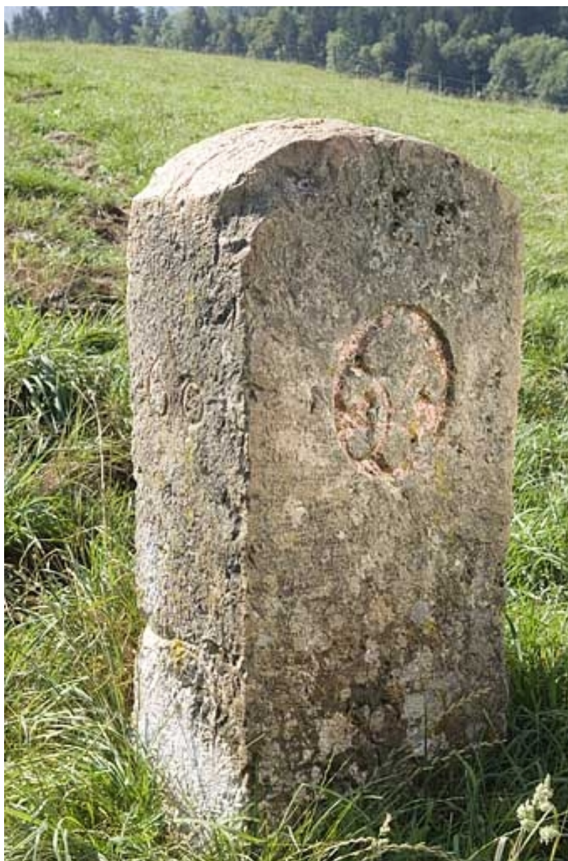
Borne n° 60 : fleur de lys côté France.