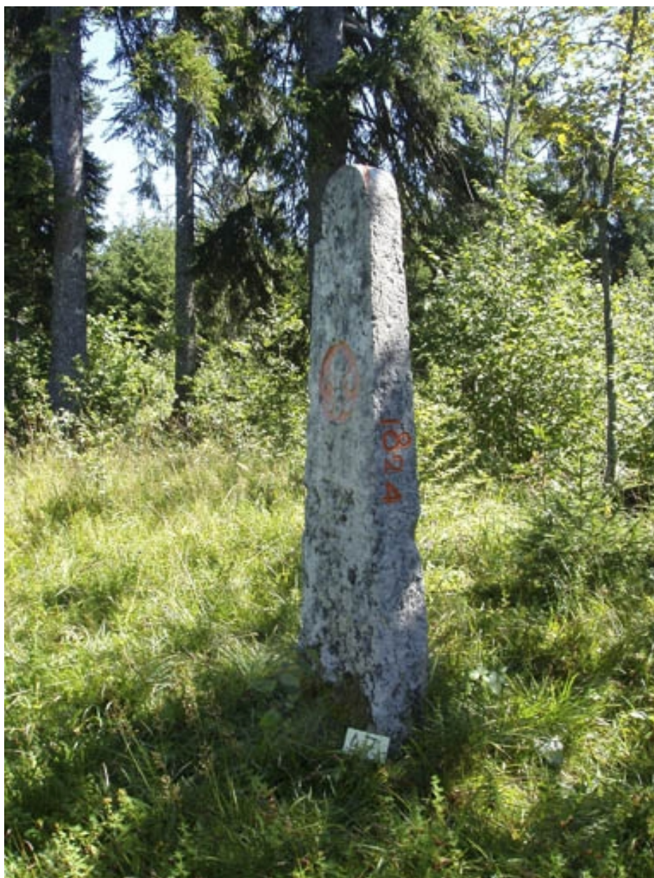
Borne n° 47 : fleur de lys côté France.