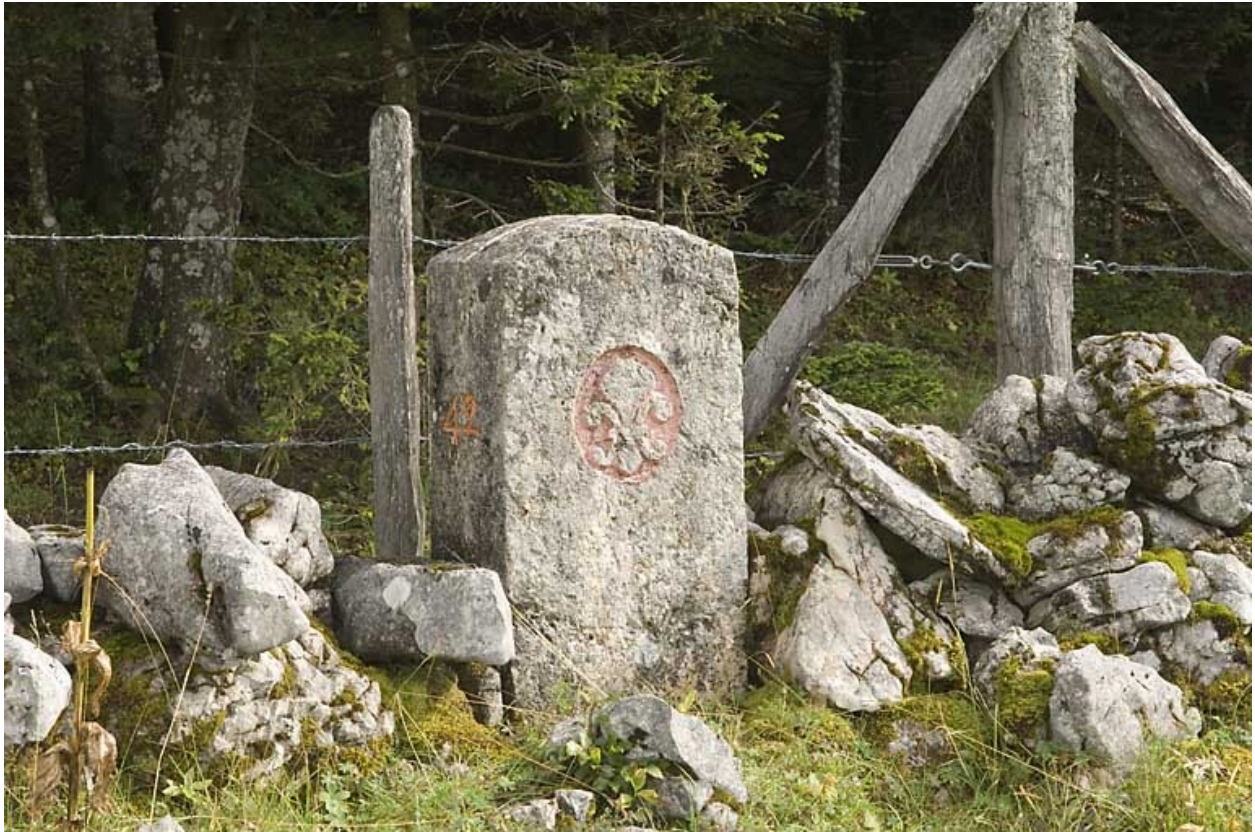
Borne n° 42 : fleur de lys côté France.