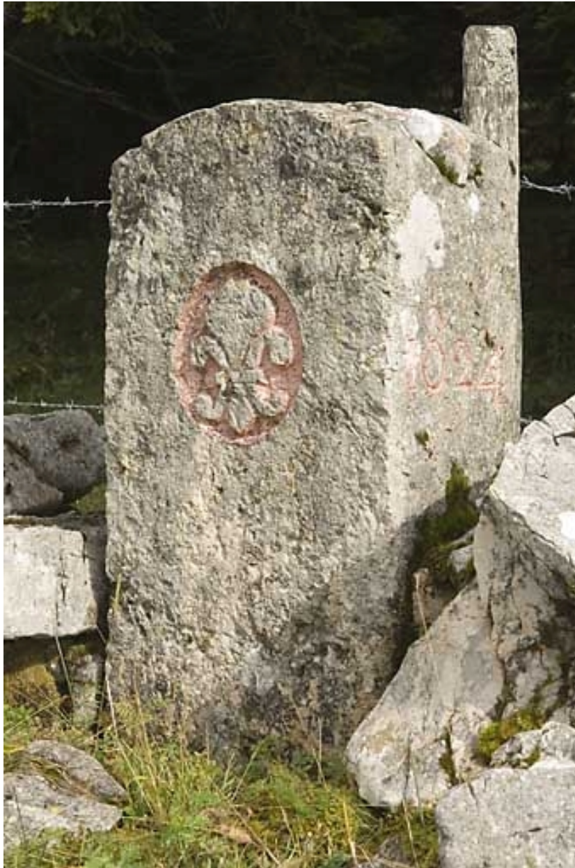
Borne n° 42 : fleur de lys côté France.