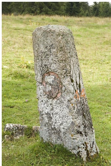
Borne n° 44 : écu du canton de Vaud côté Suisse.