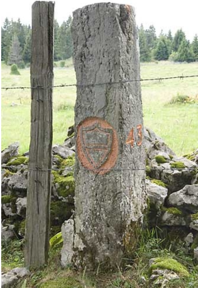
Borne n° 43 : écu du canton de Vaud côté Suisse.