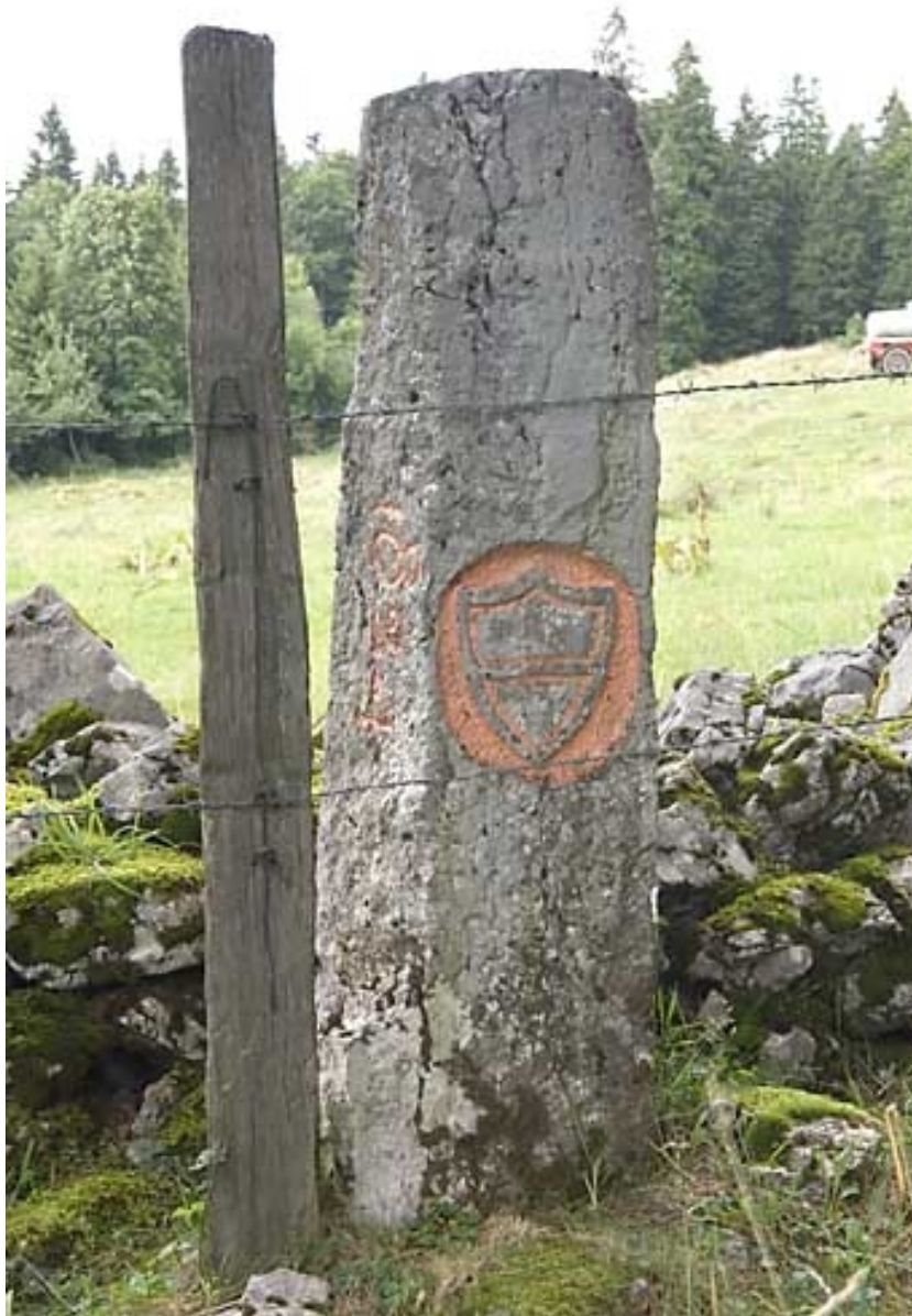
Borne n° 43 : écu du canton de Vaud côté Suisse.