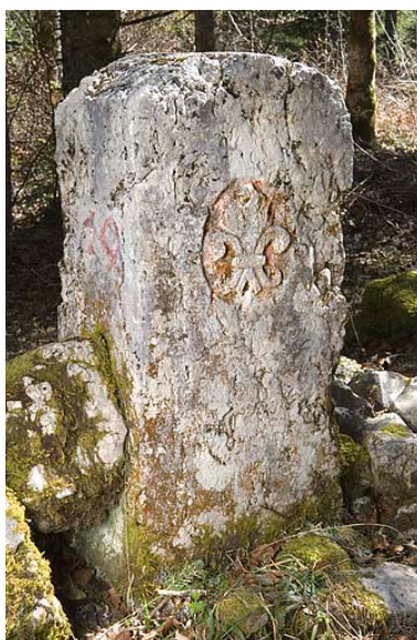
Borne n° 19 : fleur de lys côté France. IVR43_20092500481NUC2A