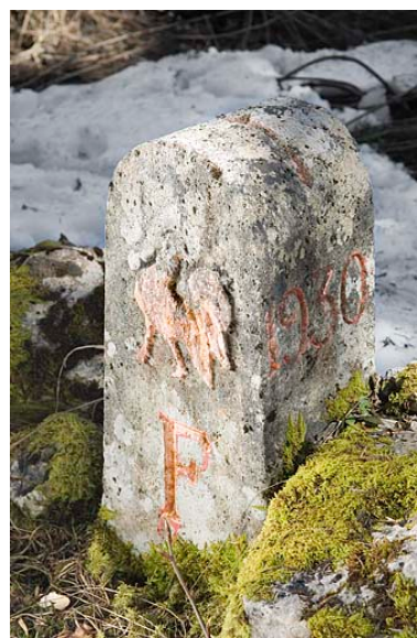
Borne n° 20. IVR43_20092500480NUC2A