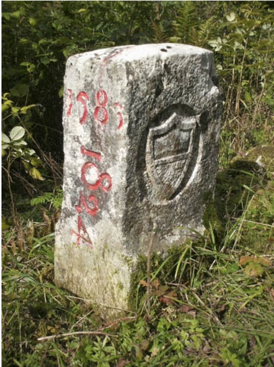
Borne n° 27 : écu du canton de Vaud côté Suisse.