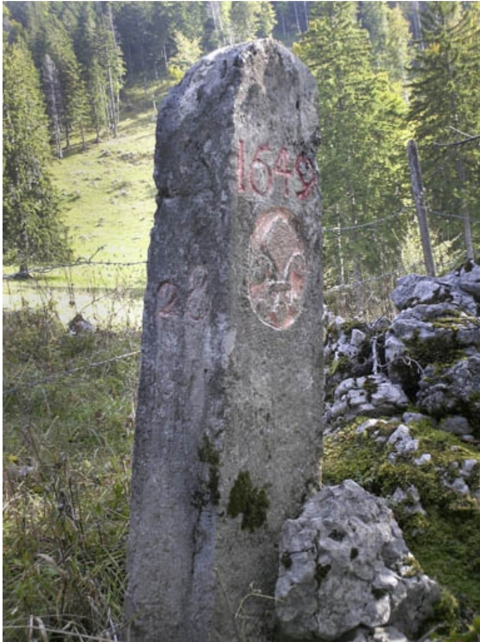
Borne n° 28 : fleur de lys côté France.