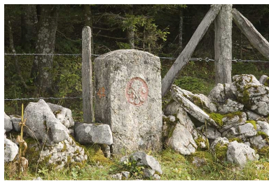
Borne n° 42 : fleur de lys côté France.