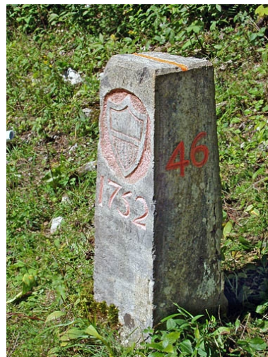
Borne n° 46 : écu du canton de Vaud côté Suisse. IVR43_20112500002NUC1A