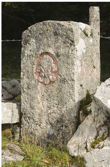
Borne n° 42 : fleur de lys côté France.