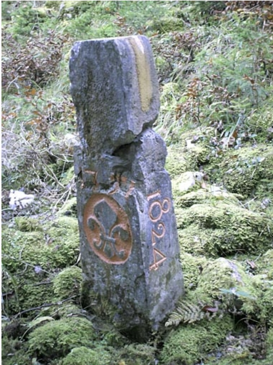
Borne n° 31 : fleur de lys côté France.