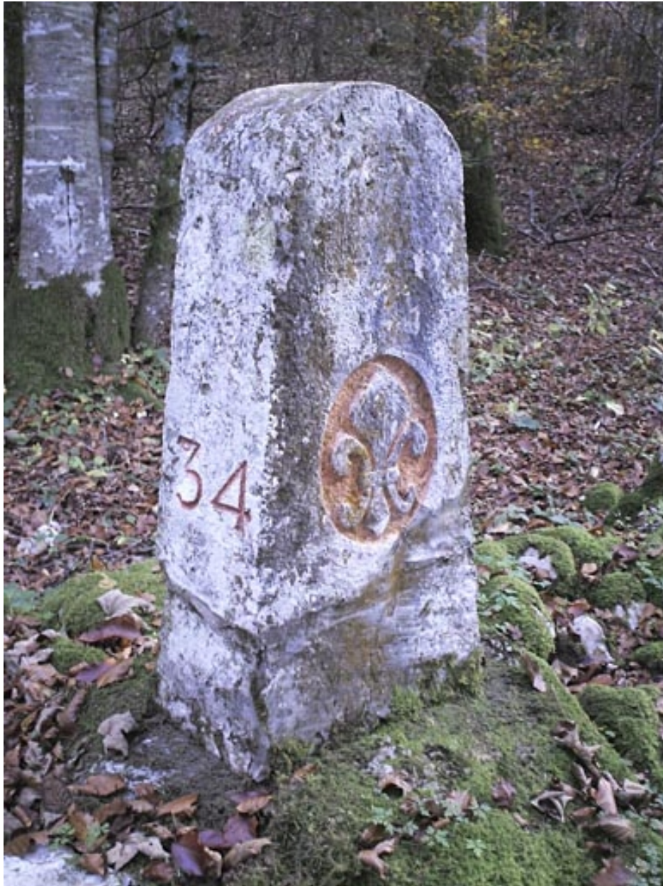
Borne n° 34 : fleur de lys côté France.