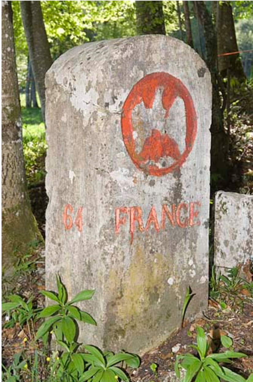
Borne n° 64 : aigle impérial côté France.