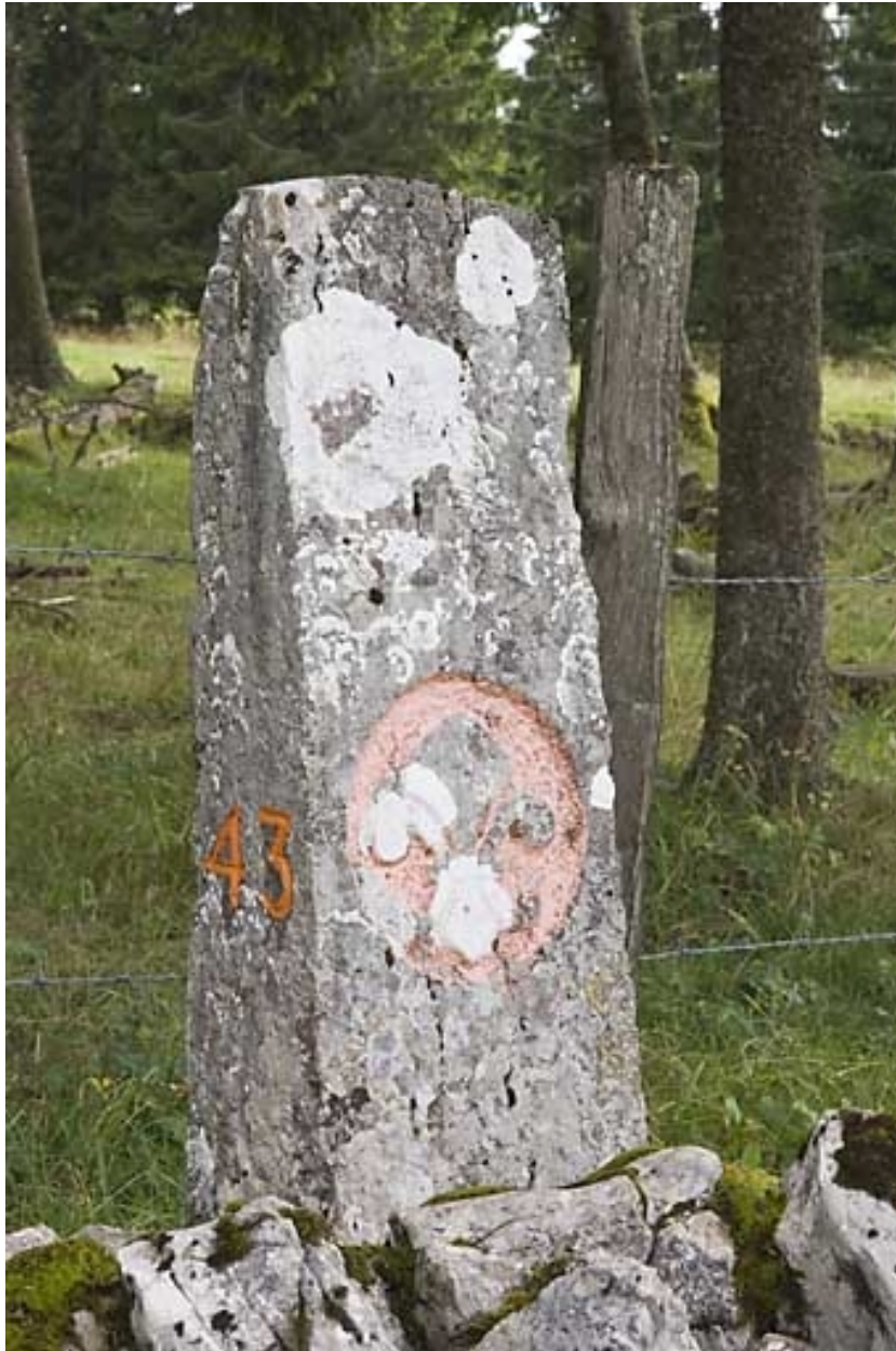
Borne n° 43 : fleur de lys côté France.