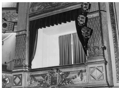
Loge du maire avant tx [travaux]. S.d. [1969]. IVR26_20222100767NUC2