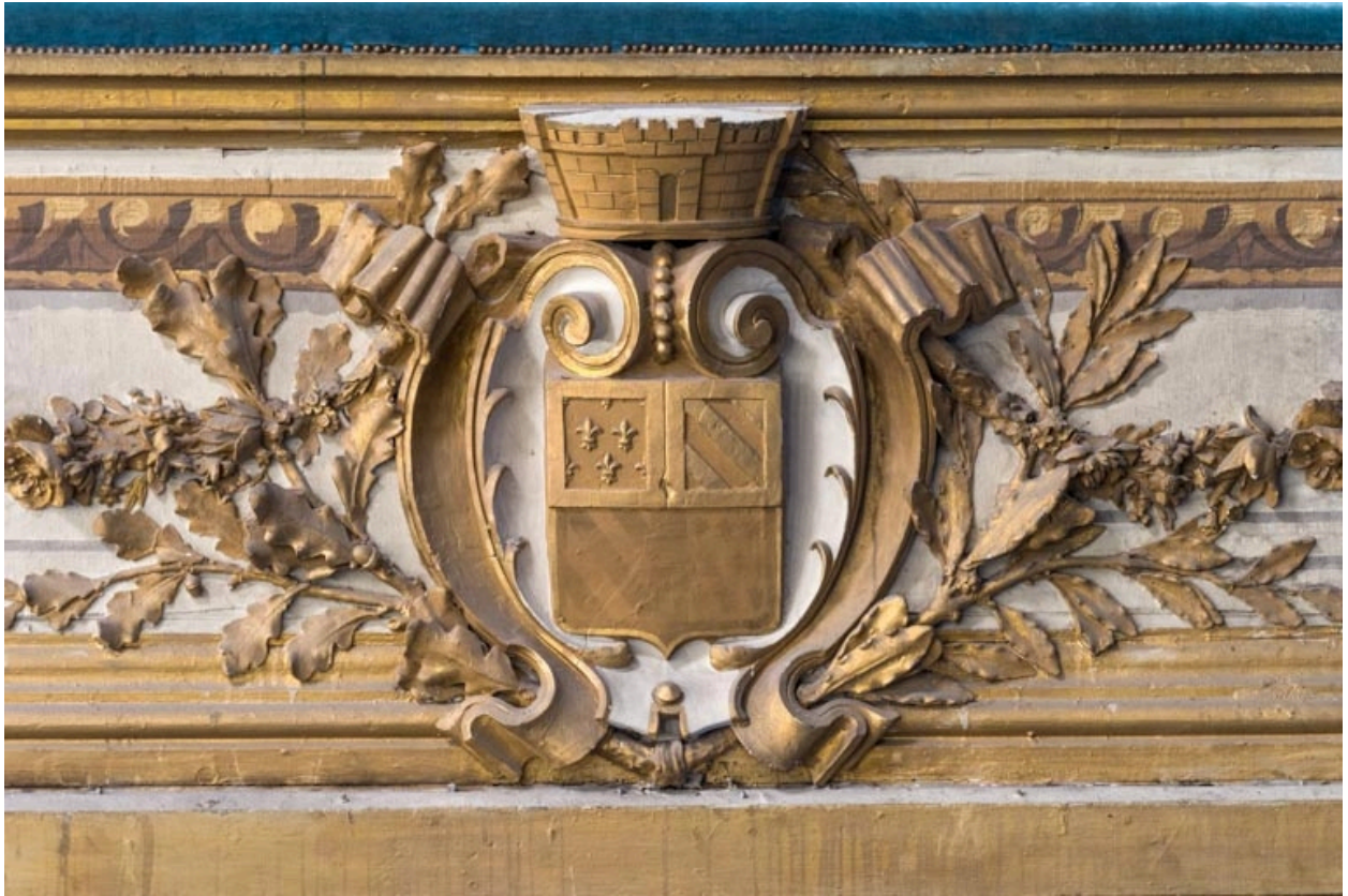
Armoiries de Dijon sur le garde-corps de la loge d'avant-scène côté cour, au 1er balcon.