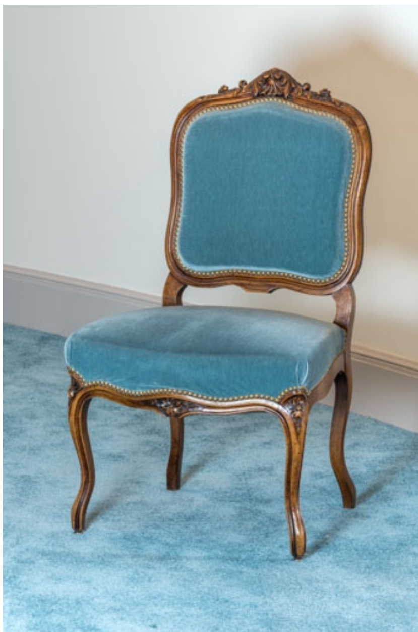
Chaise (récente) à dossier plat garni.