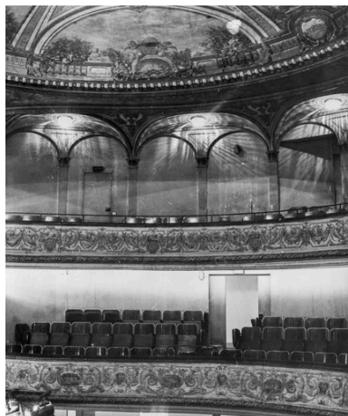
[2e et 3e balcons, avant travaux]. S.d. [1969].