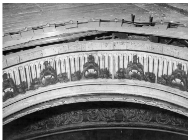
La salle - vue des combles par la couronne du plafond [avant travaux]. S.d. [1969].