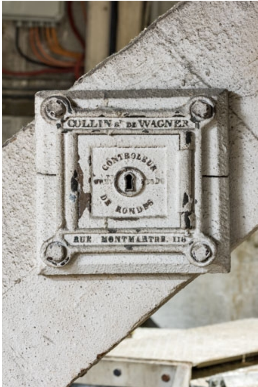
Contrôleur de ronde Collin (successeur de Wagner, 116 rue de Montmartre à Paris), dans le comble au-dessus de la salle.