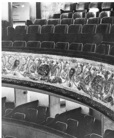
[Loges du 1er balcon et 2e balcon, avant travaux]. S.d. [1969].