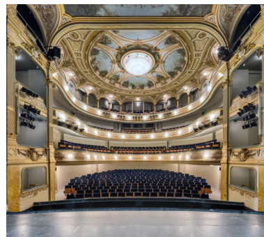
La salle vue depuis la scène.