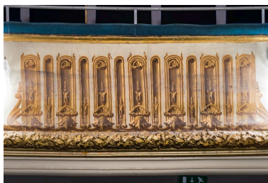
Décor peint du garde-corps du 3e balcon.