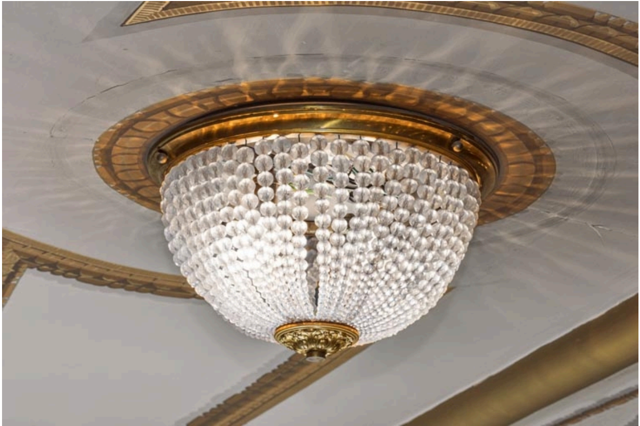
Lustre au 3e balcon.