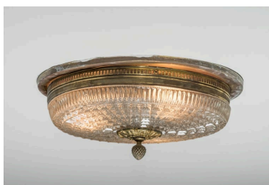
Plafonnier dans le couloir desservant le 1er balcon. IVR26_20222100588NUC4A