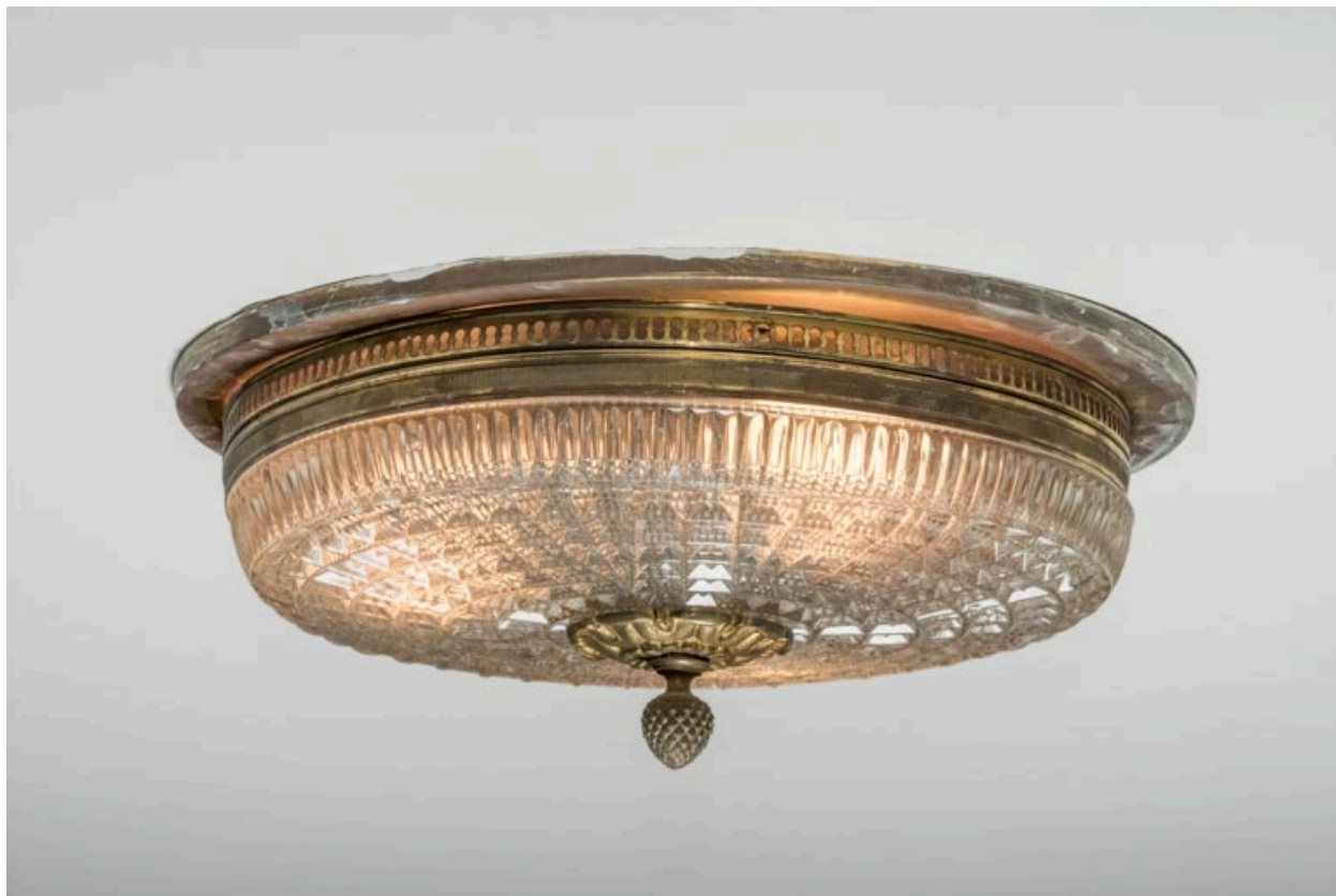
Plafonnier dans le couloir desservant le 1er balcon.