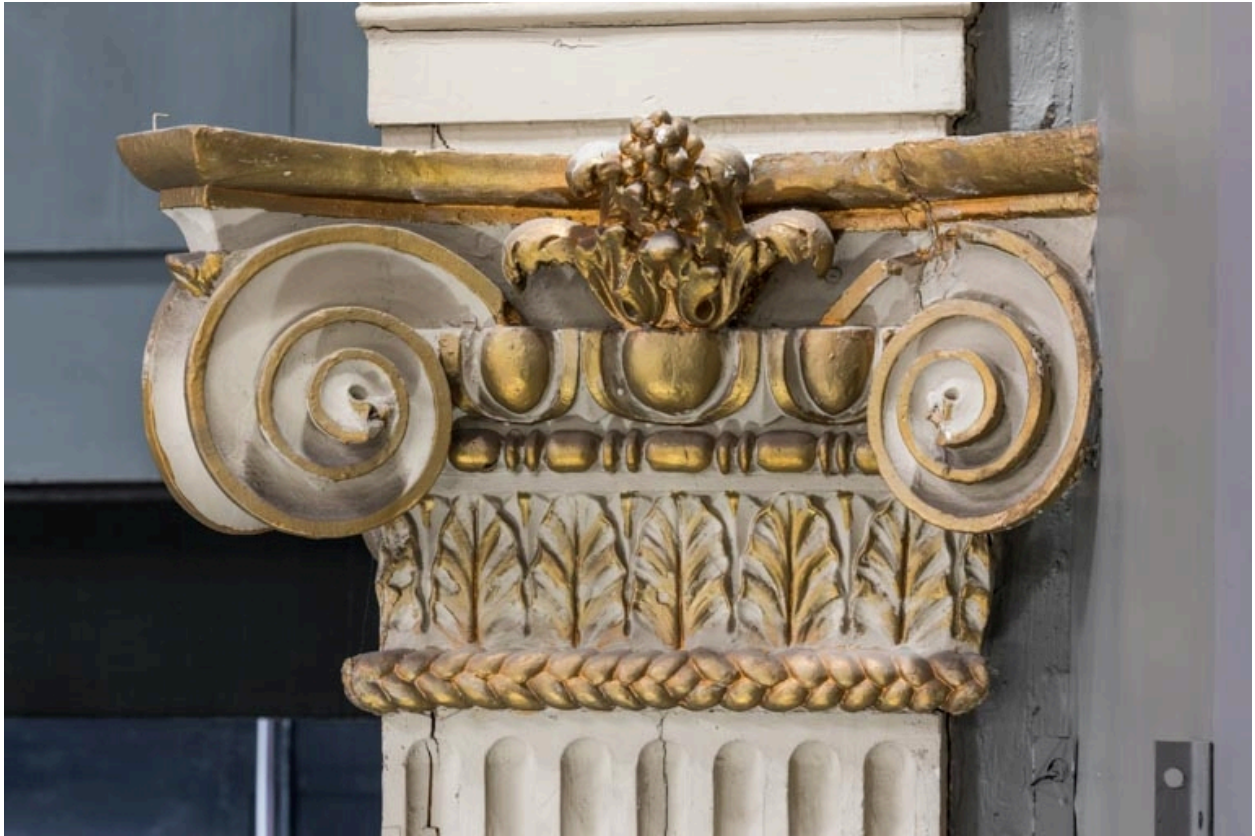
Chapiteau d'un pilastre des loges d'avant-scène.