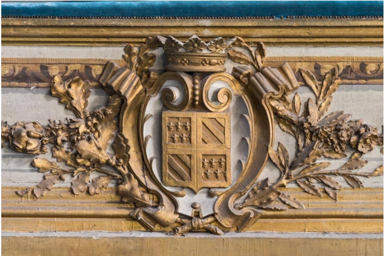
Armoiries de Bourgogne sur le garde-corps de la loge d'avant-scène côté jardin, au 1er balcon.