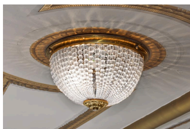
Lustre au 3e balcon. IVR26_20222100623NUC4A