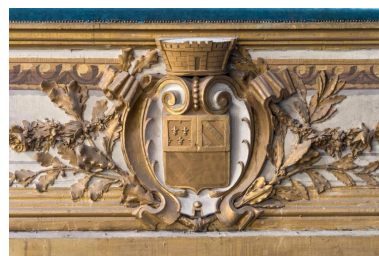
Armoiries de Dijon sur le garde-corps de la loge d'avant-scène côté cour, au 1er balcon.