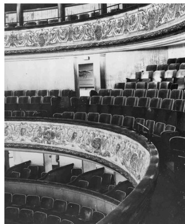
[2e balcon, avant travaux]. S.d. [1969].