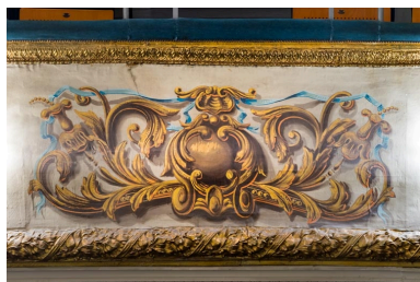
Décor peint du garde-corps d'un balcon. IVR26_20222100610NUC4A