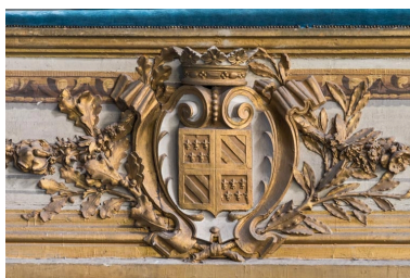
Armoiries de Bourgogne sur le garde-corps de la loge d'avant-scène côté jardin, au 1er balcon. IVR26_20222100608NUC4A