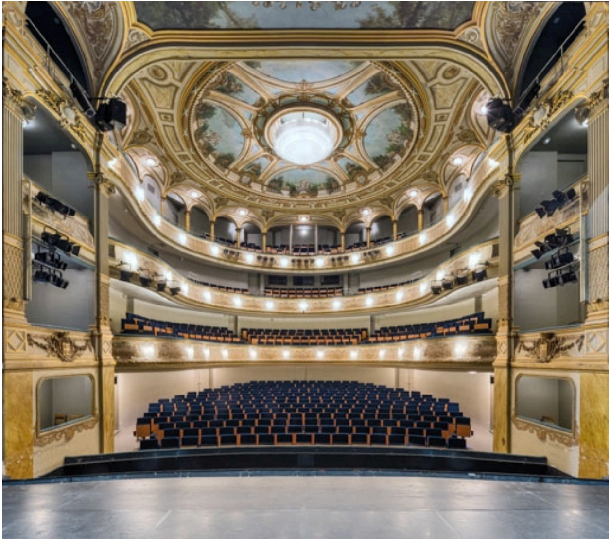
La salle vue depuis la scène.