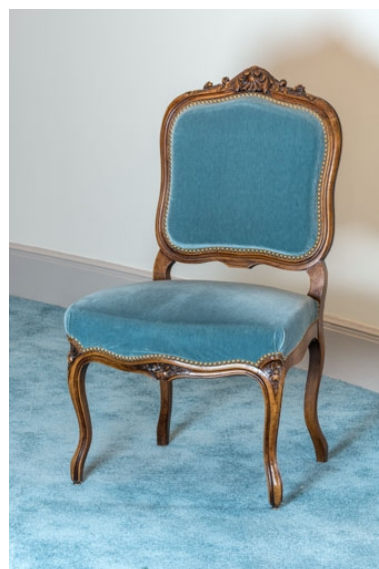
Chaise (récente) à dossier plat garni. IVR26_20222100580NUC4A