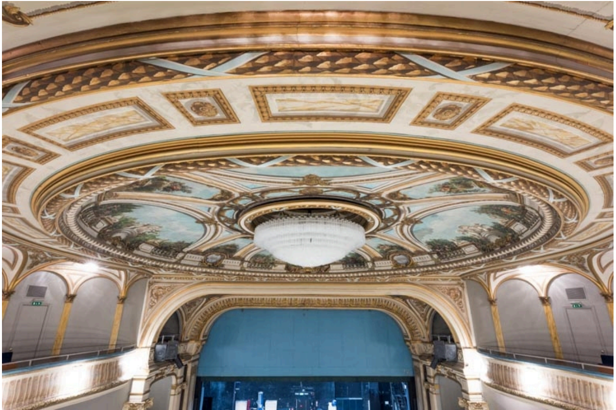
Plafond et lustre de la salle.