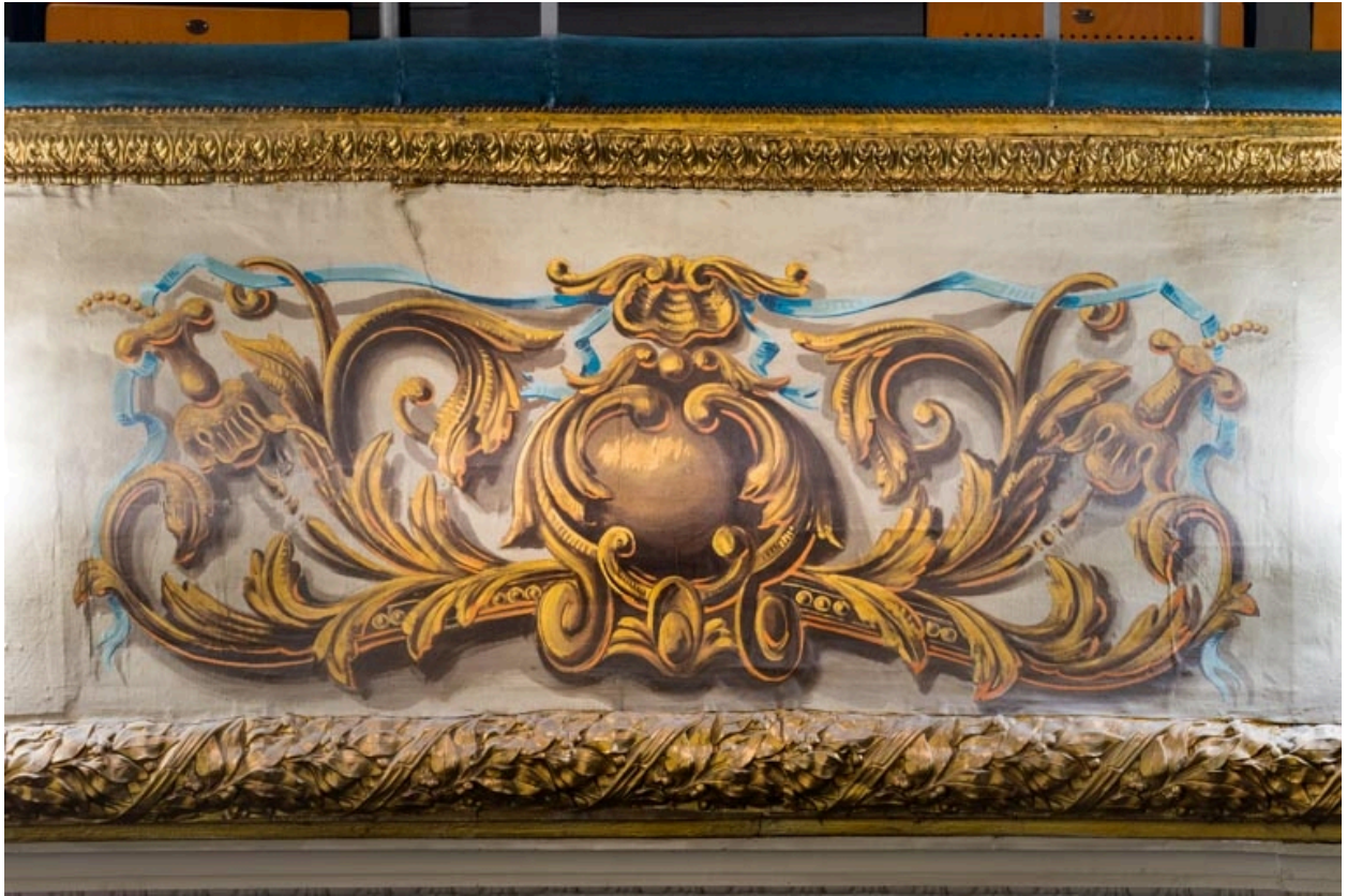
Décor peint du garde-corps d'un balcon.