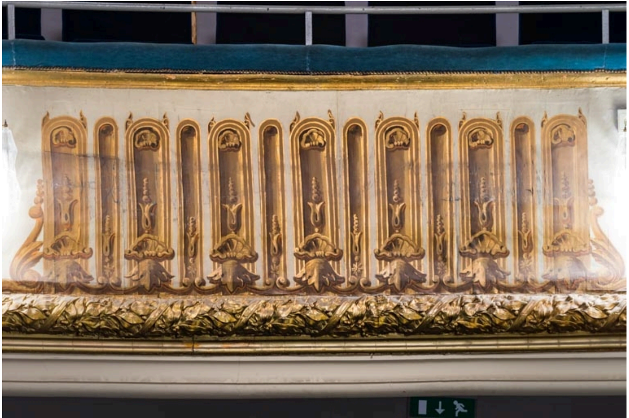
Décor peint du garde-corps du 3e balcon.