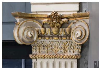
Chapiteau d'un pilastre des loges d'avant-scène.