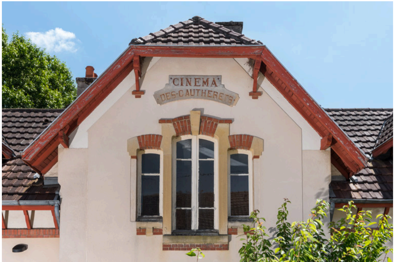
Façade antérieure : mur pignon, avec inscription.