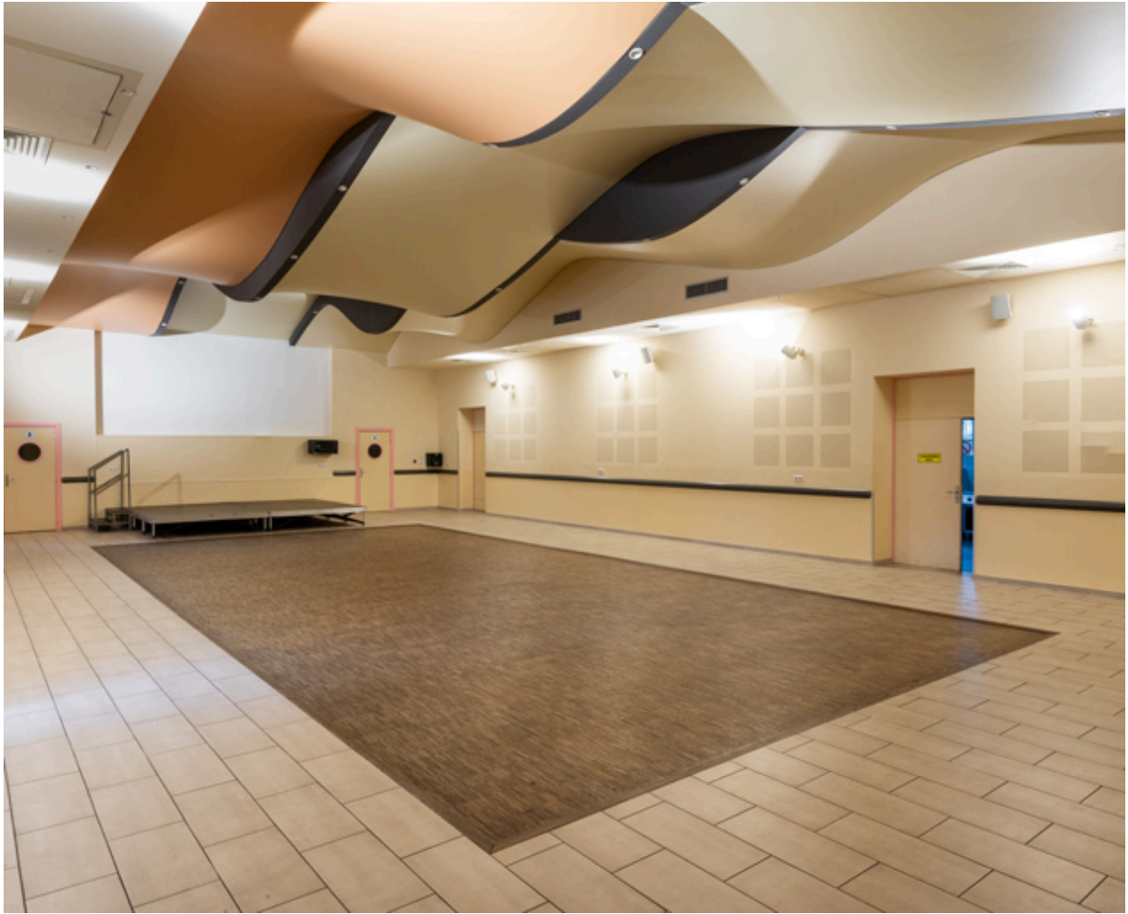
La salle, vue de trois quarts.