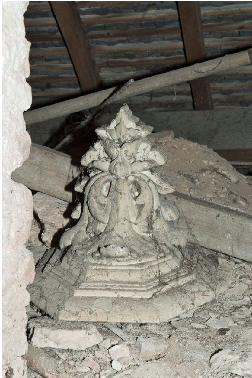
Vue d'ensemble d'une console.