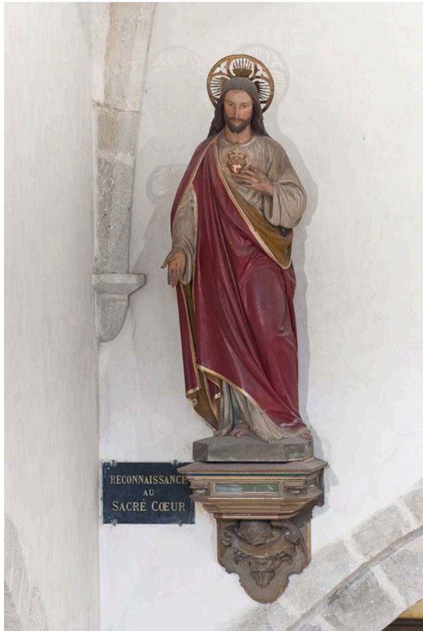
Statue du Sacré-Coeur : vue d'ensemble.