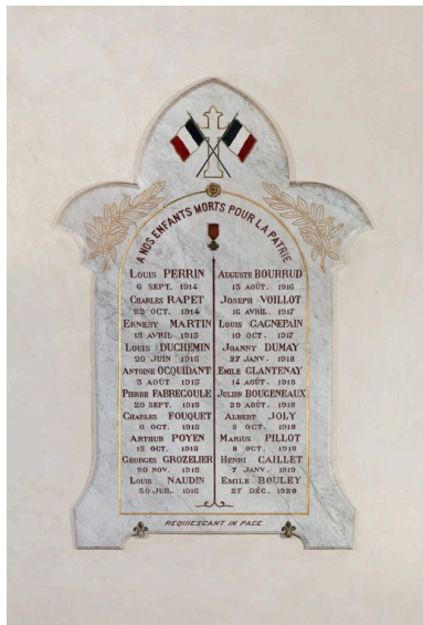
Vue d'ensemble d'une plaque commémorative.