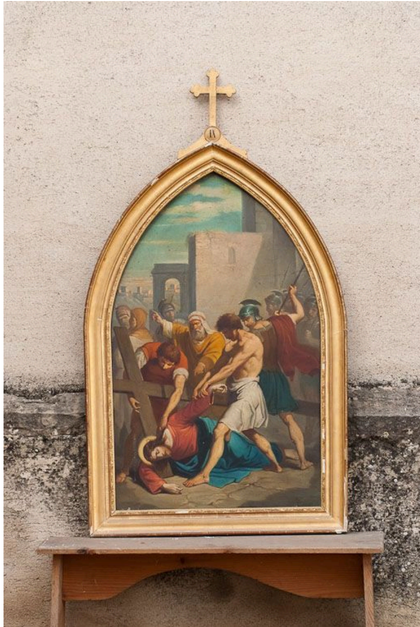
Chemin de croix : vue de la IXe station.