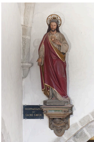
Statue du Sacré-Coeur : vue d'ensemble. IVR26_20112100171NUC2A