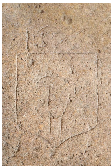
Détail de la dalle funéraire.