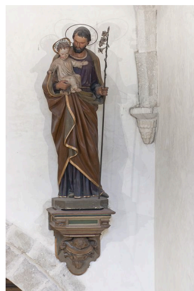
Statue de saint Joseph et l'Enfant Jésus : vue d'ensemble. IVR26_20112100170NUC2A