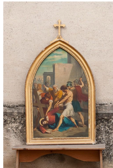
Chemin de croix : vue de la IXe station. IVR26_20112100353NUC2A