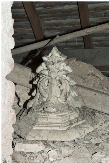
Vue d'ensemble d'une console.