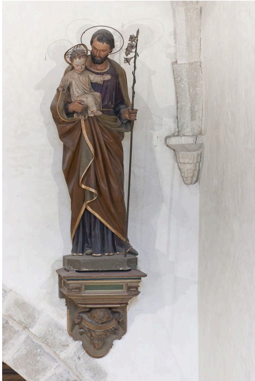
Statue de saint Joseph et l'Enfant Jésus : vue d'ensemble.