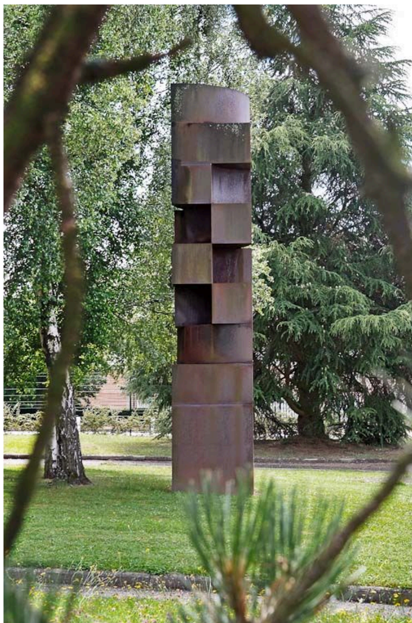
Vue d'ensemble, latérale.