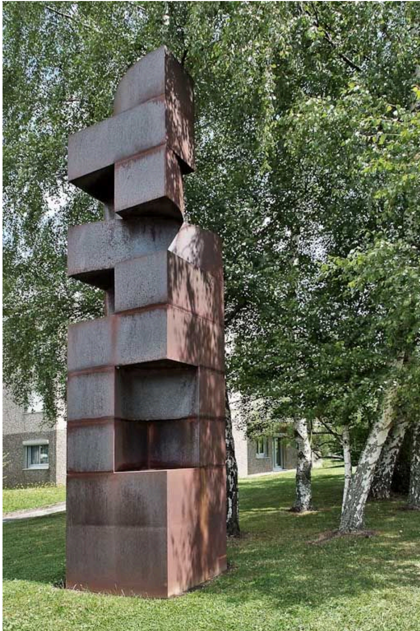
Vue de trois-quarts.