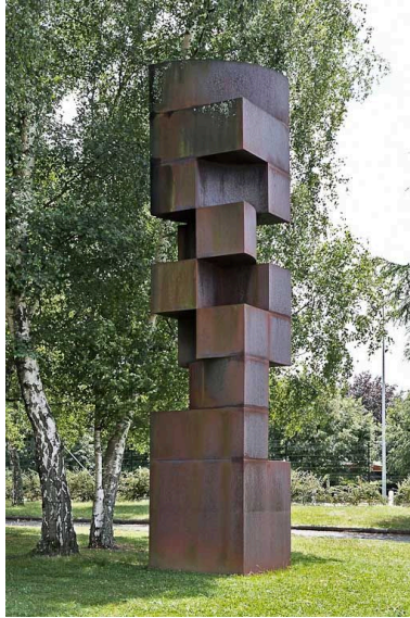
Vue de trois-quarts. IVR26_20097100439NUC2A