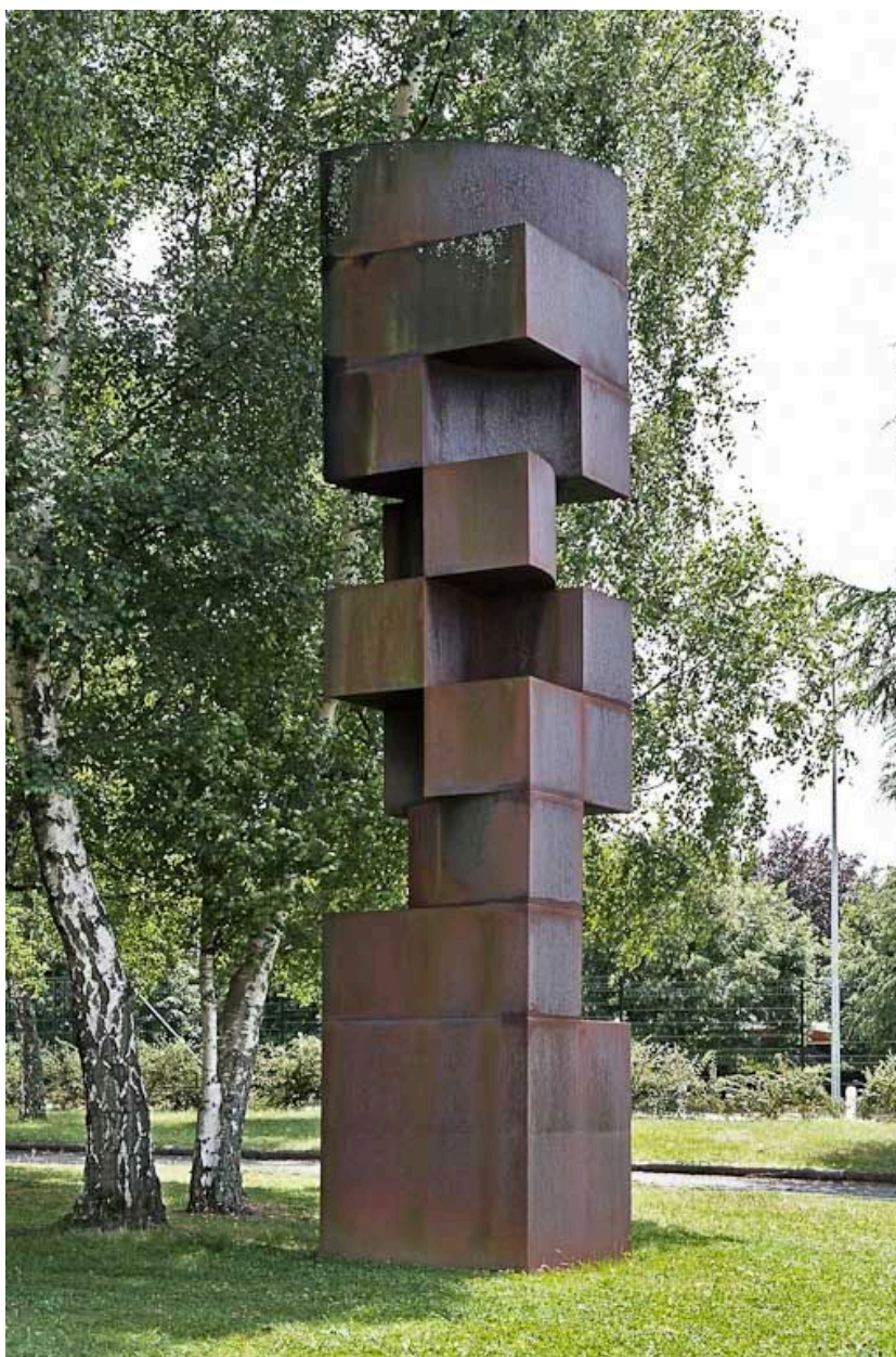
Vue de trois-quarts.