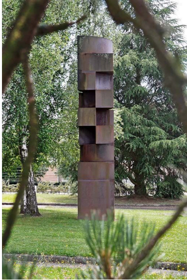
Vue d'ensemble, latérale. IVR26_20097100442NUC2A