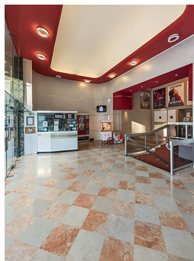
Vestibule. Les salles 3 à 6 (en sous-sol) sont desservies par l'escalier à droite, la salle 1 par la porte visible derrière lui.