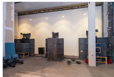
Salle 1 : installation de sonorisation sur la scène conservée à l'arrière de l'écran. IVR26_20212100307NUC4A