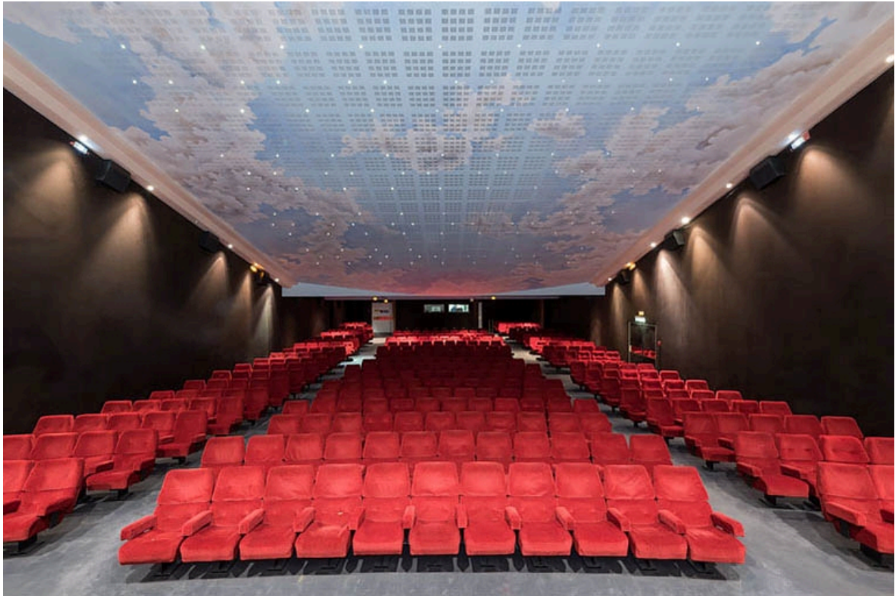
Salle 1 : vue depuis l'écran.