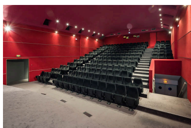
Salle 2 : vue depuis l'écran. IVR26_20212100311NUC4A