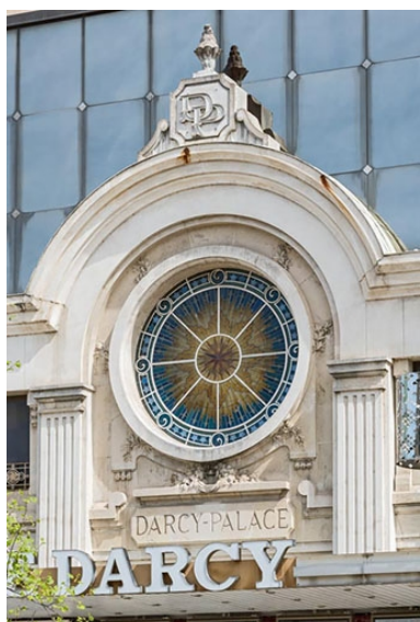
Façade antérieure, étage : partie centrale avec l'oculus. IVR26_20222100219NUC4A