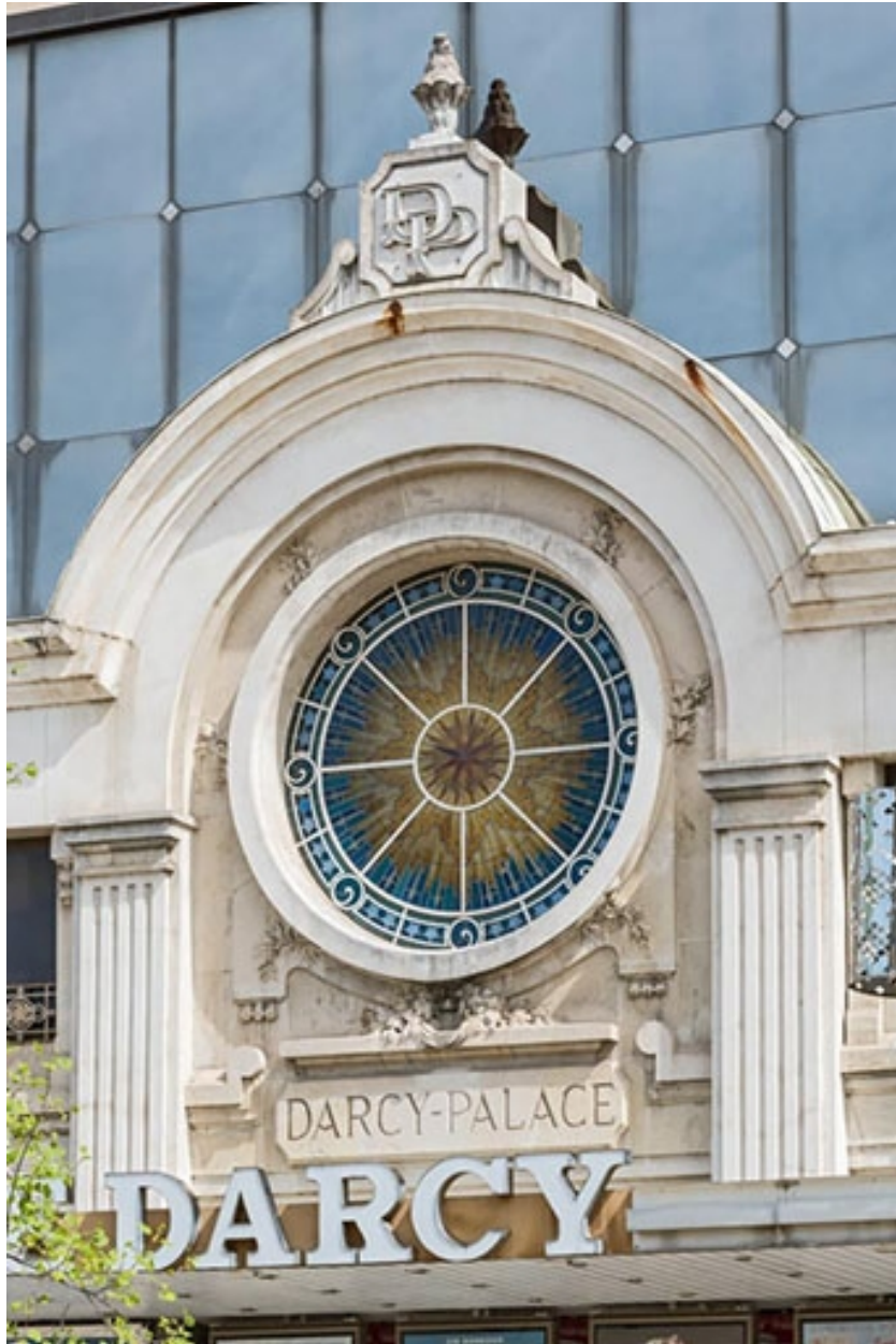
Façade antérieure, étage : partie centrale avec l'oculus.