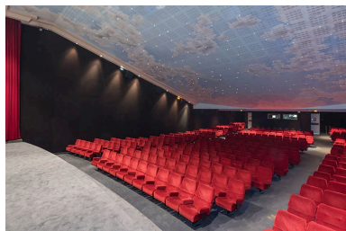
Salle 1 : vue depuis l'écran, de trois quarts droite. IVR26_20212100304NUC4A