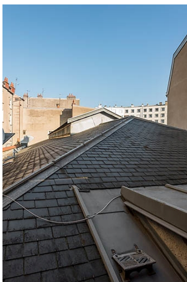
Le toit du cinéma, vu depuis la façade écran. IVR26_20212100324NUC4A