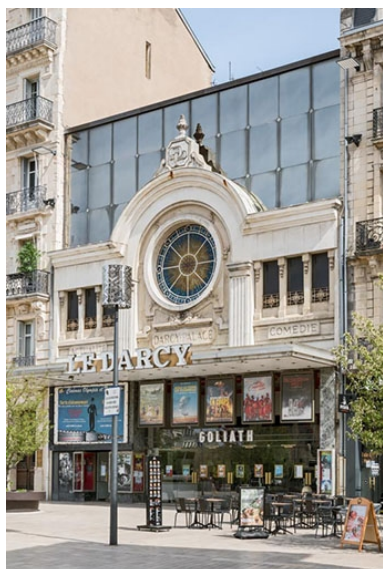
Façade antérieure, de trois quarts droite. IVR26_20222100217NUC4A