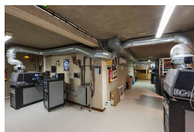
Cabine centrale, avec ses projecteurs numériques desservant les salles 3 à 5.