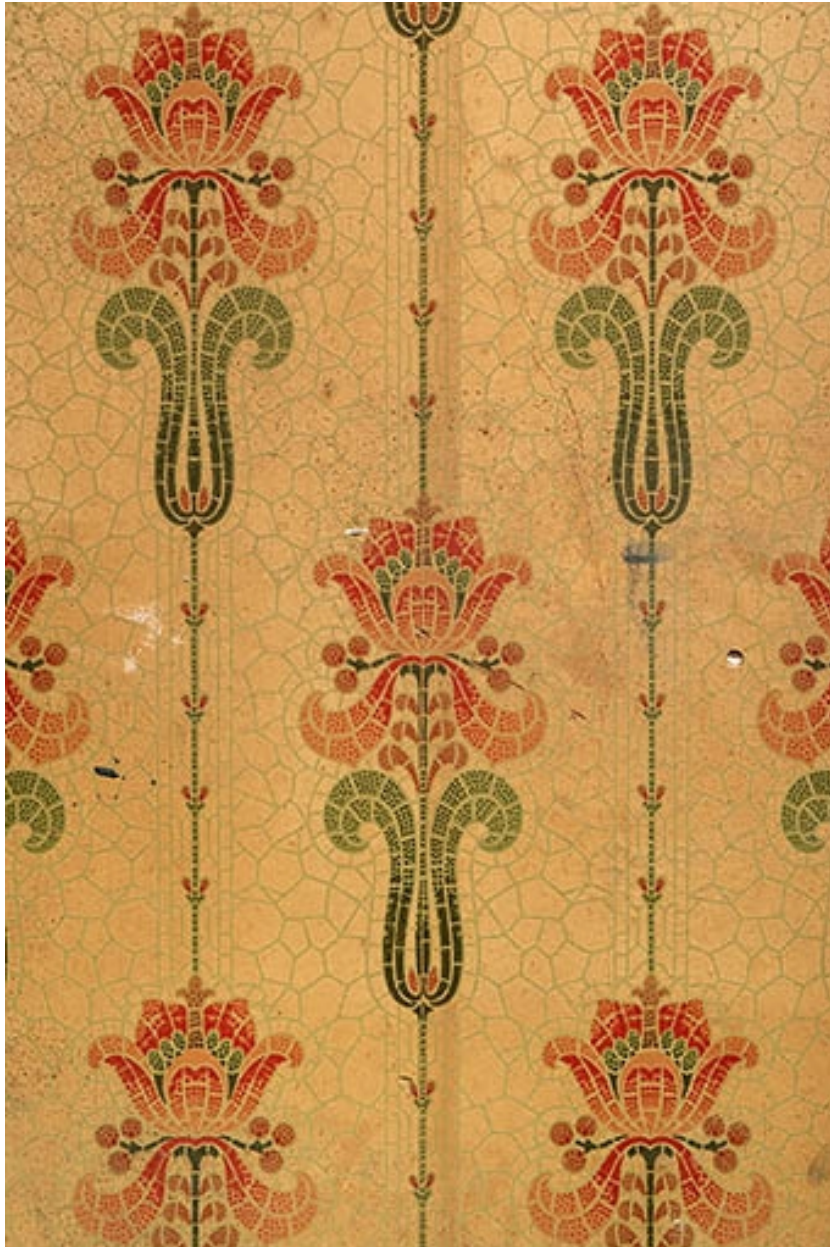
Salle 1, anciennes loges d'acteur : papier peint.