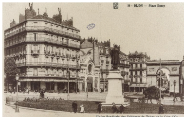
16 - Dijon - Place Darcy. S.d. [1re moitié 20e siècle, après 1916]. Autr. auteur inconnu IVR26_20222100760NUC1A