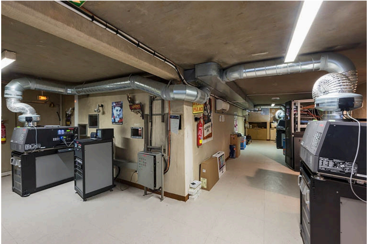
Cabine centrale, avec ses projecteurs numériques desservant les salles 3 à 5.