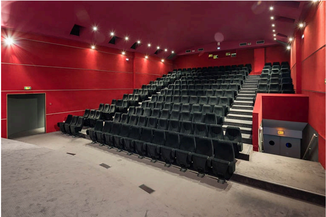
Salle 2 : vue depuis l'écran.