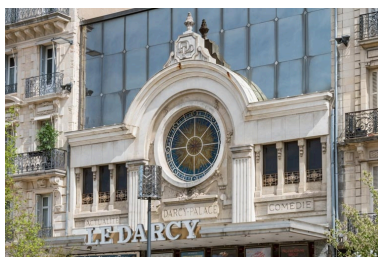
Façade antérieure : décor de l'étage et oculus, de trois quarts droite.