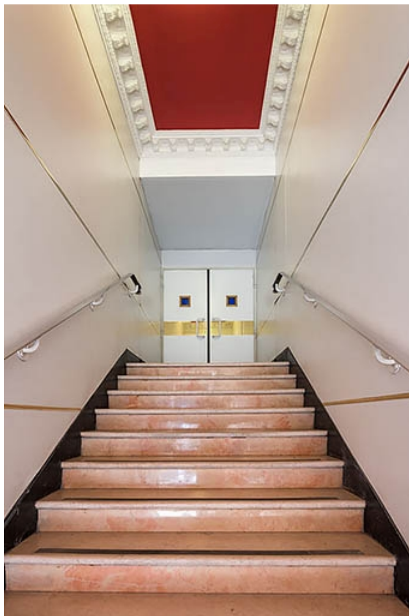
Escalier desservant la salle 2. Le plafond conserve un vestige du décor d'origine.