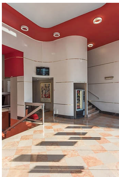
Vestibule. Les salles 3 à 6 (en sous-sol) sont desservies par l'escalier visible à gauche, la salle 2 par celui de droite.