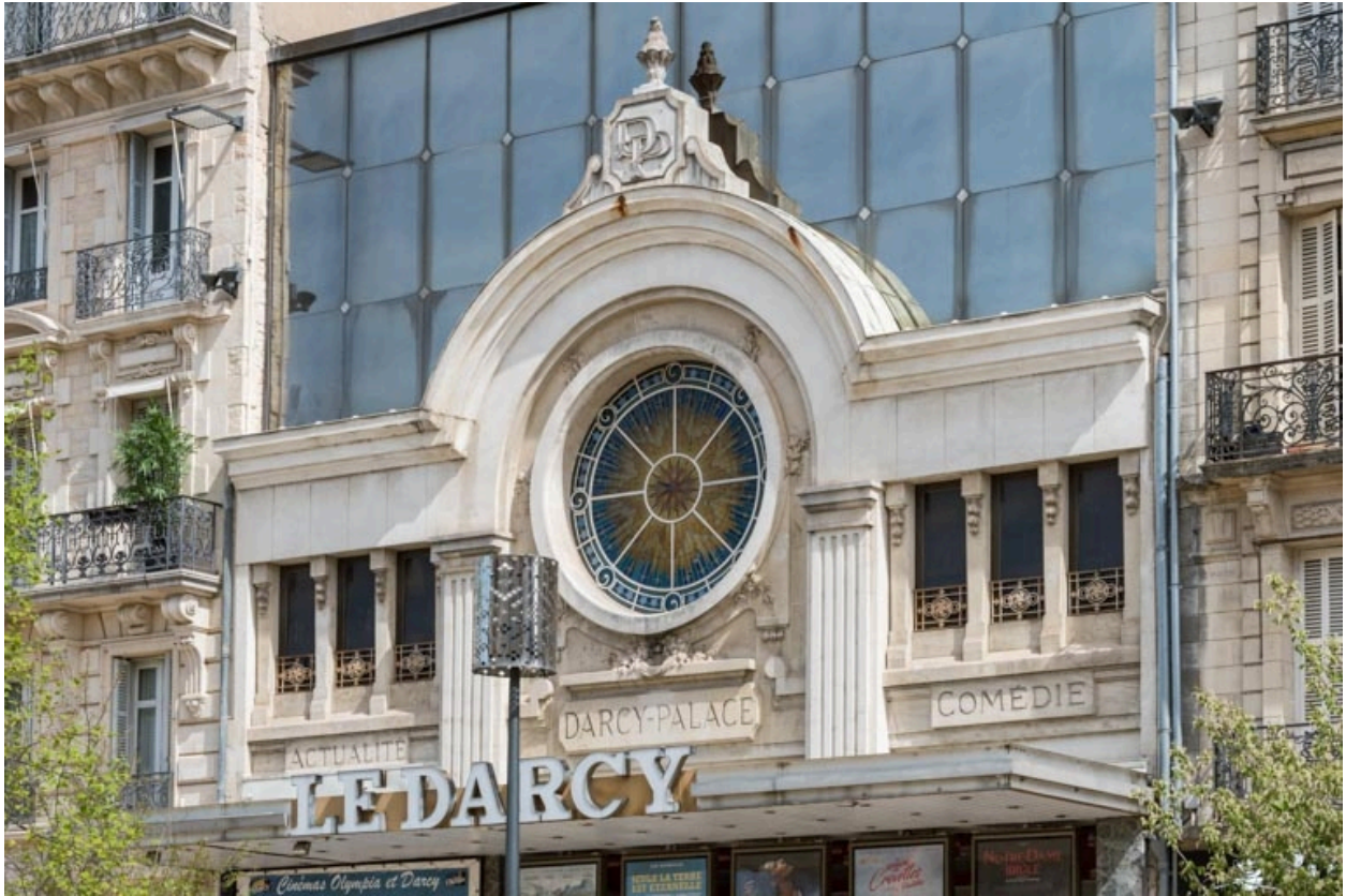
Façade antérieure : décor de l'étage et oculus, de trois quarts droite.