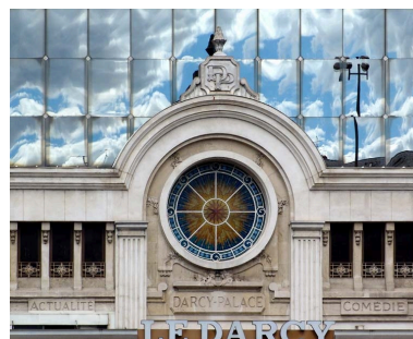
Façade antérieure, étage (en 2005) : décor et oculus.