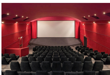
Salle 2 : vue vers l'écran. IVR26_20212100312NUC4A