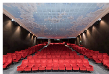
Salle 1 : vue depuis l'écran. IVR26_20212100306NUC4A