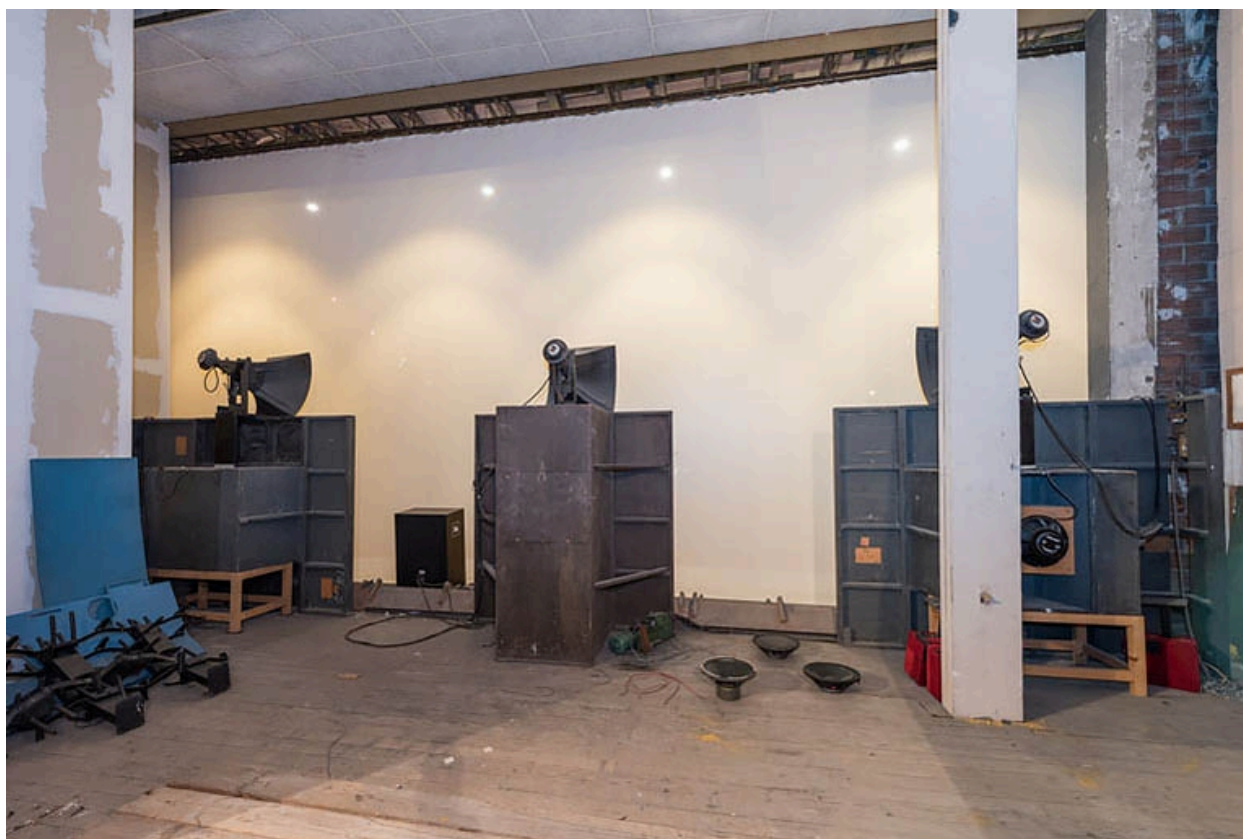
Salle 1 : installation de sonorisation sur la scène conservée à l'arrière de l'écran.