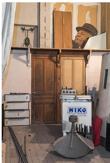
Salle 1 : anciennes loges d'acteur, à l'arrière de l'écran. IVR26_20212100308NUC4A