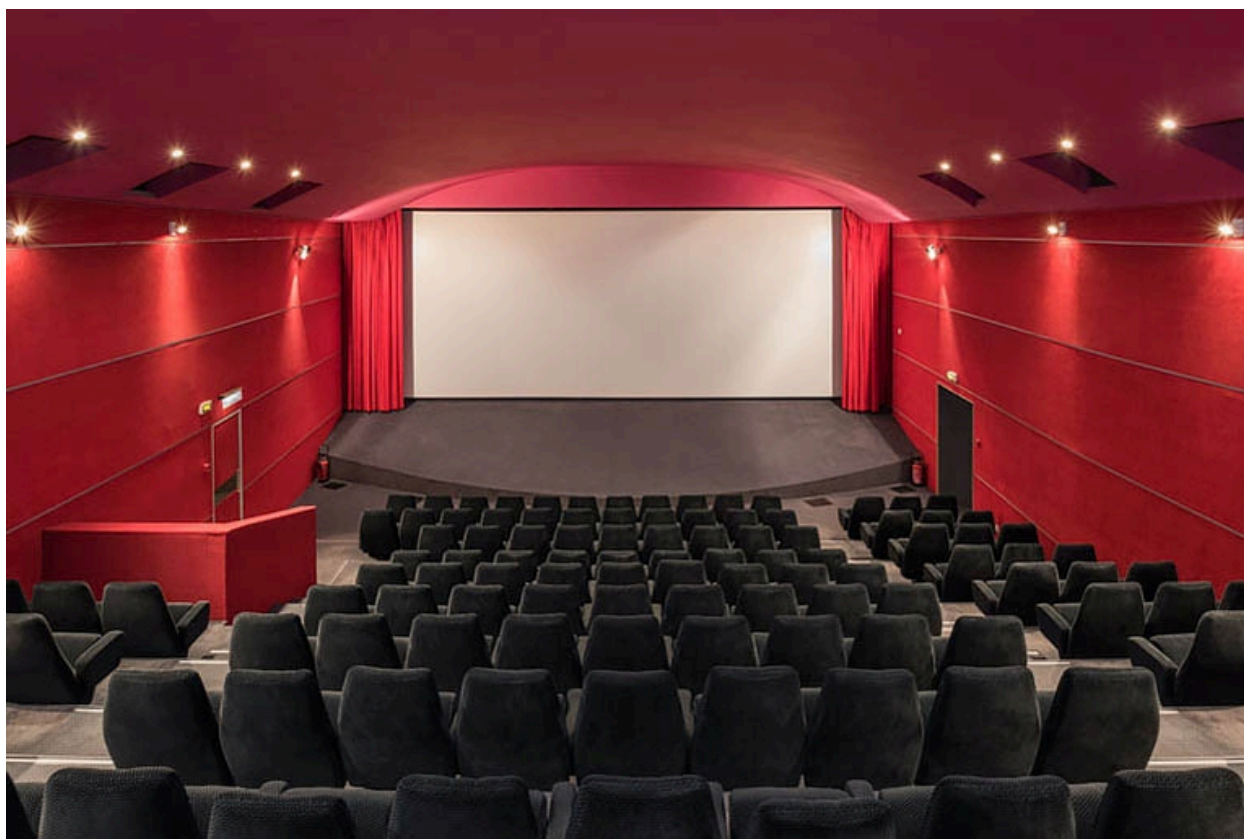
Salle 2 : vue vers l'écran.