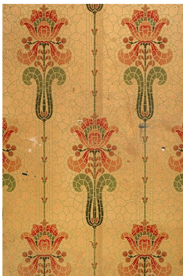
Salle 1, anciennes loges d'acteur : papier peint. IVR26_20212100309NUC4A