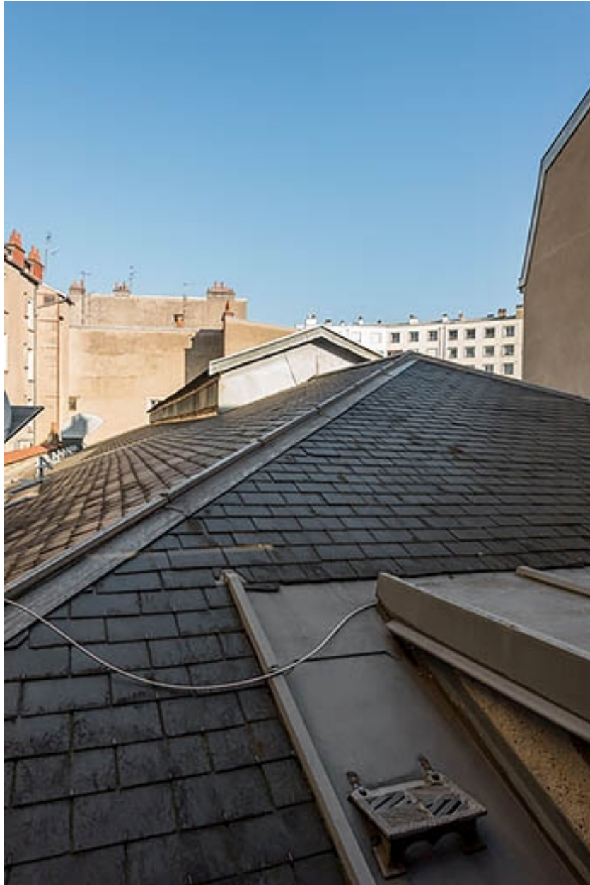
Le toit du cinéma, vu depuis la façade écran.