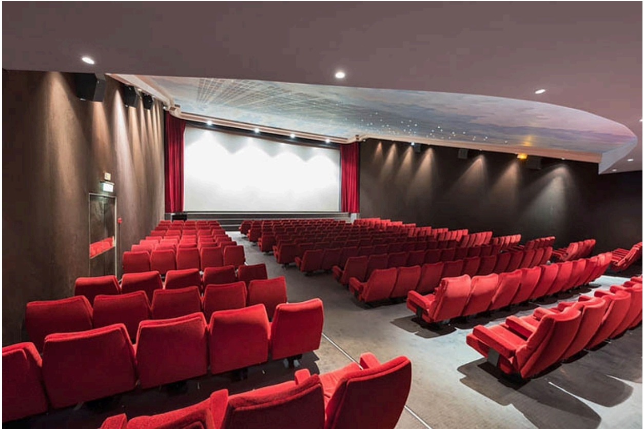
Salle 1 : vue vers l'écran.