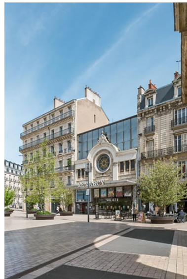
Vue d'ensemble. IVR26_20222100216NUC4A