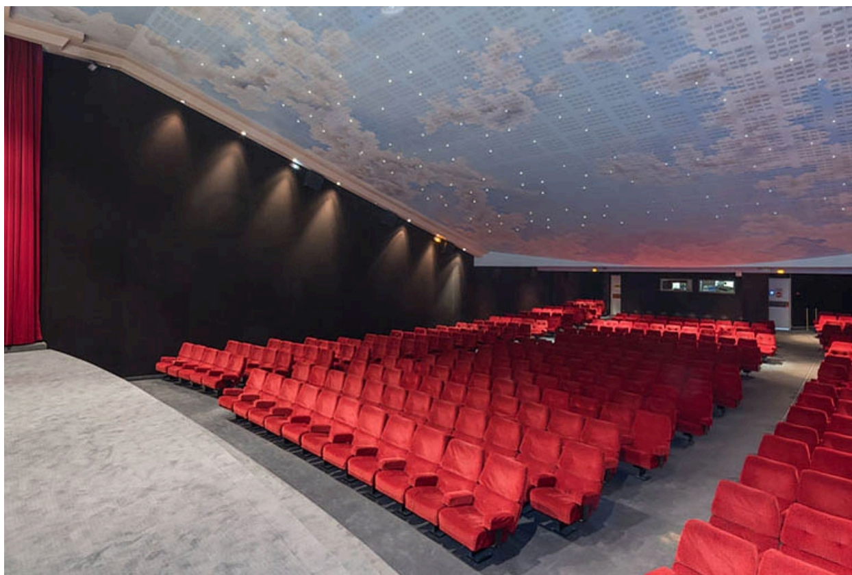
Salle 1 : vue depuis l'écran, de trois quarts droite.