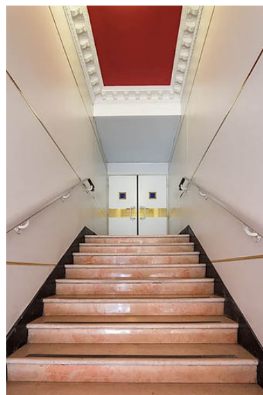
Escalier desservant la salle 2. Le plafond conserve un vestige du décor d'origine. IVR26_20212100310NUC4A