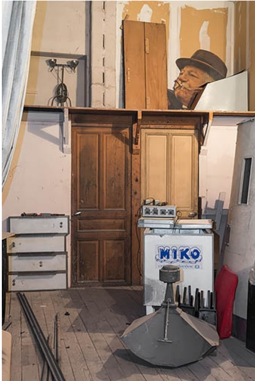
Salle 1 : anciennes loges d'acteur, à l'arrière de l'écran.