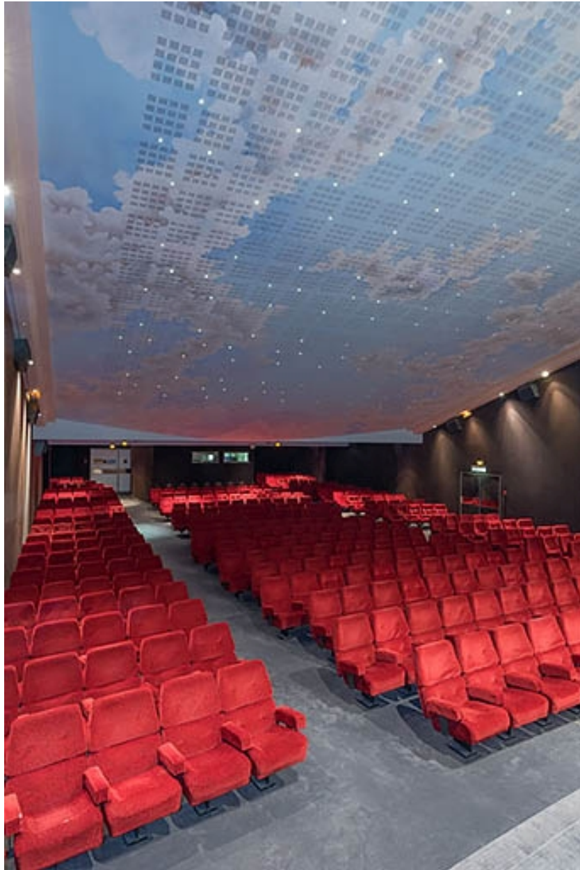
Salle 1 : vue depuis l'écran, montrant le décor du plafond dû à Jean-Claude Misset.