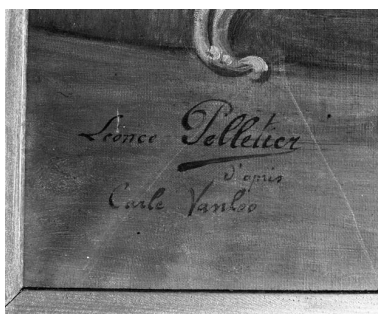
Signature IVR26_19852101160X