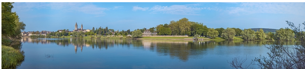
La ville de Tournus, vue d'amont, depuis la rive gauche de la Saône.