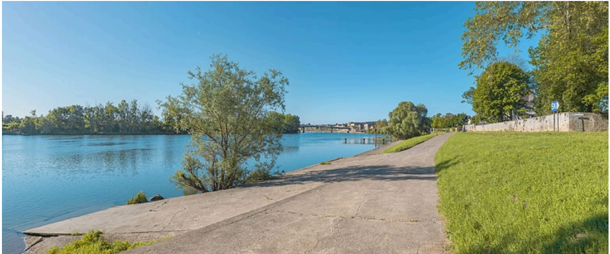
La ville de Tournus, vue d'amont, depuis le quai de la Marine (au niveau du Moulin de la Folie).