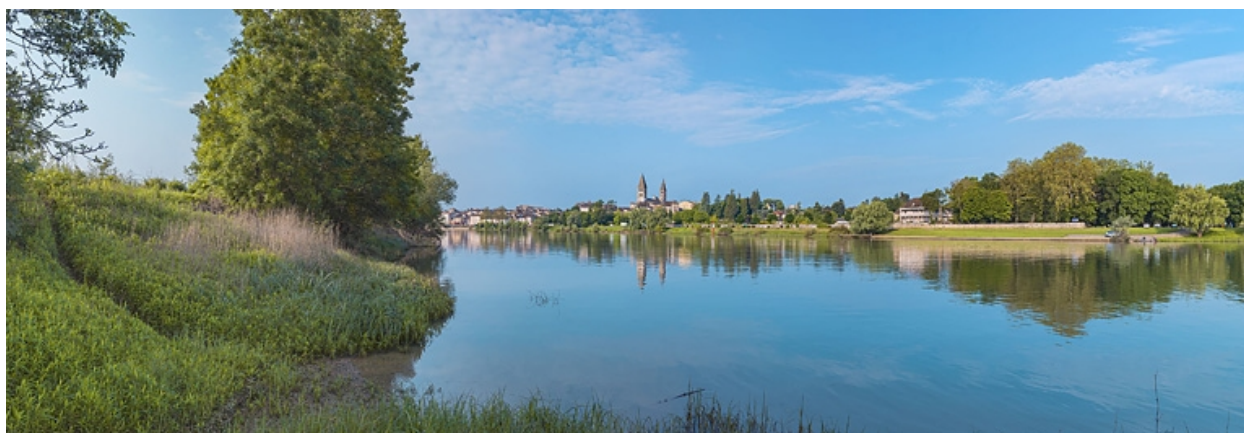
La ville de Tournus, vue d'amont, depuis la rive gauche de la Saône.