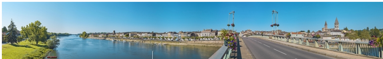
La traversée de la ville de Tournus, vue depuis le pont.