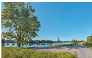
La ville de Tournus, vue d'amont (au niveau du PK 114).