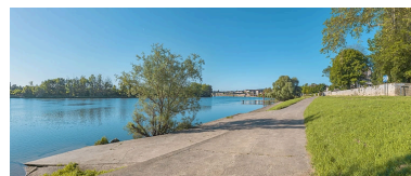
La ville de Tournus, vue d'amont, depuis le quai de la Marine (au niveau du Moulin de la Folie).