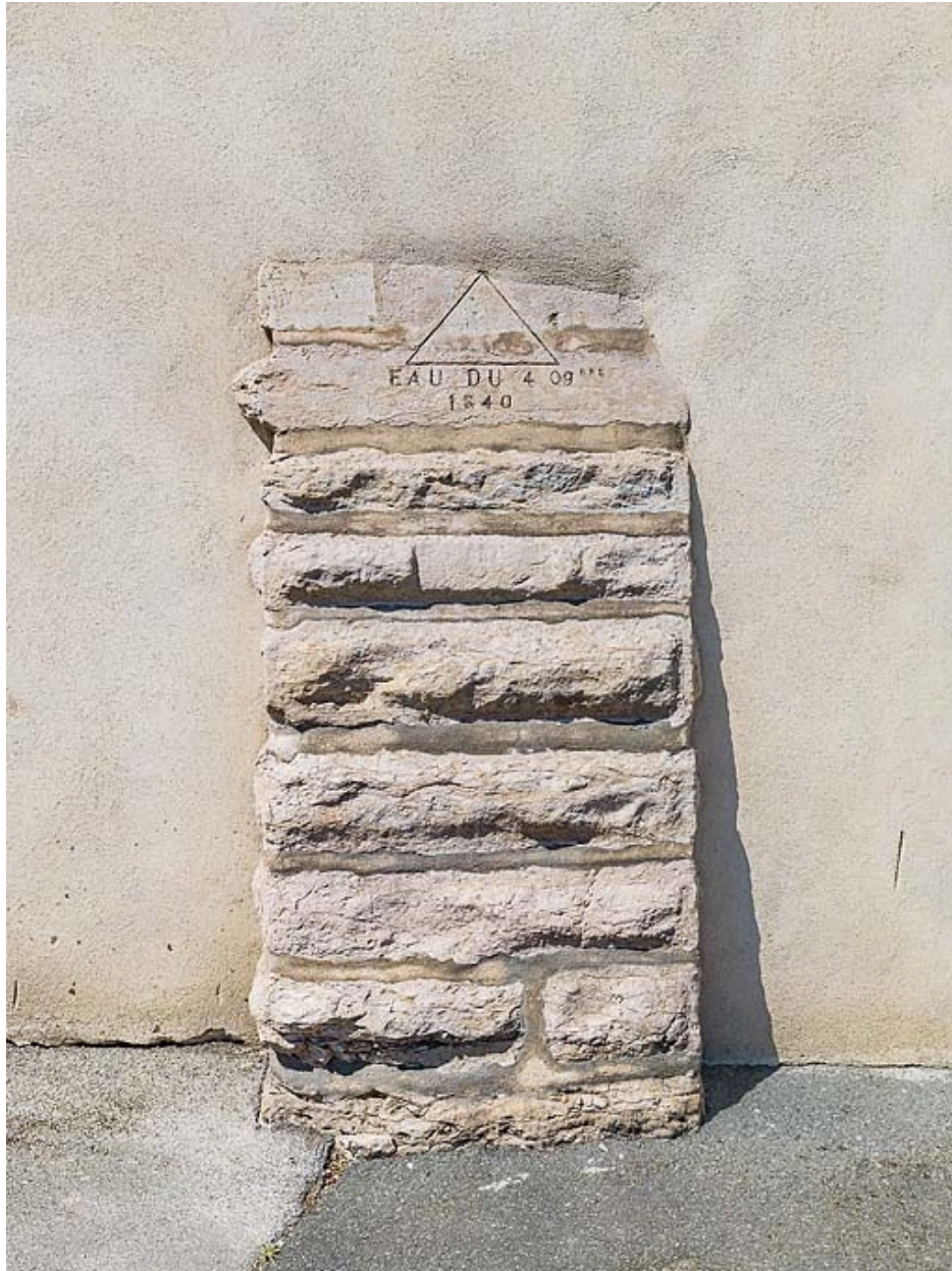
Détail du repère de la crue du 4 novembre 1840 sur une maison quai du Midi.