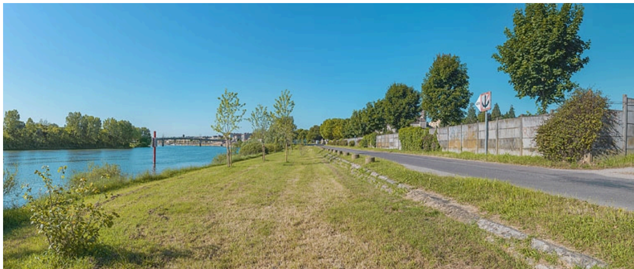
Quai de la Marine, en amont de Tournus (anciens perrés de la Pêcheurie).