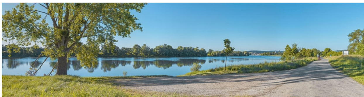
La ville de Tournus vue d'amont (à hauteur du PK 114).