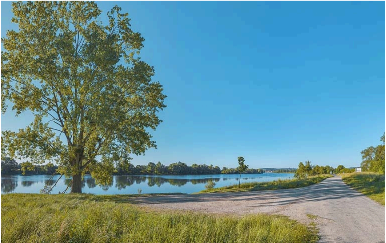
La ville de Tournus, vue d'amont (au niveau du PK 114).