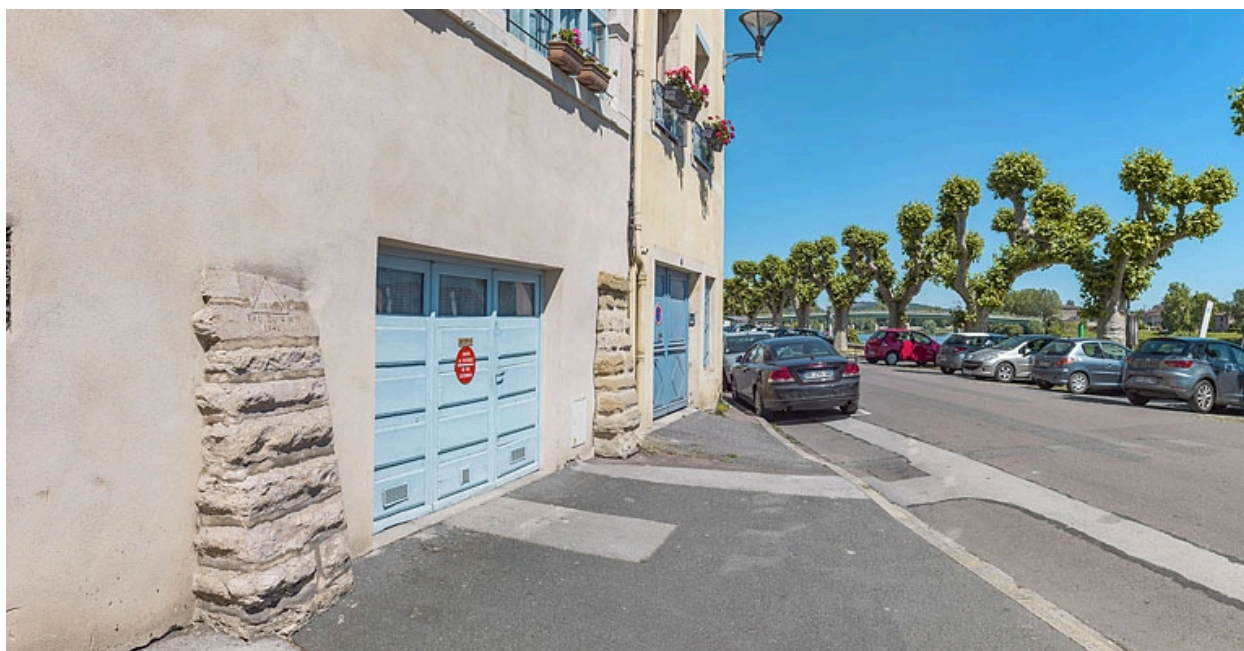
Repère de crue sur la façade d'une maison, quai du Midi.