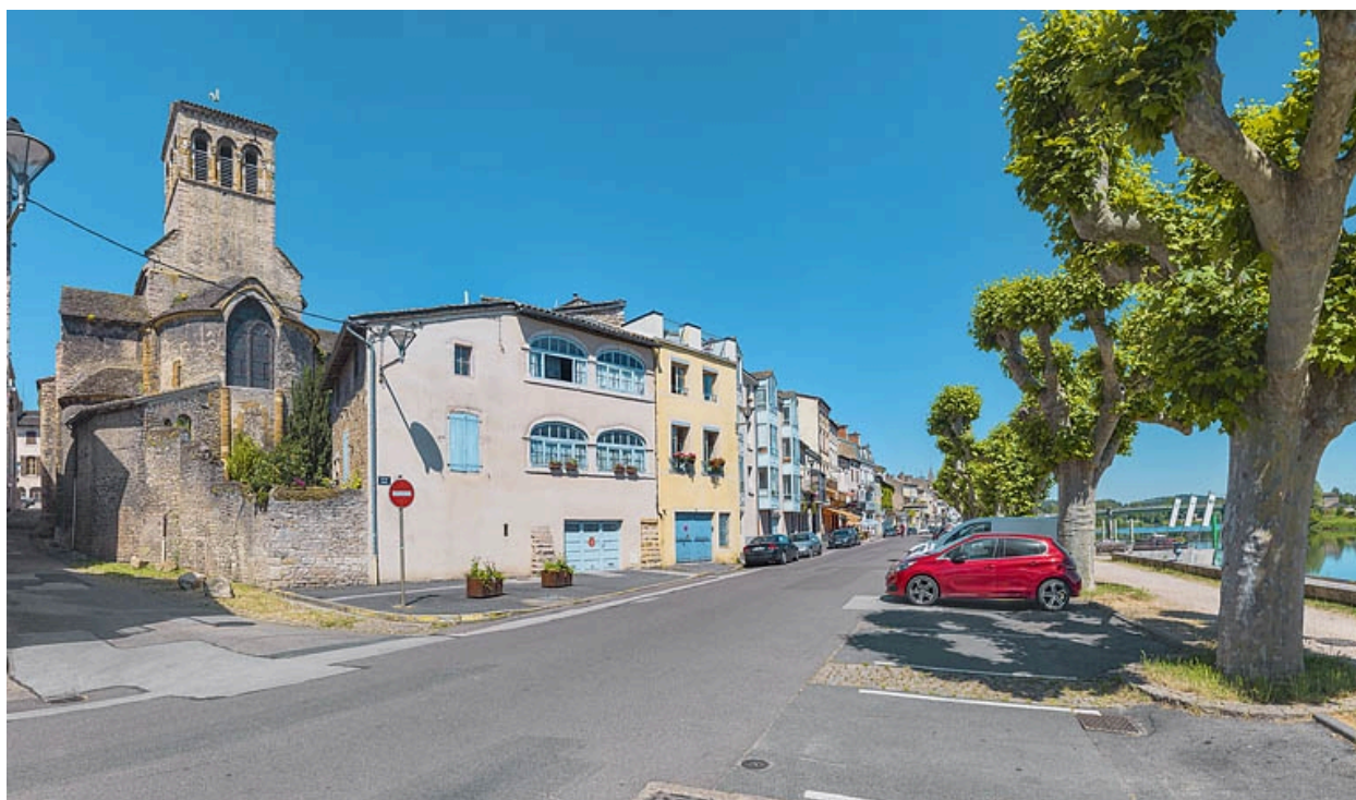
Quai du Midi et église Sainte-Madeleine à Tournus.