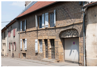
Façade antérieure, vue de trois quart droit. IVR43_20102501050NUC4A