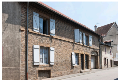
Façade antérieure, vue de trois quart gauche. IVR43_20102501049NUC4A