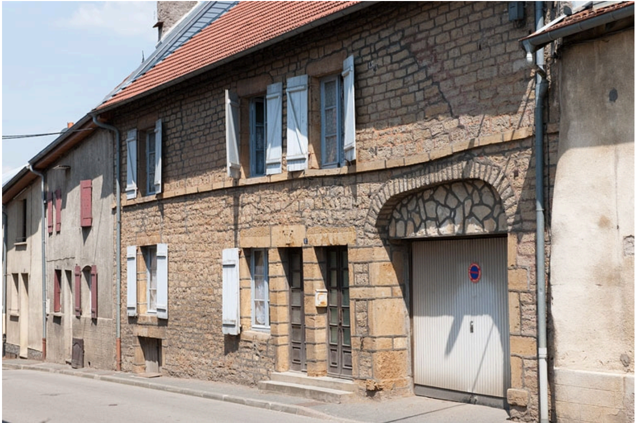
Façade antérieure, vue de trois quart droit.