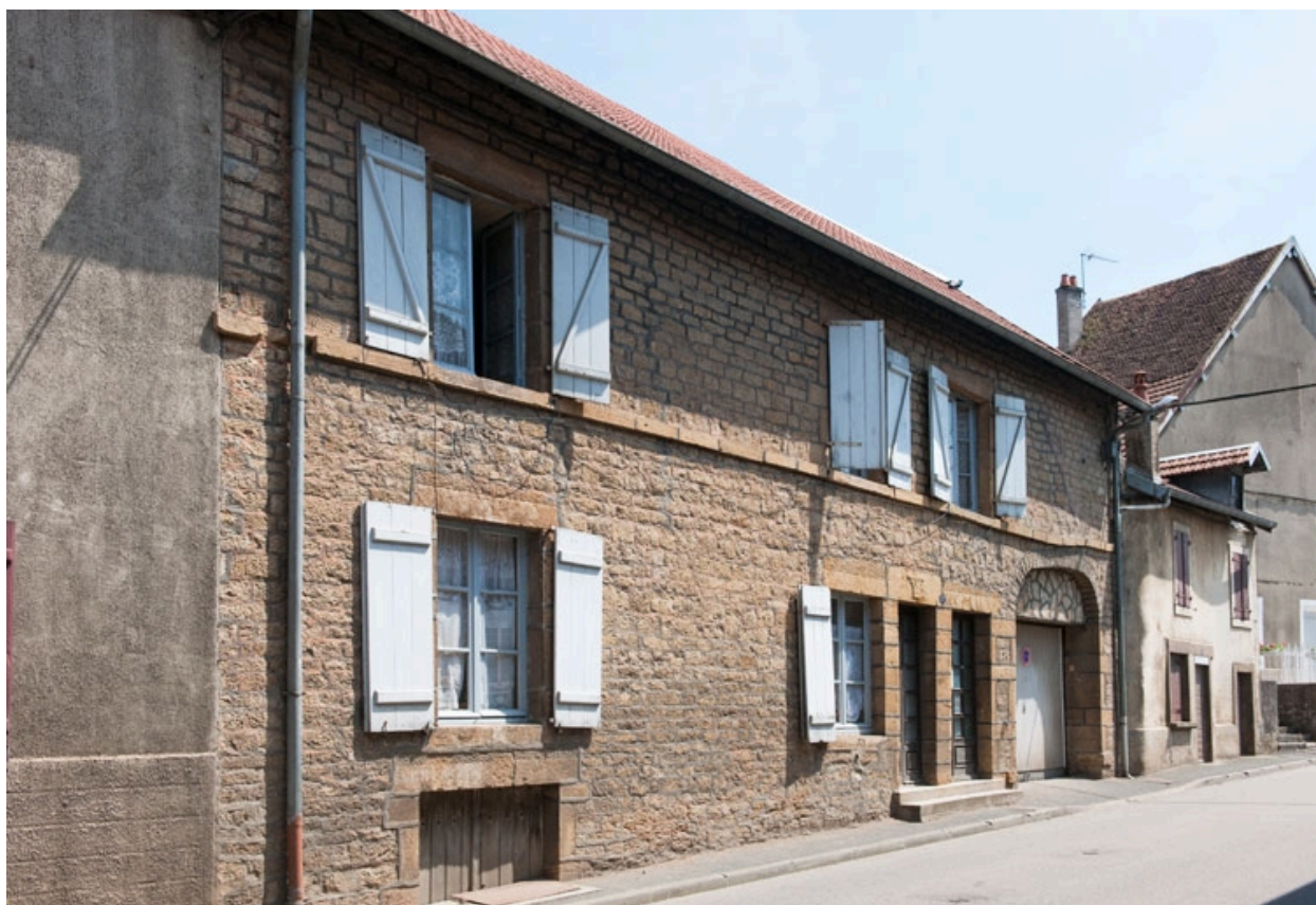
Façade antérieure, vue de trois quart gauche.