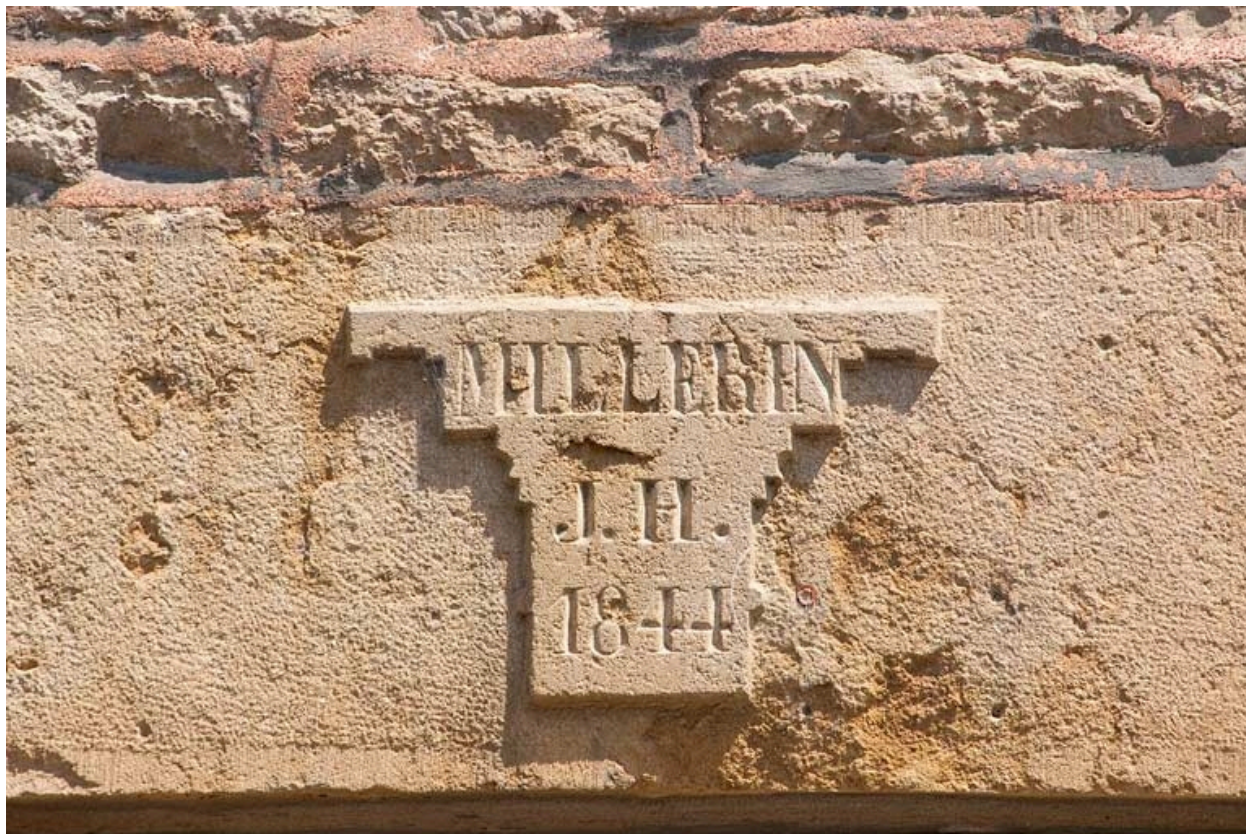
Détail : inscription sur le linteau de la porte d'entrée.