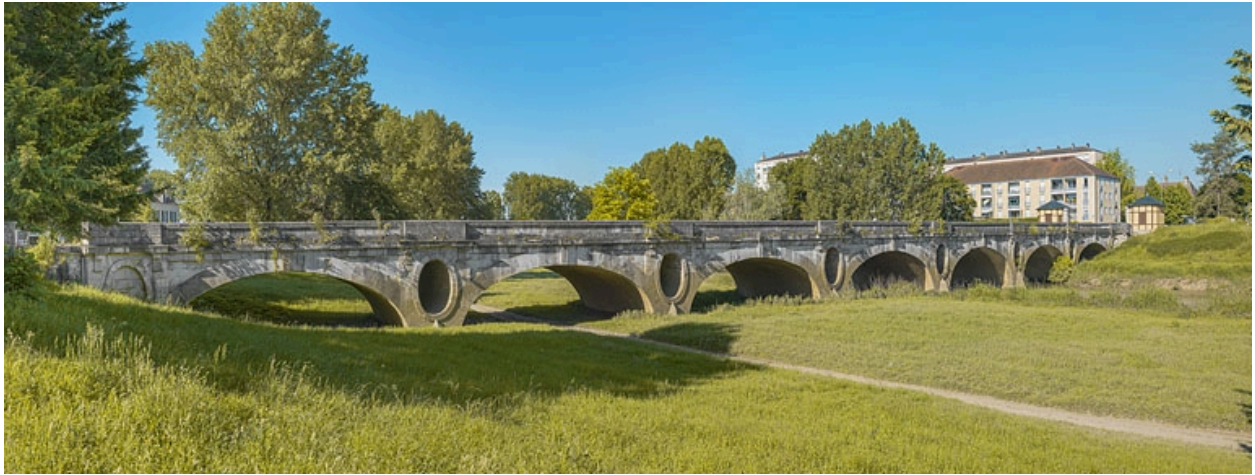
Vue d'ensemble du pont des Chavannes.