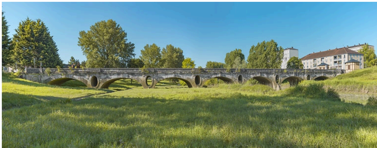
Vue d'ensemble du pont des Chavannes.