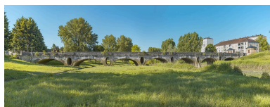
Vue d'ensemble du pont des Chavannes.