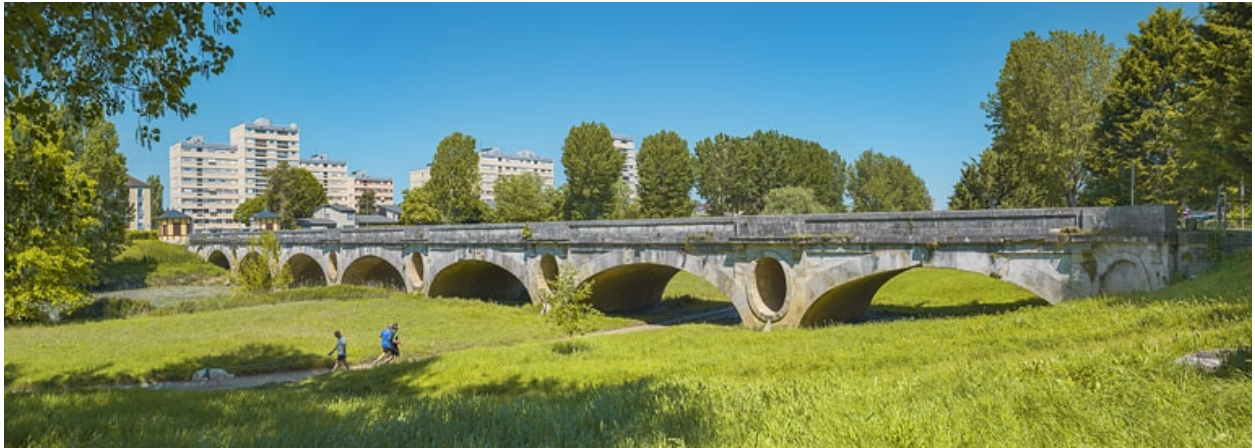
Le pont des Chavannes, vu d'aval.