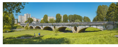
Le pont des Chavannes, vu d'aval.