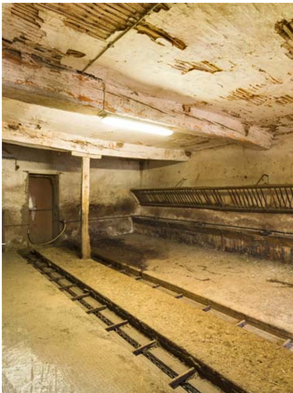
Vue intérieure de l'étable.