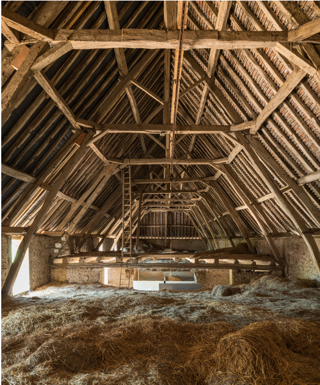
Charpente du bâtiment agricole. Vue depuis le fenil (cadrage vertical).