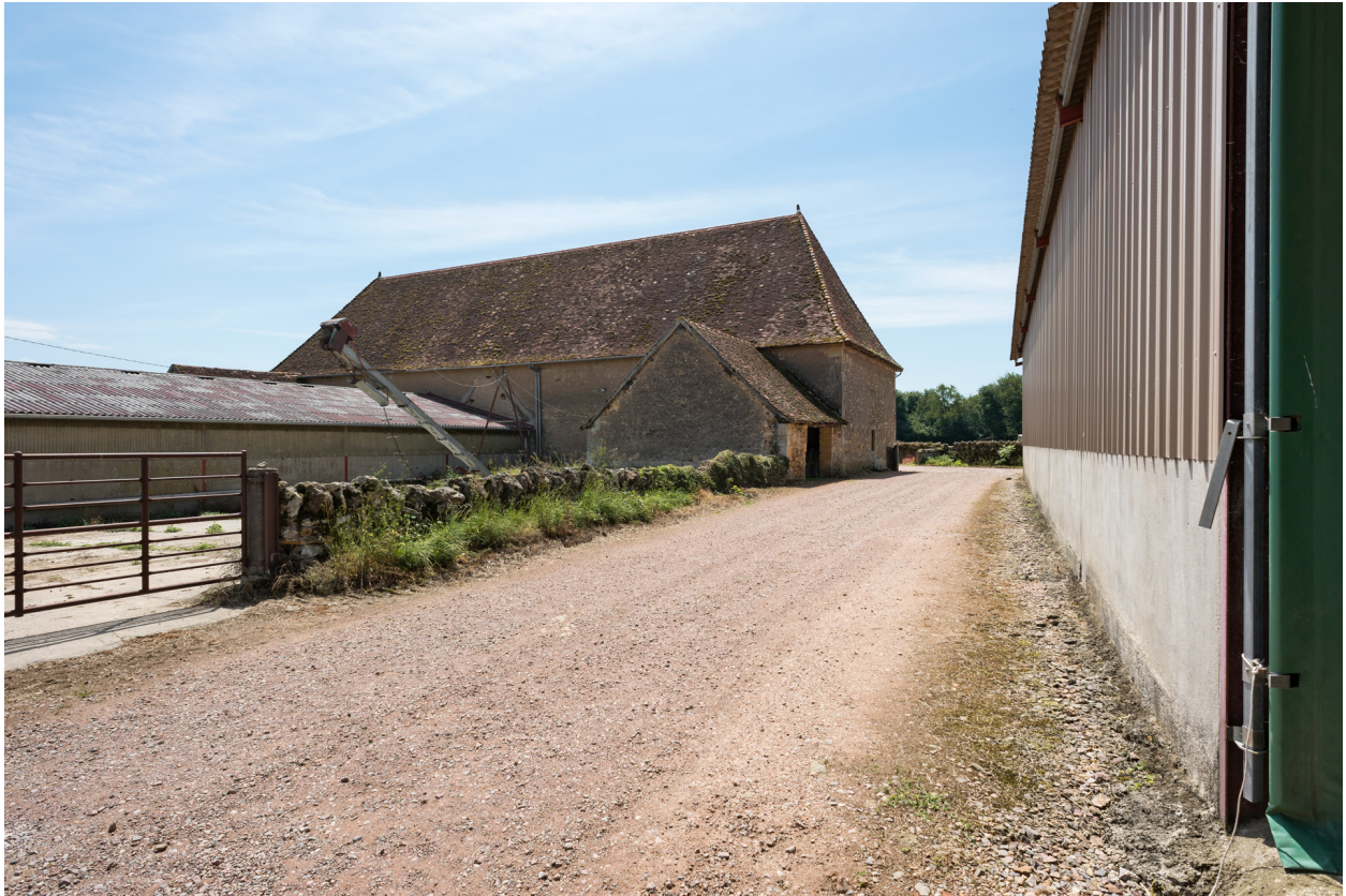
Bâtiment agricole vu de trois quarts arrière.