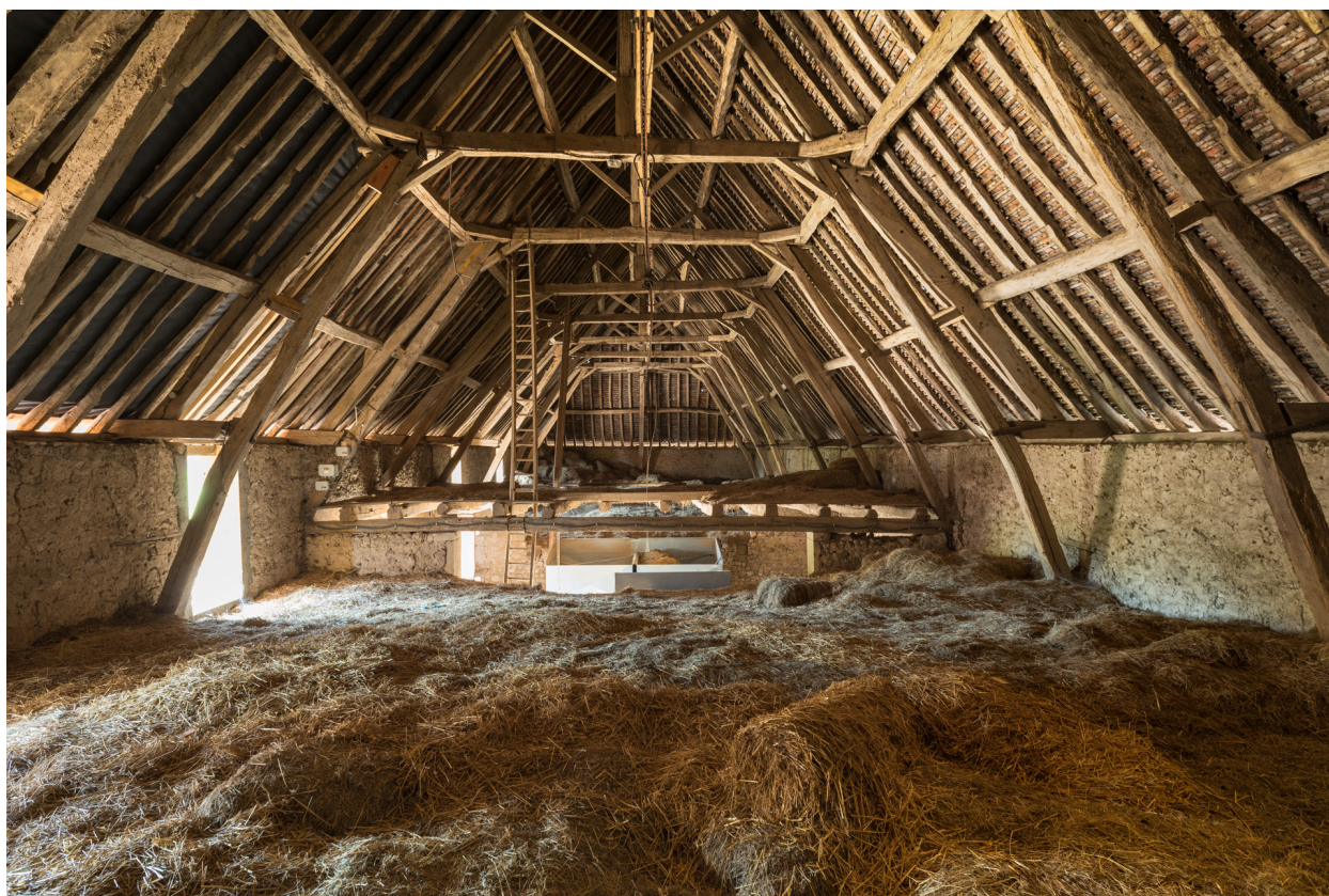
Charpente du bâtiment agricole. Vue depuis le fenil (cadrage horizontal).