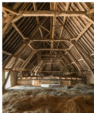
Charpente du bâtiment agricole. Vue depuis le fenil (cadrage vertical). IVR26_20187100133NUC2A