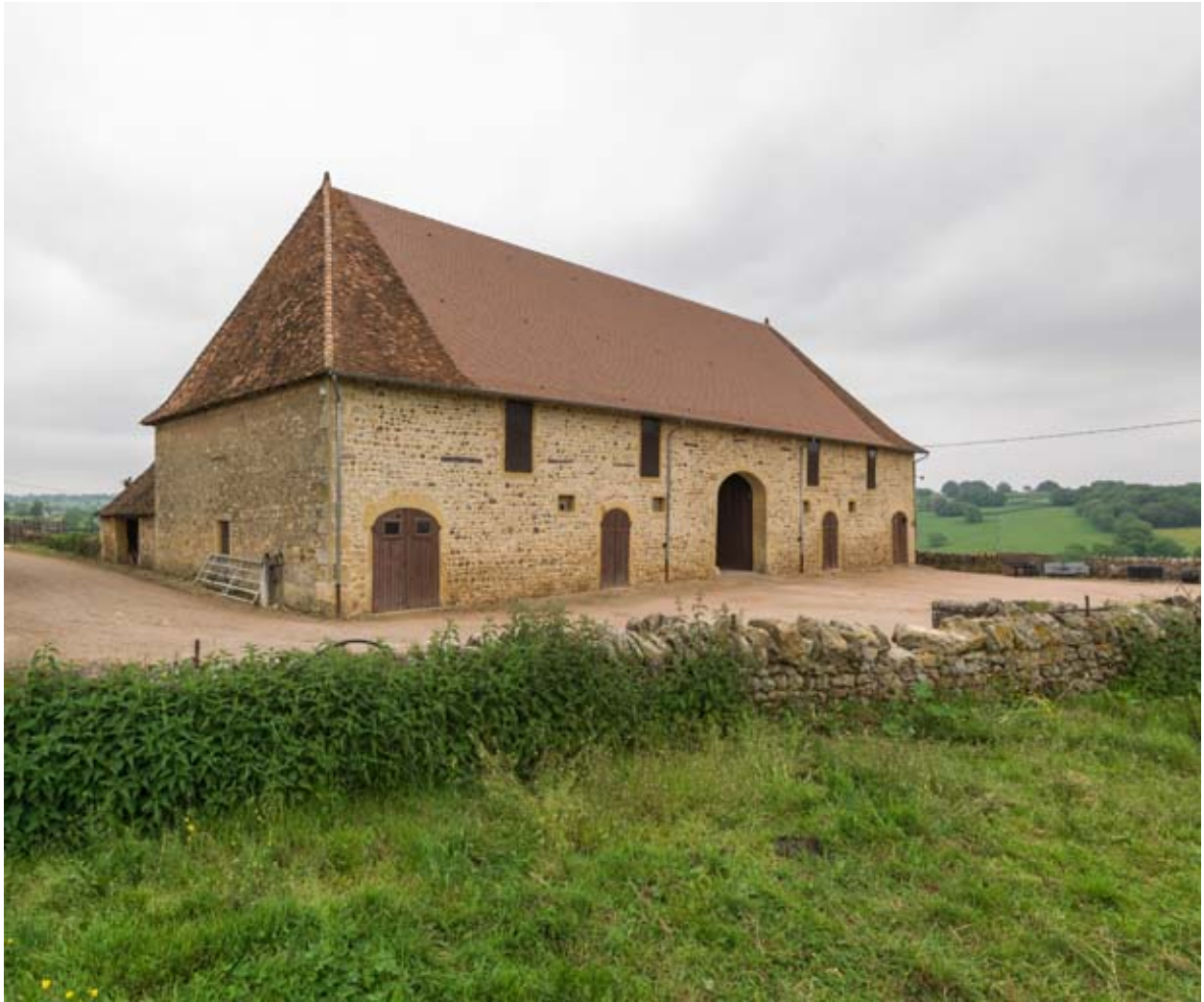
L'étable vue de trois quarts gauche.