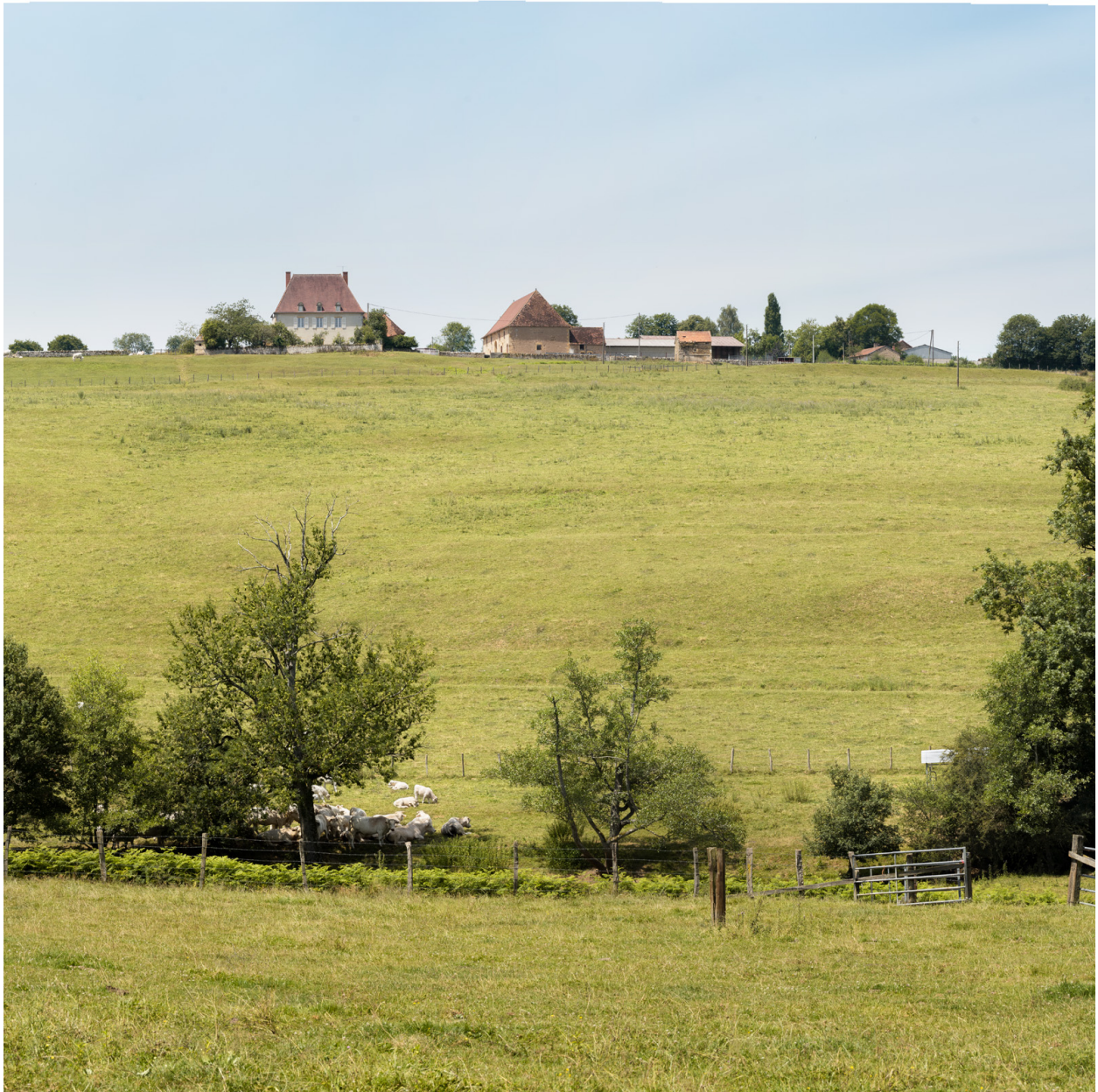
Vue d'ensemble depuis l'est.