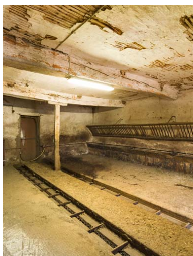
Vue intérieure de l'étable. IVR26_20187100033NUC4A