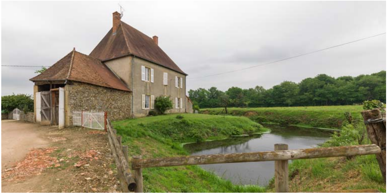
Maison d'habitation et anciennes douves, depuis le nord-est.