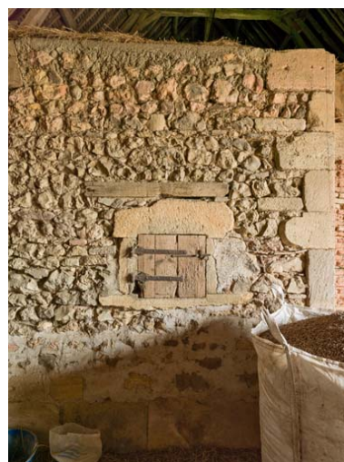
Ouverture (dite feuron) dans le mur de séparation entre l'étable et la remise.