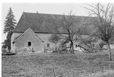
Vue postérieure de la grange au début des années 1970, avec les trois petits édifices ayant servi de soies à cochons, de réserve à betteraves et de remise à bois. L'édicule central a disparu suite à la construction d'une stabulation dans la seconde moitié des années 1970.