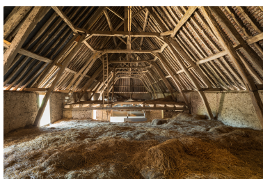
Charpente du bâtiment agricole. Vue depuis le fenil (cadrage horizontal). IVR26_20187100132NUC4A