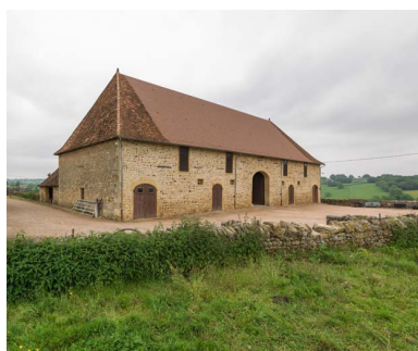
L'étable vue de trois quarts gauche. IVR26_20187100030NUC4AQ