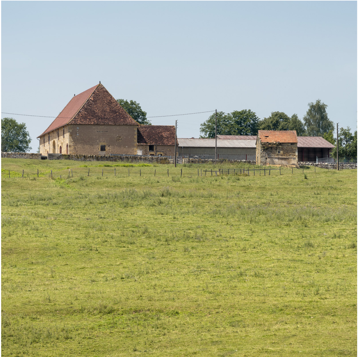
Les bâtiments agricoles vus depuis l'est.