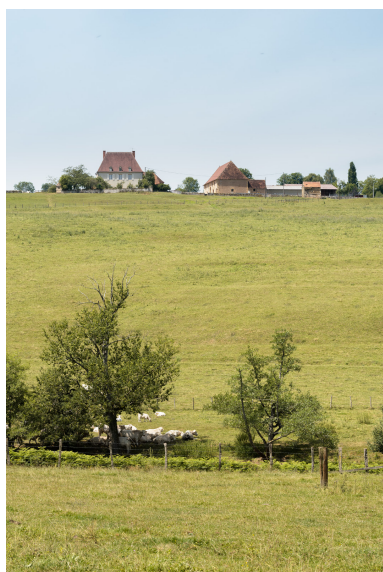
Vue d'ensemble depuis l'est (cadrage vertical). IVR26_20187100135NUC4A