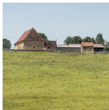
Les bâtiments agricoles vus depuis l'est. IVR26_20187100137NUC2A