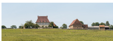
Vue rapprochée depuis l'est.