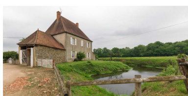
Maison d'habitation et anciennes douves, depuis le nord-est.