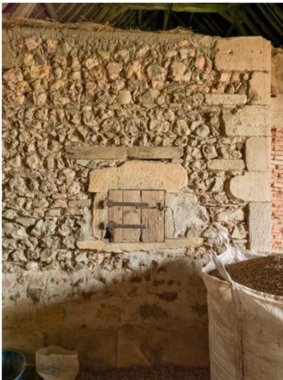
Ouverture (dite feuron) dans le mur de séparation entre l'étable et la remise.