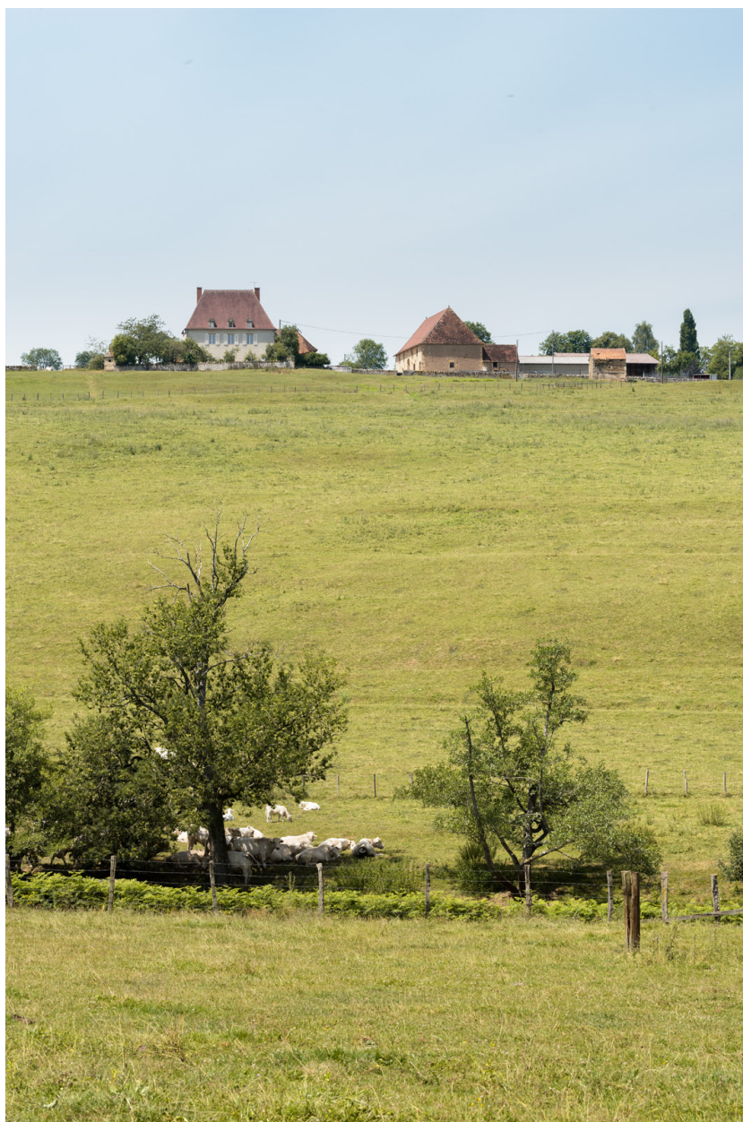
Vue d'ensemble depuis l'est (cadrage vertical).