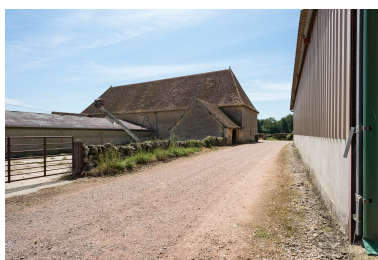
Bâtiment agricole vu de trois quarts arrière.