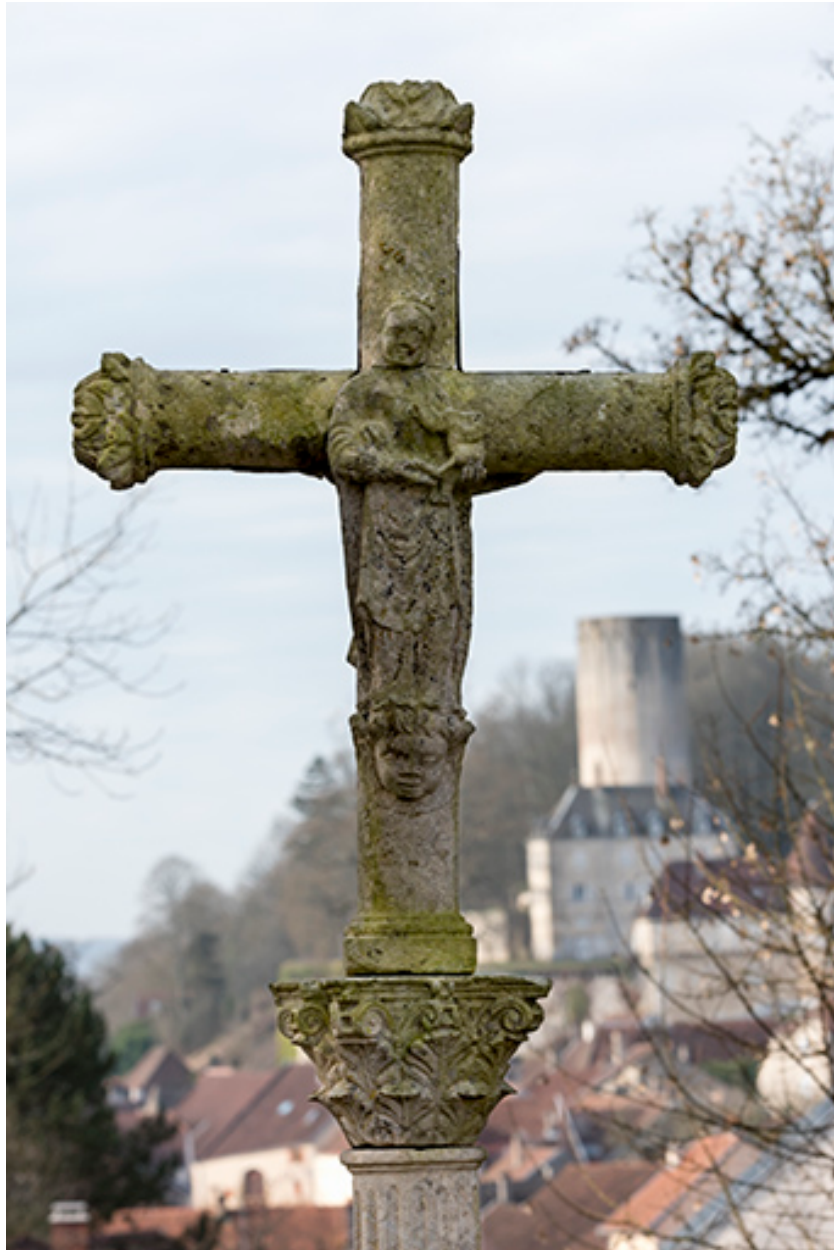
L'une des quatre croix de chemin : la croix dite du calvaire.