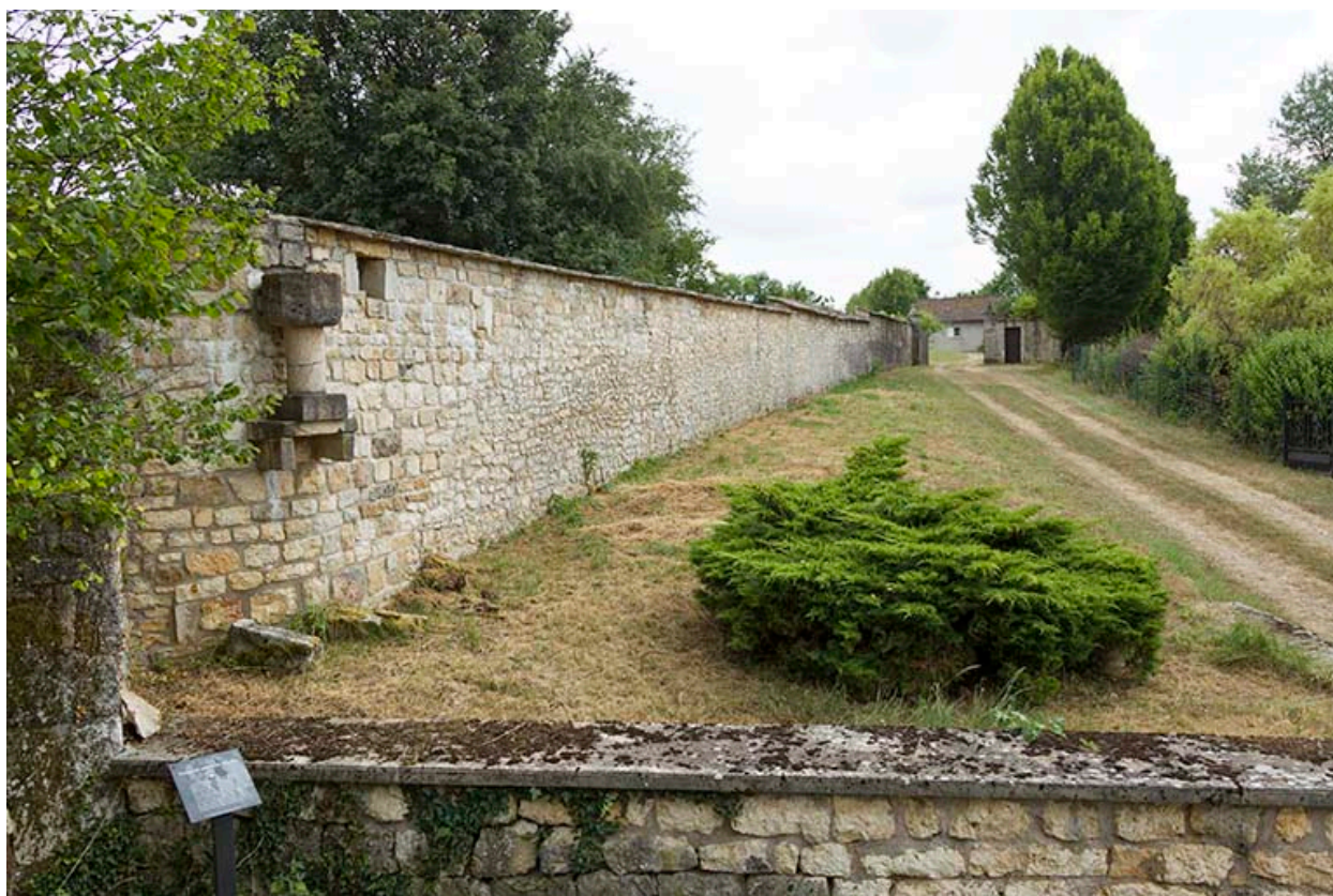
Couvent de minimes : le mur d'enclos.