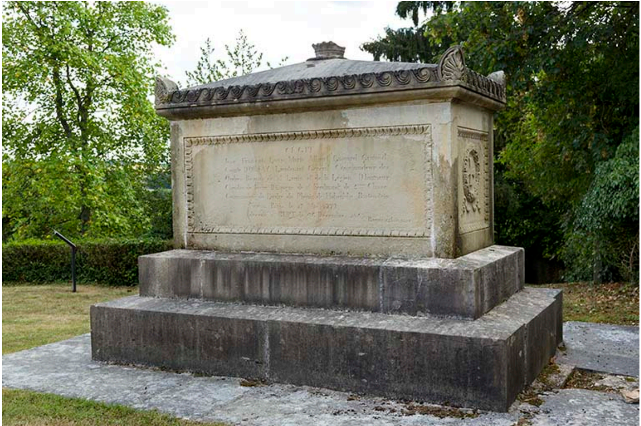
Le tombeau du comte d'Orsay, dans l'ancien cimetière.