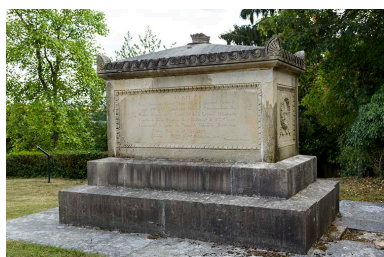
Le tombeau du comte d'Orsay, dans l'ancien cimetière.