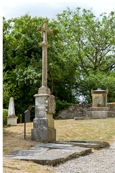
La croix de l'ancien cimetière.