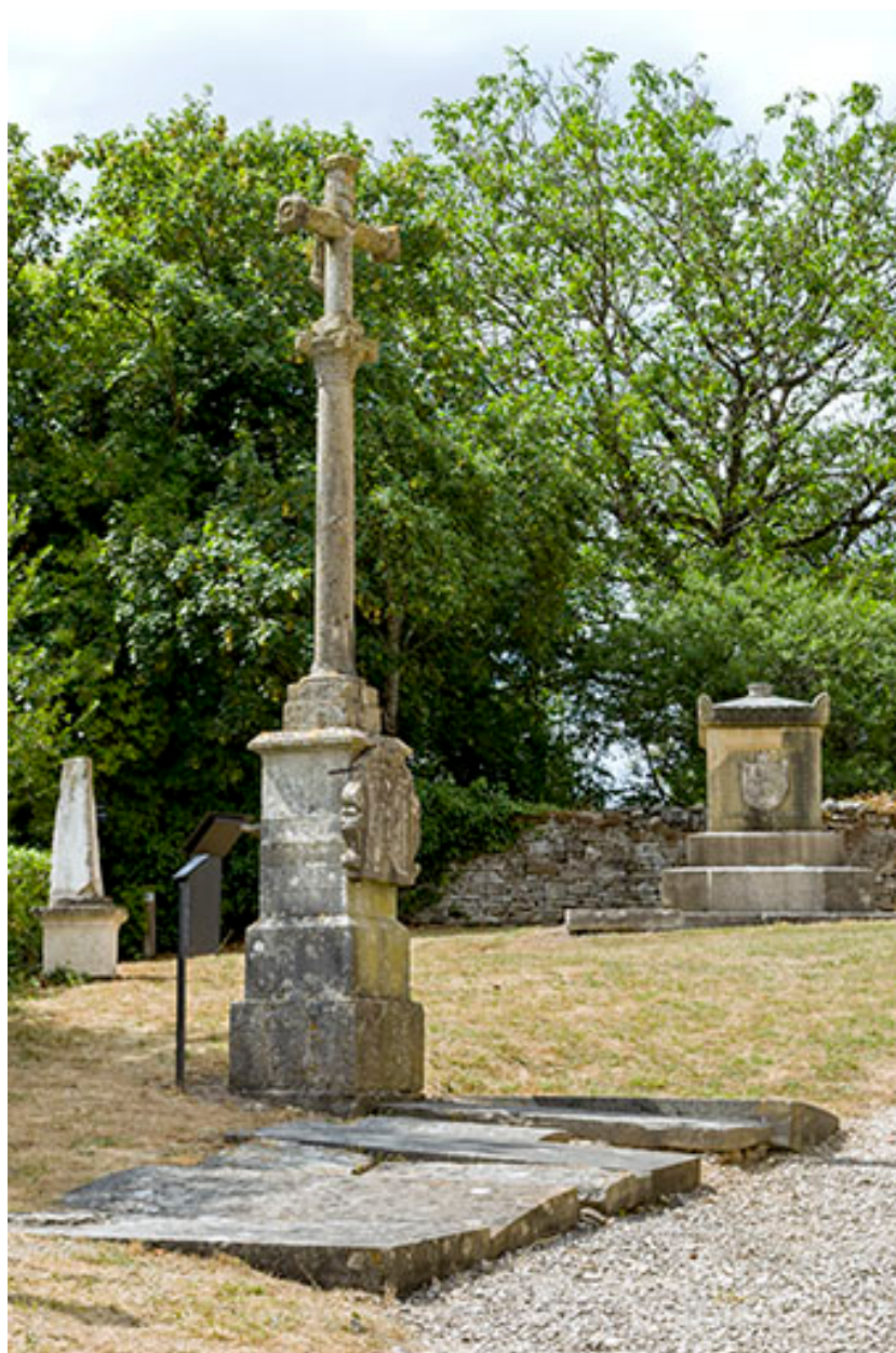
La croix de l'ancien cimetière.