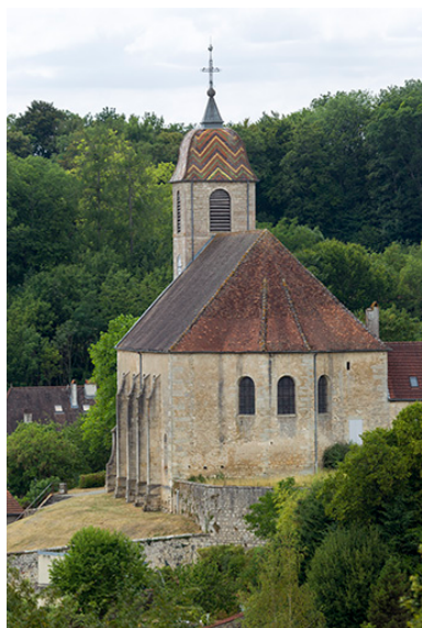
L'église paroissiale de la Nativité de la Vierge.