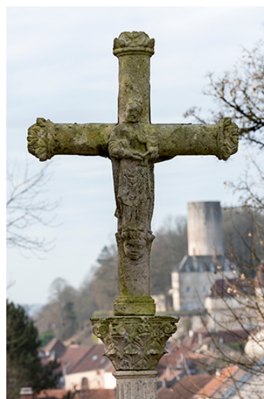
L'une des quatre croix de chemin : la croix dite du calvaire.