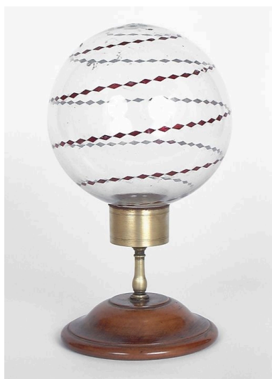
Sphère étincelante.