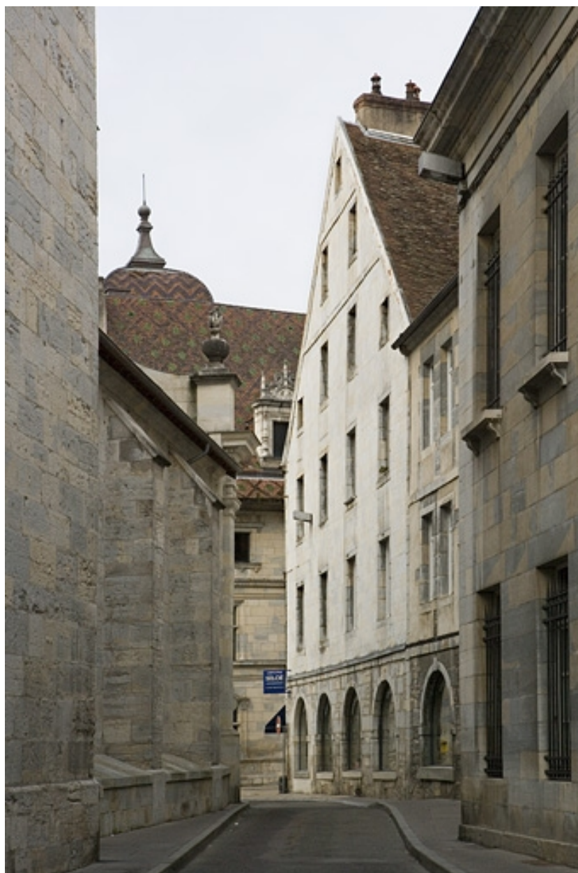
Vue d'ensemble de la façade sur pignon du logis principal depuis la rue de la Bibliothèque.