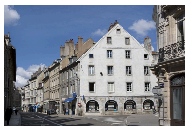
Vue d'ensemble du logis principal de trois quarts droit.