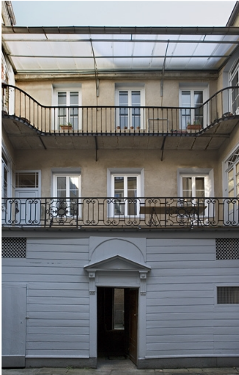
Première cour : détail de la façade principale du logis secondaire.