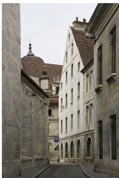
Vue d'ensemble de la façade sur pignon du logis principal depuis la rue de la Bibliothèque. IVR43_20082500268NUC2A