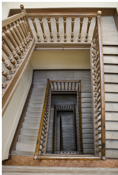
Vue d'ensemble de l'escalier. IVR43_20082500265NUC2A