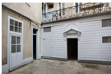
Vue du rez-de-chaussée des bâtiments au fond de la première cour : de trois quarts gauche. IVR43_20082500264NUC2A