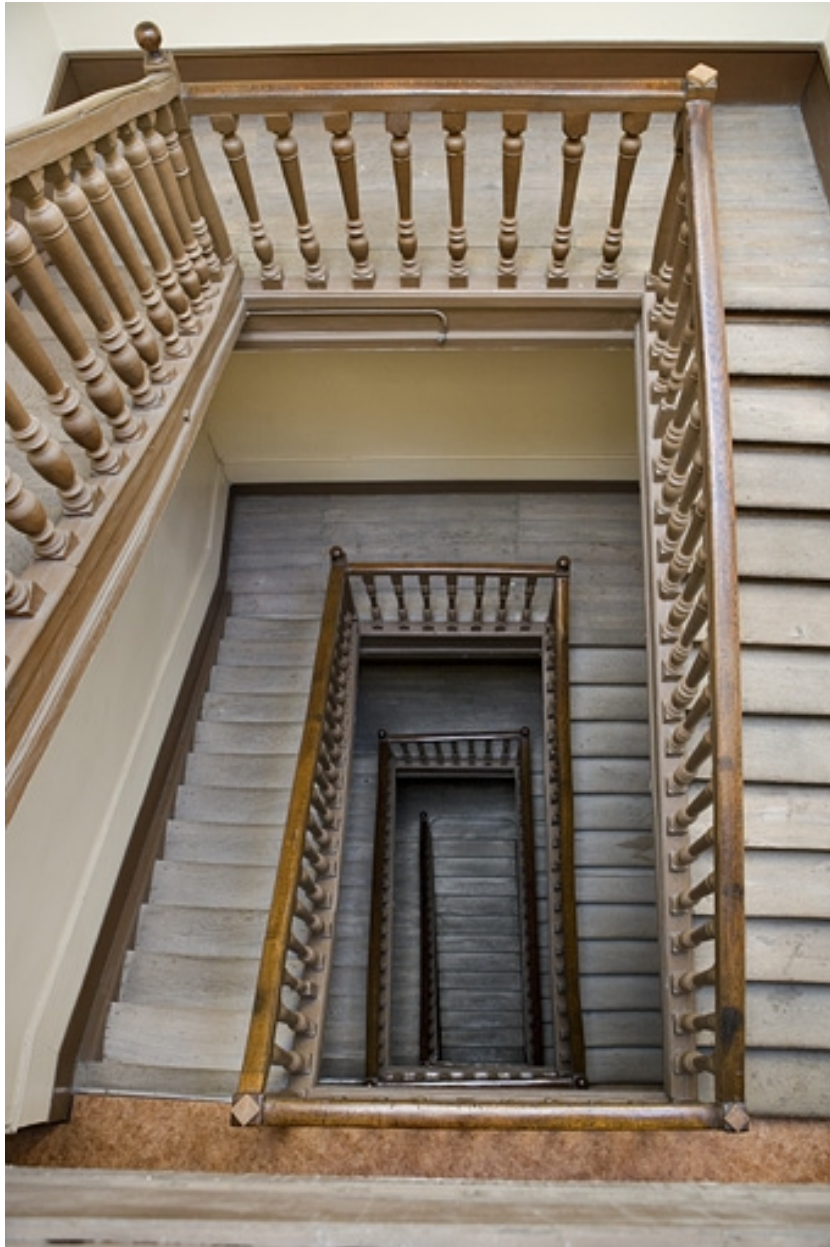
Vue d'ensemble de l'escalier.