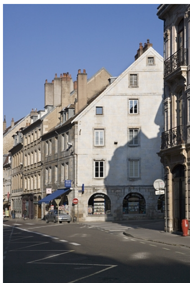
Vue d'ensemble du logis principal de trois quarts droit. IVR43_20082500267NUC2A