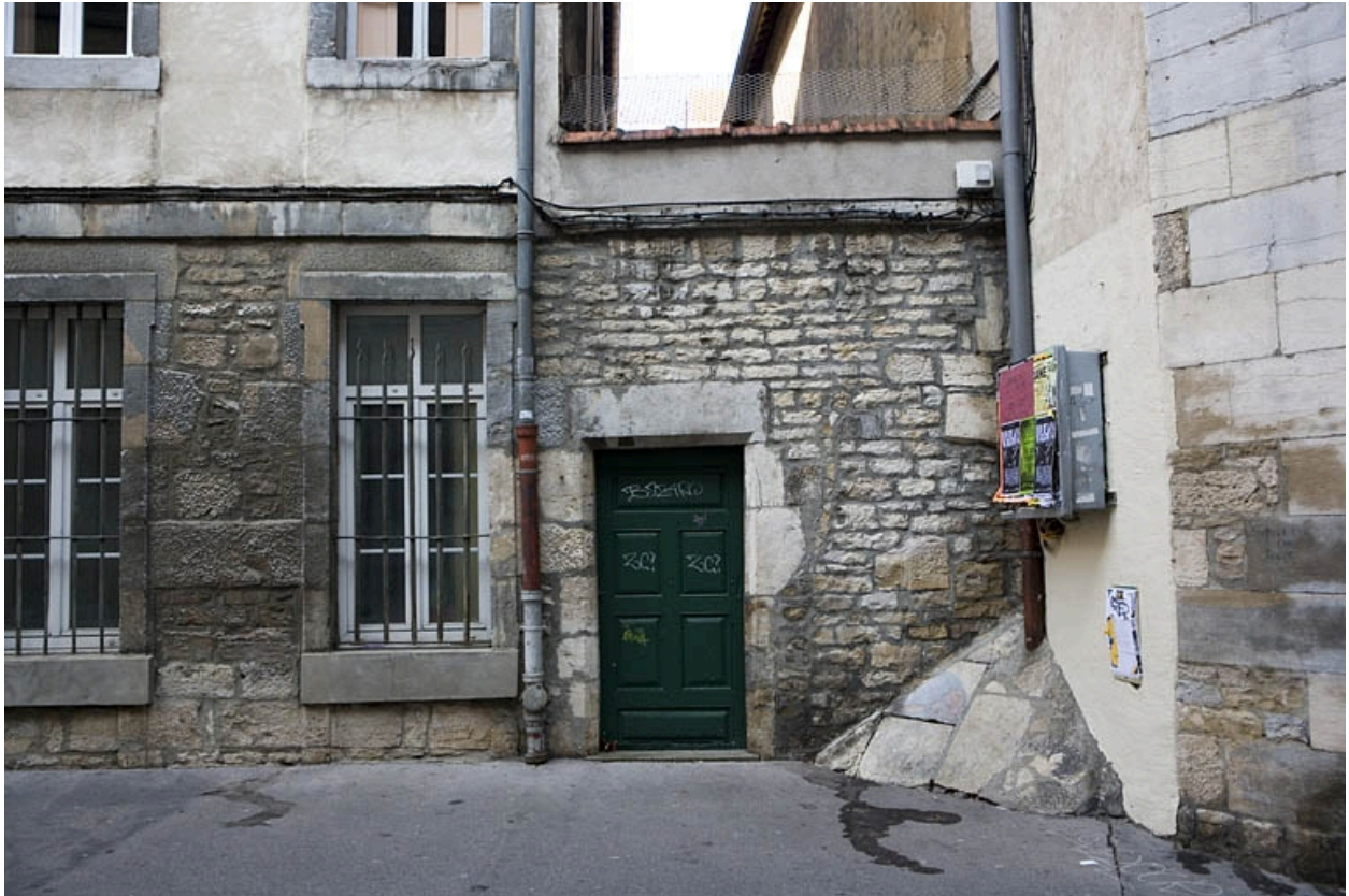
Détail de la porte secondaire située rue de la Bibliothèque.