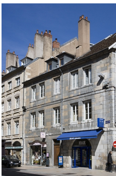
Vue d'ensemble de la façade principale du logis sur rue de trois quarts droit.