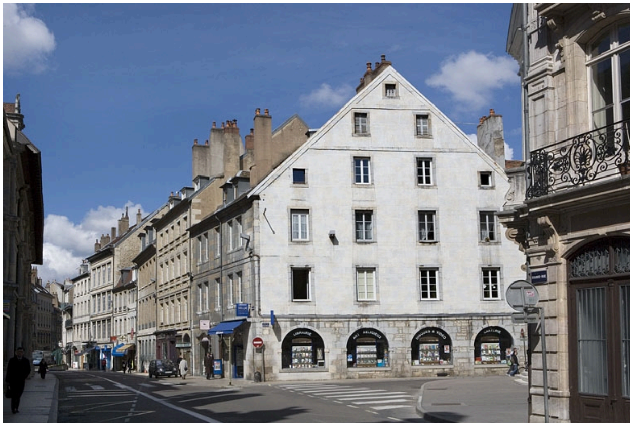
Vue d'ensemble du logis principal de trois quarts droit.