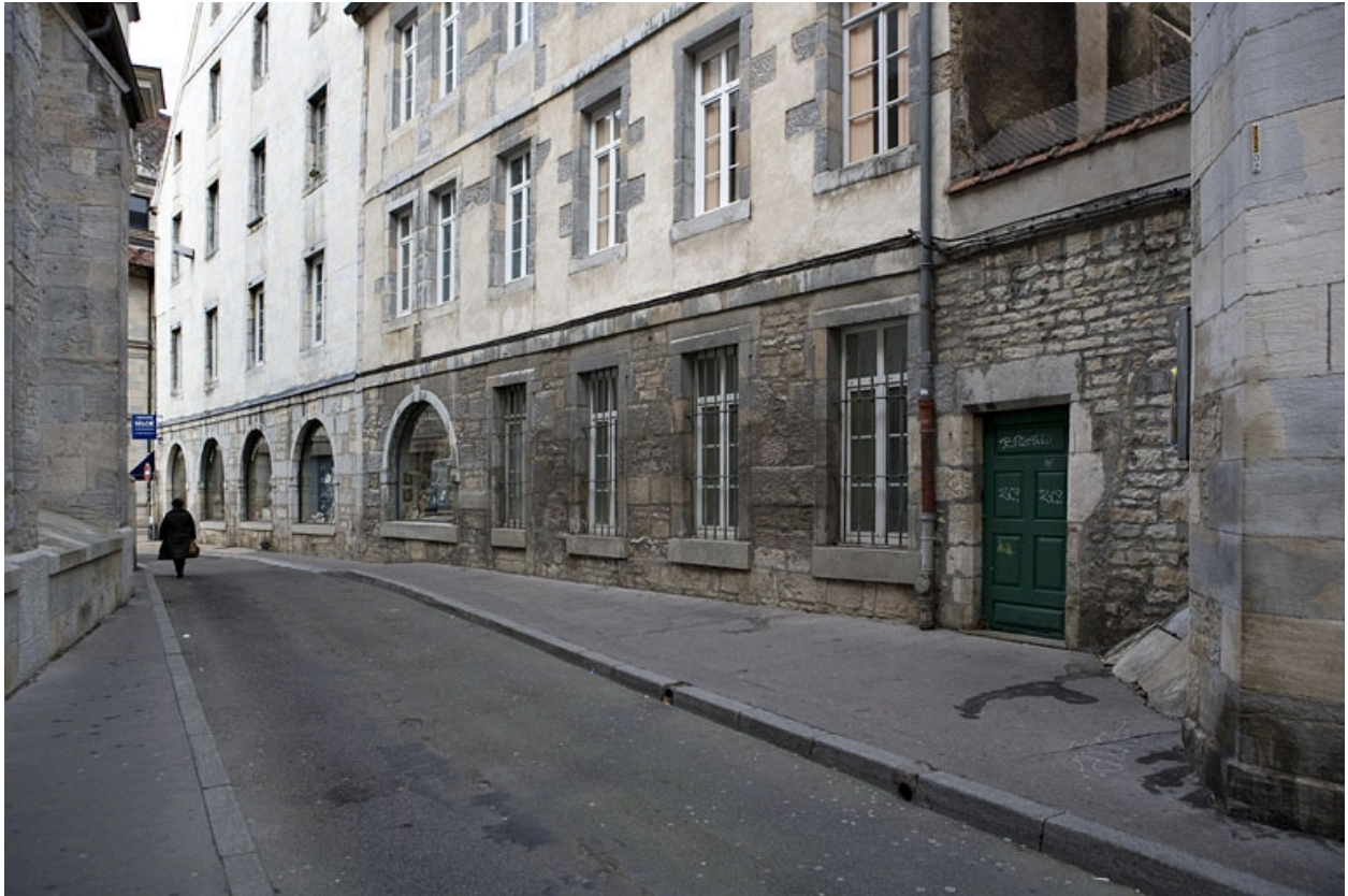
Détail des rez-de-chaussée de la façade latérale du logis principal et du logis secondaire depuis la rue de la Bibliothèque.