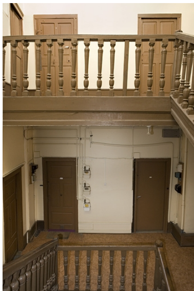
Détail de la rampe de l'escalier. IVR43_20082500266NUC2A