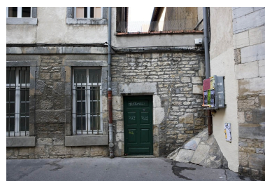
Détail de la porte secondaire située rue de la Bibliothèque.