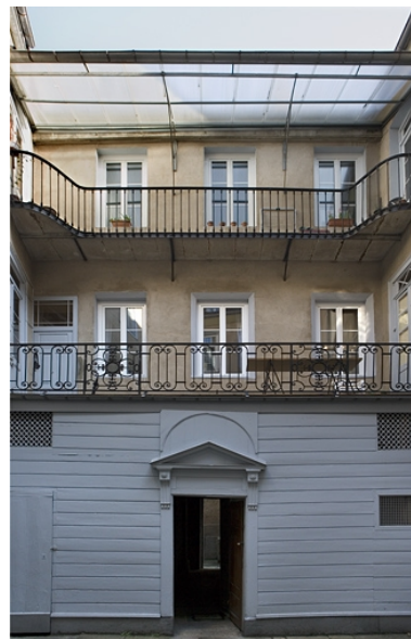
Première cour : détail de la façade principale du logis secondaire. IVR43_20082500261NUC2A