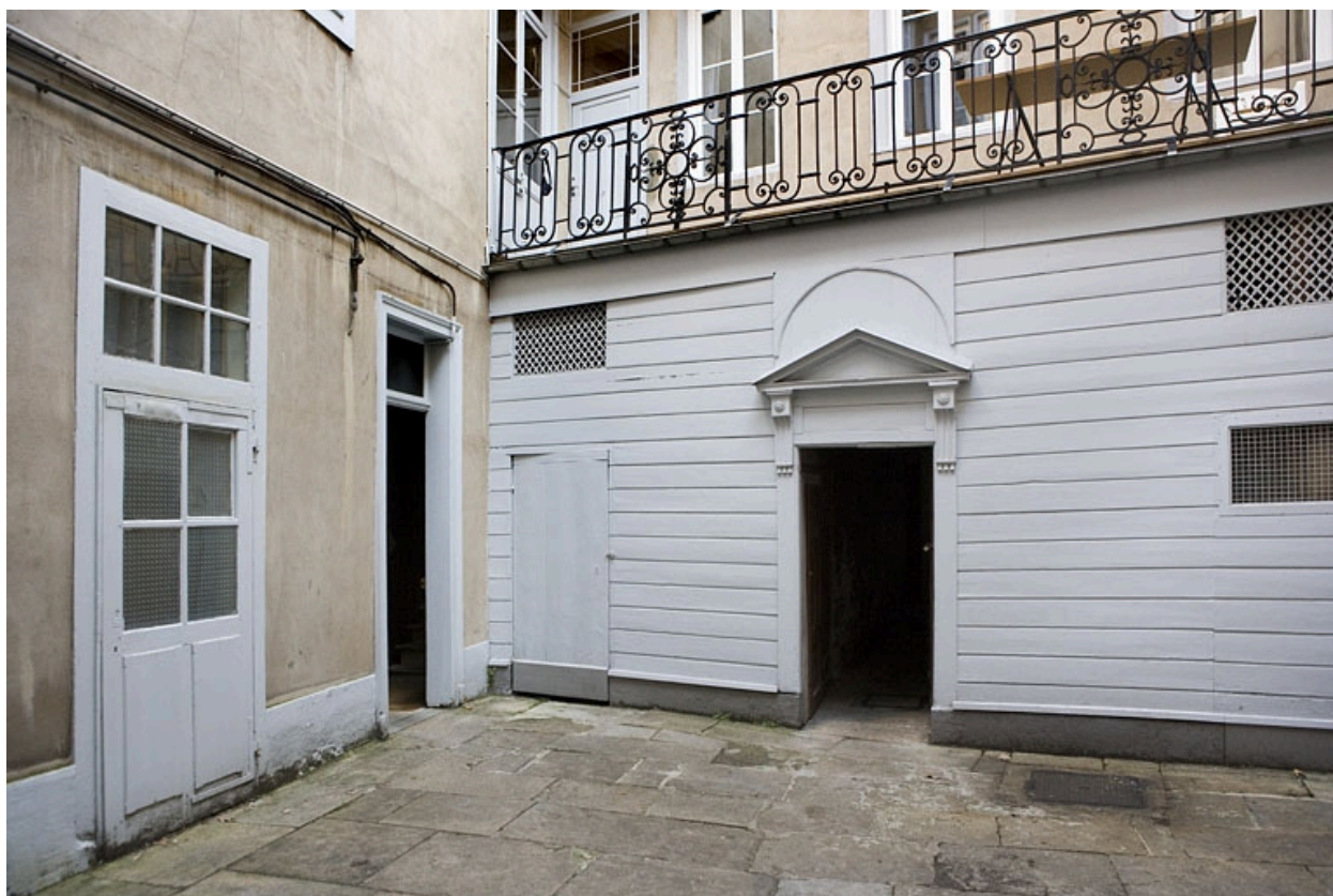
Vue du rez-de-chaussée des bâtiments au fond de la première cour : de trois quarts gauche.