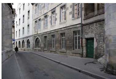
Détail des rez-de-chaussée de la façade latérale du logis principal et du logis secondaire depuis la rue de la Bibliothèque.