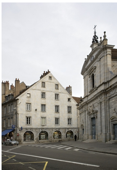
Vue d'ensemble de la façade latérale du logis principal de trois quarts droit. IVR43_20082500271NUC2A