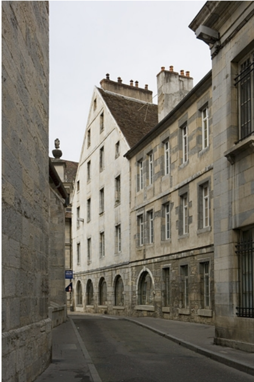
Détail de la façade latérale du logis principal et du logis secondaire depuis la rue de la Bibliothèque.