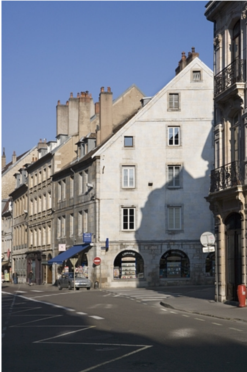
Vue d'ensemble du logis principal de trois quarts droit.