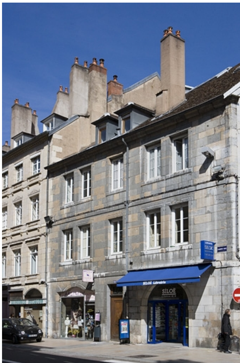
Vue d'ensemble de la façade principale du logis sur rue de trois quarts droit.