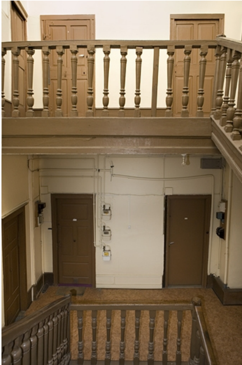
Détail de la rampe de l'escalier.