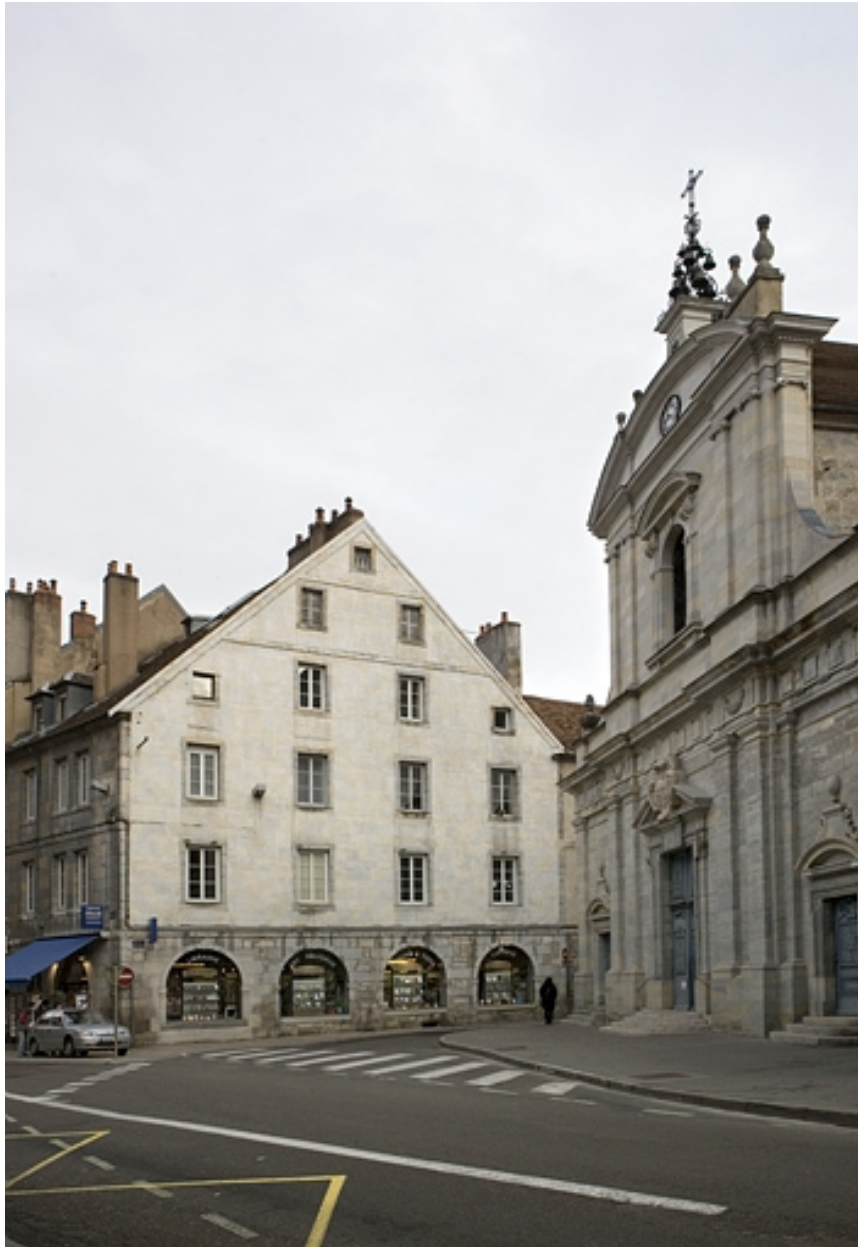
Vue d'ensemble de la façade latérale du logis principal de trois quarts droit.