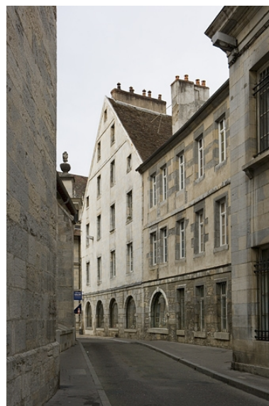
Détail de la façade latérale du logis principal et du logis secondaire depuis la rue de la Bibliothèque. IVR43_20082500269NUC2A