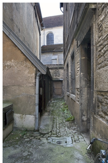
Détail des bâtiments autour de la deuxième cour. IVR43_20082500262NUC2A