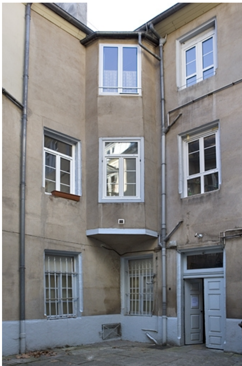
Détail des façades depuis le fond de la première cour.