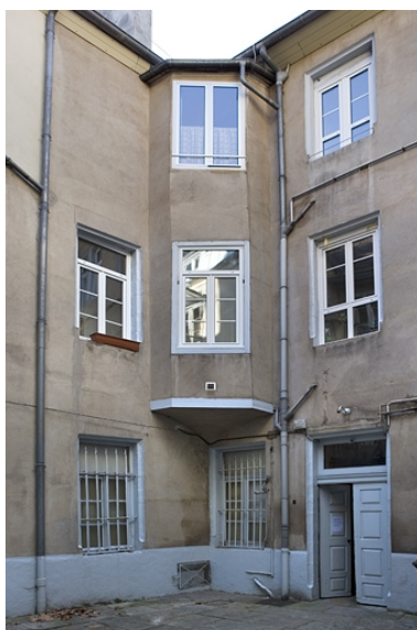
Détail des façades depuis le fond de la première cour. IVR43_20082500263NUC2A