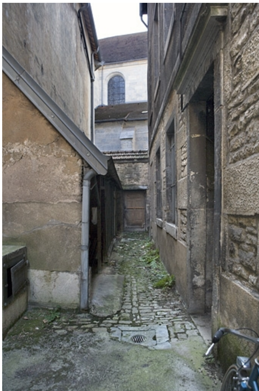
Détail des bâtiments autour de la deuxième cour.