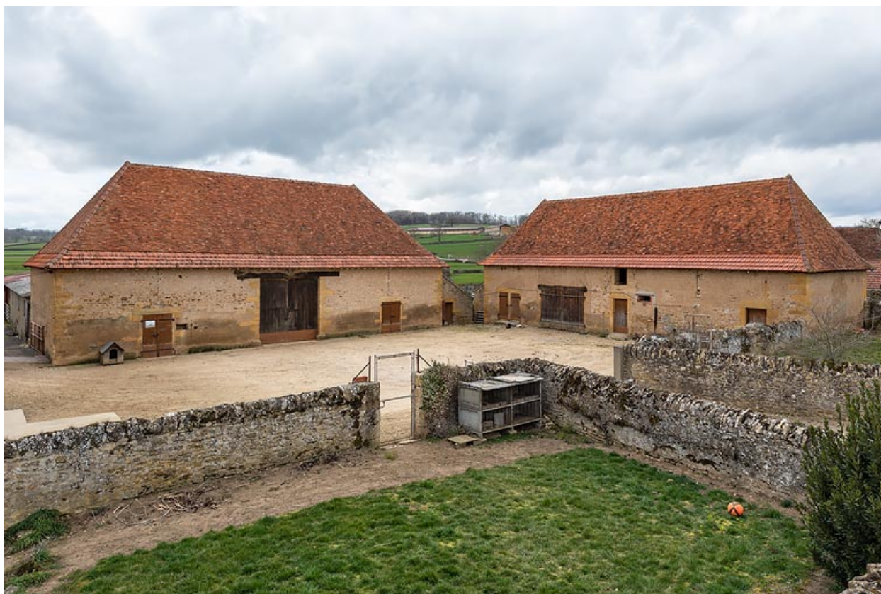
Vue de la grange, à l'ouest, et de la seconde dépendance, au nord de la cour