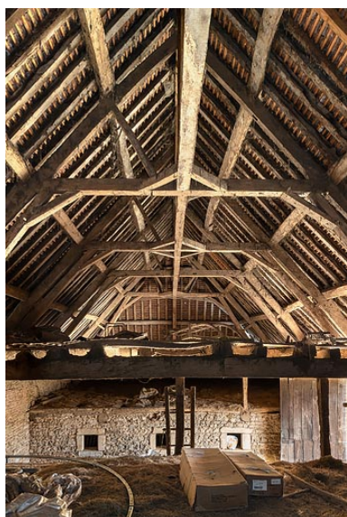
Charpente et fenil de la grange IVR26_20197100754NUC4A