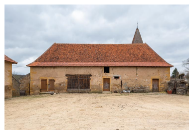
Seconde dépendance, abritant notamment une remise et des sous à cochons IVR26_20197100748NUC4A