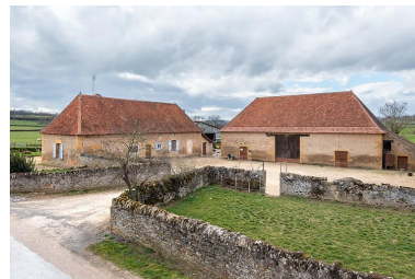
Vue de la maison, au sud, et de la grange, au fond de la cour, à l'ouest. IVR26_20197100752NUC4A