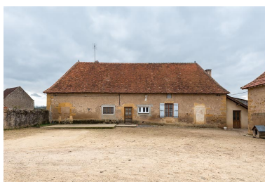
Vue de la façade antérieure de la maison IVR26_20197100749NUC4A