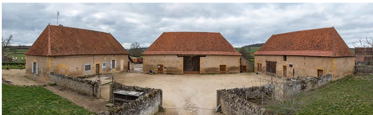
Vue de l'ensemble de la ferme