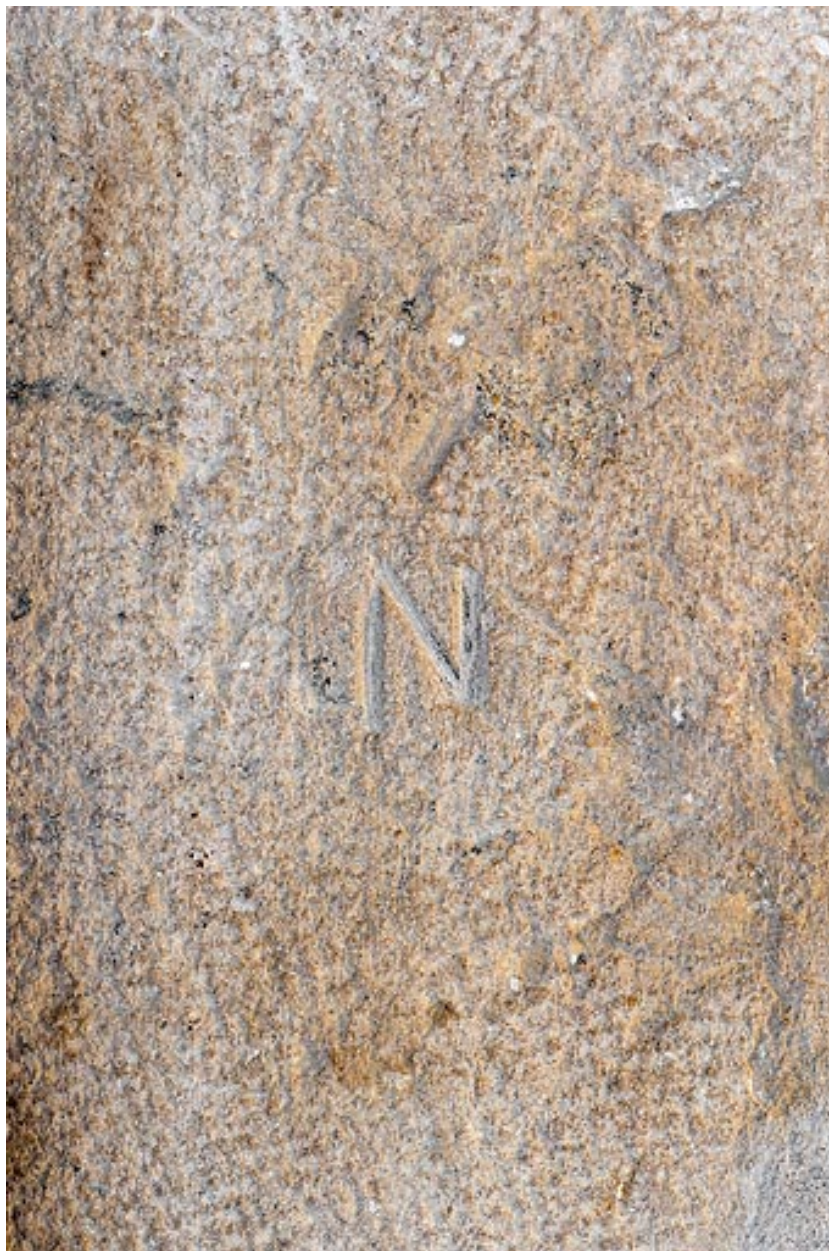
Pierre avec marque de tâcheron, dans l'encadrement d'une porte, à l'intérieur de la maison