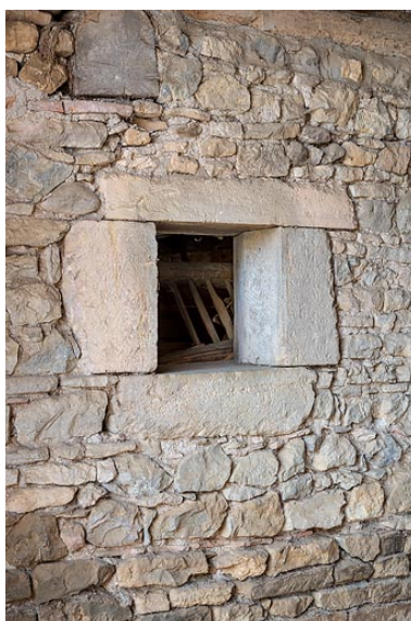
Feuron IVR26_20197100755NUC4A