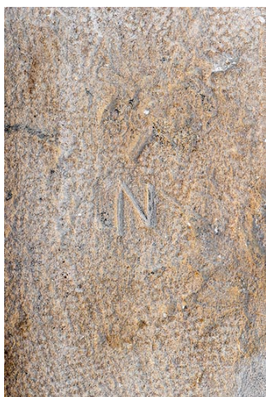
Pierre avec marque de tâcheron, dans l'encadrement d'une porte, à l'intérieur de la maison IVR26_20197100756NUC4A