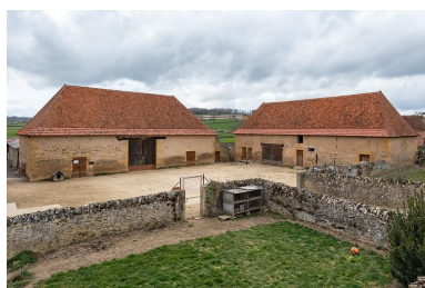
Vue de la grange, à l'ouest, et de la seconde dépendance, au nord de la cour IVR26_20197100751NUC4A