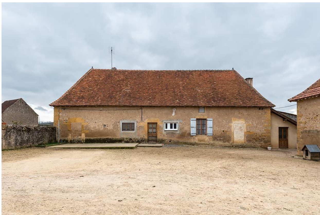
Vue de la façade antérieure de la maison