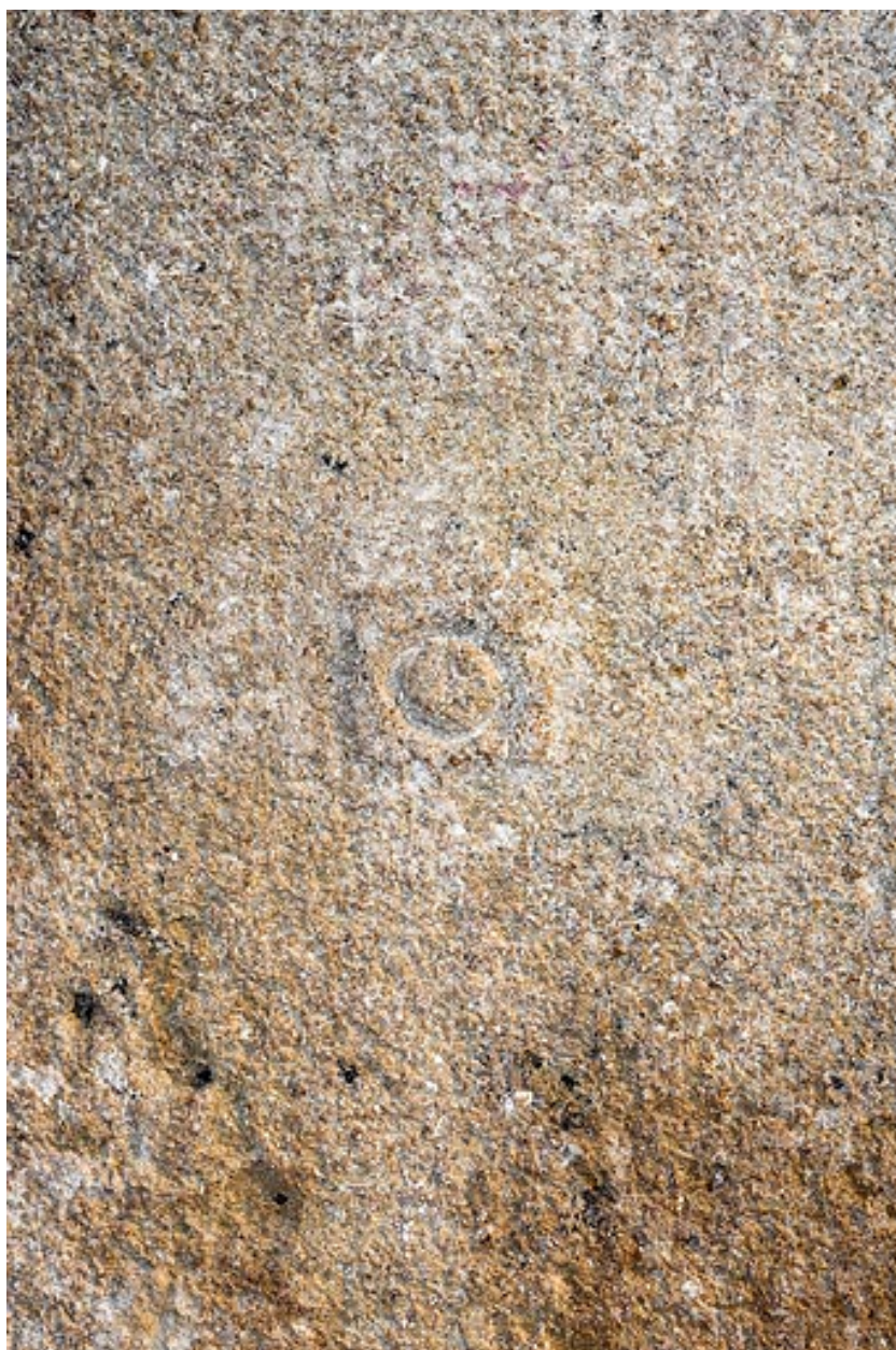
Pierre avec marque de tâcheron dans l'encadrement d'une porte, à l'intérieur de la maison