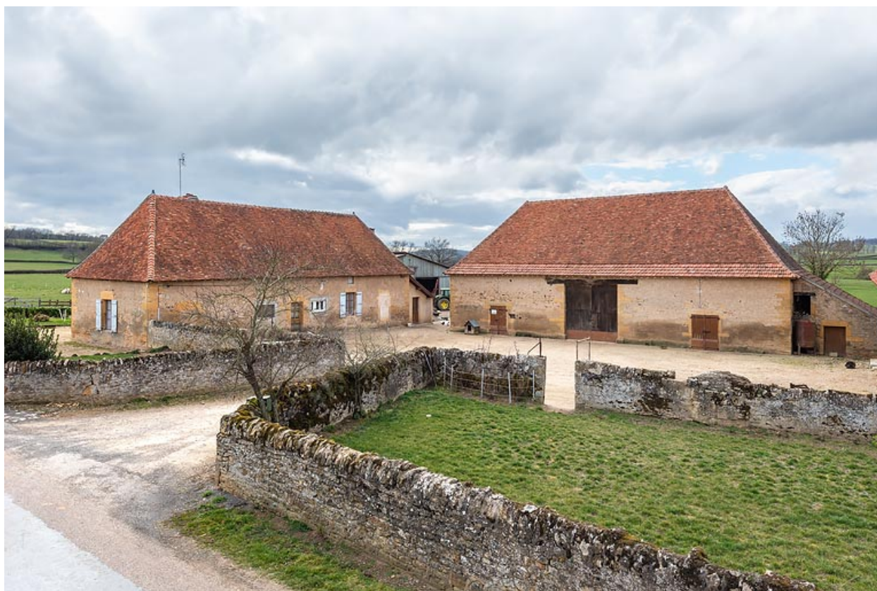
Vue de la maison, au sud, et de la grange, au fond de la cour, à l'ouest.