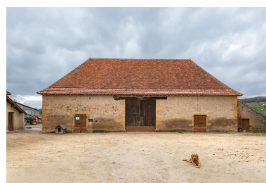
Grange, au fond de la cour, abritant une remise et deux étables doubles IVR26_20197100750NUC4A