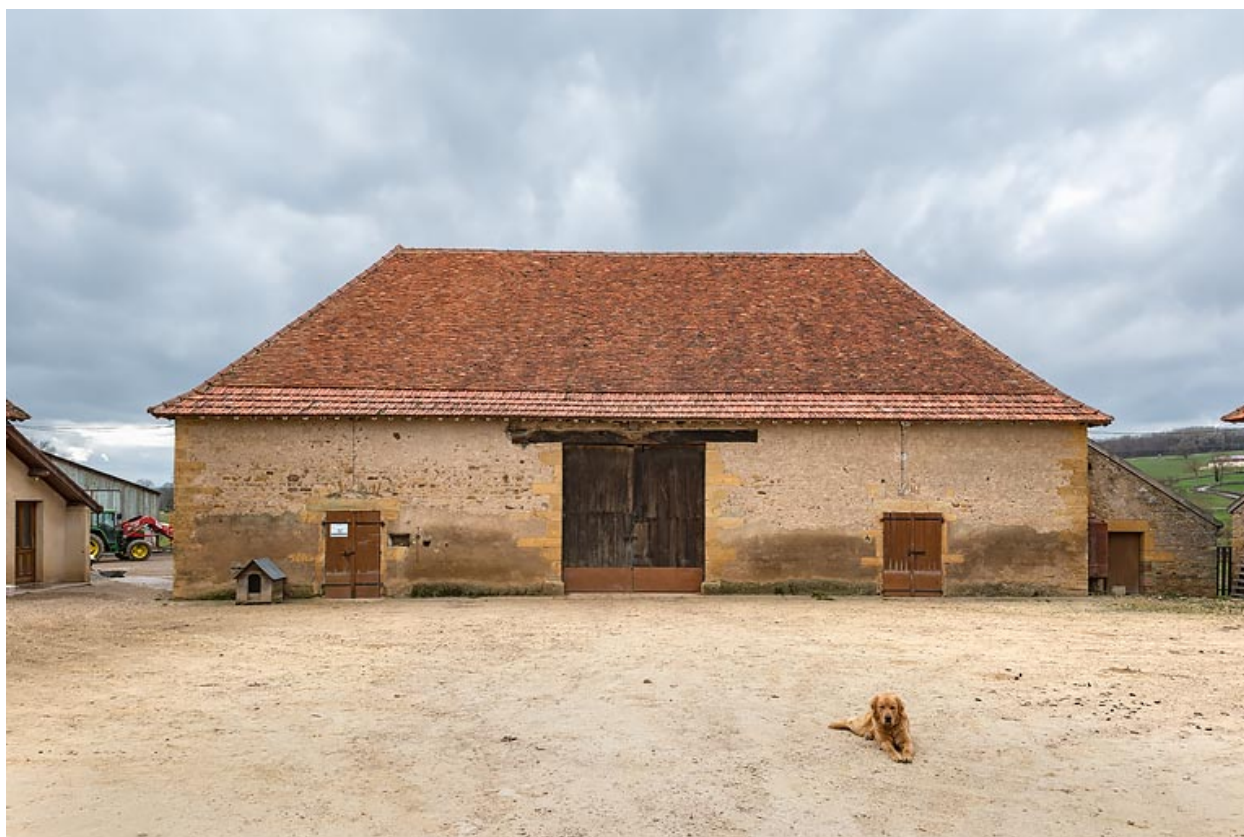
Grange, au fond de la cour, abritant une remise et deux étables doubles