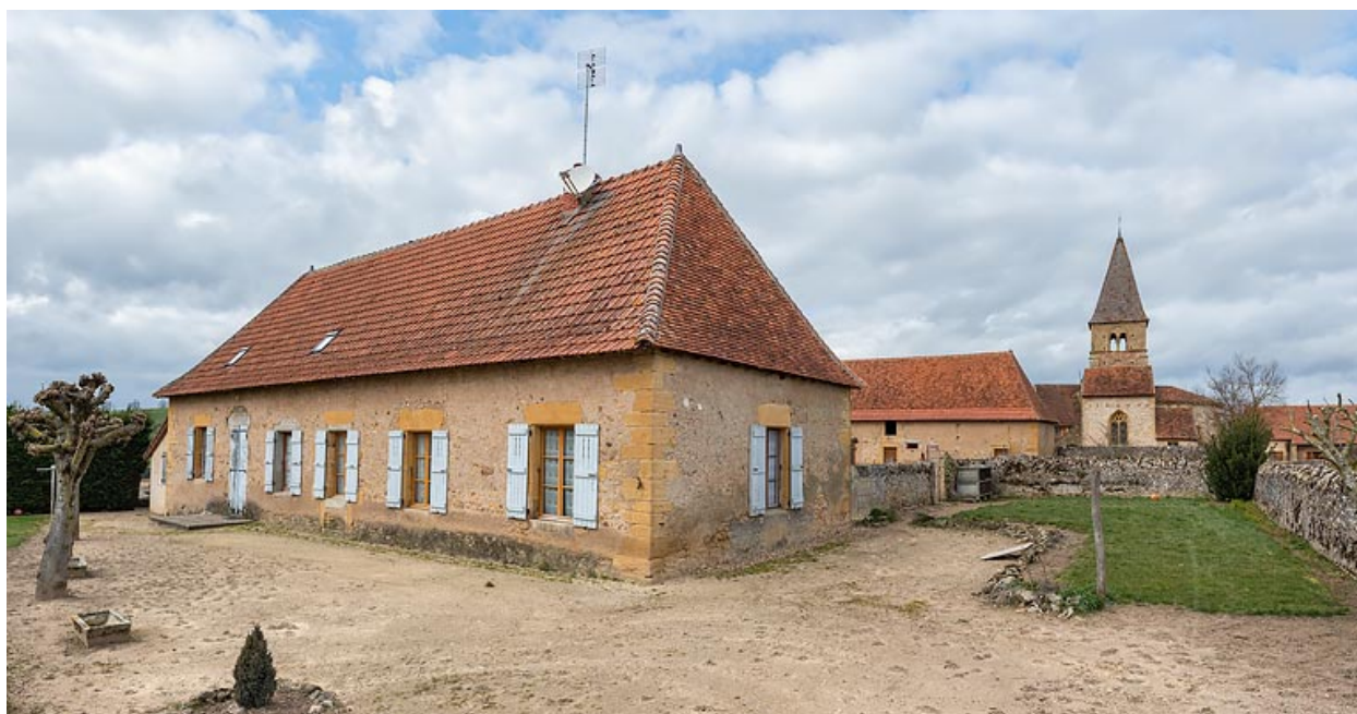
Façade postérieure de la maison. A l'arrière-plan, l'ancienne église paroissiale de Changy.