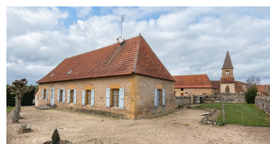
Façade postérieure de la maison. A l'arrière-plan, l'ancienne église paroissiale de Changy.