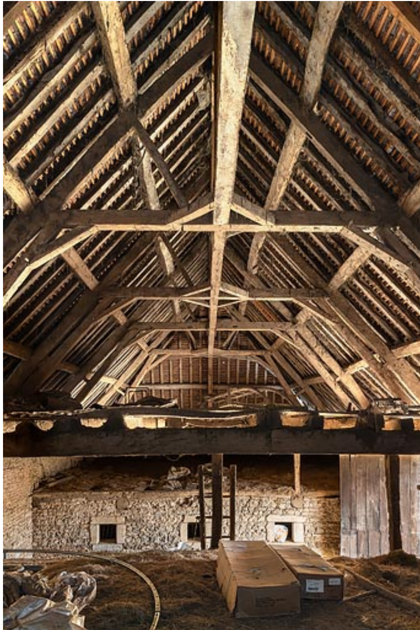
Charpente et fenil de la grange