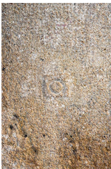
Pierre avec marque de tâcheron dans l'encadrement d'une porte, à l'intérieur de la maison IVR26_20197100757NUC4A