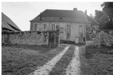
Façade antérieure.