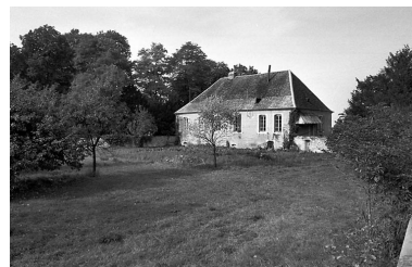
Façade postérieure. IVR43_19797000246Z