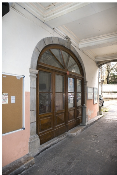
Détail de l'entrée de l'escalier à gauche du passage cochier. IVR43_20092500198NUC2A