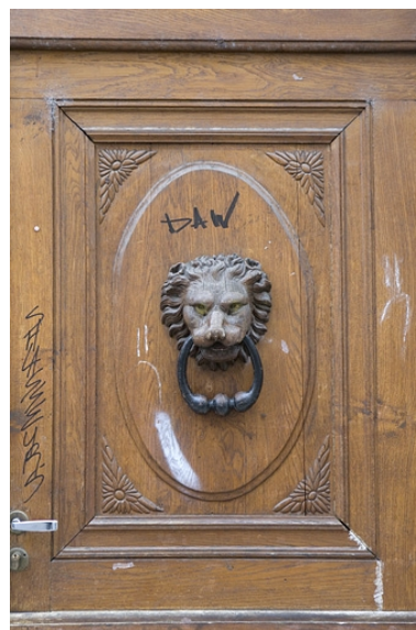
Vantail droit du portail d'entrée : détail du panneau central. IVR43_20092500191NUC2A