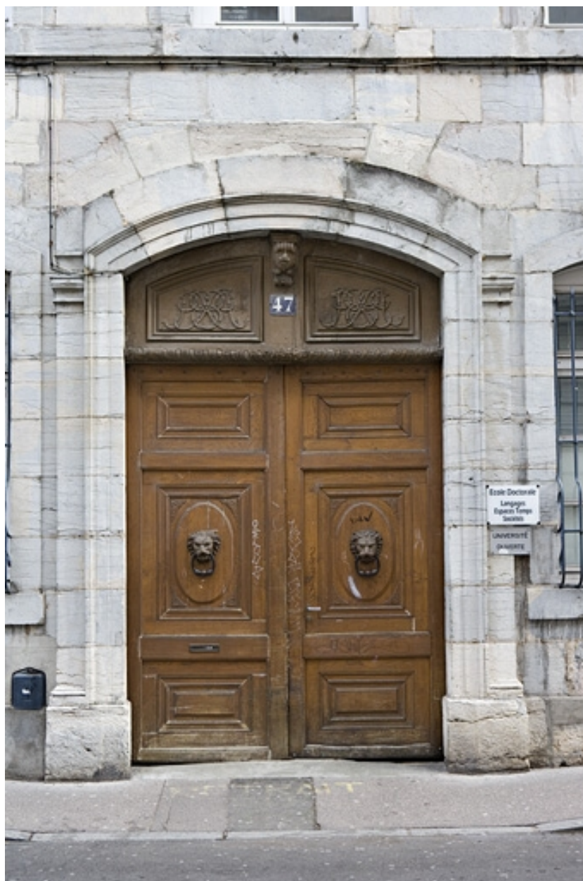
Détail du portail d'entrée.