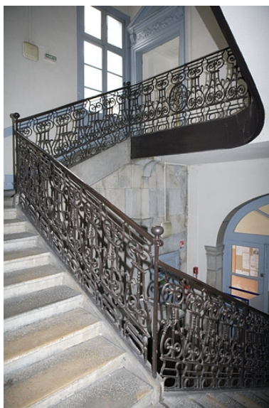
Vue d'ensemble de l'escalier.