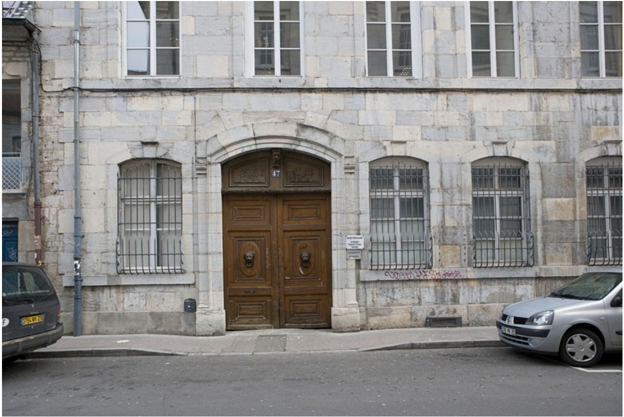
Détail du rez-de-chaussée de la façade principale.