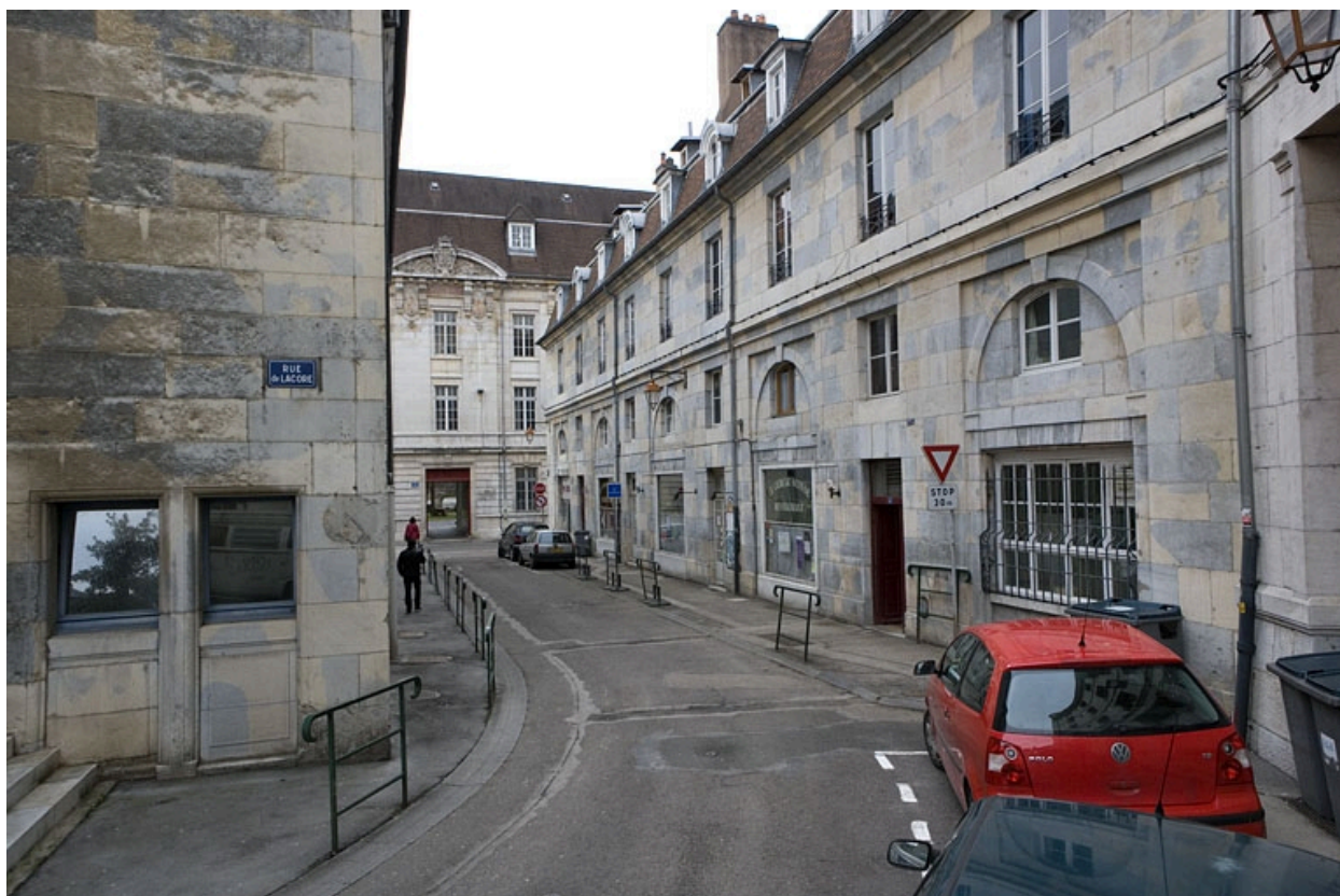
Vue d'ensemble de la façade située sur la rue secondaire.