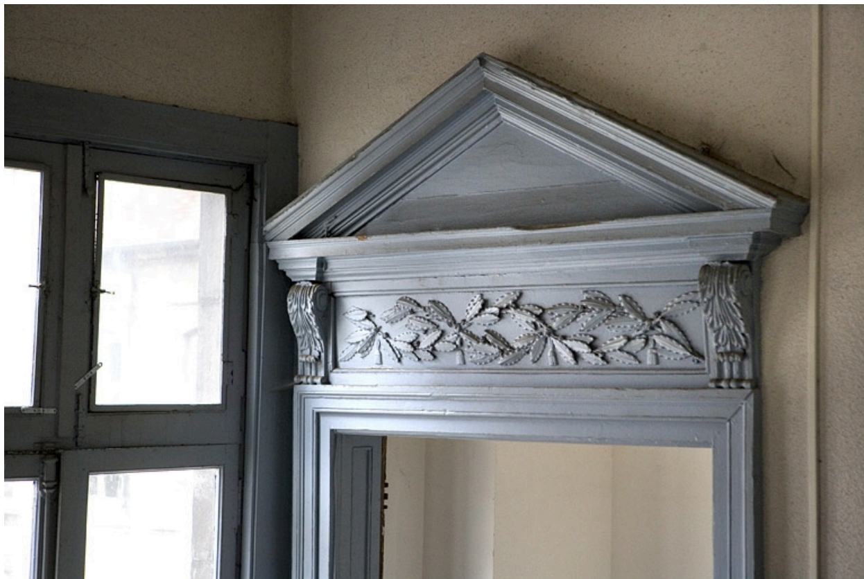
Détail d'un dessus de porte du premier étage.