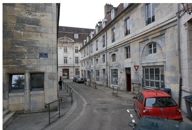
Vue d'ensemble de la façade située sur la rue secondaire. IVR43_20092500187NUC2A