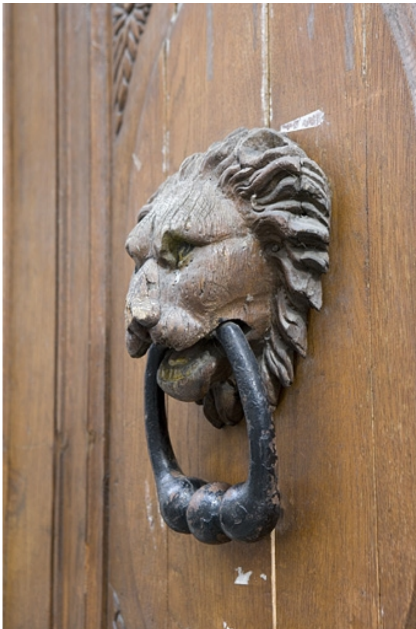
Vantail droit du portail d'entrée : détail du mufle de lion situé sur le panneau central, de trois quarts.