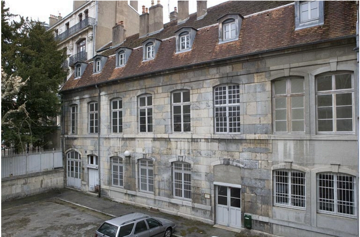
Vue d'ensemble de l'aile droite depuis l'entrée de la cour.