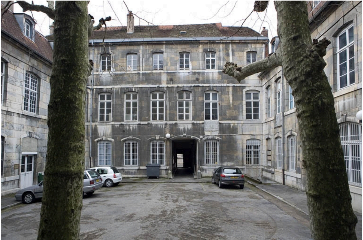
Vue d'ensemble de la façade postérieure du logis principal depuis le fond de la cour.