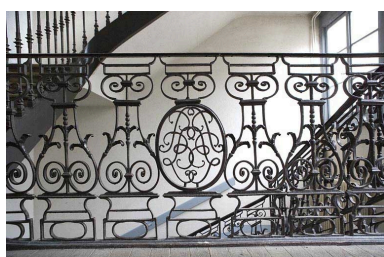
Détail des motifs en fer forgé de la rampe d'escalier.