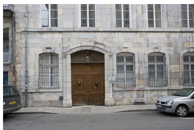
Détail du rez-de-chaussée de la façade principale.