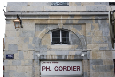
Détail d'une baie sur la rue secondaire. IVR43_20092500186NUC2A