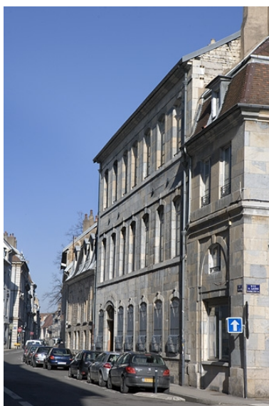
Vue d'ensemble de la façade antérieure dans l'alignement de la rue.