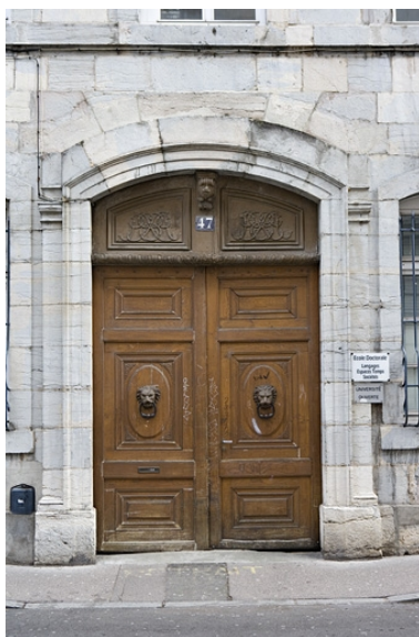
Détail du portail d'entrée.