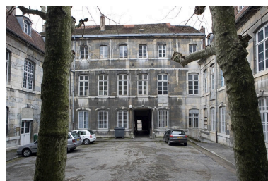
Vue d'ensemble de la façade postérieure du logis principal depuis le fond de la cour. IVR43_20092500194NUC2A