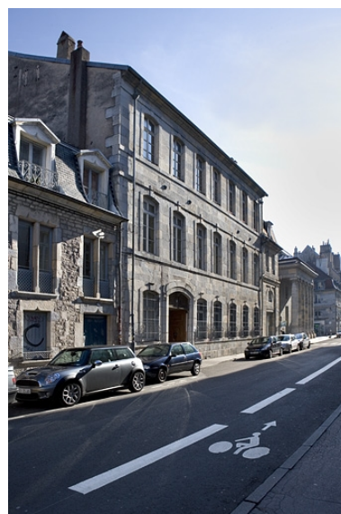
Vue d'ensemble rapprochée de la façade antérieure. IVR43_20092500184NUC2A