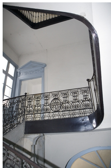
Détail de la rampe de l'escalier.