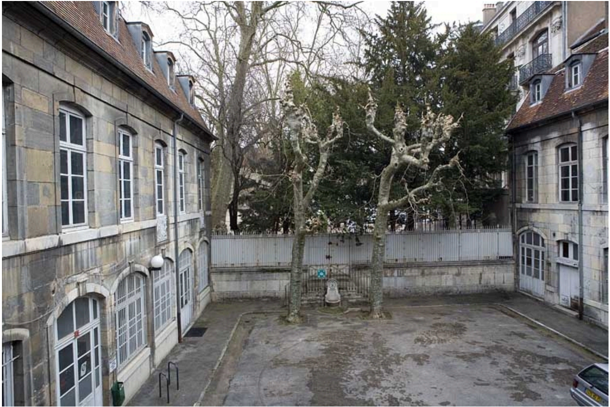
Vue d'ensemble de la cour depuis l'entrée.