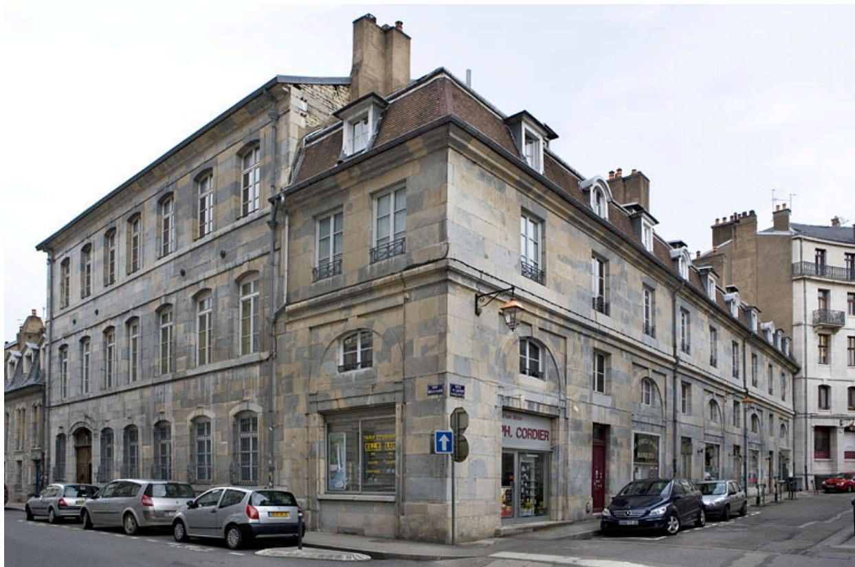
Vue d'ensemble du logis principal à l'angle des deux rues.