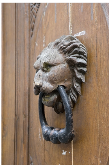
Vantail droit du portail d'entrée : détail du mufle de lion situé sur le panneau central, de trois quarts. IVR43_20092500193NUC2A