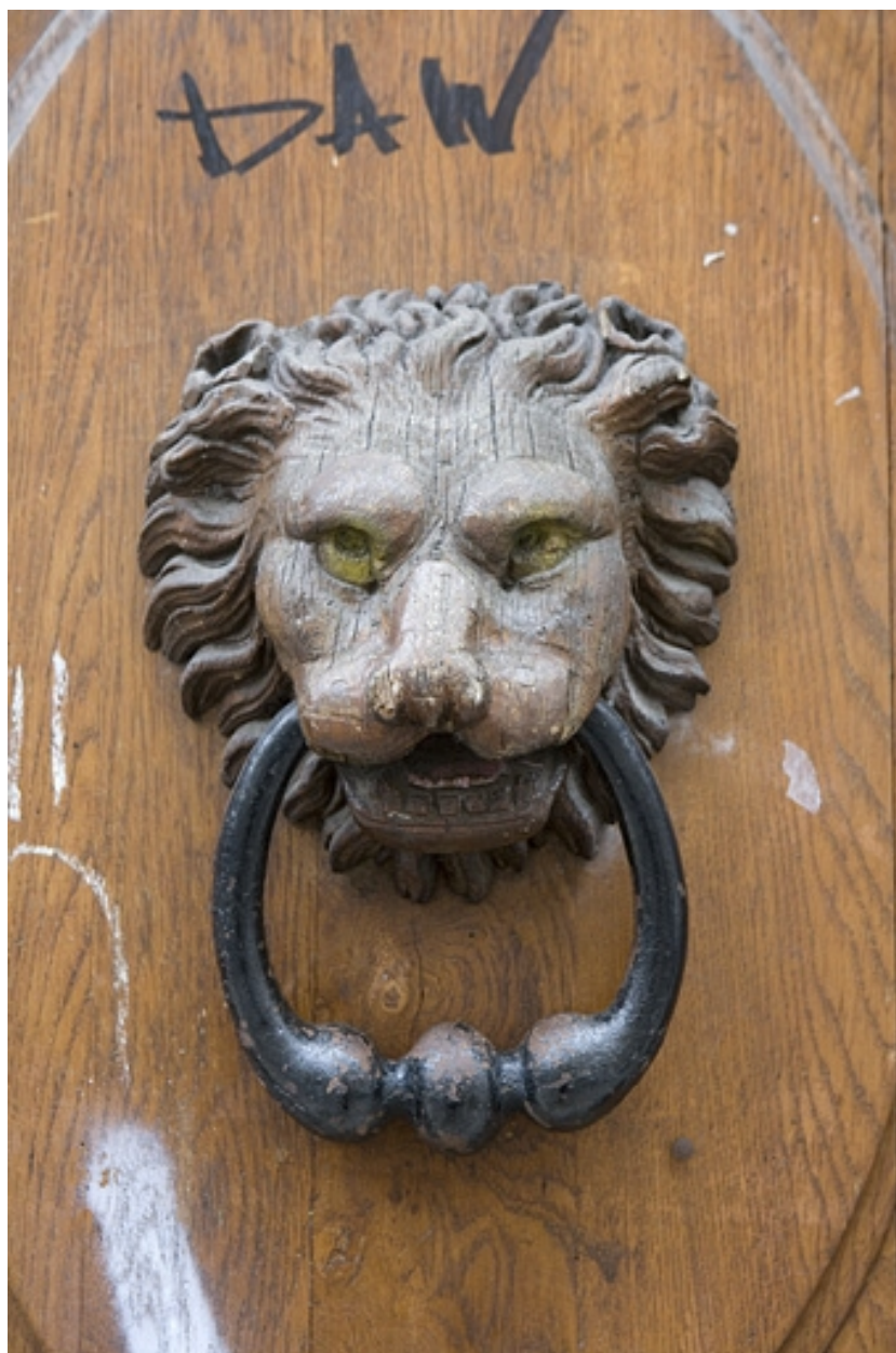
Vantail droit du portail d'entrée : détail du mufle de lion situé sur le panneau central, de face.