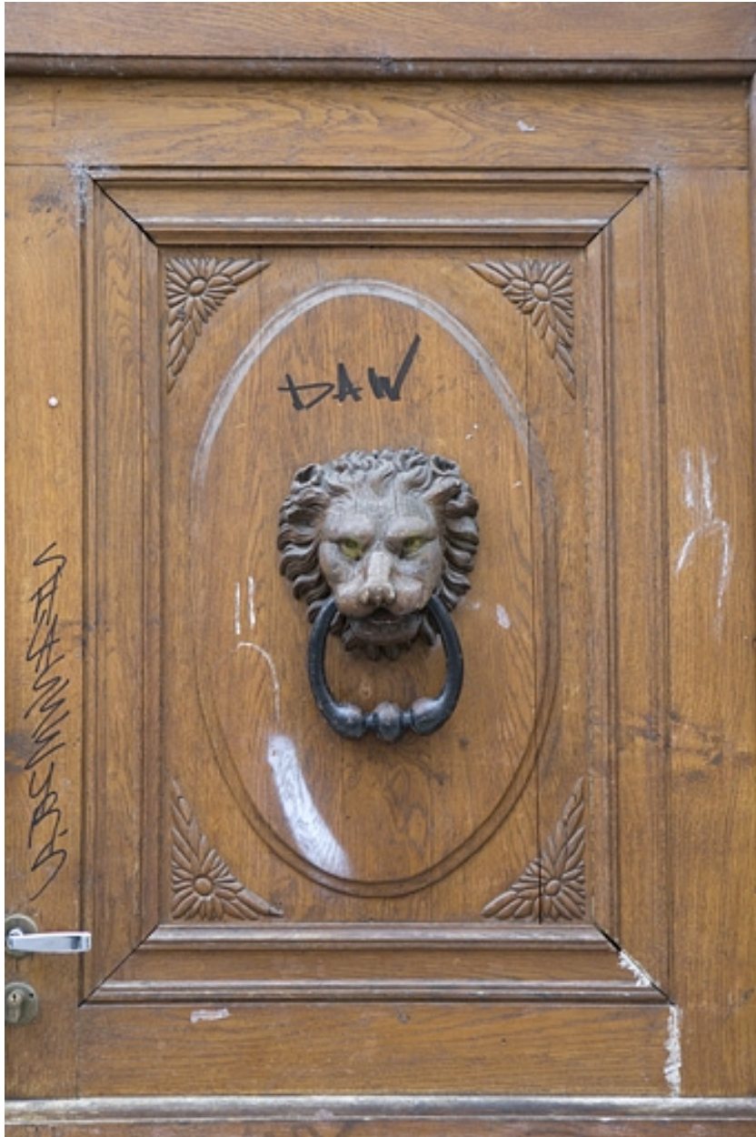
Vantail droit du portail d'entrée : détail du panneau central.