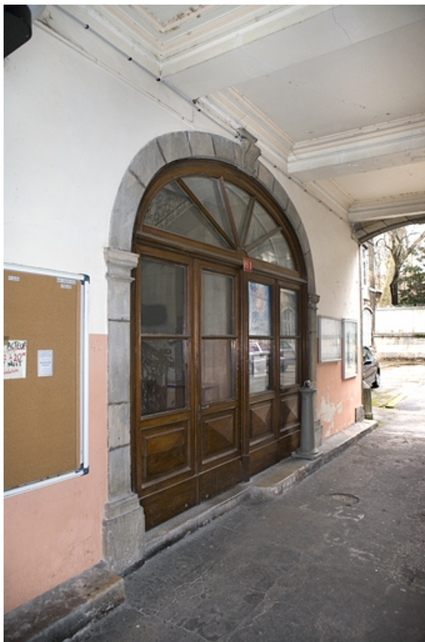
Détail de l'entrée de l'escalier à gauche du passage cocher.