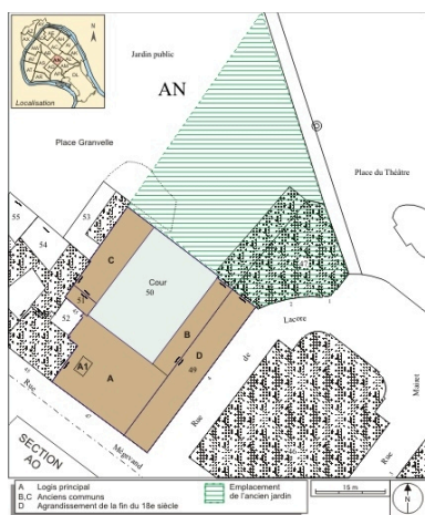
Plan masse et de situation. Extrait du plan cadastral, 1974, section AN.