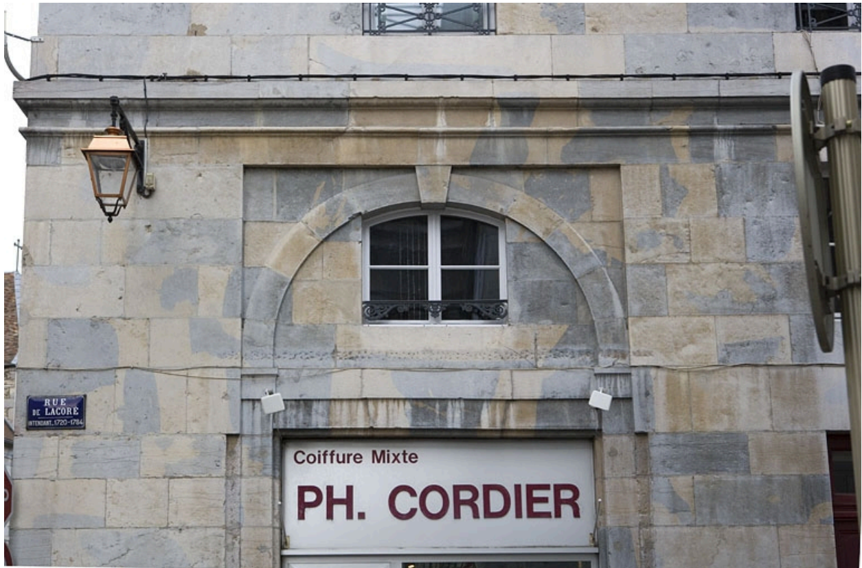
Détail d'une baie sur la rue secondaire.