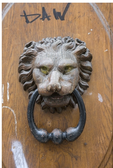
Vantail droit du portail d'entrée : détail du mufle de lion situé sur le panneau central, de face. IVR43_20092500192NUC2A