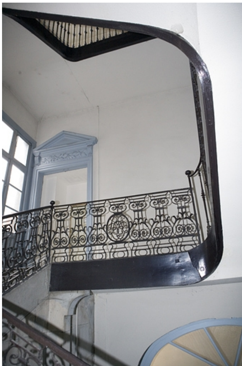
Détail de la rampe de l'escalier.