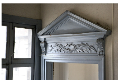
Détail d'un dessus de porte du premier étage. IVR43_20092500201NUC2A