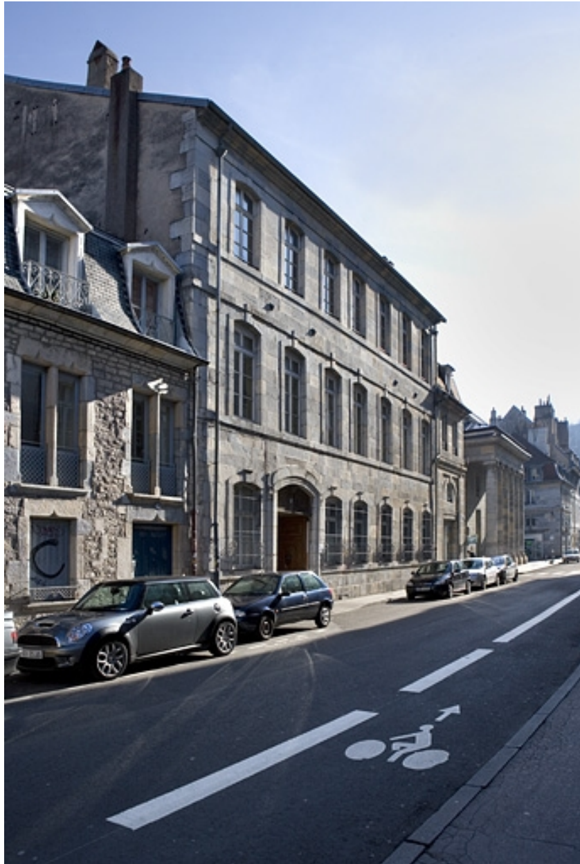
Vue d'ensemble rapprochée de la façade antérieure.