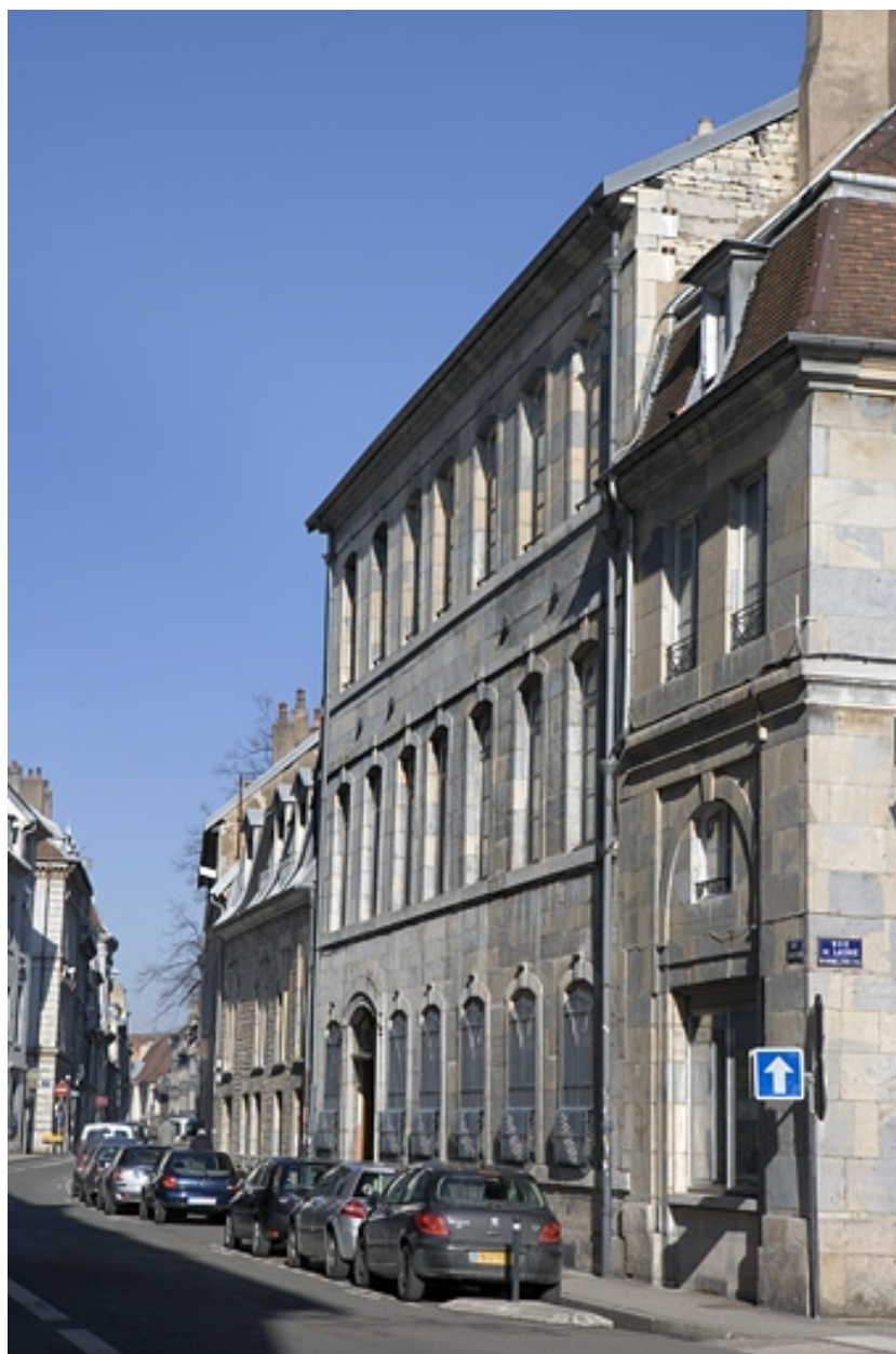
Vue d'ensemble de la façade antérieure dans l'alignement de la rue.