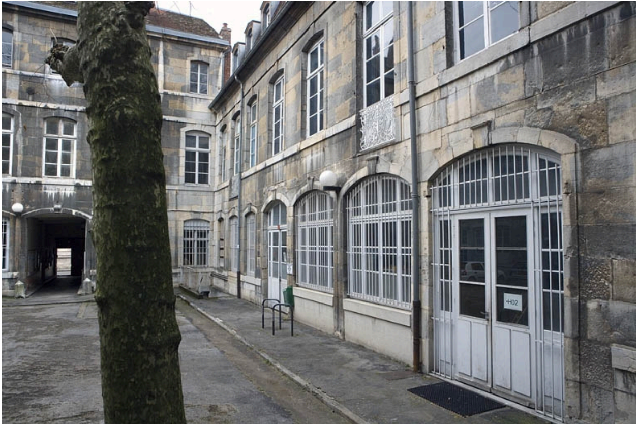
Vue d'ensemble de l'aile gauche depuis le fond de la cour.