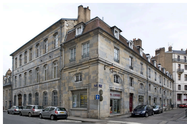
Vue d'ensemble du logis principal à l'angle des deux rues. IVR43_20092500185NUC2A