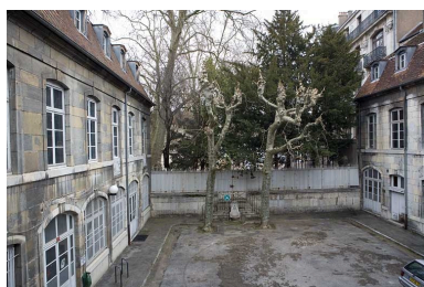
Vue d'ensemble de la cour depuis l'entrée.