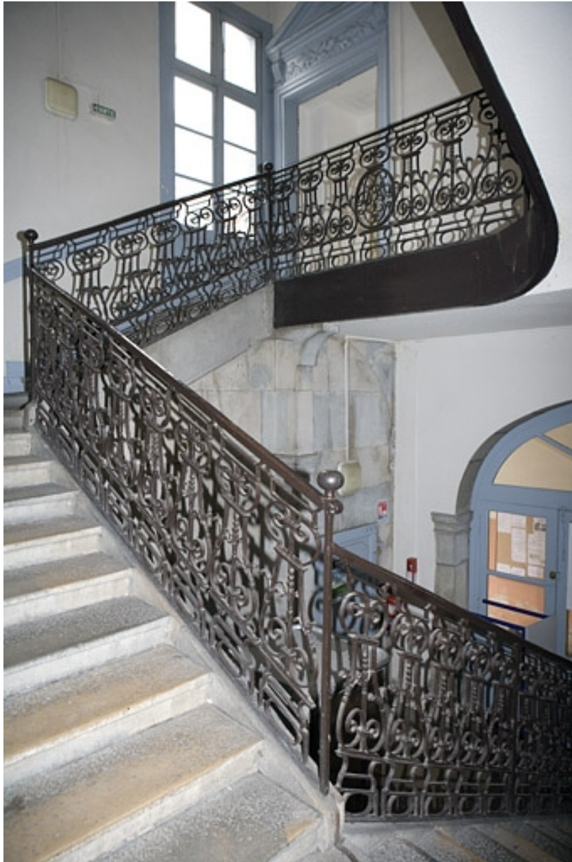
Vue d'ensemble de l'escalier.