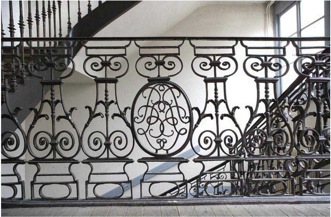
Détail des motifs en fer forgé de la rampe d'escalier.