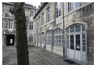
Vue d'ensemble de l'aile gauche depuis le fond de la cour.