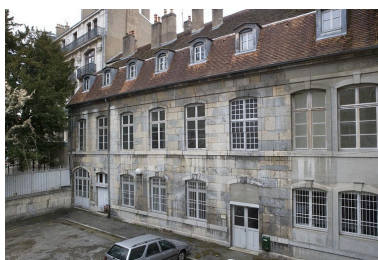
Vue d'ensemble de l'aile droite depuis l'entrée de la cour.