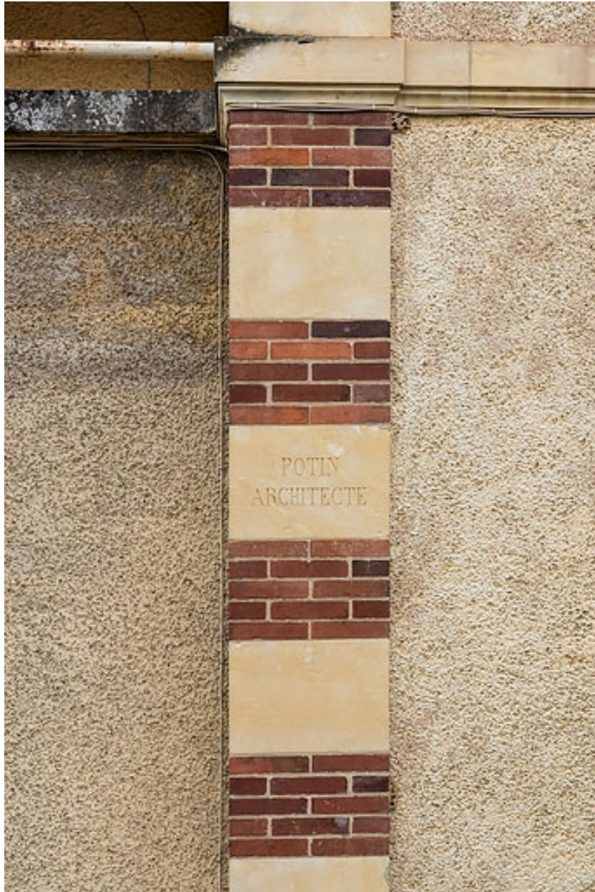
Ressaut gauche de l'avant-corps de la façade principale, signature : "POTIN ARCHITECTE".