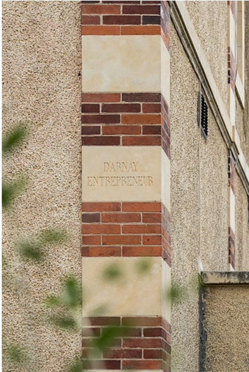
Ressaut droit de l'avant-corps de la façade principale, signature : "DARNAY ENTREPRENEUR".