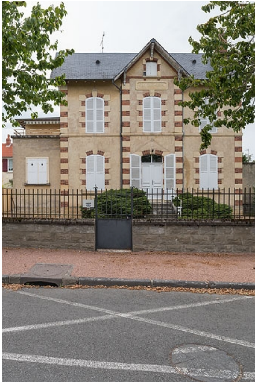
Vue de face, depuis l'avenue du Casino.