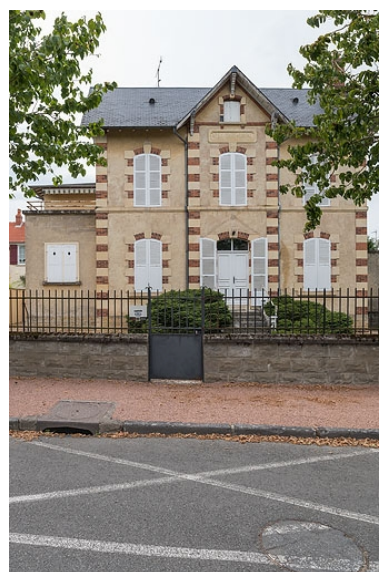
Vue de face, depuis l'avenue du Casino. IVR26_20205800566NUC4A