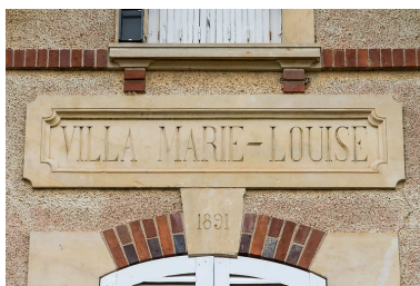
Avant-corps de la façade principale, inscription : "VILLA MARIE-LOUISE". IVR26_20205800570NUC4A