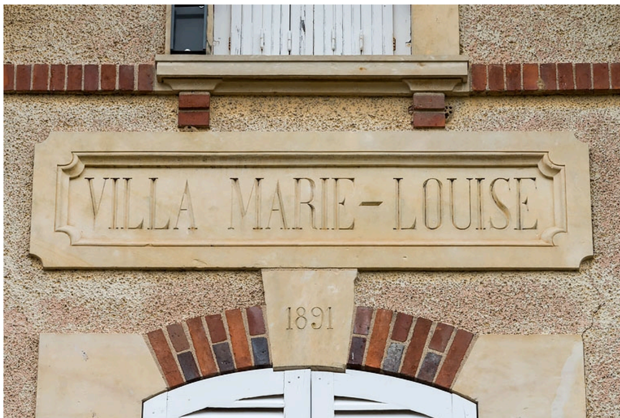
Avant-corps de la façade principale, inscription : "VILLA MARIE-LOUISE".