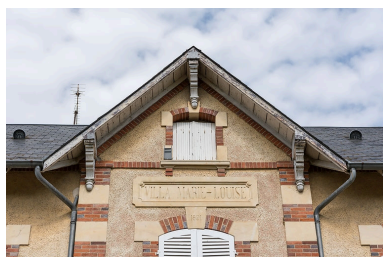
Pignon. IVR26_20205800569NUC4A