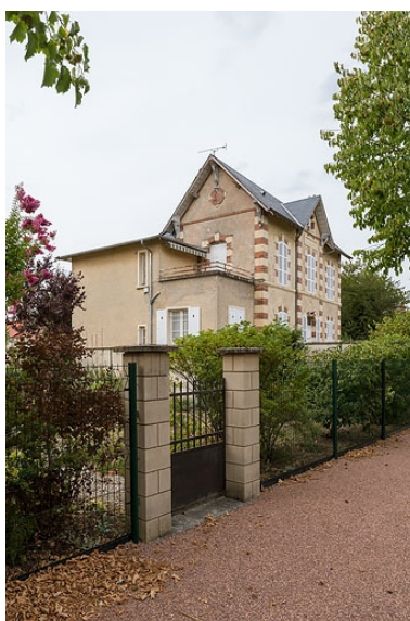
Vue de trois-quarts, depuis l'avenue du Casino. IVR26_20205800571NUC4A