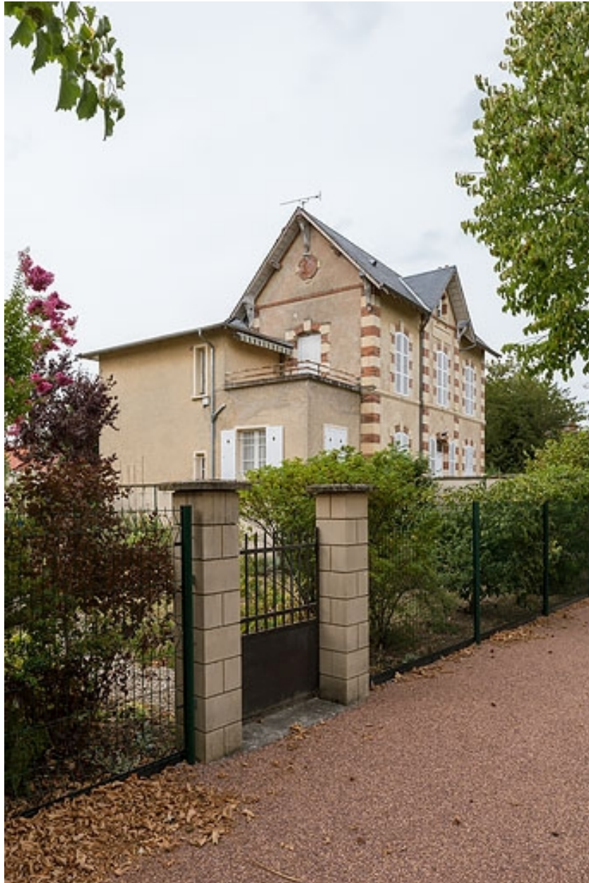
Vue de trois-quarts, depuis l'avenue du Casino.