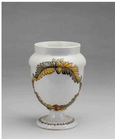
Un albarello. IVR43_20003900067XA