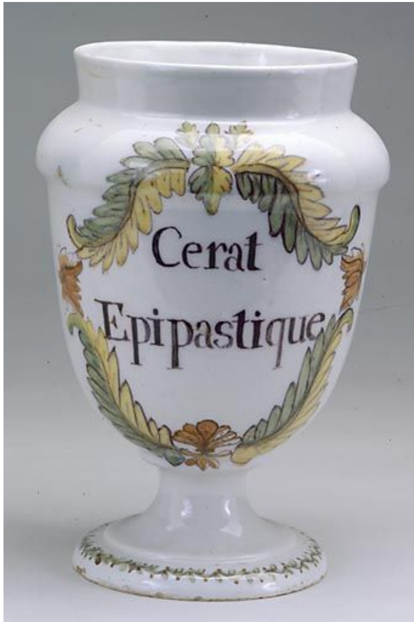
Un pot à thieraque.