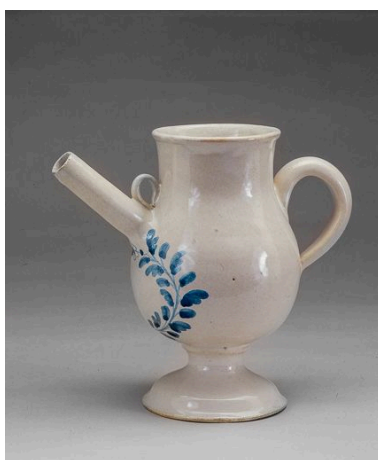
Une chevrette. IVR43_20003900073XA