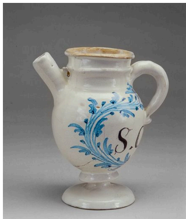
Une chevrette.