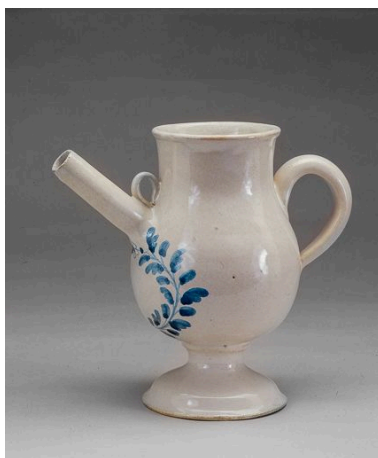
Une chevrette.