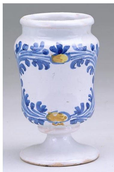
Un albarello. IVR43_20003900097XA