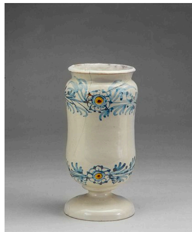
Un albarello.