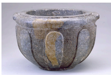
Un mortier. IVR43_20003900113XA