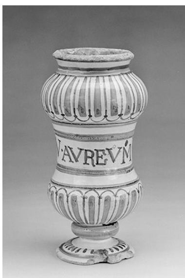
Un albarello.