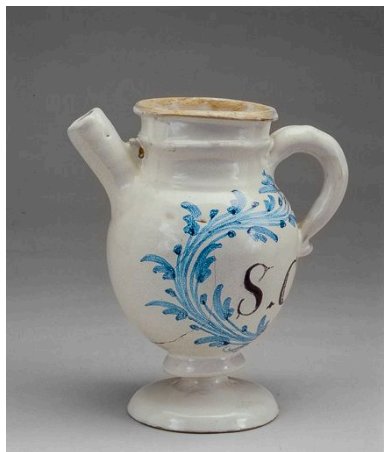
Une chevette.