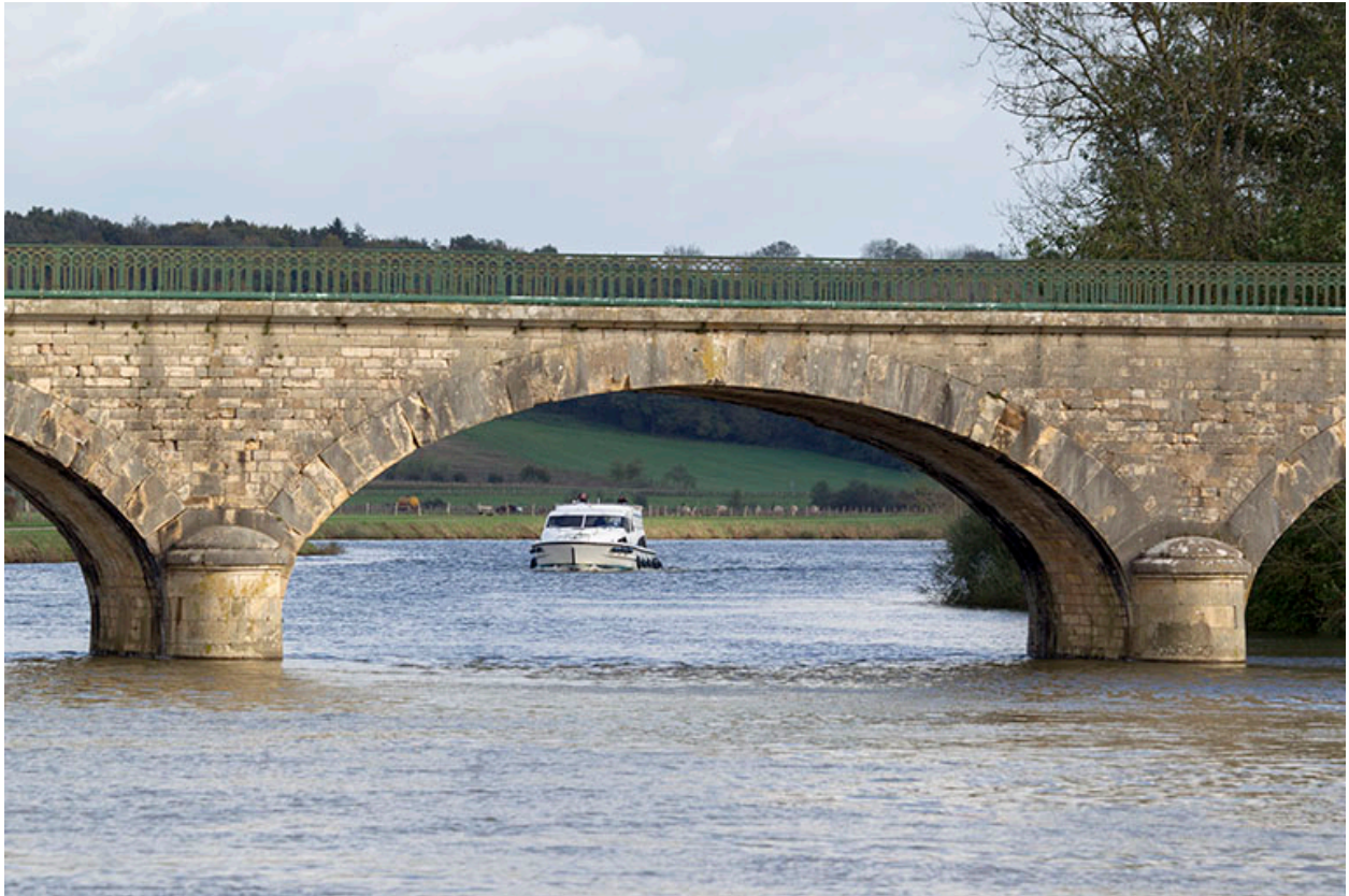
Détail d'une arche maçonnée du pont.