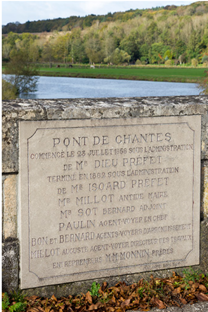
Plaque commémorative sur la construction de l'édifice.