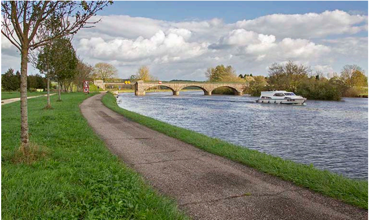
Vue depuis l'aval.