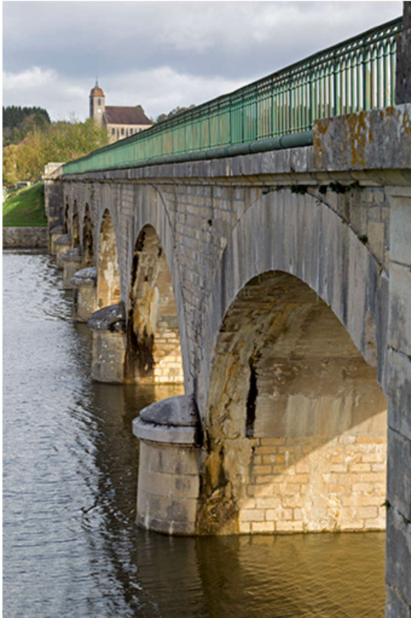
Vue de profil.