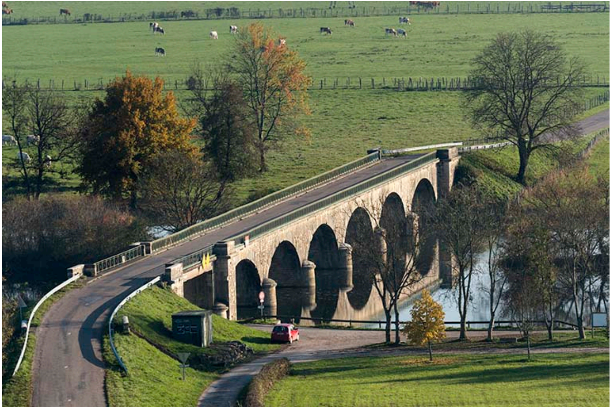
Vue générale du pont depuis le château de Rupt-sur-Saône.