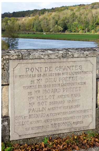
Plaque commémorative sur la construction de l'édifice. IVR43_20157000123NUC2A