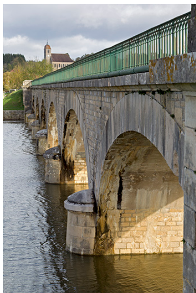
Vue de profil. IVR43_20157000124NUC2A