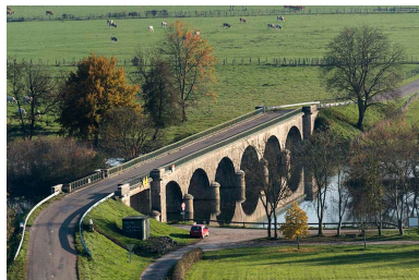
Vue générale du pont depuis le château de Rupt-sur-Saône.