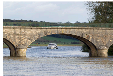
Détail d'une arche maçonnée du pont. IVR43_20157000125NUC2A