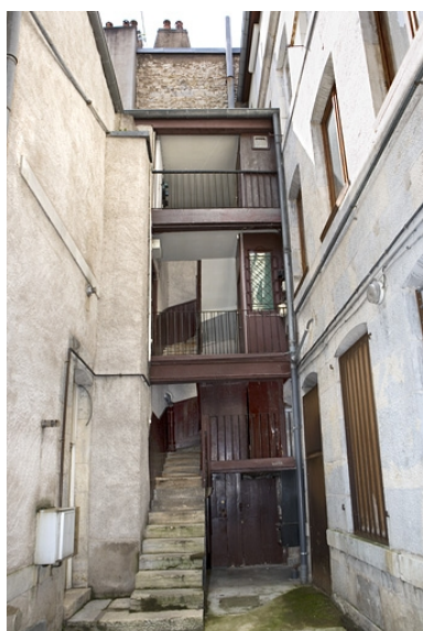
Vue d'ensemble des logis secondaires depuis l'entrée de la cour.