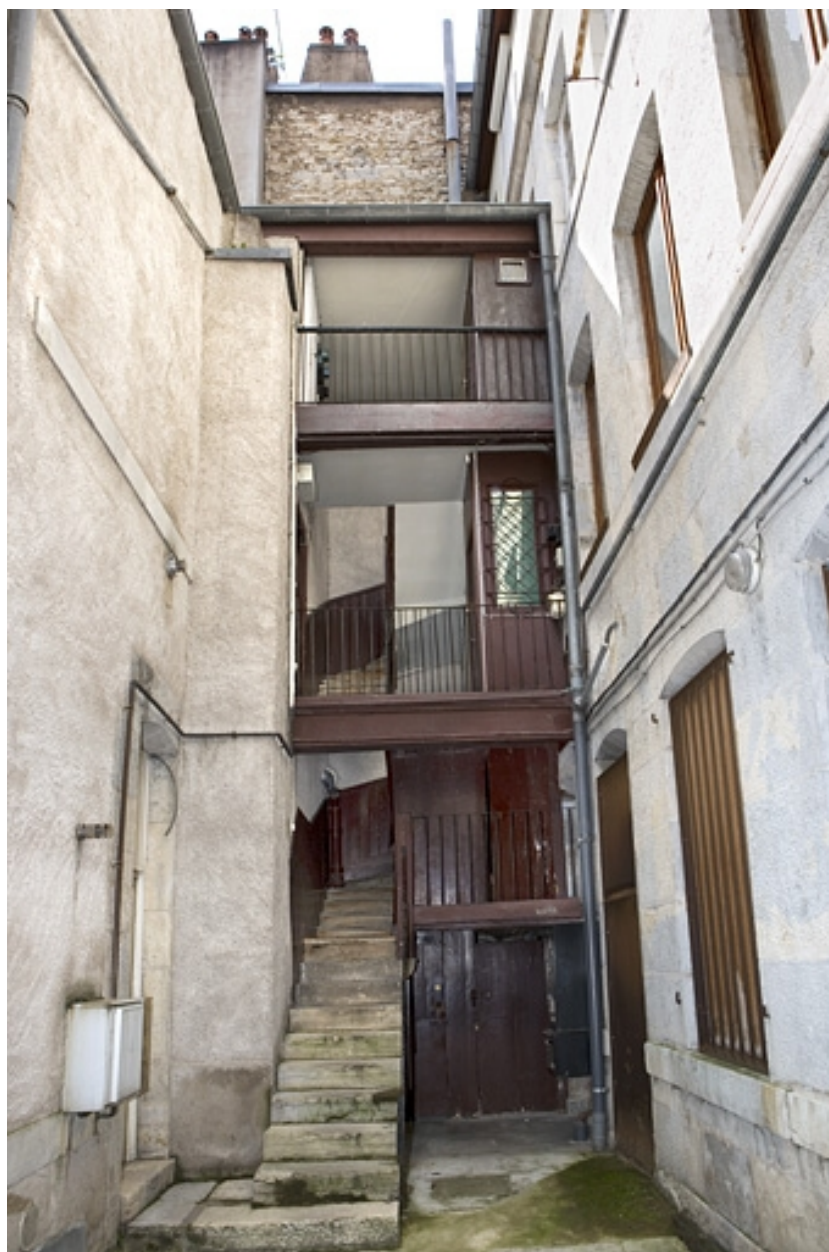
Vue d'ensemble des logis secondaires depuis l'entrée de la cour.