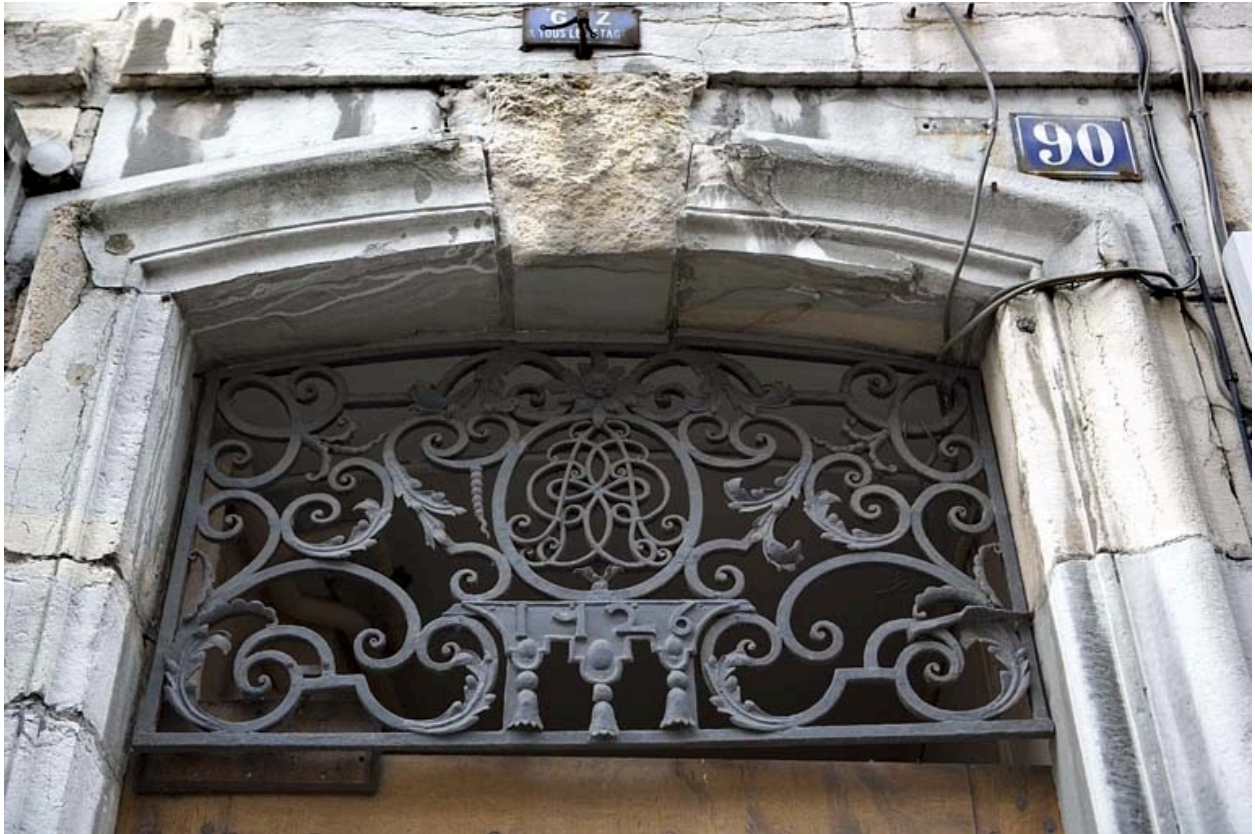
Détail du tympan en ferronnerie de la porte du couloir.