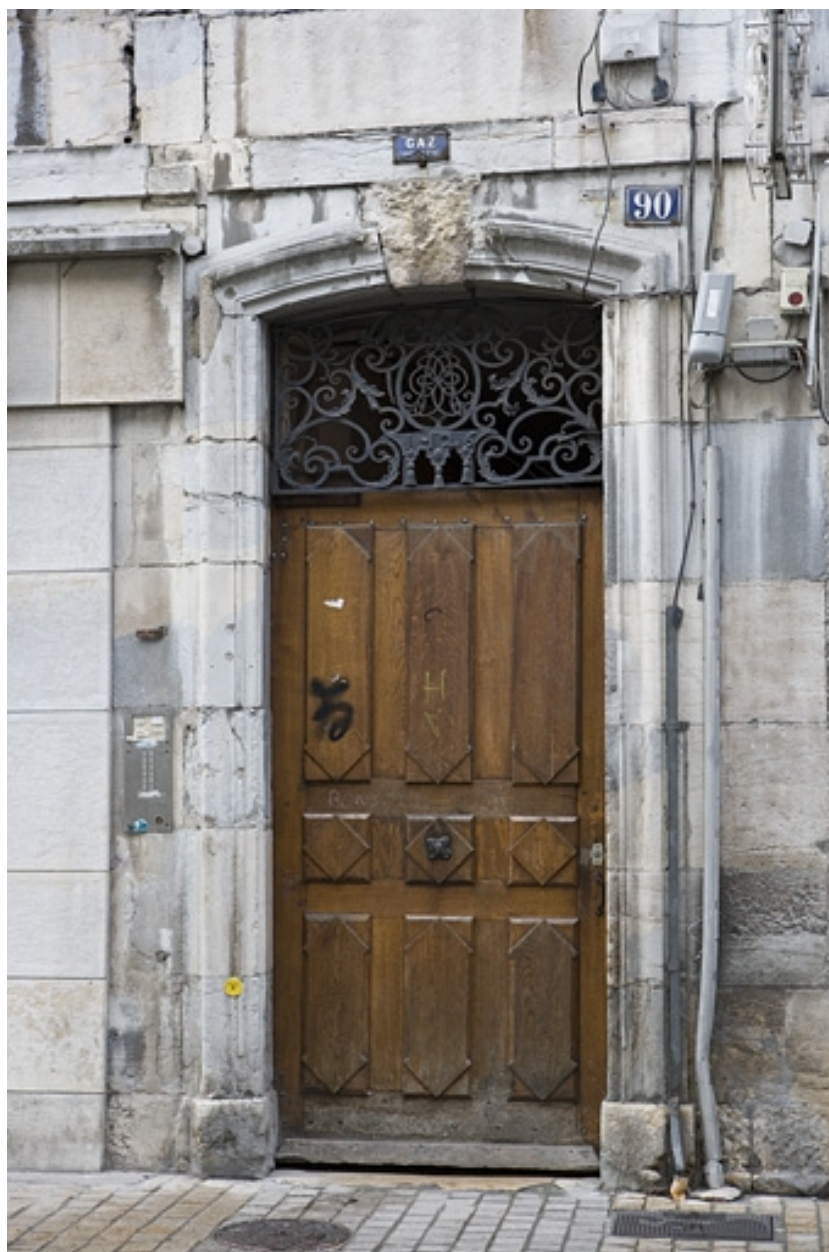
Détail de la porte du couloir d'entrée.