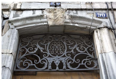
Détail du tympan en ferronnerie de la porte du couloir.