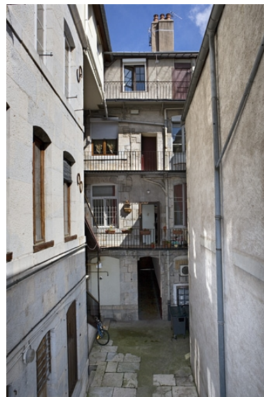
Vue d'ensemble de la façade postérieure du logis principal depuis le fond de la cour. IVR43_20082500350NUC2A