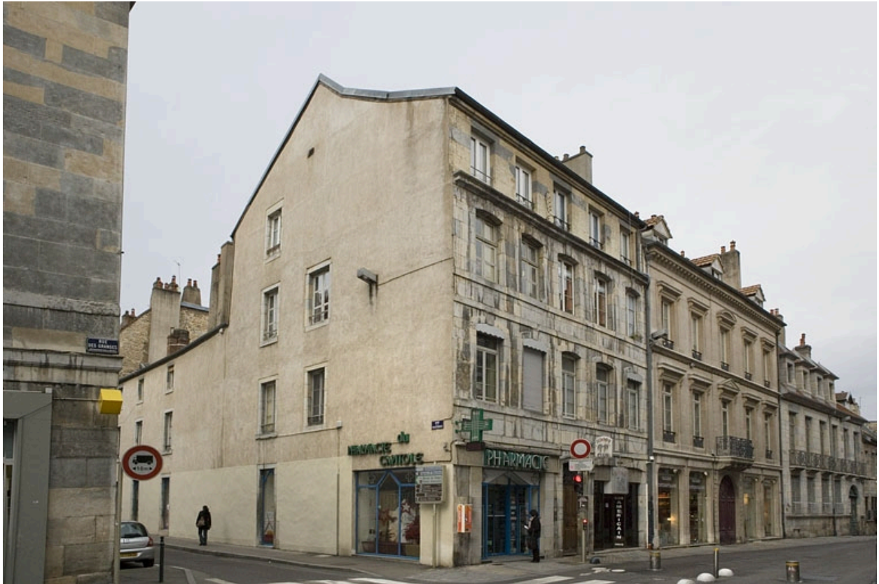
Vue d'ensemble de la maison de trois quarts gauche.