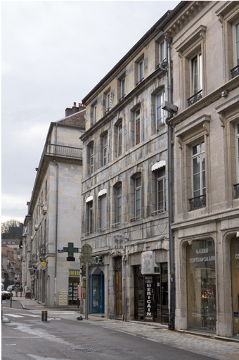
Vue d'ensemble de la façade sur rue de trois quarts droit.