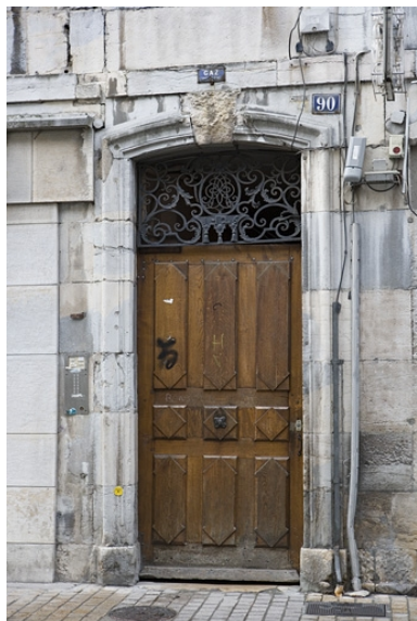
Détail de la porte du couloir d'entrée. IVR43_20082500347NUC2A