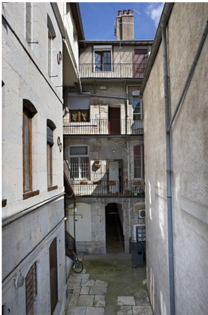
Vue d'ensemble de la façade postérieure du logis principal depuis le fond de la cour.