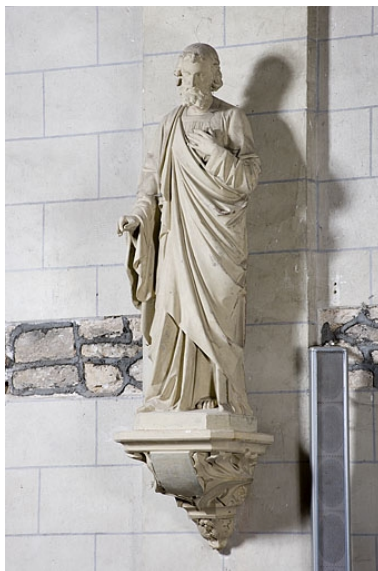
Statue : saint Joseph. IVR43_20102500124NUC4A