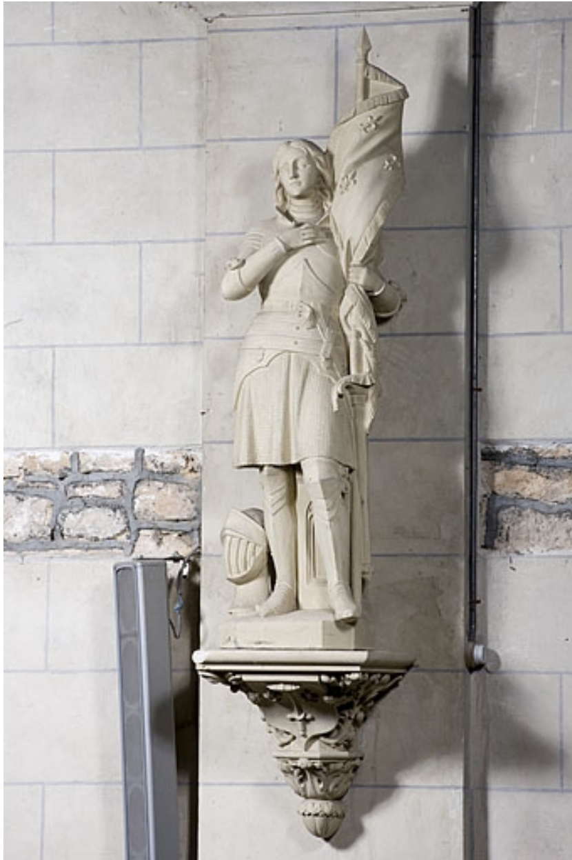
Statue : Jeanne d'Arc.