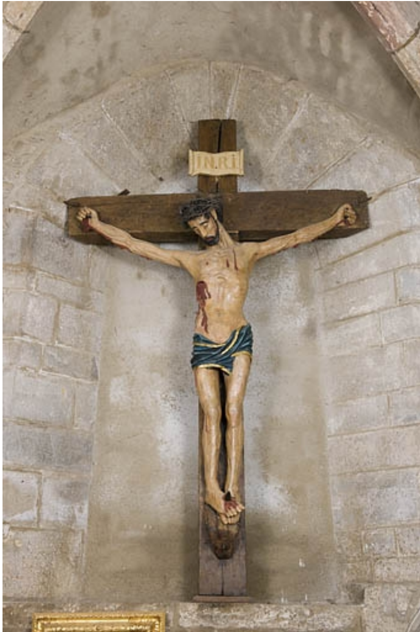
Christ en croix.