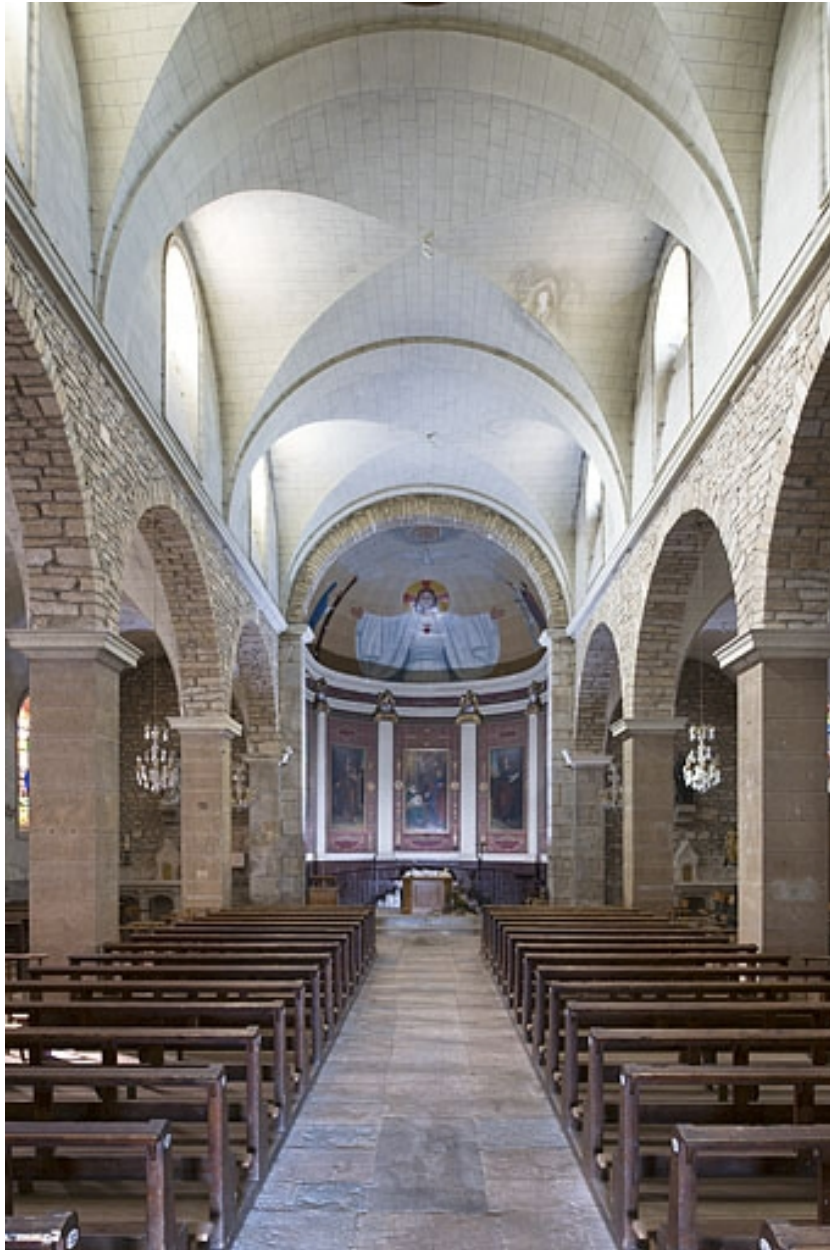
Intérieur de l'église.