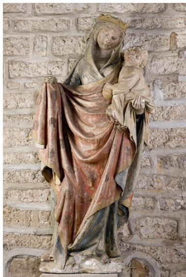
Statue de Vierge à l'Enfant du 15e siècle.