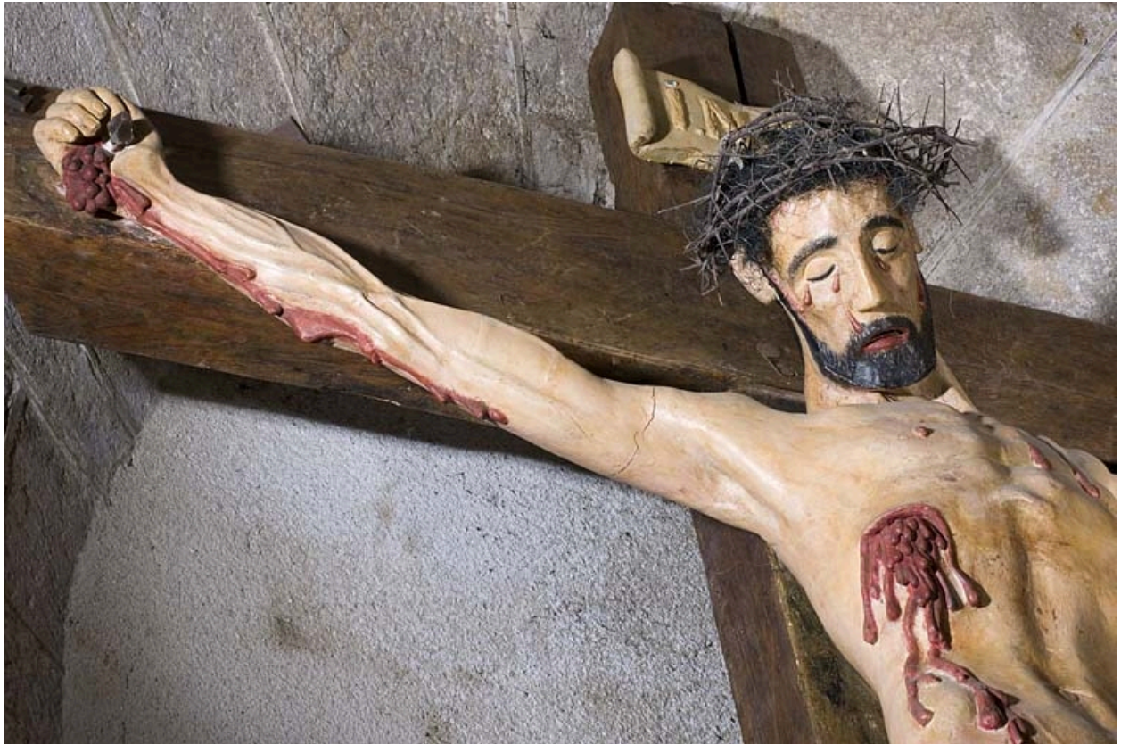
Christ en croix : détail.