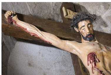
Christ en croix : détail. IVR43_20102500123NUC4A