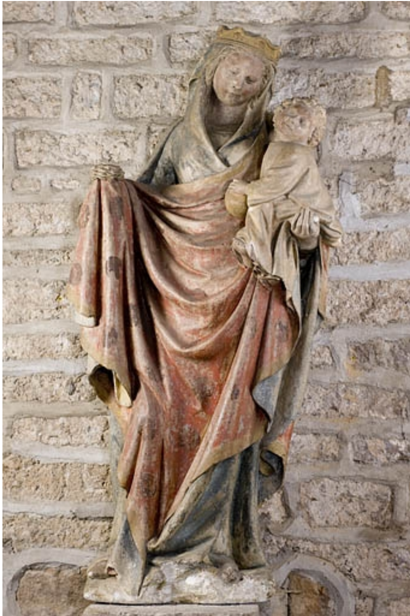
Statue de Vierge à l'Enfant du 15e siècle.