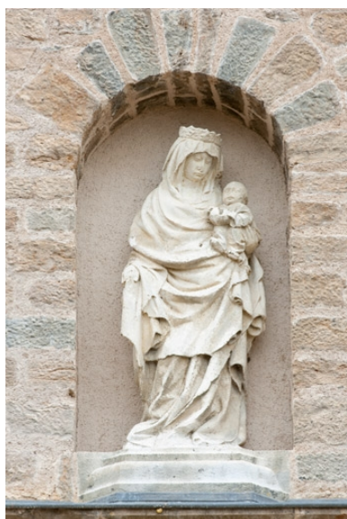
Copie de Vierge à l'Enfant du 15e siècle (l'original a été déplacé dans l'église).