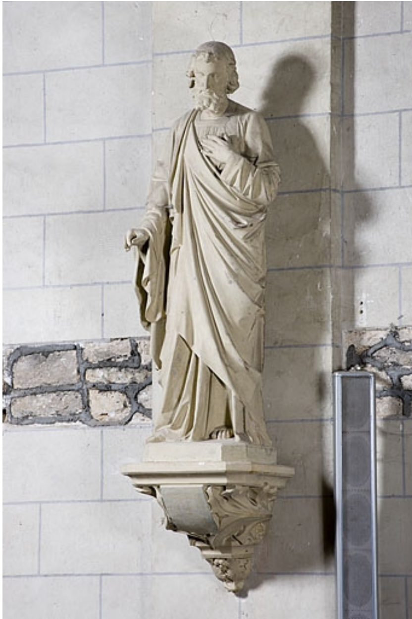
Statue : saint Joseph.