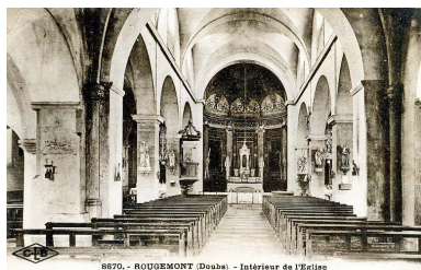
8670. - Rougemont (Doubs). - Intérieur de l'Eglise. S.d. [1ère moitié 20e siècle]. IVR43_20112502607NUC1A