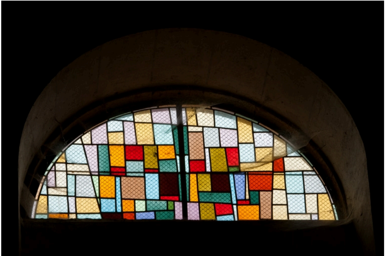
Verrière ornementale récente.