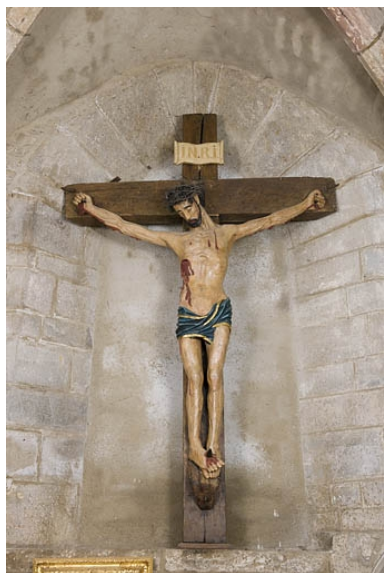
Christ en croix. IVR43_20102500122NUC4A