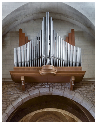
Le grand orgue.