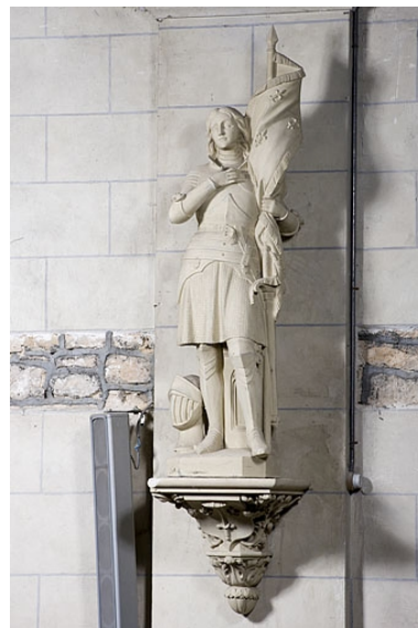
Statue : Jeanne d'Arc.