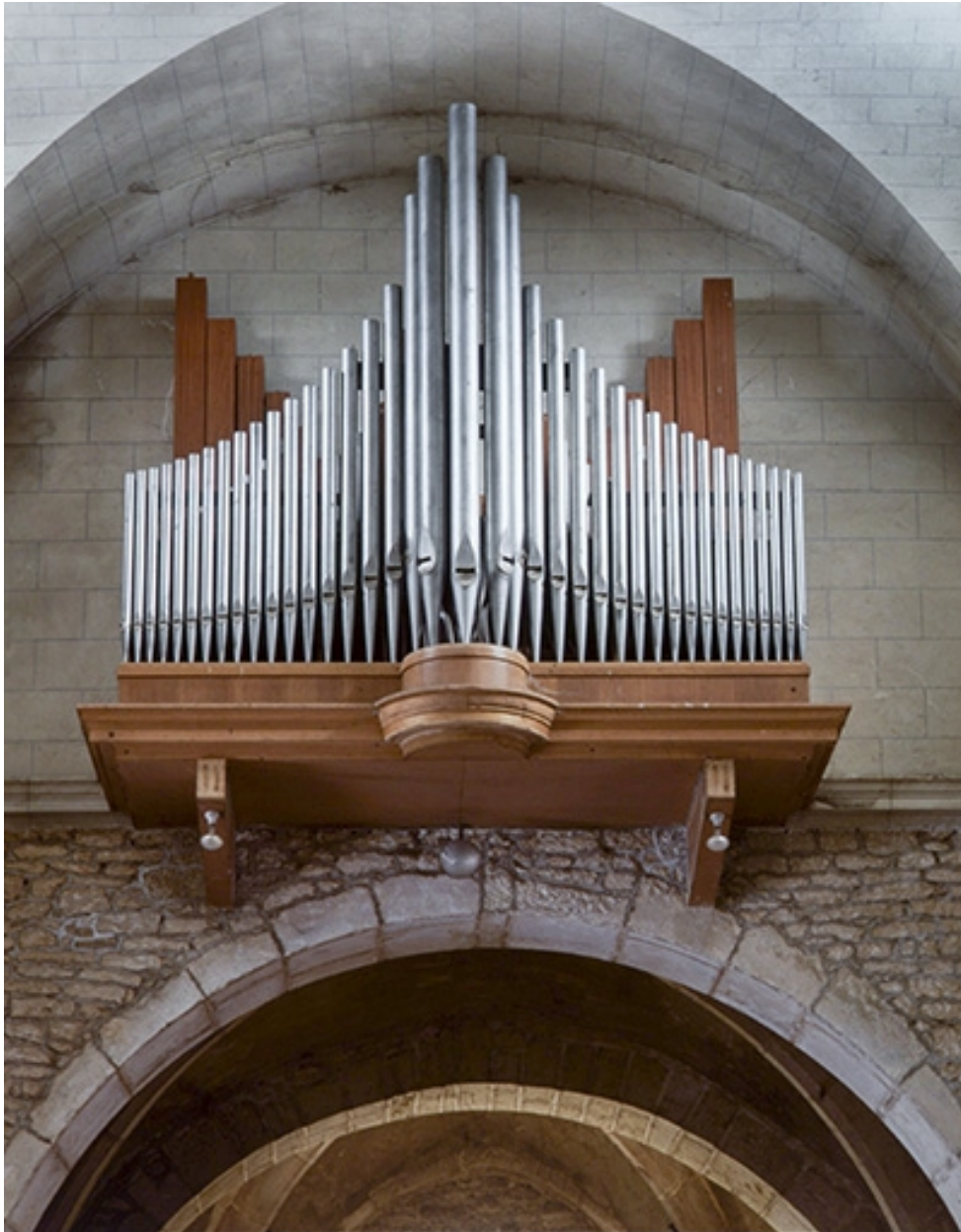
Le grand orgue.