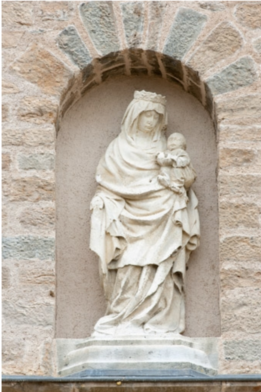
Copie de Vierge à l'Enfant du 15e siècle (l'original a été déplacé dans l'église).