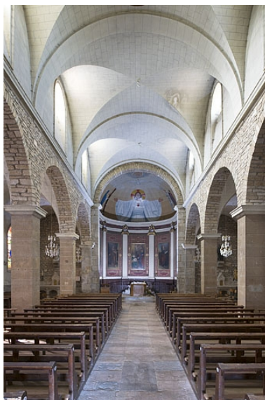
Intérieur de l'église.