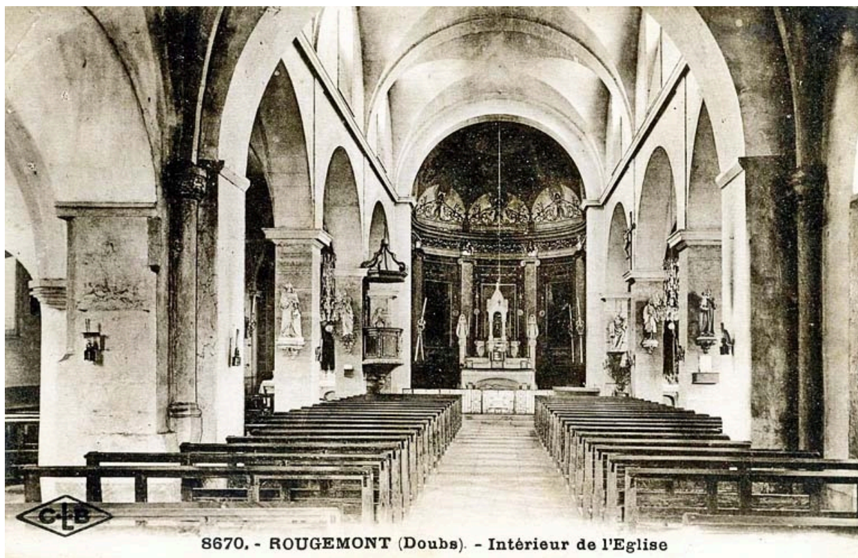
8670. - ROUGEMONT (Doubs). - Intérieur de l'Eglise

8670. - Rougemont (Doubs). - Intérieur de l'Eglise. S.d. [1ère moitié 20e siècle].