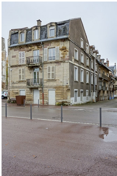
Façade sur la rue des Thermes, vue sur l'allée des Romains.