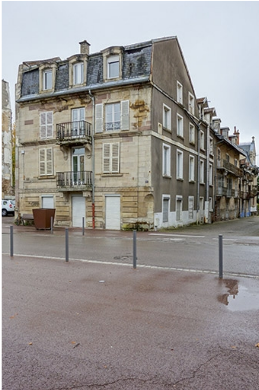
Façade sur la rue des Thermes, vue sur l'allée des Romains.